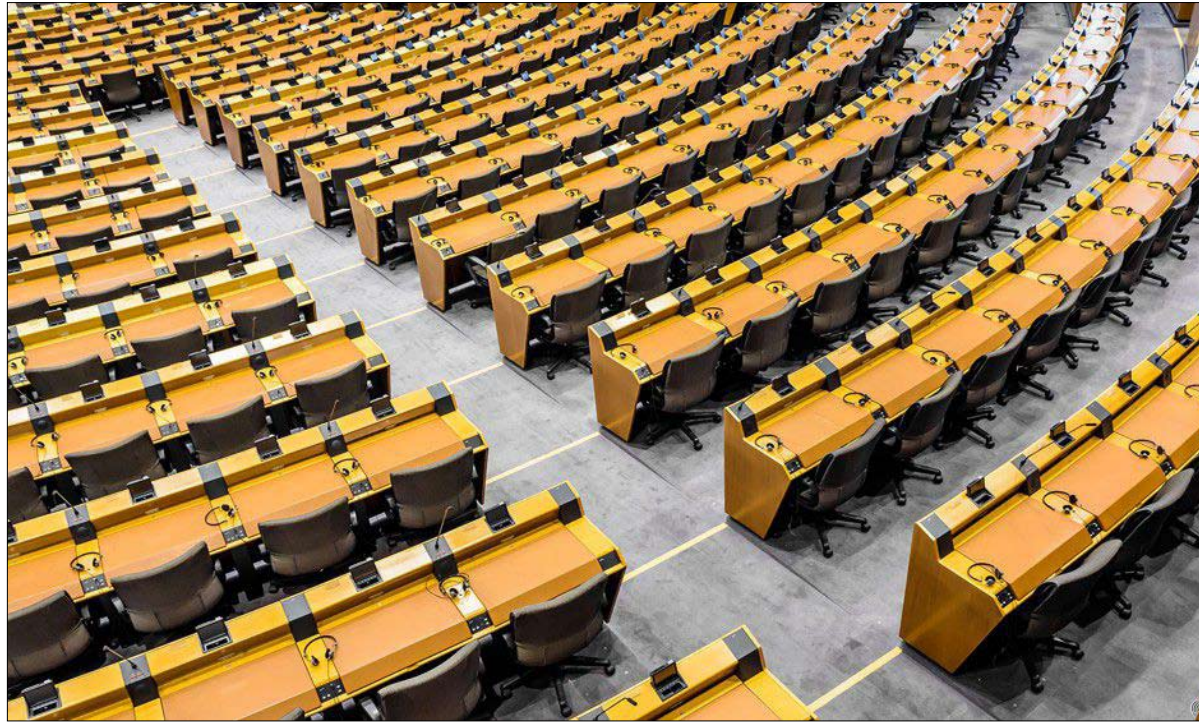
إعادة تشكّل داخل البرلمان الأوروبي

احتفظ سباق الانتخابات الأوروبية لعام 2019 بالكثير من المفاجآت، لكنه أكد أيضاً الاتجاهات الرئيسية المتوقعة. في الواقع، تتحرك الصفائح التكتونية للحياة السياسية الأوروبية ببطء، لأن انتخاب 751 نائباً