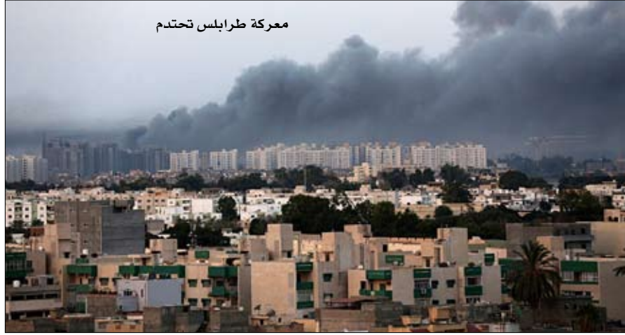
معركة طرابلس تحتمد