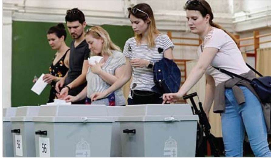
نسبة مشاركة عالية

•• طوكيو-وكالات: أكد الرئيس الأمريكي دونالد ترمب، امس الاثنين، خلال مؤتمر صحافي مع رئيس وزراء اليابان شينزو آبي، من طوكيو، التي وصلها، السبت، في زيارة تستمر 4 أيام، أن الولايات المتحدة لا تسعى إلى تغيير النظام في إيران. وأضاف أنه يعتقد أن إيران تريد عقد اتفاق مع الولايات المتحدة، وهو أمر متوقع. «نحن لا نسعى لتغيير النظام في إيران، إلا أننا نريد منهم أن يتوقفوا عن إجراء التجارب النووية»، مضيفاً أن إيران تصرفات كثيرة غير مقبولة في الشرق الأوسط. كما أكد أن تجاوزات إيران وتدخلاتها في الدول ستوقف بسبب العقوبات التي فرضتها. من جهته، أكد رئيس الوزراء الياباني، أن بلاده ستسأل مبعوثين إلى طهران لحل الخلاف مع الولايات المتحدة. وفي وقت سابق الاثنين، تحدث ترمب عن إمكانية إجراء محادثات مع إيران، وذلك خلال لقائه آبي. وقال: «أنا أعتقد أن إيران لديها الرغبة في الحوار، وإذا رغبت في الحوار ففتح راغبون أيضاً».