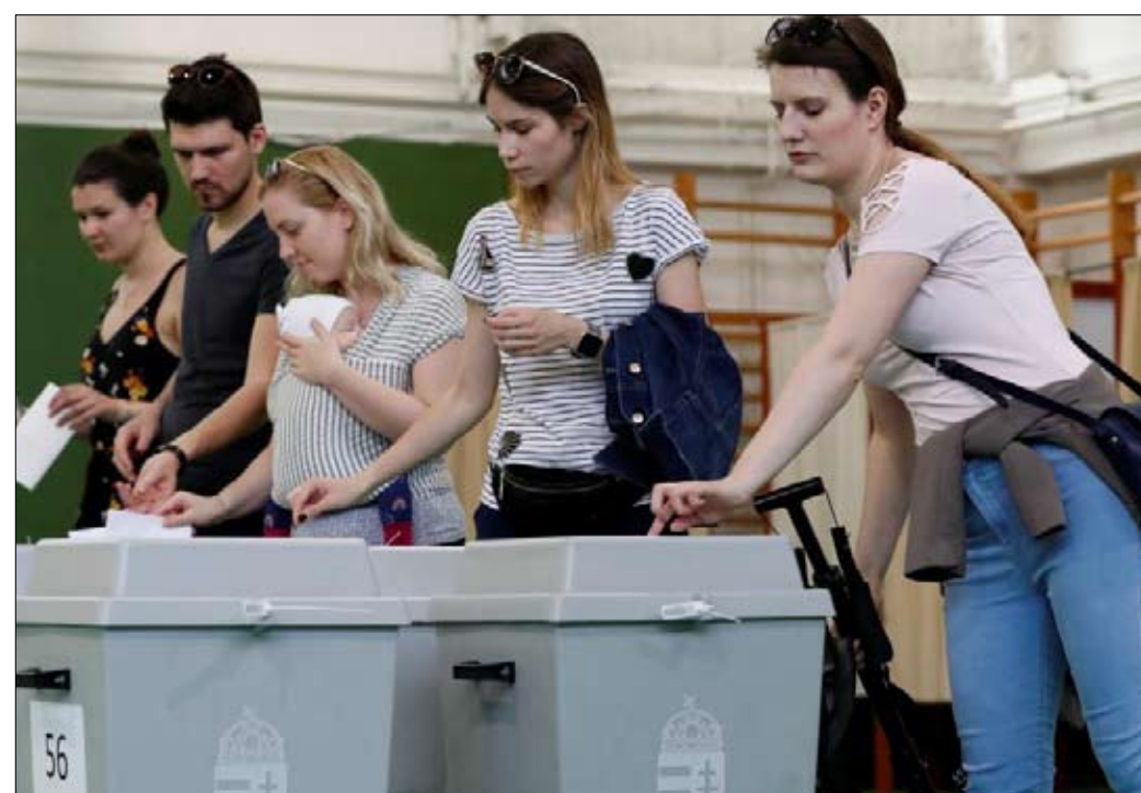
نسبة مشاركة عالية

رئاسة المفوضية الأوروبية: حزب معنة بين ألمانيا وما تبقى من الطا محين