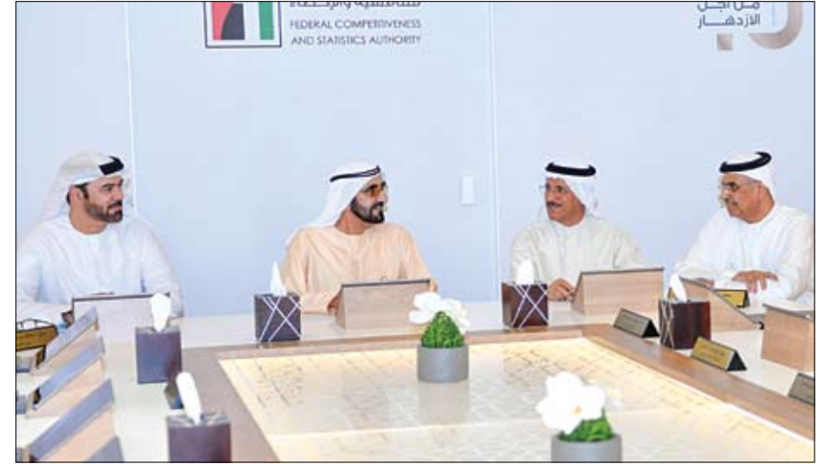
محمد بن راشد خلال زيارته لاجتماع عقد بمناسبة مرور 10 سنوات على انطلاق التنافسية (وام)

استقبل صاحب السمو الشيخ محمد بن زايد آل نهيان ولي عهد أبوظبي نائب القائد الأعلى للقوات المسلحة امس صاحب السمو الشيخ حمد بن محمد الشرقي عضو المجلس الأعلى حاكم الفجيرة يرافقه سمو الشيخ محمد بن حمد بن محمد الشرقي ولي عهد الفجيرة. وتبادل سموهما - خلال اللقاء الذي جرى في قصر البطين في أبوظبي - التهاني بمناسبة شهر رمضان المبارك .. داعيين الله العلي القدير أن يعيده على دولة الإمارات وقيادتها وشعبها بالخير والبركة ويديم عليها نعم الأمن والأمان والاستقرار لتبقى واحة للسلام والمحبة في ظل راعي نهضتها وقائد مسيرتها المباركة صاحب السمو الشيخ خليفة بن زايد آل نهيان رئيس الدولة «حفظه الله».