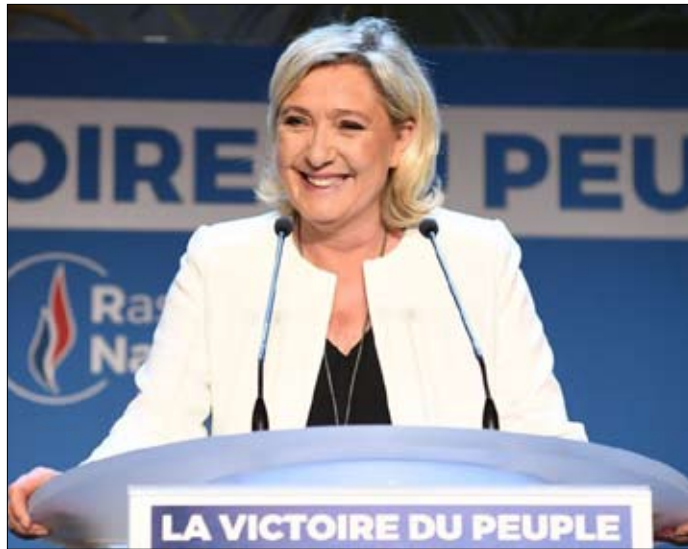
مارين لوپان.. انتصار مشروح