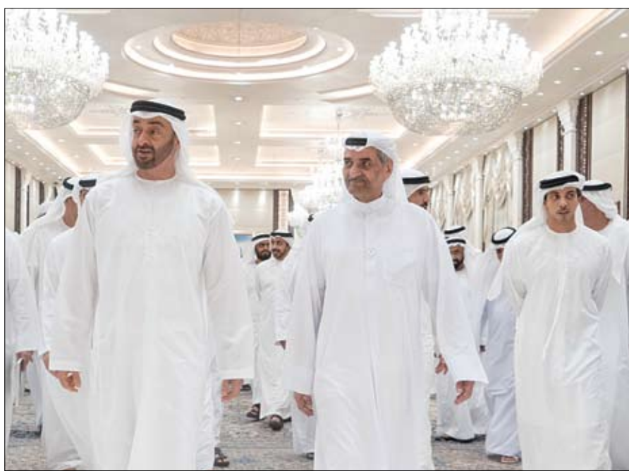
محمد بن زايد خلال استقباله حاكم الفجيرة

الأعلى للقوات المسلحة آباء وأشقاء شهداء الوطن يرافقتهم الشيخ خليفة بن طحون بن محمد آل نهيان مدير تنفيذي مكتب شؤون أسر الشهداء في ديوان ولي عهد أبوظبي ووفد من جامعة الإمارات. وتبادل سمو معهم التهاني بمناسبة شهر رمضان المبارك، وراjin الله تعالى أن يعيده على وطننا وقيادته وشعبه بالخير واليمن والبركات ويحفظ أمنه وأمانه واستقراره.