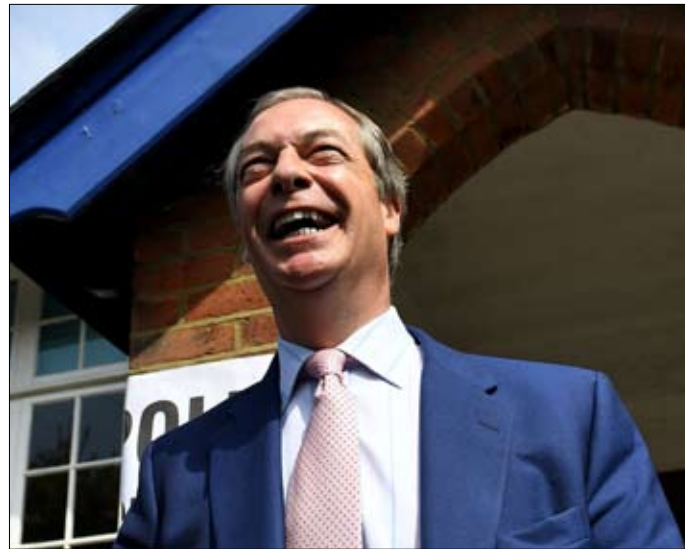
نايجل فاراج يصنع الحدث مرة أخرى