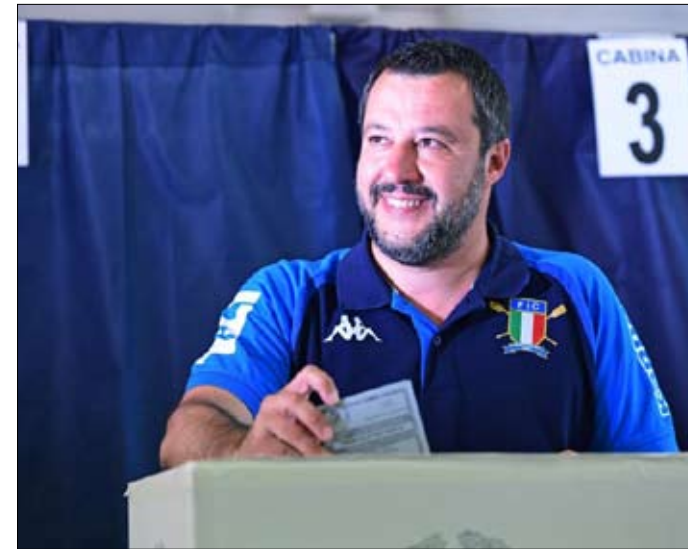
سالفيني... الأجاز الأكبر