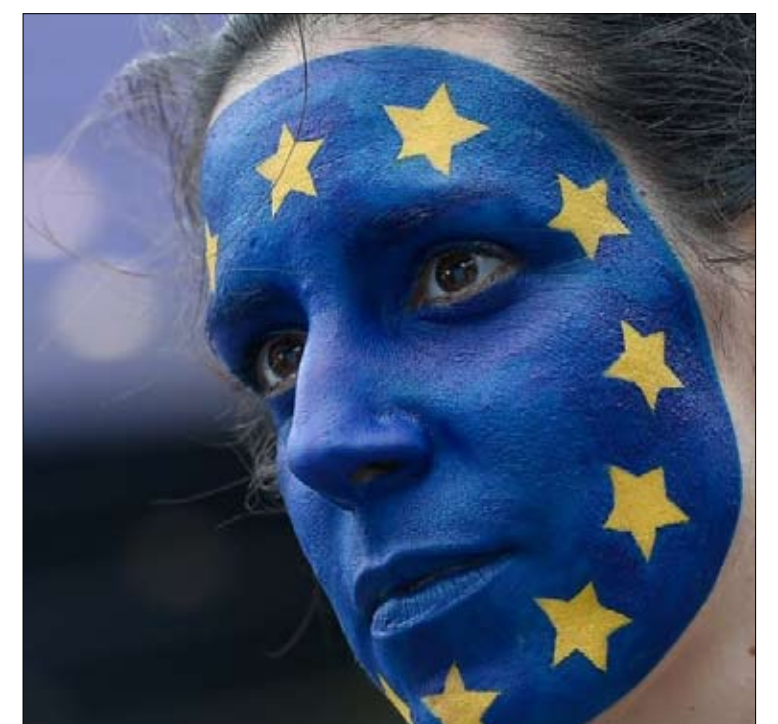
وقف قطار الشعبوية

رئاسة المفوضية الأوروبية: حزب معنة بين ألمانيا وما تبقى من الطا محين