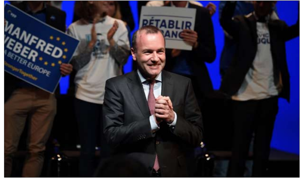
مانفريد ويبر مرشح الألمان للمفوضية