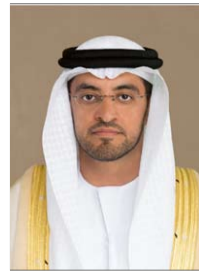
في إدارة النفايات.

المتعلقة بتحديد ملكية النفايات وآليات تصنيفها، وكيفية فصلها وجمعها وإعادة تدويرها واستخدامها وطرق معالجتها وجمعها وتخزينها ونقلها، إضافة إلى اشتراطات ومواصفات أجهزة التتبع ومكبات النفايات الصحية والقائمة الواجب على الجهات المعنية الالتزام بها، والعقوبات الجزائية المترتبة على الرمي العشوائي للنفايات. وفي هذا الصدد، قال معالي فلاح محمد الأحبابي، رئيس مجلس إدارة مركز أبوظبي لإدارة النفايات (تدوير): "إن لأئحة الإدارة المتكاملة للنفايات ستسهم بلا شك في رسم مستقبل أفضل لإدارة النفايات لأهميتها في تحديد اللوائح والتشريعات الواجب على جميع الجهات المعنية الالتزام بها، لاسيما في ظل تزايد التحديات التي تواجه قطاع إدارة النفايات وتنامي الحاجة إلى تبني أساليب وآليات أكثر ابتكاراً لتحويل