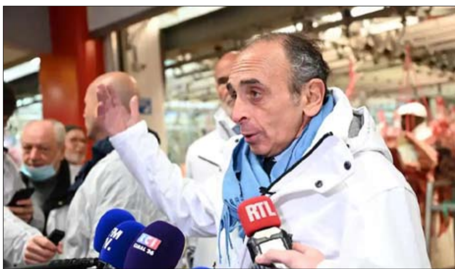
يدعي ان برنامجه مستوحى من الدبغولية

بعد ذلك، سيكون مفتاح المستقبل، ما وراء نتيجة زهور، هو نتيجة مارين لوبان، وموقفها أثناء الاقتراع. وتضيف جوليان توراي، أنه "إذا كانت "لوبان" سيئة كما كان الحال عام 2017، فإن حركة زهور وماريون ماريشال لوبان يمكن أن تستفيد من هذا الفشل الجديد وربما تضعف حزبا. وإذا كان أداؤها جيدا، فستكون قادرة على إعادة التموضع كزعيمية لا مفر منها لليمين المتطرف".