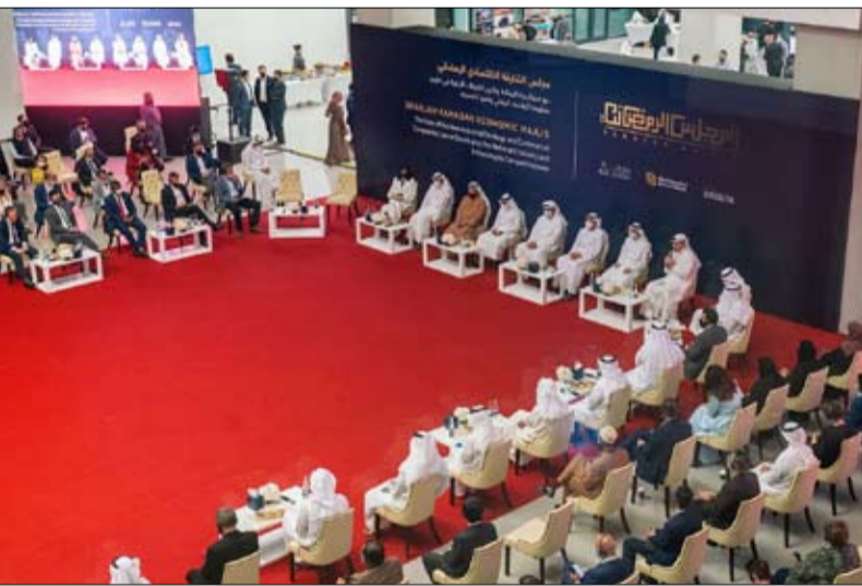
درؤساً من الأزمة المالية العالمية لعام 2008، الشركات والخروج بتوصيات عملية للتغلب على التحديات الناجمة عن الأزمة.