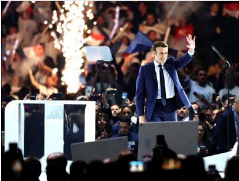
خاض الحملة الانتخابية متأخرا