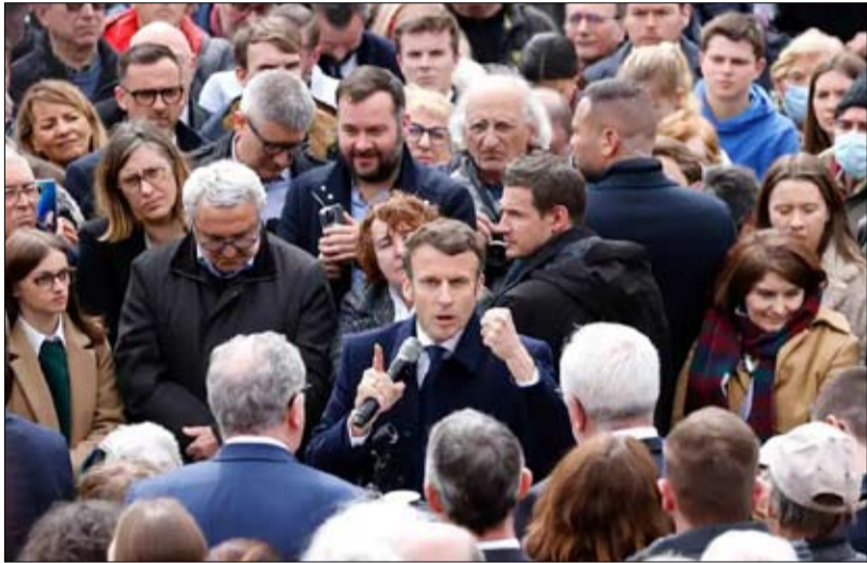
سيهزمه ماكرون بفارق عريض