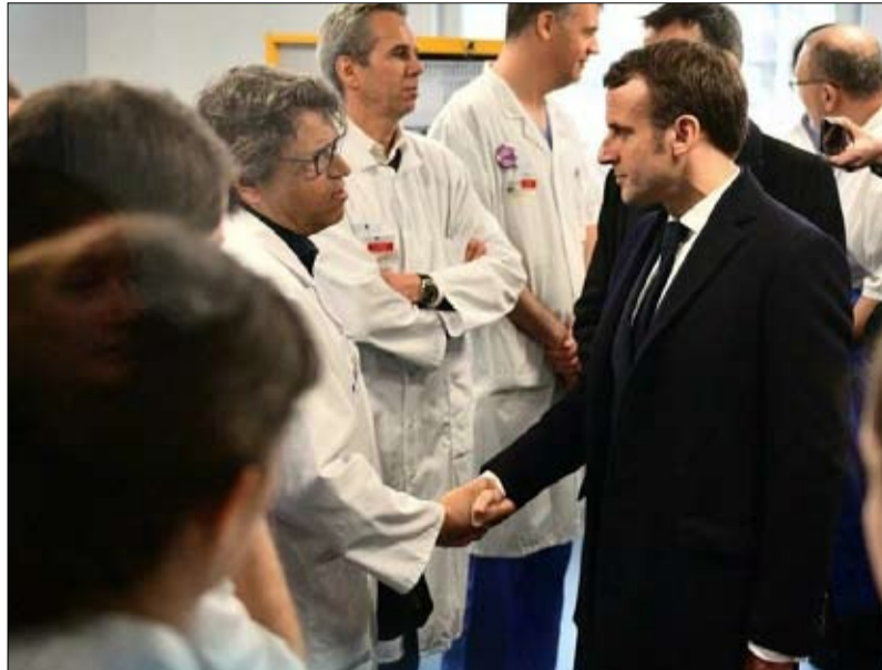
البعد الاجتماعي ثغرة في برنامج المنتهية ولايته