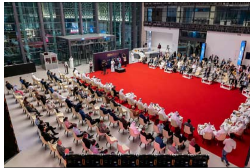
المجلس نخبة من الخبراء وصناع القرار في جميع القطاعات، وقادة الأعمال الذين استخلصوا

ويأتي اختيار الشارقة لشعار المجلس في دورة العام الجاري استجابة لنمو الاستثمار في سوق الأصول الافتراضية، والآفاق الواعدة للعوائد المجزية من خلال اعتماد العملات المشفرة والرموز غير القابلة للاستبدال، بالإضافة إلى التطورات الرئيسية في البنية التحتية الرقمية وتكنولوجيا التشفير. وفي إطار ترسيخ دولة الإمارات لمكانتها كمركز عالمي لتجارة الأصول الافتراضية، أصدرت هيئة تنظيم الأصول الافتراضية "أول قانون لتنظيم الأصول الافتراضية بهدف تقديم إطار قانوني لحماية المستثمرين وتنظيم وتسهيل عملية دمج الأصول الرقمية في الاقتصاد على المدى الطويل، ويوصفها حاضنة للقطاعات الناشئة، تظهر الشارقة قدرة كبيرة على جذب الشركات الأجنبية المتخصصة في هذا القطاع. يشار إلى أن دورة العام الماضي من مجلس الشارقة الاقتصادي الرمضاني ركزت على حزم