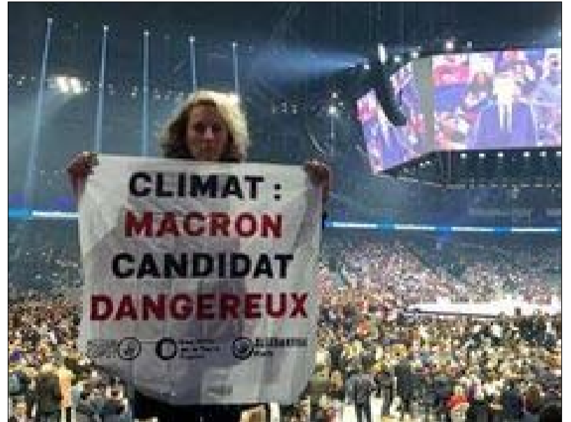
الامتناع عن التصويت شبح مخيف