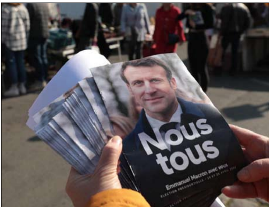
ماكرون غير شعار حملته