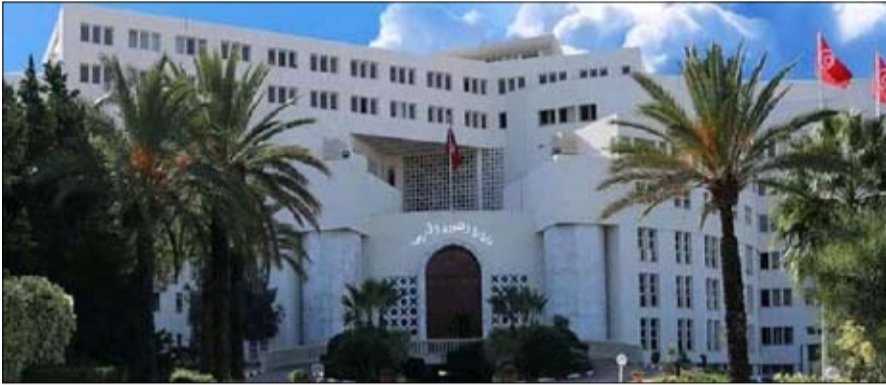
الخارجية التونسية تحتج