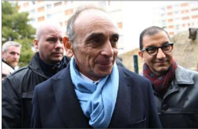
زهور من رموز اليمين المتطرف