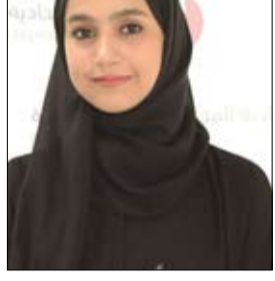
الصعيديين الإقليمي والعالمي، وسد فجوة المهارات الاقتصادية الجديدة، وتعزيز اقتصادها العربي.

على مستوى العالم، بهدف تأهيل الكفاءات وصقل المهارات، حيث تركز البرامج على القيادة، والمهارات التقنية، مثل التحول الرقمي، وعلوم البيانات، والتكفاء الاصطناعي، وتكنولوجيا المعلومات، والتحويل الرقمي، وغيرها من المجالات. وأوضحت شركة كورسيرا أنها تسعى لموظفي الحكومة أساسية للتطوير المستمر، وتعزيز القدرة التنافسية لدولة الإمارات العربية المتحدة على