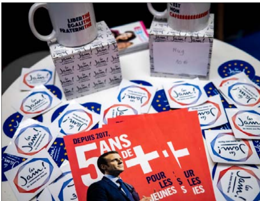
صورة ماكرون تطرح مشكلة

ماكرونية لأحد أصدقائها، من الذين لم يصادروا حزب "الجمهوريون": نحن ننحصر على رئيس يميني؛ قبل ان تسلّم: أضع نفسي مكان ناخبي اليسار، باستثناء إجراء اجتماعي وحيد، لا يوجد الكثير...".