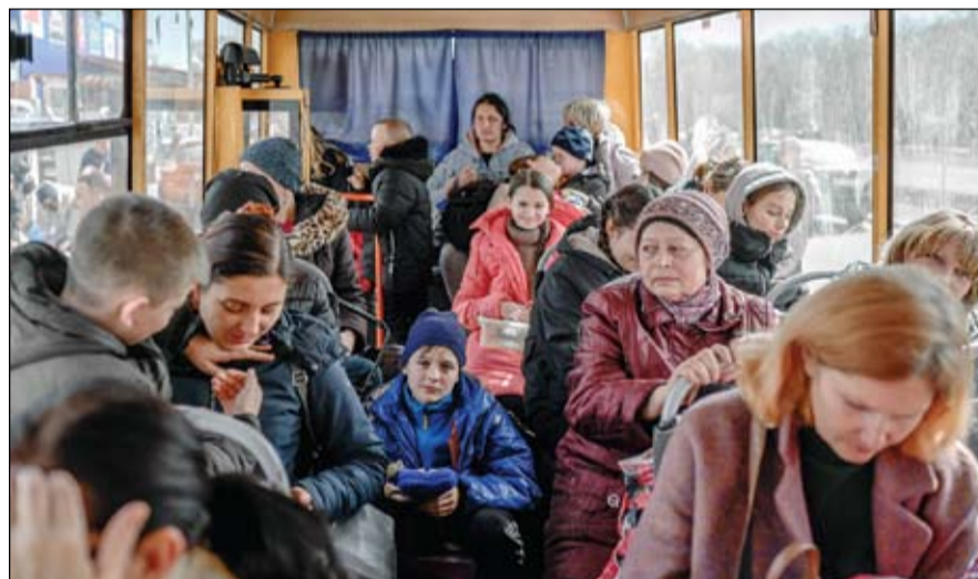
نازحون داخليا يصلون إلى مركز للنازحين في زابوريجيا شمال غرب ماريوبول.

الروسى أن يغذي الآلة العسكرية الروسية عبر مصادر تمويل جديدة، داعياً أيضاً إلى حظر البنوك الروسية من النظام المالي الغربي. ودان زيلينسكي بعض القادة السياسيين أو في قطاع المال والأعمال الذين ما زالوا يعتبرون