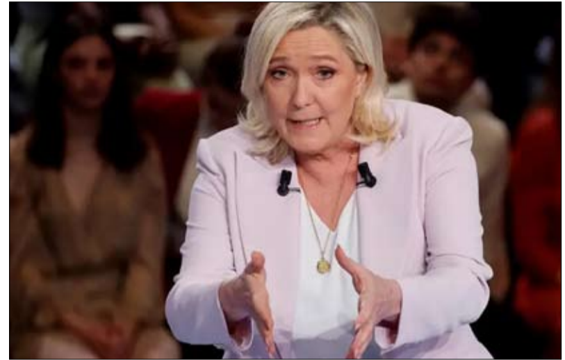
زعامة أقصى اليمين لن؟

إيريك زهور يحتل مرتبة أقل من 11 بالمائة، أي أقل بكثير من مارين لوبان (20 بالمائة). يتأرجح جان لوك ميلينشون بين 14 و15 بالمائة وفاليري بيكريس بين 9 و11 بالمائة. في الجولة الثانية، سيفوز إيمانويل ماكرون في جميع السيناريوهات، وقد حصل حتى على 65 و67 بالمائة من الأصوات، في حال مواجهته لزهور، وفقاً لآخر استطلاع أيقوب.