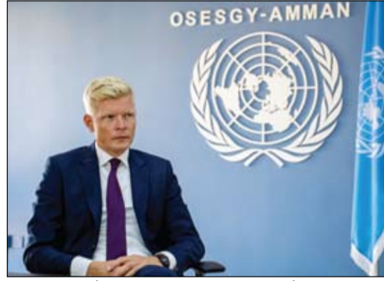
المبعوث الأممي إلى اليمن، هانز غرونديبرغ (أرشيفية)

ذلك، هناك تقارير عن أنشطة المشاورات أمس الأربعاء، أن المشاركين بدأوا في البحث عن حلول للانتقال باليمن إلى دولة آمنة ومستقرة. وقال إنهم سيستكملون ذلك يوم غد، وسيعملون على التوافق التام، مشيراً إلى أنه متفائل بخصوصاً بعدد المشاركين في المشاورات، أن المجلس لس الحرص من كل الأطراف المشاركة في المشاورات اليمنية المنعقدة في الرياض على مصلحة اليمن. وأضاف في إحاطة حول