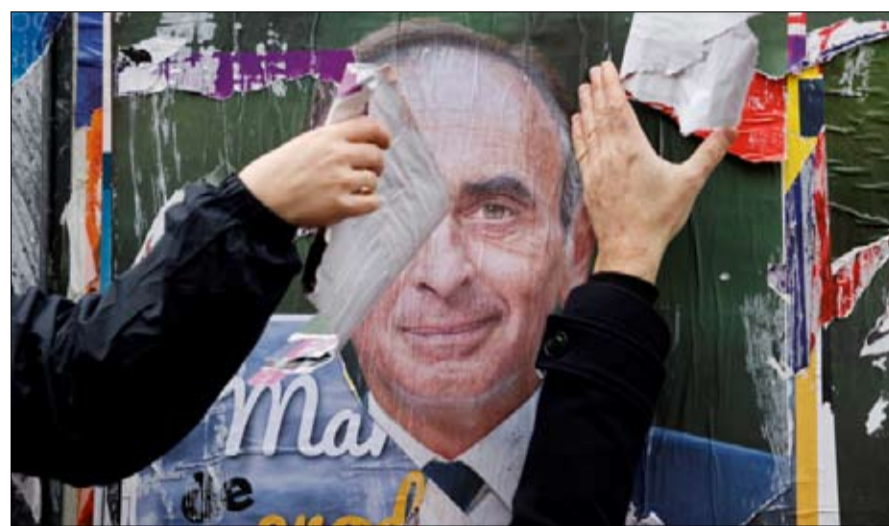
معارضون لخطابه العنصري يمزقون ملصقا لزهور

يتعامل برنامج إريك زهور مع الموضوعات المتعلقة بالريف والمناطق الزراعية أو عظمة فرنسا دولياً وموقعها كقوة عظمى وسيطة. ومع ذلك، هناك نقاط أخرى تضعه في أقصى اليمين. انه يقترح، من بين أمور أخرى، وقف لم شمل الأسرة، وإنشاء نظام لانتزاع الجنسية من الجرمين من أصل أجنبي، وحظر "أي دعاية في المدرسة"، وخفض المسؤولية الإجرامية إلى