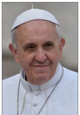
•• بيروت-أ ف ب

يتوجه البابا فرنسيس في شهر حزيران-يونيو المقبل إلى لبنان الغارق في أزماته، وفق ما أعلنت الرئاسة اللبنانية في خطوة من شأنها أن تحمل "رجاء" اللبنانيين المتعبين الذين ينتظرون الزيارة منذ سنوات. وأوردت الرئاسة في بيان أن السفير البابوي في لبنان المؤقت جوزيف سببيري سلم رئيس الجمهورية ميشال عون رسالة خطية علمه فيها أن قداسة البابا فرنسيس قرّر زيارة لبنان في شهر حزيران (يونيو) المقبل، على أن يصار إلى تحديد تاريخ الزيارة وبرنامجها وموعد الإعلان عنها رسمياً، بالتنسيق بين لبنان الكرسي الرسولي.