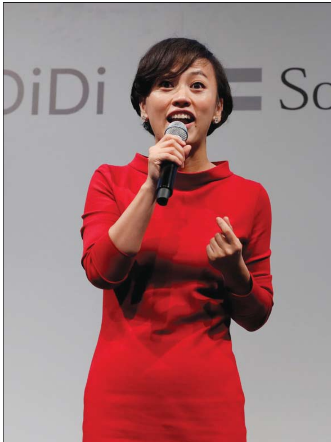
جان ليورنيسة ديدي تشوكسينج تتحدث خلال مؤتمر صحفي عن مشروعها لسيارات الأجرة اليابانية في طوكيو.