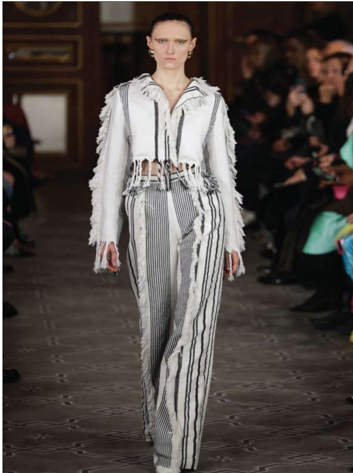
عارضة أزياء تقدم تصميمًا لإيمان أيسي خلال أسبوع الموضة النسائية الراقية في باريس.

في الطريق إلى البحر يمتد نهر دجلة والفرات عبر سهل خصيب عريض كان يعرف قديماً باسم بابل، وهو تلك المنطة التي يطلق عليها ما بين النهرين.