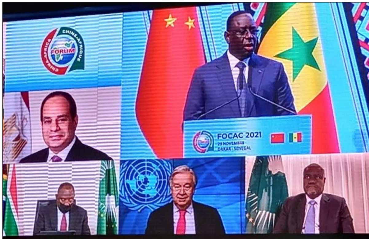
مساهمة تقديرة للافارقة في داكار