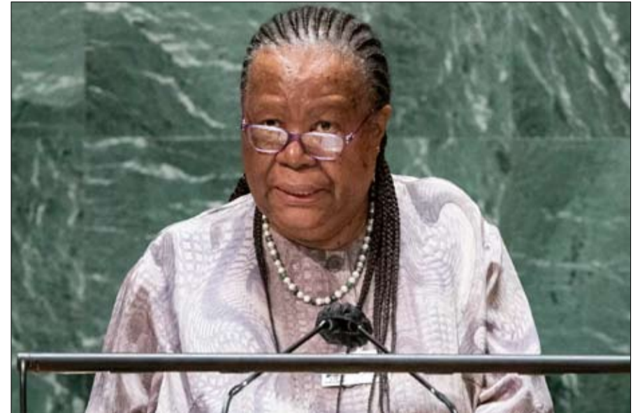
وزيرة خارجية جنوب إفريقيا نالدي بانديور

يُعزى استمرار الجائحة جزئياً إلى تغطية التطعيم غير المتكافئة في أجزاء كثيرة من العالم، لا سيما في البلدان الأقل نمواً