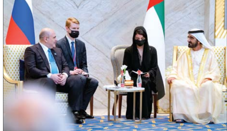
محمد بن راشد خلال استقباله رئيس وزراء روسيا الاتحادية

استقبل صاحب السمو الشيخ محمد بن زايد آل نهيان ولي عهد أبوظبي نائب القائد الأعلى للقوات المسلحة أمس في قصر الشاطئ.. معالي الدكتور سورينام جاي شانكار وزير الشؤون الخارجية في جمهورية الهند الصديقة. ورحب سموه خلال اللقاء بزيارة وزير الشؤون الخارجية الهندي.. الذي نقل إلى سموه تهاني الإمارات الوطنية. (التفاصيل ص3)