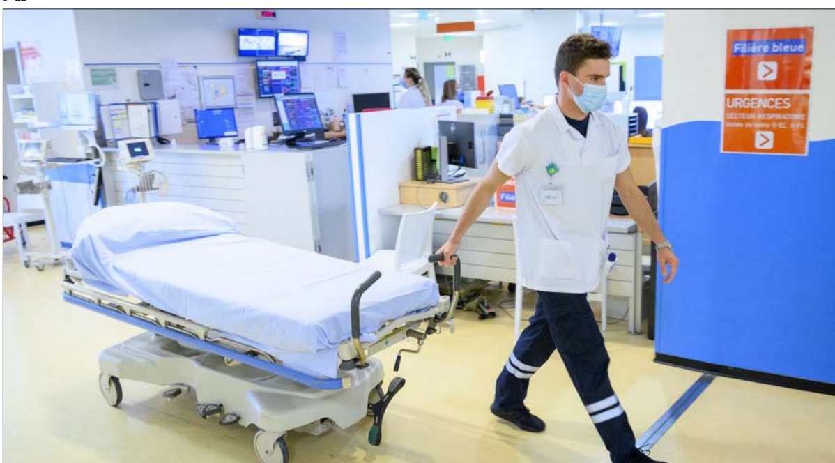
استنفاً في كل مستشفيات أوروبا