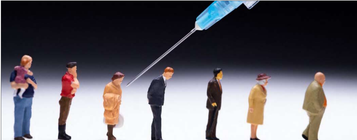
يظل التطعيم هو أفضل طريقة لمكافحة كوفيد-19