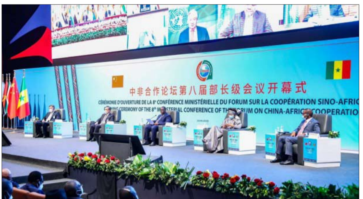
الديون كانت هاجس المشاركين في المنتدى الثامن