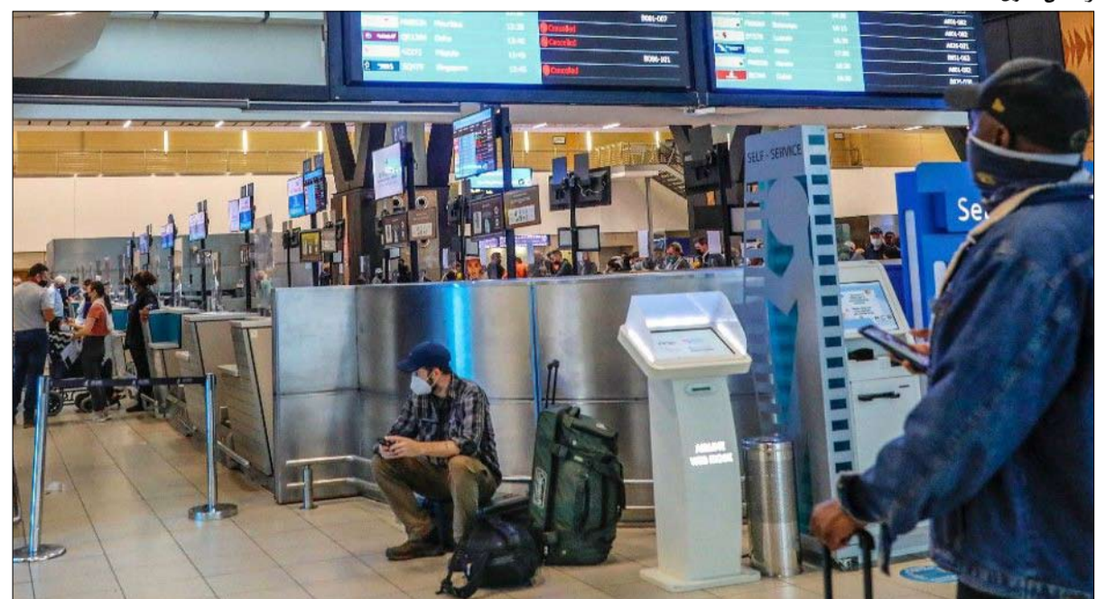
مطار أو آر تامبو الدولي في جوهانسبرج بعد أن حظرت عدة دول الرحلات الجوية من جنوب إفريقيا