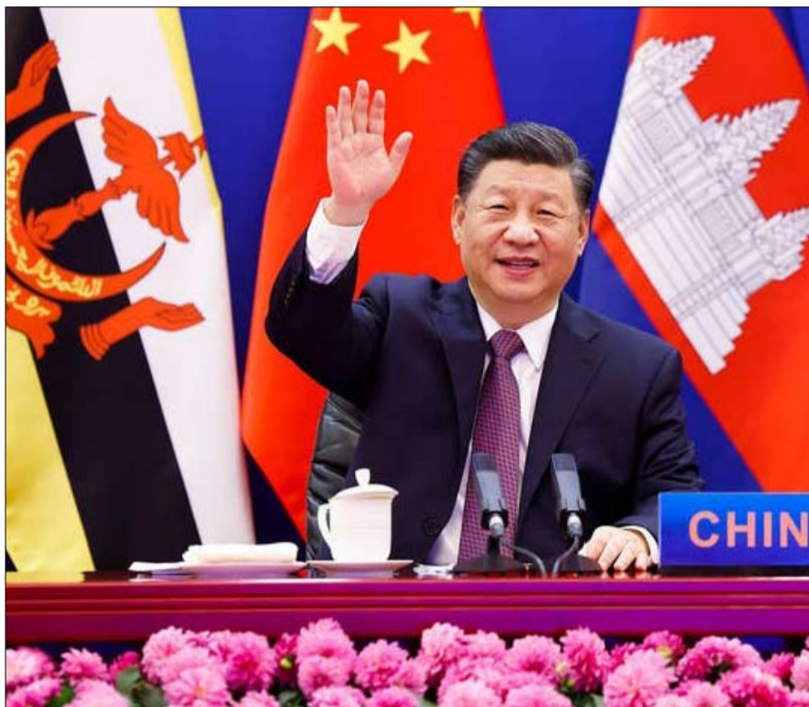
مشاركة عن بعد للرئيس الصيني