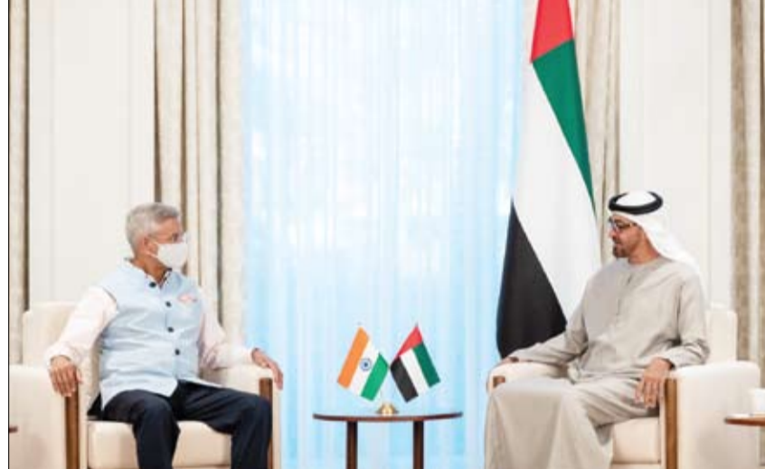
محمد بن زايد خلال استقباله وزير الشؤون الخارجية الهندي

احتفى إكسبو 2020 دبي، بأصحاب الهمم أمس الأول بالتزامن مع انعقاد «اليوم الدولي للأشخاص ذوي الإعاقة»، وذلك عبر فعاليات ومناقشات رئيسة أقيمت في جناح نيكرس، لبحث عدد من القضايا مثل ضمان الوصول الشامل، والتعليم، والعمل اللائق، والابتكار والتكنولوجيا، والرياضة للأشخاص من أصحاب الهمم. شارك في الفعالية معالي حصة بنت عيسى بو حميد وزيرة تنمية المجتمع حيث انطلقت الفعالية المتخصصة تحت عنوان «صياغة