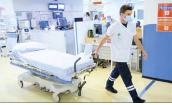
استفزاز في كل مستشفيات أوروبا

•• باماكو-أ ف ب قتل 30 شخصاً على الأقل في هجوم نفذه مسلحون يعتقد أنهم إرهابيون واستهدف عربة نقل في منطقة غوتي المضطربة وسط مالي، على ما أفاد مسؤولون محليون وكالة فرانس برس. وقال المسؤولون إن الركاب أمطروا بالرصاص وتم إحراق العربة في هجوم نفذه إرهابيون قرب بلدة باندياغارا الجمعة. وأضاف المسؤولون طالبين عدم الكشف عن هويتهم إن سلطات الولاية أرسلت قوات أمنية إلى المكان الذي وقع فيه الهجوم. وأكد مسؤول في باندياغارا حصيلة القتلى ومن بينهم نساء وأطفال كما قال. ولم تتبين الهجوم أي من المجموعات المسلحة العديدة التي تنشط في الدولة الواقعة بغرب إفريقيا.