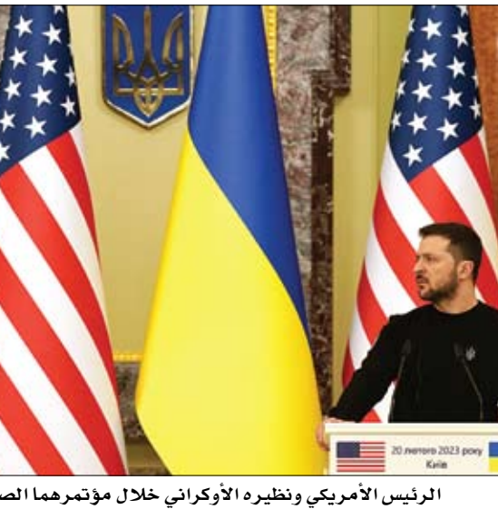
الرئيس الأمريكي ونظيره الأوكراني خلال مؤتمرهما الصحفي في كيفيف.

وقال بايدن إنه كان يتحدث مع زيلينسكي هاتفيا قبل عام أثناء بداية الهجوم الروسي. وأشار إلى أن كيفيف لها مكانة خاصة والمنتجات والأطر التنموية المستدامة بما يخدم مصالح شعوب المنطقة والعالم، بما في ذلك قطاع الغذاء الذي يشكل