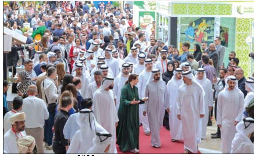
محمد بن راشد خلال زيارته معرض جلفود 2023

أولوية استراتيجية دولة للإمارات. خلال جمع الفائزين على مختلف القطاعات الحيوية للغذاء أولوية استراتيجية للدولة الإمارات توظف في سبيلها كل الإمكانيات الممكنة ضمن أطر عمل مرنة وفعالة. (التفاصيل ص 2)