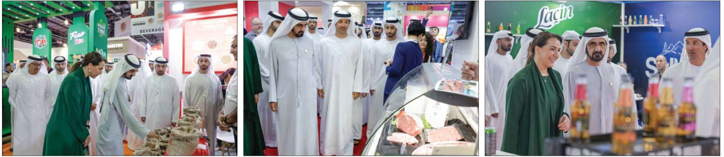
خلال زيارته لمعرض جلفود 2023 ضمن أكبر دورة في تاريخه