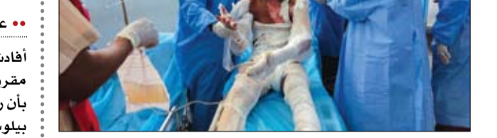
احد جرحى انفجار الشاحنة يتلقى العلاج

وقالت المصادر الأميركية إن حاملة طائرات و 3 غواصات و 36 سفينة حربية أميركية ستشارك بمناورات في المحيط الهادئ. بالتزامن، أعلنت الصين في الأيام الأخيرة عن مناورات بالذخيرة الحية تزامناً مع زيارة بيلوسي لتايوان. وكانت وزارة الخارجية الصينية أمس الاثنين قد جددت تحذيراتها من عواقب زيارة بيلوسي لتايبيه، في حال قررت إصدار التحذير الأحدث خلال إفاضة دورية لوزارة الخارجية الصينية، حيث قال المتحدث باسم الوزارة تشاو لي جيان إنه «في حالة قيام رئيسة مجلس النواب الأميركي بزيارة تايوان يبقى الجيش الصيني لن يبقى مكتوف الأيدي». ووصلت نانسي بيلوسي، إلى سنغافورة في ساعة مبكرة من صباح أمس في مستهل جولتها الآسيوية.