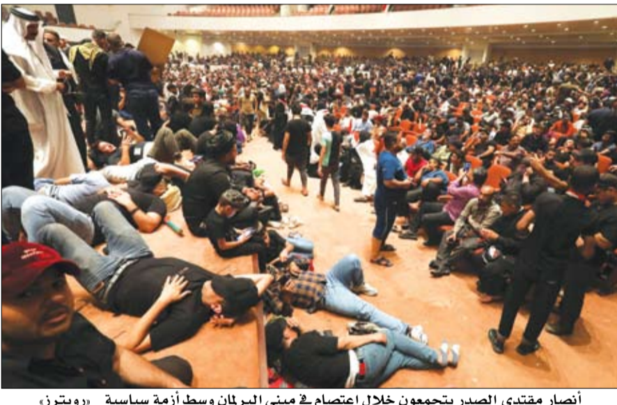
انصار مقتدى الصدر يتجمعون خلال اعتصام في مبنى البرلمان وسط أزمة سياسية

•• أبو ظبي-وام: تلقى صاحب السمو الشيخ محمد بن زايد آل نهيان رئيس الدولة «حفظه الله» أمس اتصالاً هاتفياً من معالي نيكولا تشوكا رئيس وزراء جمهورية رومانيا الصديقة بحثاً خلاله علاقات التعاون بين دولة الإمارات ورومانيا وفرص تعزيزها وتطويرها في مختلف المجالات. وتناول الجانبان مسارات العمل