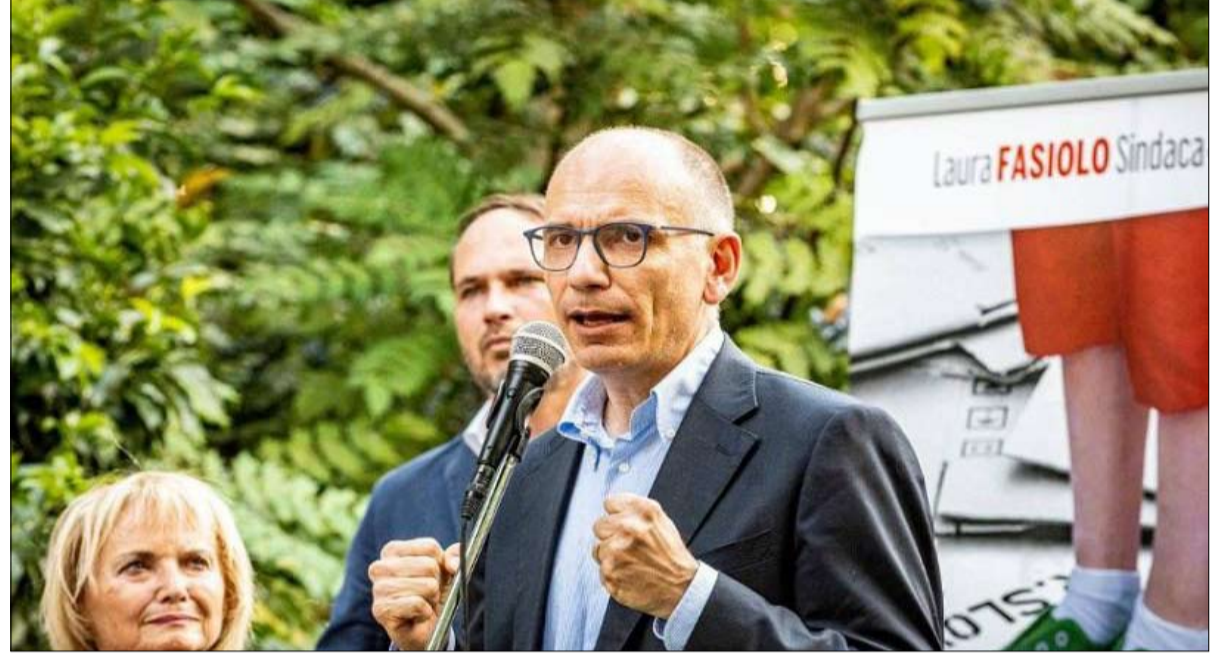
الحزب الديمقراطي سيقود اليسار

الرابطة وفورزا إيطاليا، يمكن أن يصل التحالف اليميني إلى 45 بالمائة من الأصوات، وهو ما يكفي لتوضيح هذا التحالف في المركز الأول، دون الحصول على الأغلبية المطلقة. وبالتالي فإن تعيين جورجيا ميلوني في قصر شيغي سيكون منطقيًا، على الرغم من صعوبة تحيّل تصويت الأحزاب الأخرى لصالح قانون تقترحه فراتلي ديتاليا.