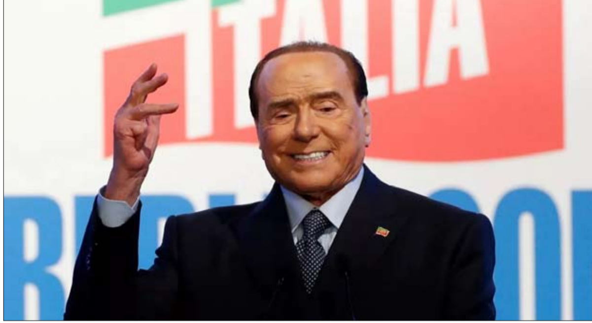
برلسكوني يريد العودة لتقديم المرح