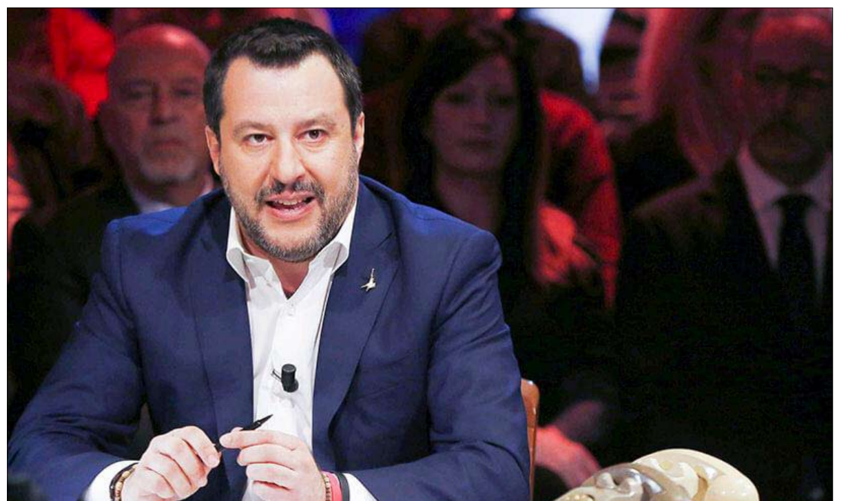
سالفيني ومازق داخل الرابطة