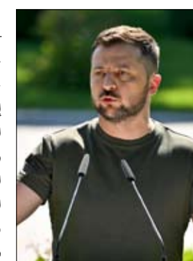
•• عواصم-وكالات طالب الرئيس الأوكراني فولوديمير زيلينسكي، حكومته بالبدء الفوري في تنفيذ عملية إجلاء إجزامي للسكان من منطقة دونيتسك شرقي البلاد التي تشهد قتالا ضارياً مع روسيا.

وأضاف: "كلما غادر المزيد من الناس منطقة دونيتسك الآن، قل عدد الأشخاص الذين سيكون لدى الجيش الروسي وقت لتفهمه" مضيفاً أنه "سيتم منح السكان تعويضات".