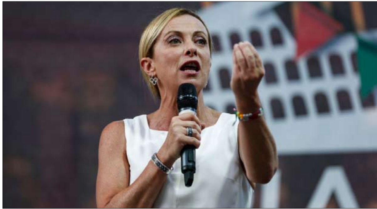
جورجيا ميلوني الاوفر حظا بيننا

- تسبب سقوط الحكومة في إثارة بلبلة داخل جميع الأحزاب