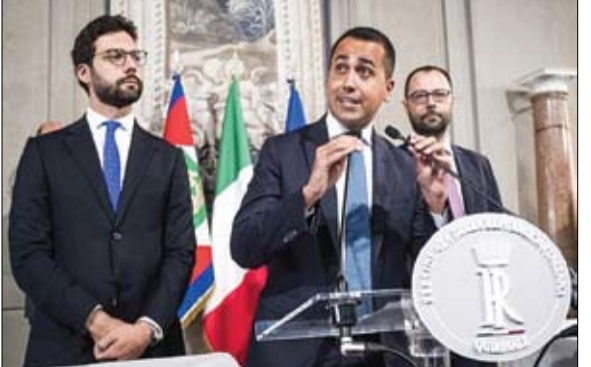
لويجي دي مايو سيواجه صندوق الاقتراع لأول مرة

•• عواصم-وكالات: قالت المخابرات البريطانية أمس إن روسيا تتجه إلى تعديل خططها في دونباس بعد ما وصفتها بالفشل في إحداث اختراق حاسم. وأشارت المخابرات البريطانية إلى أن روسيا «قد تعيد نشر عدد كبير من قواتها من قطاع دونباس الشمالي إلى جنوب أوكرانيا». وعن المعركة في شرق أوكرانيا، قالت وزارة الدفاع البريطانية في تقريرها الأخير، يوم الجمعة، إنه من المحتمل أن تكون مجموعة فاغنر العسكرية الروسية الخاصة قد تم تكليفها بالمسؤولية عن قطاعات محددة من جبهة القتال في الشرق. ورجح تقرير وزارة الدفاع البريطانية أن يكون تكليف موسكو لمجموعة فاغنر، بعمليات قتالية في أوكرانيا، عائداً إلى النقص الكبير الذي تواجهه روسيا في المشاة القتالية. وقال وزير الدفاع البريطاني في تغريدته، «إنه يوم انفراج بالنسبة للعالم، وخصوصاً بالنسبة لأصدقائنا في الشرق الأوسط وآسيا وأفريقيا، بينما تغادر الحبوب الأوكرانية الحصار الروسي». وأضاف «لظلماً كانت أوكرانيا شريكاً يمكن الاعتماد عليه وستبقى كذلك إذا احترمت روسيا التزاماتها في الاتفاق».