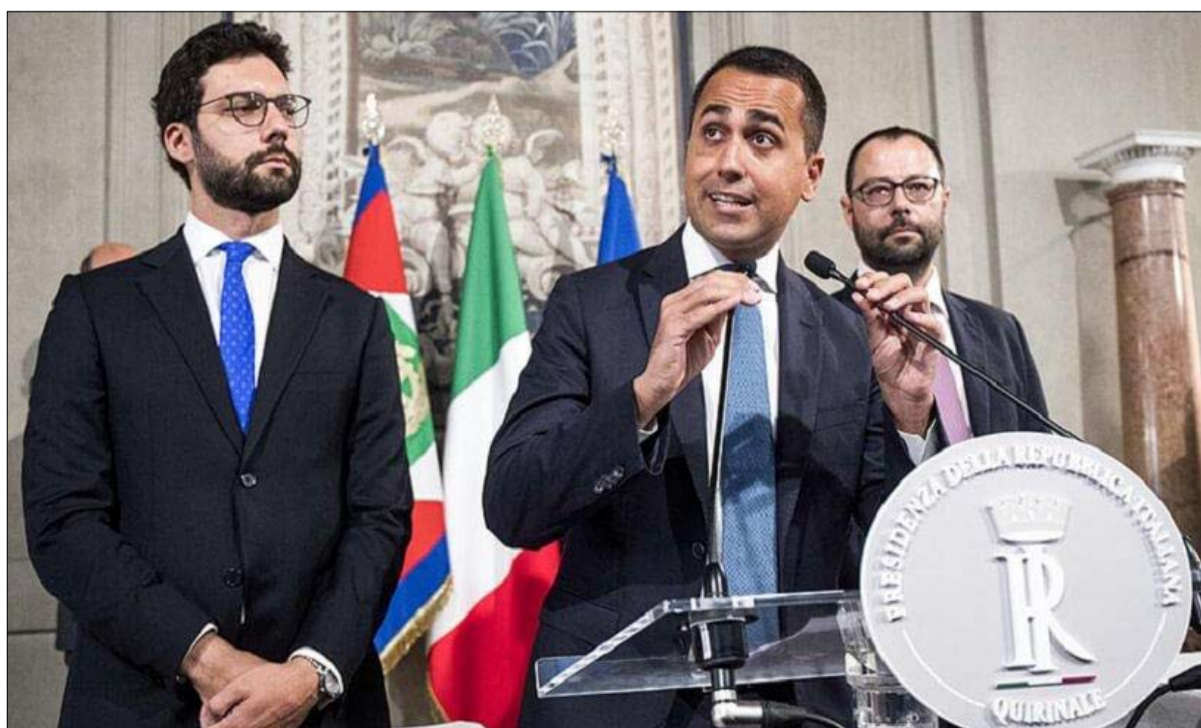
لويجي دي مايو سواجها صندوق الاقتراع لأول مرة

- لا مخرج من هذا الوضع، ويمكن أن يعلن عن خمس سنوات جديدة من عدم الاستقرار في إيطاليا