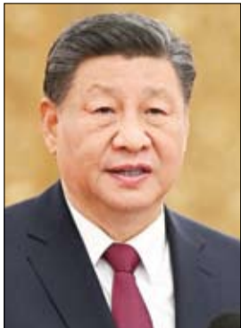
•• بكين- أ ف ب:

قال الرئيس الصيني شي جينبينغ لكبار المسؤولين أمس الأربعاء إنه يتعين على بكين معالجة الصعوبات المحلية والدولية «بهدوء»، قبل أسبوع من أهم اجتماع سياسي سنوي في البلاد.