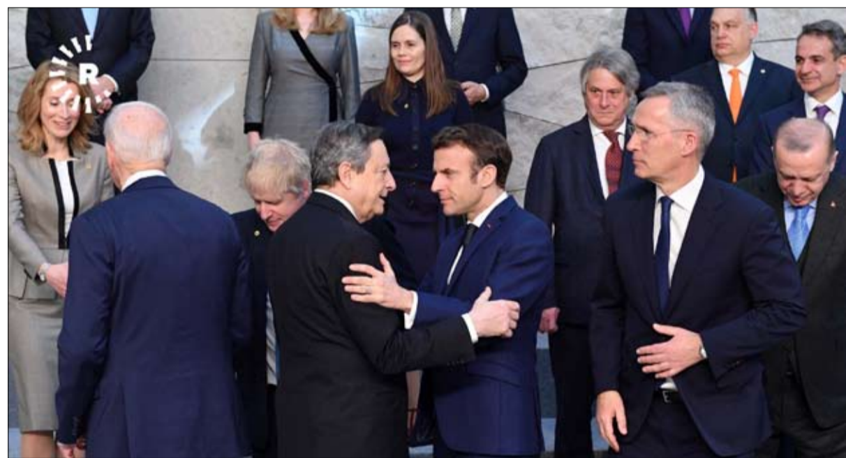
هل تساهم فرنسا في الإضعاف التدريجي لحلف الناتو؟

وبدلاً من ذلك، ومع التركيز الجديد على أوروبا أنهى ماكرون عملية برخان التي نشرت باريس فيها ما يقرب من 5000 جندي في ماني للمساعدة على محاربة العديد من التحديات التي لا تتطلب فقط مجموعة ضخمة من القدرات كما أن التكاليف الاقتصادية لمواجهة كل هذه