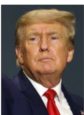
•• برلين-أ ف ب

طالبت ألمانيا الجمعة بتوفير رعاية طبية عاجلة لمعارض الكرملين المسجون أليكسي نافاني الذي أكد أنه مريض ومحروم من الرعاية في سجنه بروسيا. وكان نافاني، أبرز معارضي الرئيس الروسي فلاديمير بوتين، قد أكد الأرماء أنه مصاب بعوارض انفولونزا ومنها الحمى، لكنه لا يزال في زنزانه في سجنه الخاضع لتدابير أمنية مشددة قرب موسكو ومحروم من أدوية أساسية. وقالت المتحدثة الحكومية كريستيان هوفمان إن نافاني "بحاجة ماسة للمساعدة الطبية كما أشار العديد من الأطباء الروس، ندعو السلطات الروسية لتوفير ذلك فوراً وبشكل تام".