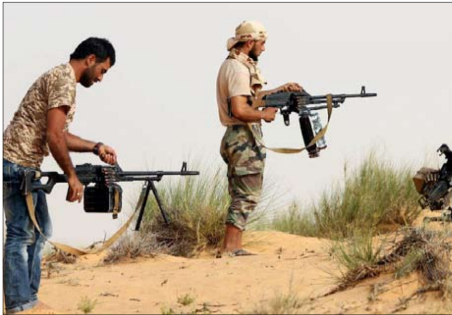
ما ينذر بدخول ليبيا في دوامة من الصراع.

محللون حذروا من استناد الميليشيات إلى دعوة الغراياني من أجل الخروج في مظاهر من العنف، لأجل تعطيل الحراك الجديد في المشهد السياسي،