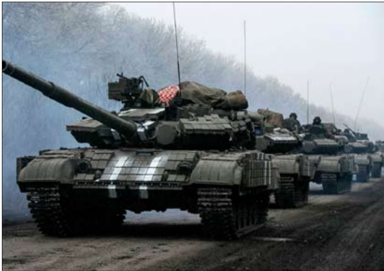
الغزو الروسي لأوكرانيا كشف عن نقاط ضعف أوروبا