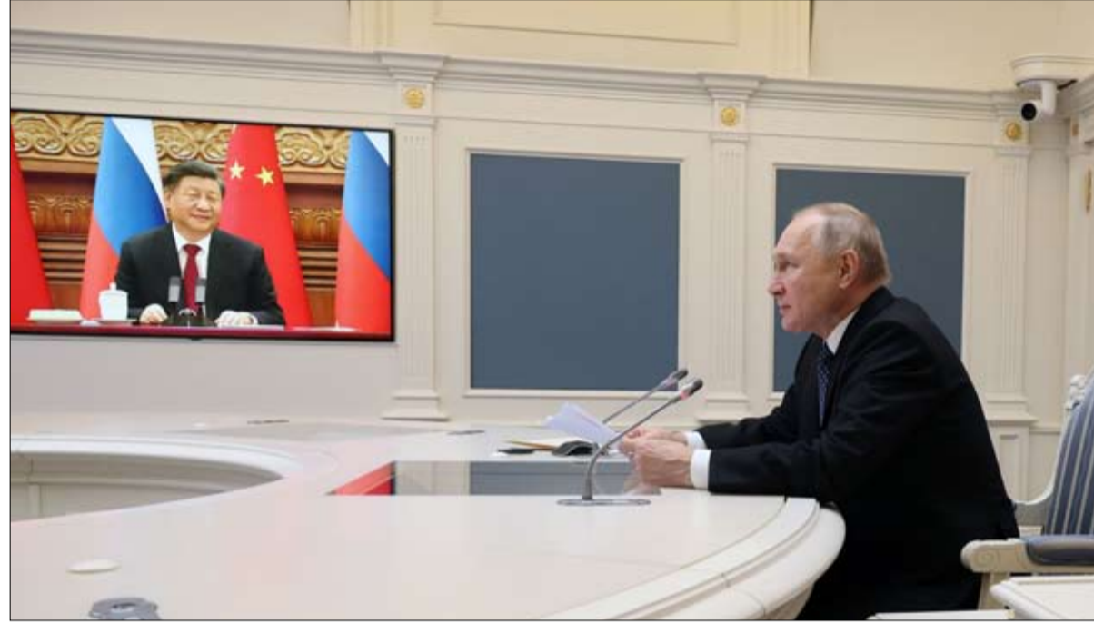
الصين جزء رئيسي من النظام العالمي الجديد

الدولية في وارسو، على هذا الموقف قائلا "من الجيد أن يشير ماكرون إلى سيادة فرنسا عدة مرات على الأقل، لكنه يضعها في سياق تحالف قوي داخل الاتحاد الأوروبي وحلف شمال الأطلسي والولايات المتحدة". ومع ذلك، كما يشير سموولر، لا يشير ماكرون على وجه التحديد إلى بولندا ولكنه يذكر تعزيز العلاقات مع إيطاليا وإسبانيا واليونان وكرواتيا وبلجيكا. حتى مولدوفا وجورجيا حصلنا على إشارة منه، باختصار فإن المراجعة التي تقوم بها فرنسا تشمل الناتو والاتحاد الأوروبي وأوروبا الشرقية وأفريقيا. ربما يكون نطاقاً شاملاً للغاية وعمومياً للغاية بشأن كيفية التعامل مع الحجم الهائل للتحديات المقبلة. ستصبح التفاصيل والتكاليف المالية لإعداد فرنسا لعام 2030 أكثر وضوحاً في الأشهر المقبلة. وربما يتم تجسيد هذا الخط المهم الذي اتخذه ماكرون عندما يعود السلام إلى أوكرانيا، سنحتاج إلى تقسيم جميع من جانبه علق أوجينيوس سموولر من مركز العلاقات