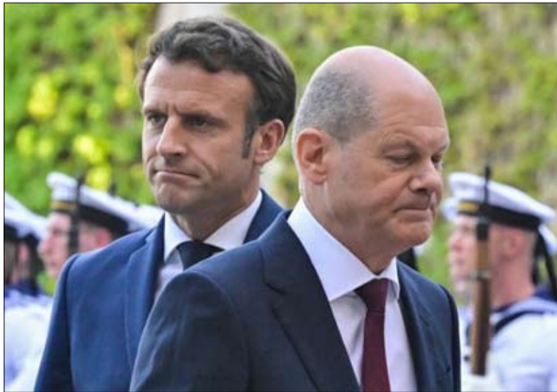
ماكرون وشولتزر.. مواقف متباينة في عدة ملفات