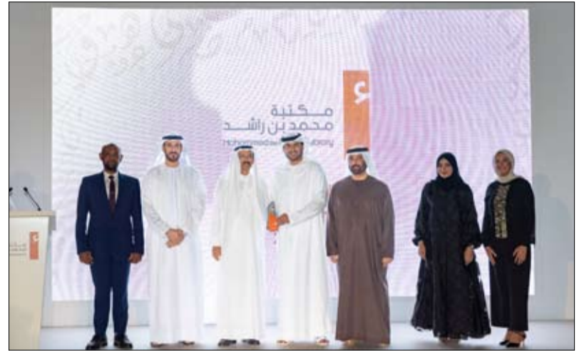
في حفل مميز بحضور كبار المسؤولين