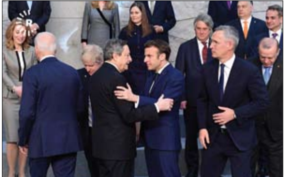
هل تساهم فرنسا في الإضعاف التدريجي لحلف الناتو؟

أعلنت مقديشو، أمس الجمعة، مقتل قائد عمليات تنظيم داعش الإرهابي فرع الصومال، في مواجهات مسلحة بولاية بونتلان شرقي البلاد. وقال بونتلان، في بيان نقله التلفزيون الحكومي، إن عناصرها الأمنية تصدت لهجوم من عناصر تنظيم داعش الإرهابي على بلدة بلي طيطين. وأضاف البيان أن المواجهات وقعت في الساعات الليلية قبل الماضية، حيث تمكنت القوات خلال المواجهات من قتل قائد عمليات تنظيم داعش الإرهابي أبوالبراء الأماني، الذي يحمل الجنسية الإثيوبية. وبحسب البيان، فإن أبوالبراء عين في هذا المنصب في يونيو (تموز) 2021، كما لعب دوراً كبيراً في ضم عدد من الإثيوبيين إلى التنظيم.