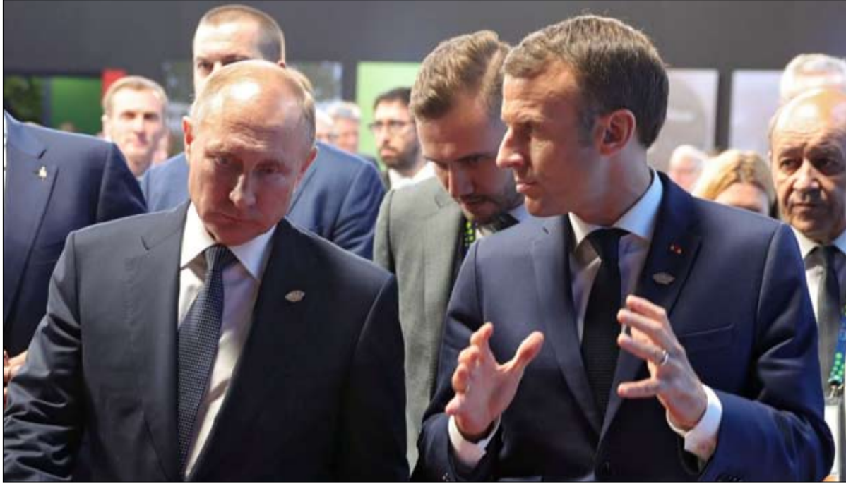
هل يسعى ماكرون حقاً لإبرام صفقة مع بوتين لإنهاء الحرب الروسية في أوكرانيا؟

أوروبا وقلبت حقبة ما بعد الحرب الباردة، أصبح على الناتو والأوروبيين إدراك كيف ولماذا يجب الدفاع عن القارة. وقال ماكرون إن الردع النووي "الموثوق والحديث" هو المفتاح. وأضاف أن "قواتنا النووية تساهم من خلال وجودها في أمن فرنسا وأوروبا. مُعلقاً على هذا الموقف الفرنسي قال فرانسوا هابسبورغ، كبير مستشاري أوروبا في المعهد الدولي للدراسات الاستراتيجية: "ماكرون يعيد صياغة موقف فرنسا بشأن الردع النووي". في الواقع، غالباً ما يتبرخ خبراء الدفاع في أوروبا إمكانية قيام فرنسا، بقدراتها النووية، بتزويد الأوروبيين بمظلة أمنية خاصة. قد يرتجف أتباع الأطلسي من هذه الفكرة. لكن الحرب الروسية في أوكرانيا تجبر الحلفاء على التفكير في الاتجاه الاستراتيجي المستقبلي للاتحاد الأوروبي وحلف شمال الأطلسي. وهكذا يسلم الصراع الضوء على الحاجة إلى الحفاظ على رادع نووي قوي وموثوق لمنع اندلاع حرب كبرى. قال ماكرون إن هذا الردع يجب أن يكون "شريعياً وفعالاً ومستقلاً". وبينما يريد أن تكون فرنسا "قوة مستقلة ومحترمة ونشيطة في قلب الحكم الذاتي الاستراتيجي الأوروبي"، فإنه يطمئن حلف شمال الأطلسي والعديد من الدول الأوروبية. إذ ستحافظ فرنسا على روابط قوية مع حلف الأطلسي. الشراكة الاستراتيجية مع الولايات المتحدة "ستبقى أساسية ويجب أن تظل طموحة، واضحة واقعية". ستعمل فرنسا أيضاً على تعميق علاقتها مع ألمانيا وإقامة شراكات دفاعية مع إيطاليا وإسبانيا مع تعزيز الركيزة الأوروبية في الناتو. "عندما يعود السلام إلى أوكرانيا، سنحتاج إلى تقسيم جميع من جانبه علق أوجينيوس سموولر من مركز العلاقات