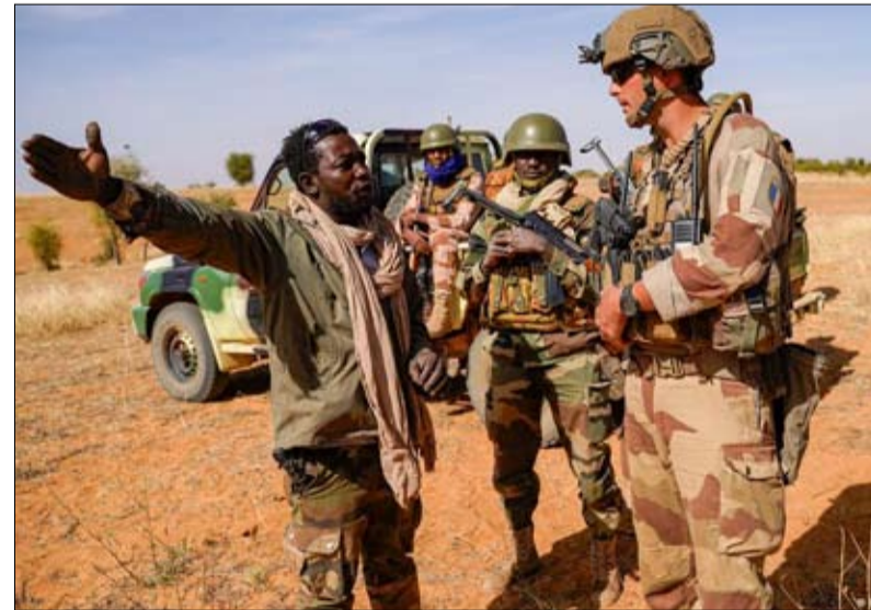
فرنسا أنهت عملية برخان في مالي للتركيز على أوروبا