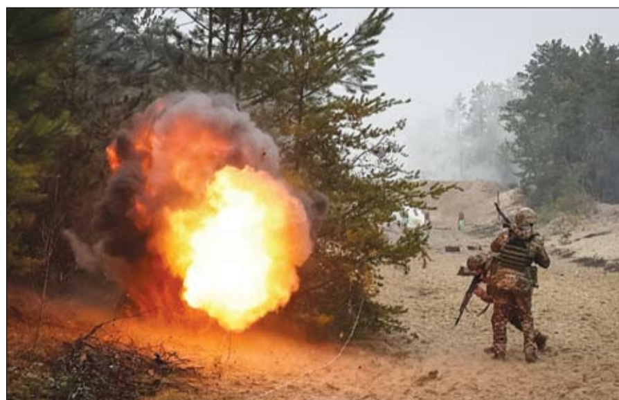
جنود أوكرانيون خلال تدريبات بالقرب من الحدود مع بيلاروسيا

الدفاع الأوكراني إن الوضع صعب في البلدة صعب للغاية، لكنه تحت السيطرة. فقد قالت أوكرانيا في وقت سابق الجمعة إن قواتها لا تزال صامدة في سوليدار بعد ليلة محمومة من القتال فيما أصبح أحد أكثر ساحات القتال دموية في الحرب برمتها. من جانبها، قالت نائبة وزير الدفاع هانا ماليار إن القوات الأوكرانية صمدت، يوم الجمعة، بعد ليلة محمومة من المارك في البلدة. وتعتبر سوليدار، الواقعة على بعد 15 كيلومترا من باخموت، ذات أهمية استراتيجية لكيف، فهي تقع في وسط خط الدفاع باخموت - سيفيرسك. ورغم أنها لن تشكل نقطة تحول في الحرب، إلا أن سقوط سوليدار في يد القوات الروسية بعد أشهر من الدفاع الأوكراني سيكون علامة فارقة في ساحة المعركة، وسيوفر للقوات الروسية نقطة انطلاق استراتيجية لجهودها من أجل تطويق مدينة باخموت القريبة. وتكبد الجانبان خسائر فادحة، المرة من أجل سوليدار.