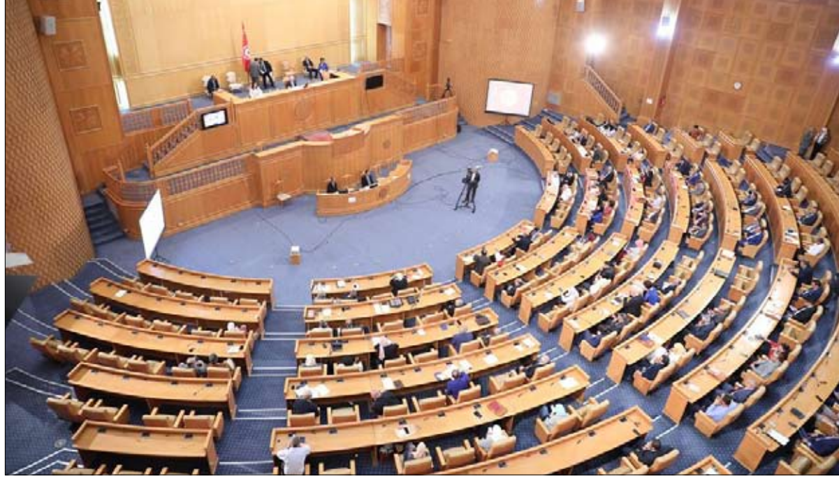
احزاب تستنكر موقف البرلمان