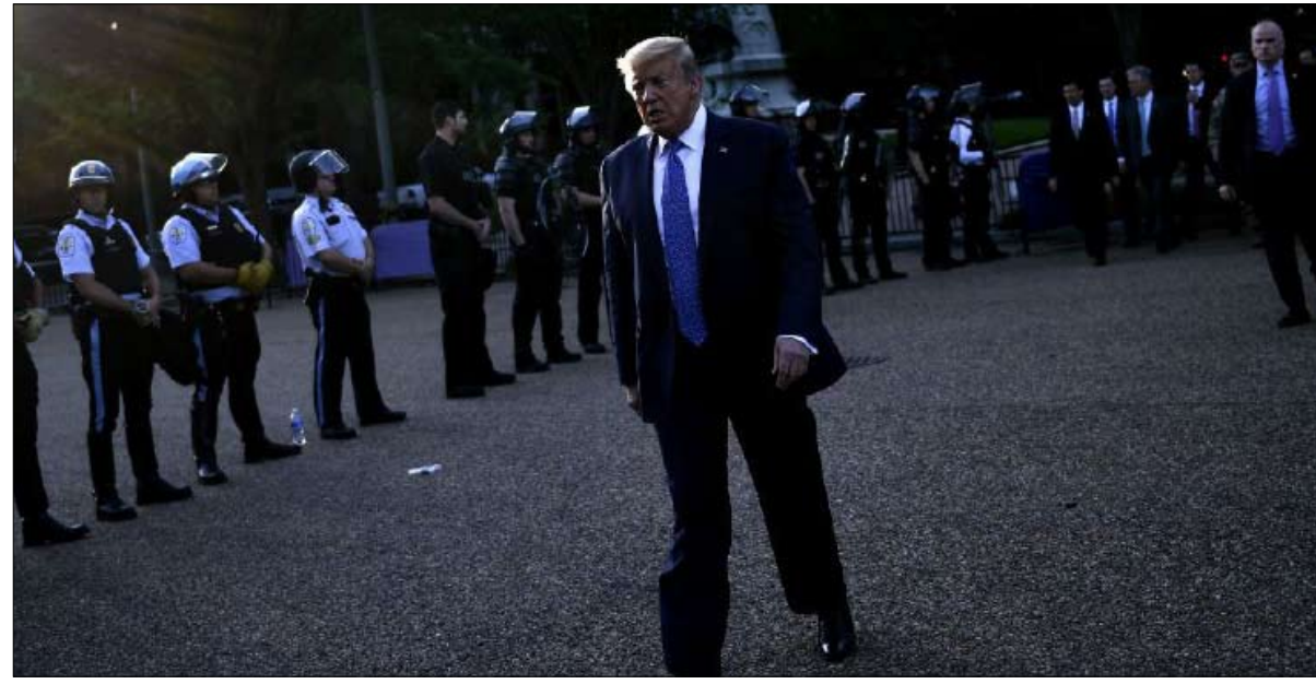
ترامب... الخروج من الحصار

أمام كل الكوارث التي تتساقط على بلاده اليوم، لم نعد نعرف أيها الأكثر خطورة