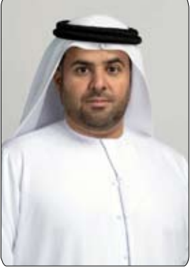
لمهرجان نيويورك الدولي لأفضل أعمال التلفزيون والأفلام.

ستوديو الشرق الأوسط 2020 عن فئة أفضل استخدام للرسوم المتحركة» للجائزة الذهبية لأفضل غرافيك في مهرجان القاهرة للإذاعة والتلفزيون التاسع في العام 2003 والجائزة الفضية عن فئة «أفضل عمل إنتاجي للهوية المؤسسية» على مستوى العالم لعام 2017 ضمن فعاليات الدورة التاسعة والخمسين