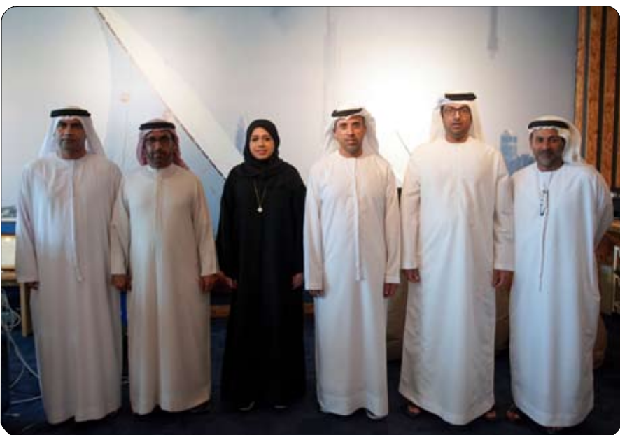
أسبوية يتنافسون في 17 رياضة من بينها الرياضات البحرية التي سوف تشهد مسابقات الدرجات المائية (جانس جي بي 2 وجانس جي بي 3 وواقف جي بي 2) وموتو سيرف وقوارب الروبوت كمنترول.

اللاعبين المشاركين في دورة الألعاب الآسيوية الشاطئية دورة الألعاب الآسيوية الشاطئية السادسة المقررة في سانيا الصينية خلال الفترة من 28 نوفمبر حتى السادس من ديسمبر المقبلين، بمشاركة رياضيين من 45 دولة