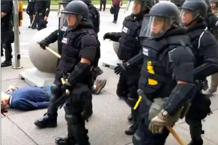
الدعوة الى تشديد القبضة الامنية

أمام كل الكوارث التي تتساقط على بلاده اليوم، لم نعد نعرف أيها الأكثر خطورة