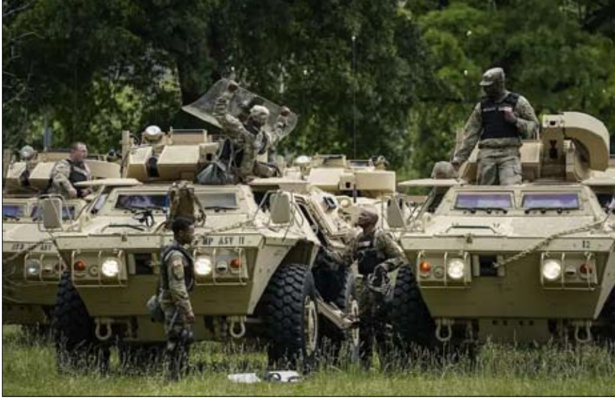
المطالبة بتدخل الجيش

ليس من قبيل الصدفة أن يعبر مسؤولو وكالة الاستخبارات المركزية، الحاليين والسابقين، عن قلقهم من الانحراف السلطوي للرئيس. وبعد حادثة كنيسة القديس يوحنا، تحدى مارك بوليمبولوس، وكيل وكالة المخابرات المركزية السابق في أوروبا وآسيا، "إنه يذكرني بما كنت أتلفت عنه لسنوات في العالم الثالث، قال صحفية واشنطن بوست حيث مارس كثير من الزعماء ذلك.. لم يخف ترامب أبدًا إعجابيه بالديكتاتوريين، وبالرجال الأقوياء؛ بوتين، دوتيرتي وآخرون، وبالتالي، بزعم كوربا الشمالية، الذي تربطه به حالة عشق، هل جاء دوره أخيرًا لإظهار قدراته وإخراج المدفعية الثقيلة من هرمون التستوستيرون؟ يبدو أن دعوته المتكررة لإدخال الجيش في اللعبة، وحضه على "الحزم والشدّة"، تشير إلى ذلك. عندما يبدأ النهب، يبدأ إطلاق النار، حذر مستعيرا مفردات رئيس شرطة عنصرية ومظاهرات في حقبة النضال من أجل حقوق مدنية متساوية، أتت إلى تصاعد العنف (نفي ترامب أن يكون استلهم موقولته منه، وتميل إلى تصديقه، لأن التاريخ ليس من نقاط قوته).