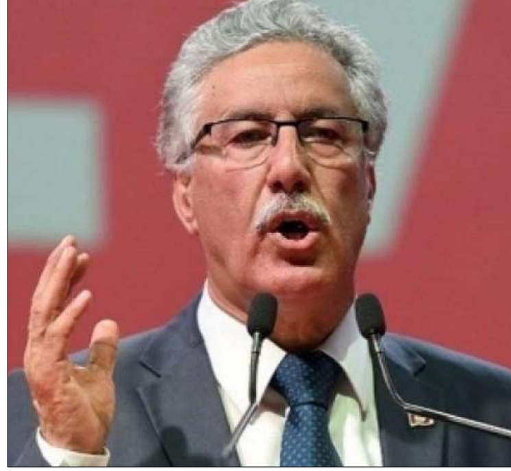
حزب العمال يستنكر ويدين

يستمر الجدل حول المسألة الليبية في تونس، وبعد فشل البرلمان في اعتماد قرار يرفض التورط في تشريع التدخل الأجنبي في ليبيا وجعل تونس قاعدة انطلاقه، أعلنت أحزاب غير ممثلة في البرلمان مواقفها من هذا التطور. وفي ذنا الإطار، استنكر حزب العمال موقف كل الكتل والأطراف وعلى رأسها كتلة حركة النهضة وحلفائها من اللائحة المقدمة من كتلة الدستوري الحر بعد تعديلها معتبرا انهم "عملوا على إسقاط هذه اللائحة رغم ما ادخل عليها من تعديلات نزعتم عنها صبغة الاصطفاف