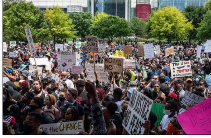
من يوقف الانتفاضة؟