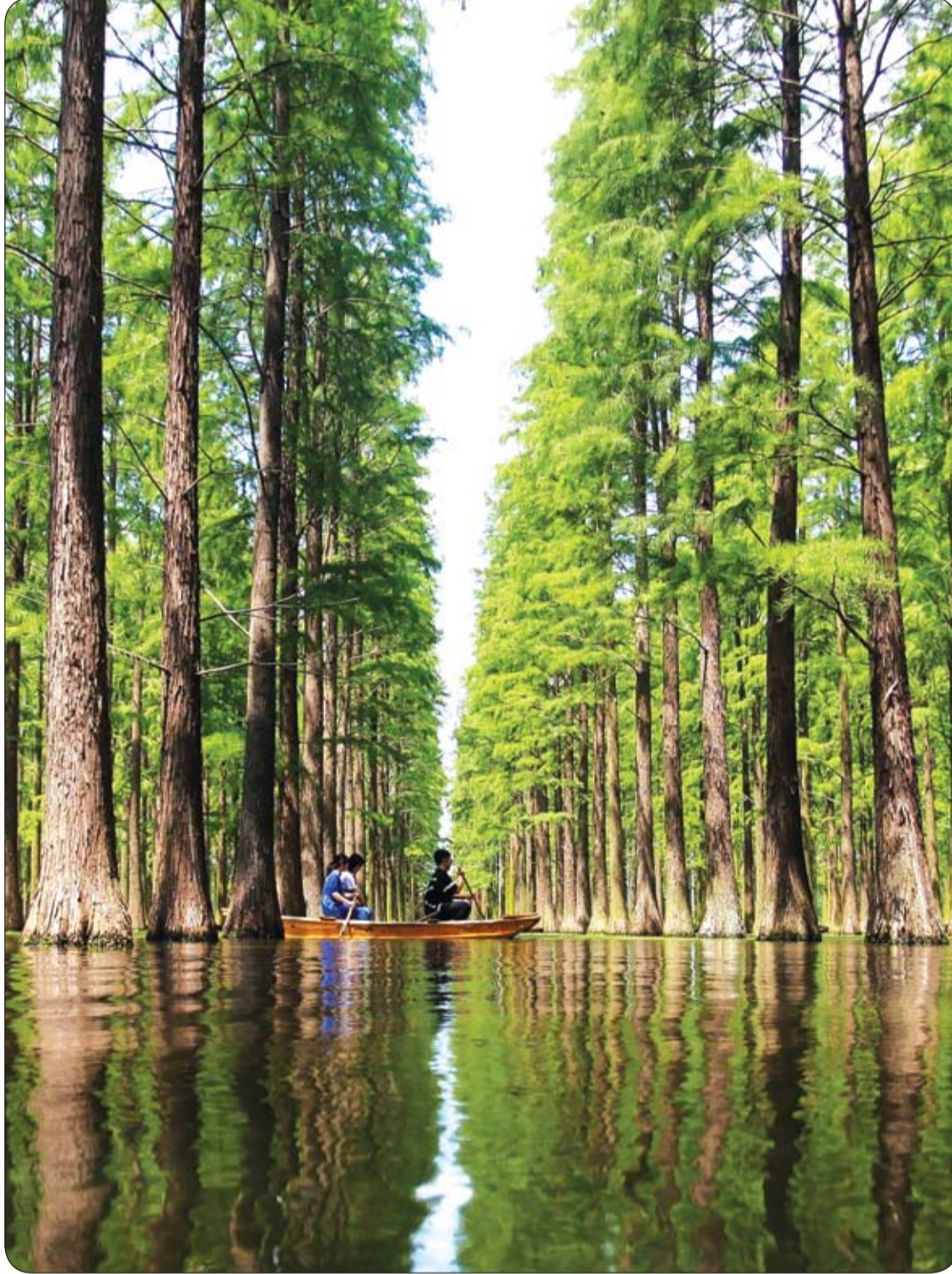
سياح يركبون قارباً بين الأشجار في منتزه بحيرة لويانغو بـيانغتشو بمقاطعة جيانغسو، شرق الصين.

يمكن للأباء والأمهات قريباً اختيار جنس أطفالهم في وقت مبكر، وذلك بفضل اكتشاف جديد للعلماء اليابانيين. وتحمل الإناث كروموسومات إكس في خلايا الجسم، في حين يحمل الذكور كروموسومات إكس واي، ويمكن أن تؤدي طريقة جديدة ومبسطة إلى الفصل بين النوعين كجزء من عملية التلقيح الصناعي، واختيار الآباء والأمهات جنس المولود حسب الرغبة. وقال أحد مؤلفي الورقة البحثية المشاركين، ماسايوكي شيمادا، من جامعة هيروشيما، هذه أول دراسة تظهر بشكل علمي الفوارق الوظيفية، أي القدرة على الإخصاب، بين الحيوانات المنوية إكس والحيوانات المنوية واي. وفي حين أن العلماء قادرين على فصل الكروموسومات لبعض الوقت، فإن هذه الطريقة الجديدة تجعل العملية أكثر بساطة وأسرع بكثير، بحسب صحيفة ميرور البريطانية. وعلى الرغم من أن البحث قد يكون له يوماً ما تأثير على المجتمع البشري، إلا أن العلماء يقولون إن التطبيق الرئيسي لعمليتهم سيكون في البداية في المزارع. وقال شيمادا «في مزرعة للأبناج، تكون قيمة البقرة الأنثى أعلى بكثير من الذكور، لأن الحليب لا يُنتج إلا من الأبقار الإناث. وفي حالة إنتاج لحم البقر، فإن سرعة النمو أعلى بكثير للذكور من الإناث». ويقول شيمادا إن هناك أسئلة أخلاقية يجب الإجابة عليها قبل أن يتم تطبيق التكنولوجيا على البشر، استخدام هذه الطريقة في التكنولوجيا التناسلية البشرية هو تخمين في الوقت الراهن، وينطوي على قضايا أخلاقية كبيرة لا تتأثر بفائدة هذه التقنية الجديدة». وحذر البروفيسور روبين لوفيل بادج، الخبير في علم الأحياء التطوري بمعهد فرانسيس كريك في لندن، بأن هناك حاجة إلى إجراء مزيد من الاختبارات قبل الإعلان أن هذه التقنية آمنة.