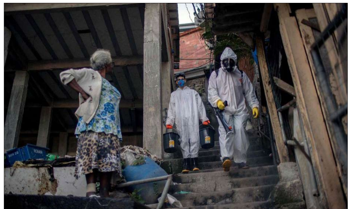
الأحياء الفقيرة وكر الوباء