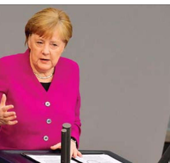
ميركل تلقي خطابها أمام البرلمان الألماني حول تداعيات جائحة كورونا

التعايش معه لفترة طويلة، أظهر مسح ألماني أن معنويات المستهكين تراجعت بشكل كبير جراء تفشي الوباء. وقالت أنجيلا ميركل أمام مجلس النواب البوندستاغ، الخميس، إن ألمانيا لا تزال في بداية وباء فيروس كورونا الجديد، وسوف يتعين عليها العيش معه لفترة طويلة. وأضافت المستشارة الألمانية: لسنأ في المرحلة الأخيرة من الوباء، إنما ما زلنا في البداية.. واكتسبنا بعض الوقت، مشيرة إلى أنه تم استغلال هذا جيداً لتعزيز نظام الرعاية الصحية في البلاد. وأظهرت بيانات معهد روبرت كوخ للأمراض المعدية، أمس الخميس، أن عدد حالات الإصابة المؤكدة بفيروس كورونا في ألمانيا زاد بمقدار 2352 حالة وبلغ الإجمالي 148046 إصابة، مما