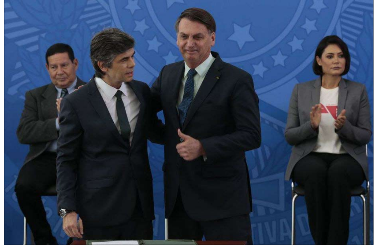
وزير الصحة الجديد يلتزم

لنصيحة منظمة الصحة العالمية ... "من حسن الحظ، للبرازيل دستور يحمي الحريات، ولهذا الدولة الفيدرالية مؤسسات تمنح جزءاً كبيراً من السلطة للحكام ورؤساء البلديات"، قال الأكاديمي. ورغم خطها الليبرالي جدا ستضخ الحكومة أكثر من 120 مليار يورو لدعم الاقتصاد. وحسب صندوق النقد الدولي ستشهد البرازيل مع ذلك انخفاضاً في إجمالي الناتج المحلي بنسبة 5 فاصل 3 بالمائة عام 2020.