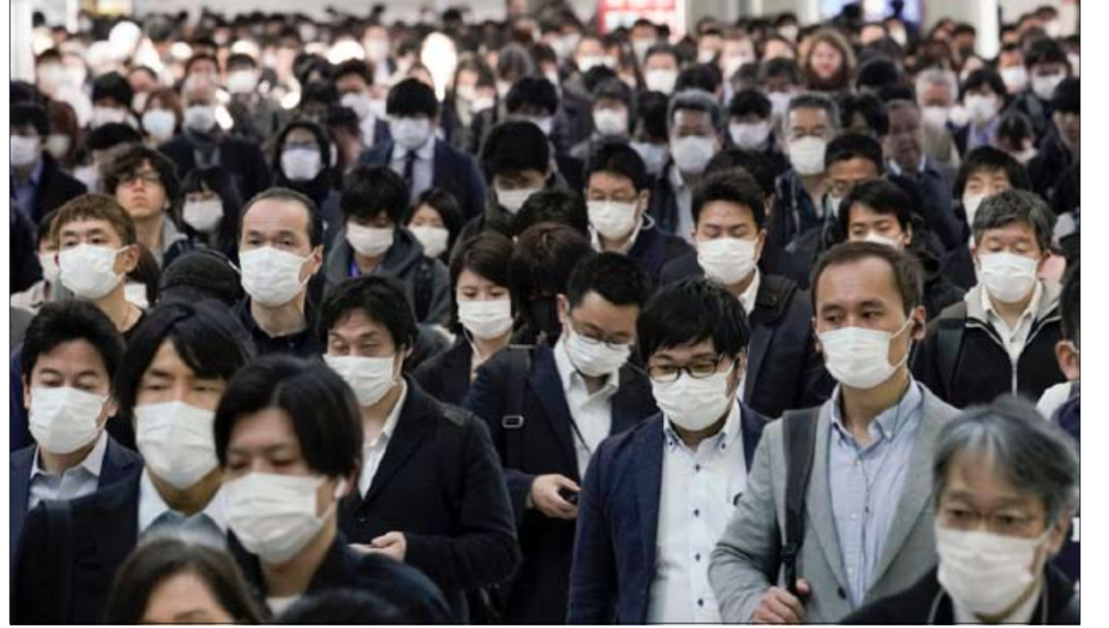
اليابان تواصل العمل

إذا كان للأرخبيل 15 حالة فقط في الأول من مارس، فإنه يحد يوم الأحد... أكثر من 500. تتحدث وسائل الإعلام اليابانية عن موجة ثانية منذ ثلاثة أسابيع، حتى وإن كانت تبدو أشبه بتسارع الأولى، يؤكد جان فرانسوا هيمبرجر، صحفي وباحث متخصص في اليابان.