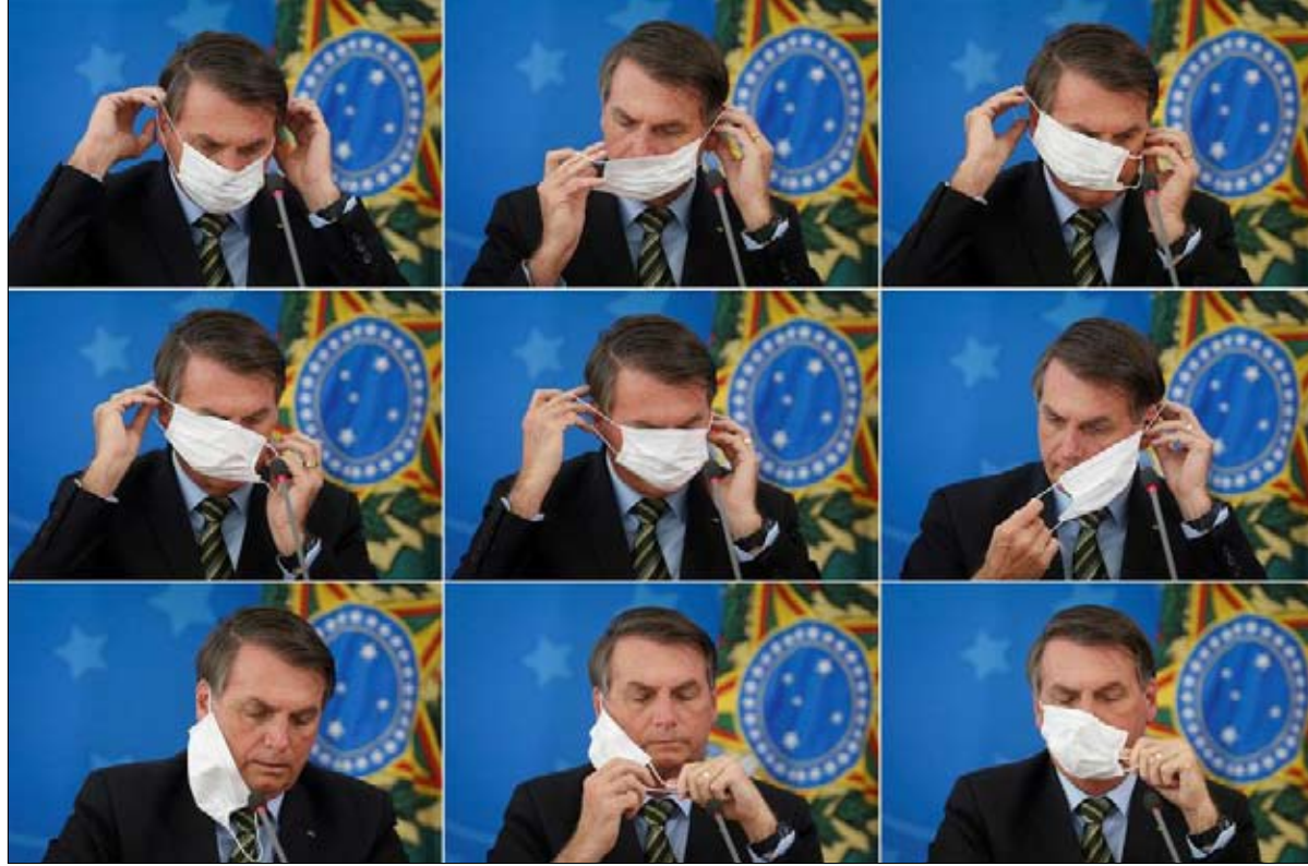
الخطاب الرئاسي يخلق البلبلة

لذا، يرغب بوتين في تنظيم هذا العرض في موعد آخر، ولكن من هي الشخصيات البارزة التي ستقف جنباً إلى جنب في الساحة الحمراء، كما في الأيام الماضية؟