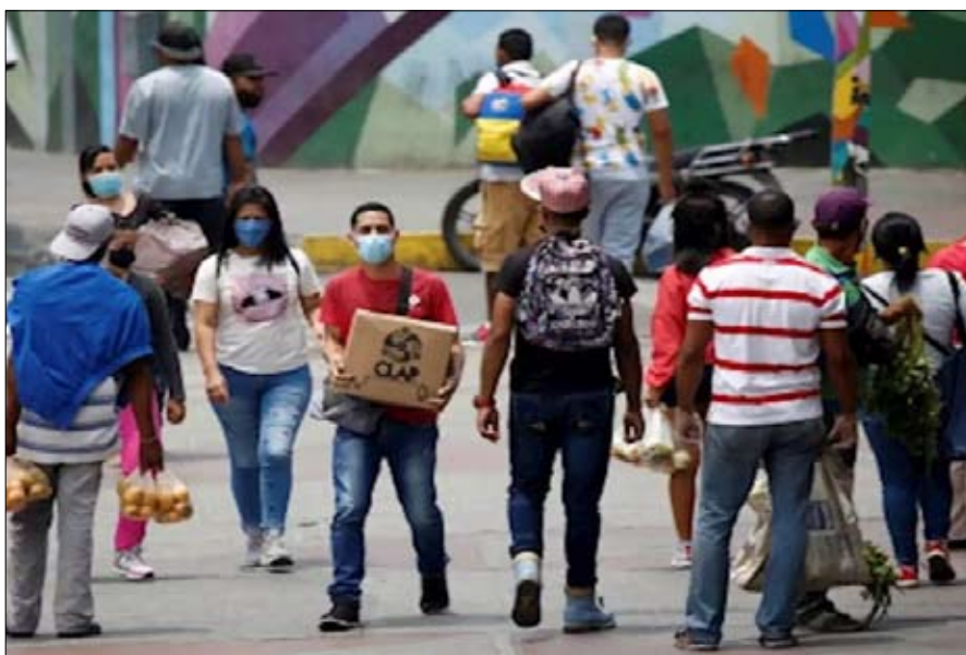
•• كراكاس-أ ف ب

أعلن نائب في المعارضة الفنزويلية أن سبعة أشخاص جرحوا خلال تظاهرة للمطالبة بالطعام وتحولت إلى عمليات "تهب" للمحال التجارية في مدينة بشارق فنزويلا، التي تعاني من أزمة خطيرة وسط انتشار وباء كوفيد-19.