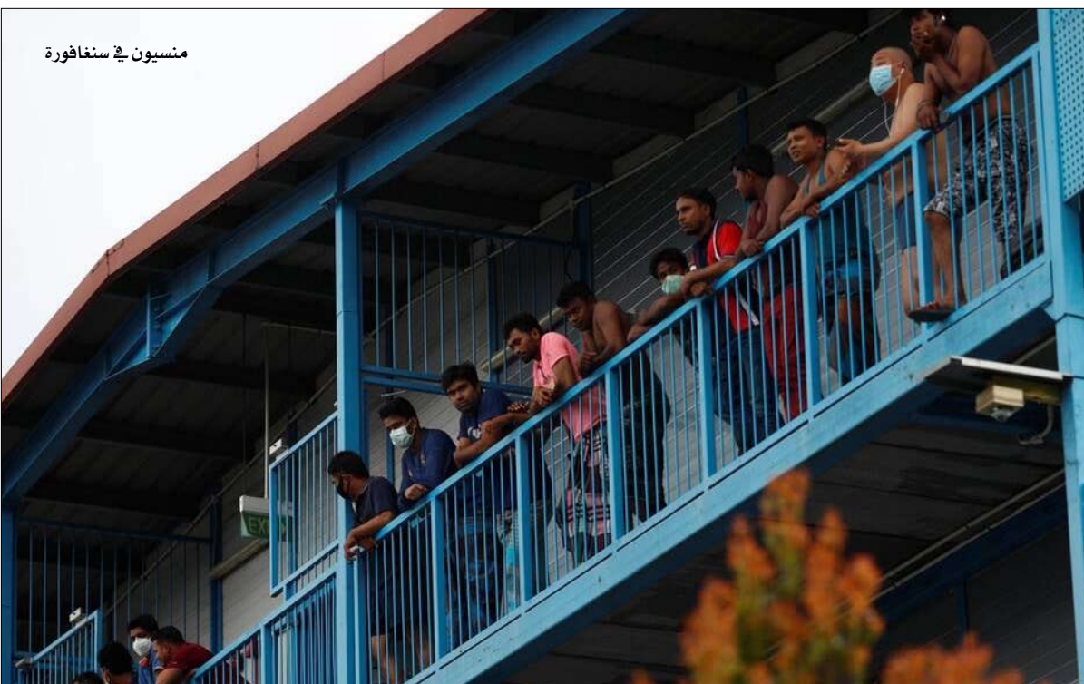
متسبون في سنغافورة