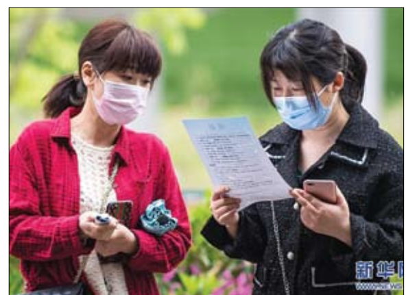
الصين مخاوف جديدة

حذرت غوغل من أن مقرنصين مدعومين من الدول يستغلون أزمة فيروس كورونا لاستهداف منظمات الرعاية الصحية العاملة لمحاربة الوباء. وقال فريق أمني مهمته الدفاع ضد الهجمات الإلكترونية المدعومة من الحكومات على غوغل ومستخدميه، إنه حدد أكثر من 12 مجموعة ترعاها الدول وتستخدم مواضيع كورونا كطعم في الاصطياد الاحتيالي وفخاخ البرامج الخبيثة. وفي وقت سابق من هذا الشهر، أفادت شركة "غوغل" بأنها اكتشفت حوالي 18 مليون برنامج خبيث ووسائل اصطياد مرتبطة بالباحثة يومية وحوالي 240 مليون رسالة سبام مرتبطة بكورونا.