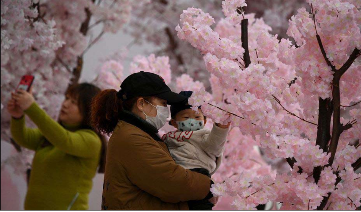
الربيع الدامي في آسيا