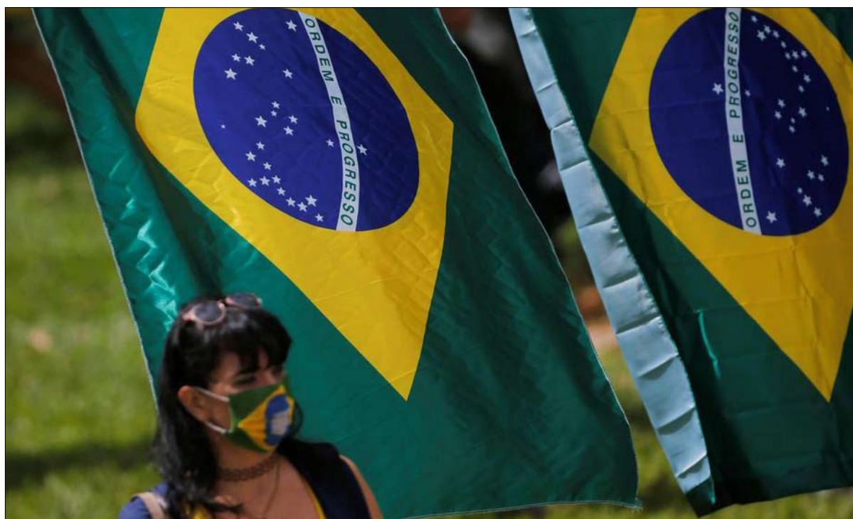
البرازيل في انتظار الصدمة