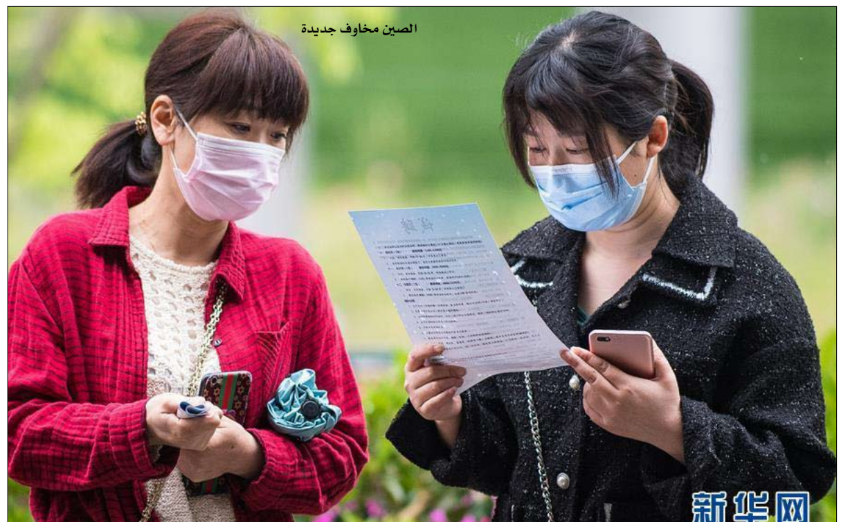
الصين مخاوف جديدة