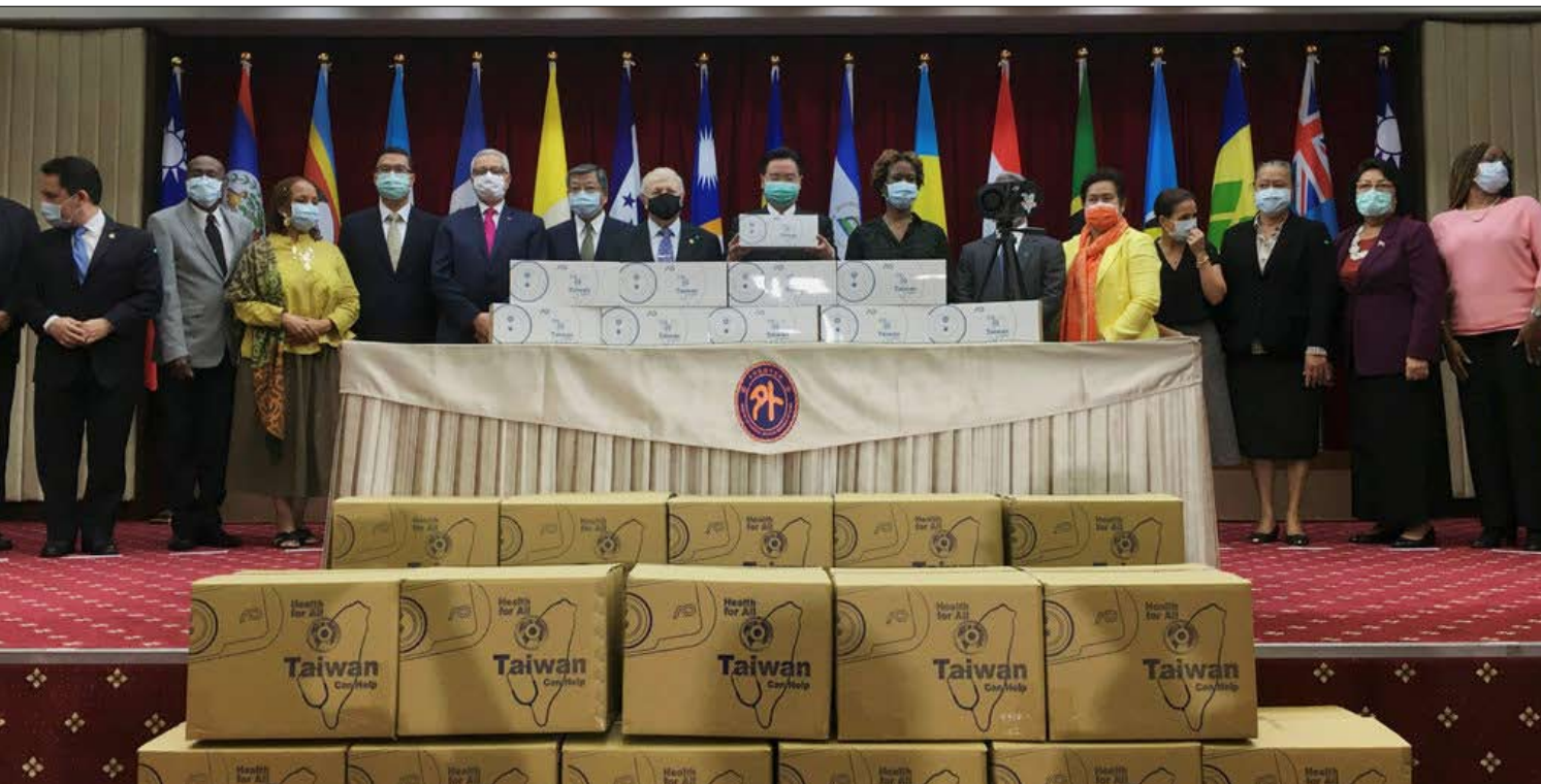
تايوان تنجح وتقدم مساعدات