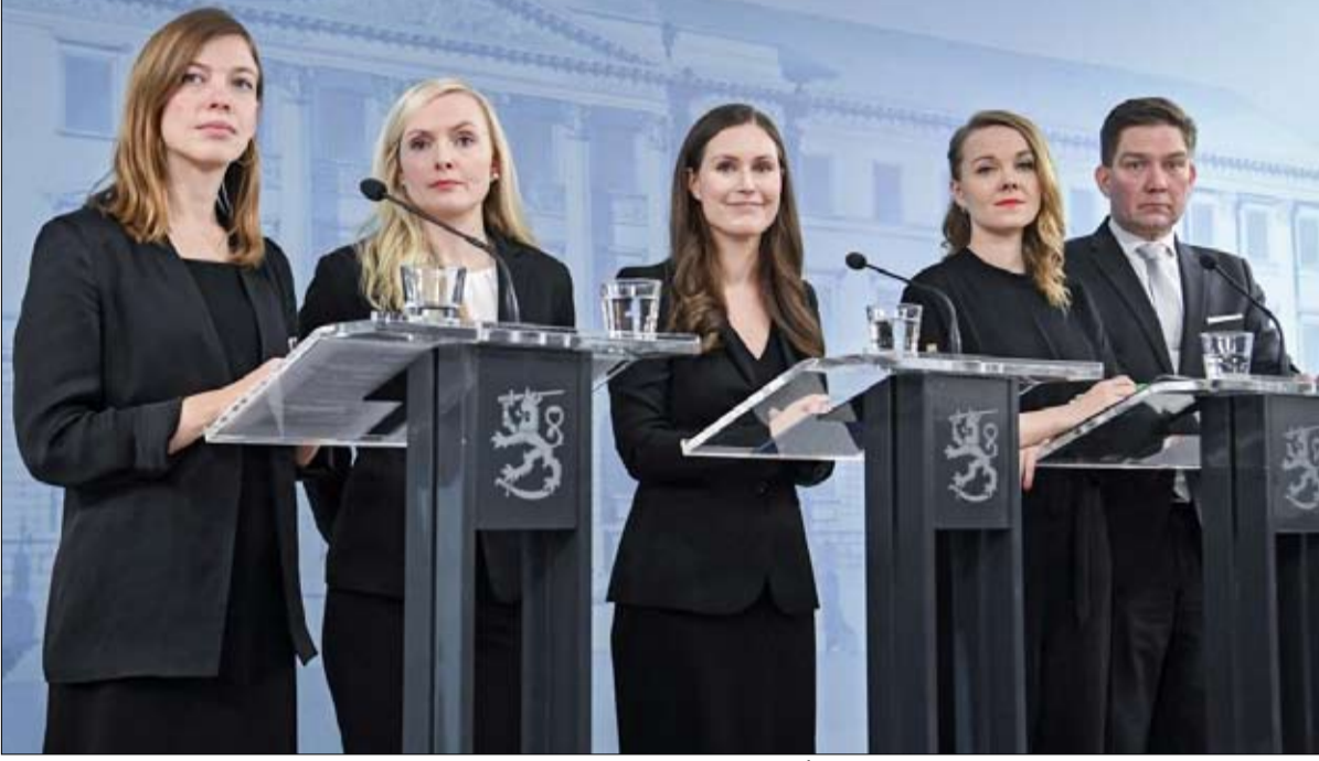
لي اندرسون، من اليسار، ماريا أويسالو، وكاتري كولوني وتوماس بلومكنيست من اعضاء الحكومة

وقالت في مؤتمر صحفي "تم أفكر قط في عمري أو جنسي... أفكر في أسباب دخولي معترك السياسة، والأشياء التي من أجلها اكتسبت ثقة الناخبين.."