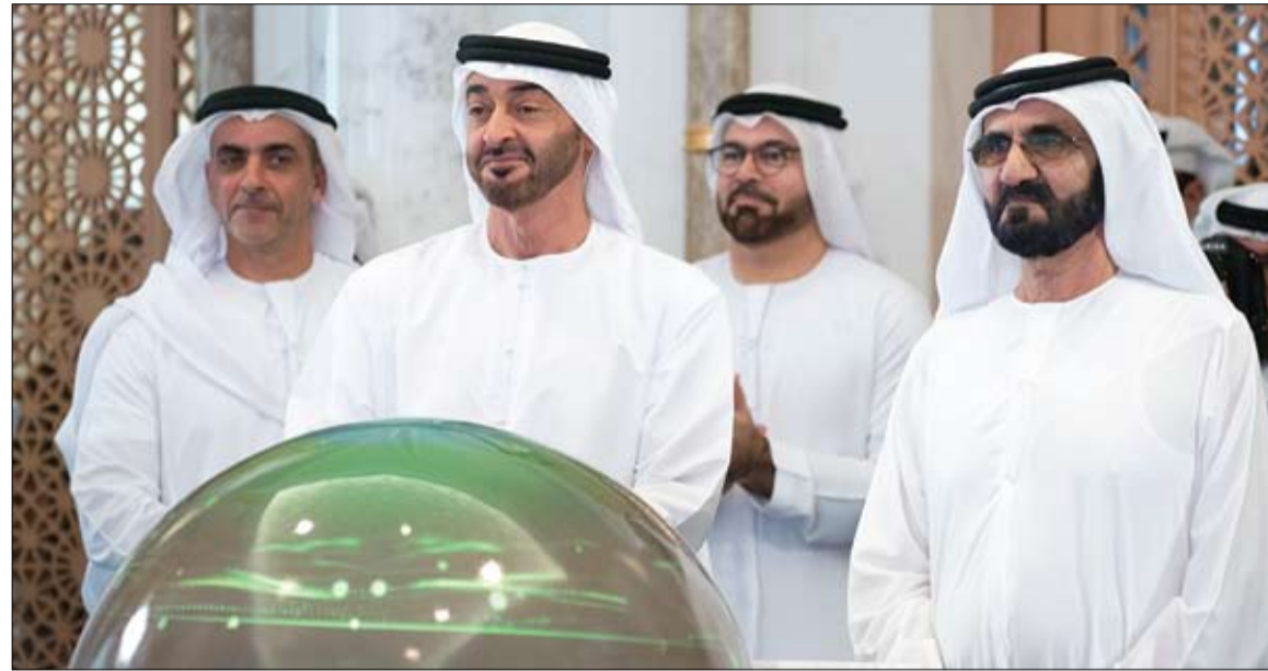
محمد بن راشد ومحمد بن زايد خلال إطلاقهما الهوية الإعلامية للإمارات

أنا فخورة جدا ببلدي... لا تخفي أبيلي ياتينماكي تأثرها عندما تتحدث عن الحكومة الجديدة، فلندا الآن في أيدي النساء، تقول باعتزاز النائب في البرلمان الأوروبي (64 عاما) التي كانت أول امرأة تقود حكومة بلدها، كان ذلك قبل ستة عشر عاماً. اليوم، تتولى النساء قيادة الأحزاب الخمسة المشاركة في الائتلاف الحاكم، منذ شهر، وأربعة منهن دون سن 35، ويُنسب العالم بحداثة هذا البلد. تجدر الإشارة إلى إن رئيسة الوزراء الجديدة، سانا مارين، ابنة عشرين عاماً، فهي من أسرة متواضعة، وأم لطفل يبلغ من العمر 23 شهراً، وأصبحت في سن 34 عاماً أصغر رئيسة حكومة حالياً في العالم. (التفاصيل ص 15)