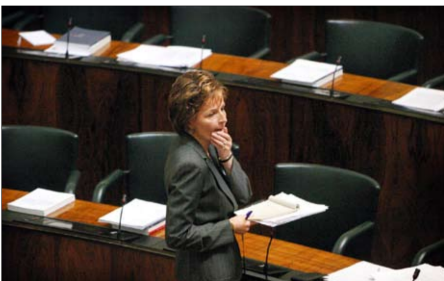
آنيلي ياتيماتي أول امرأة قادت حكومة فنلندا