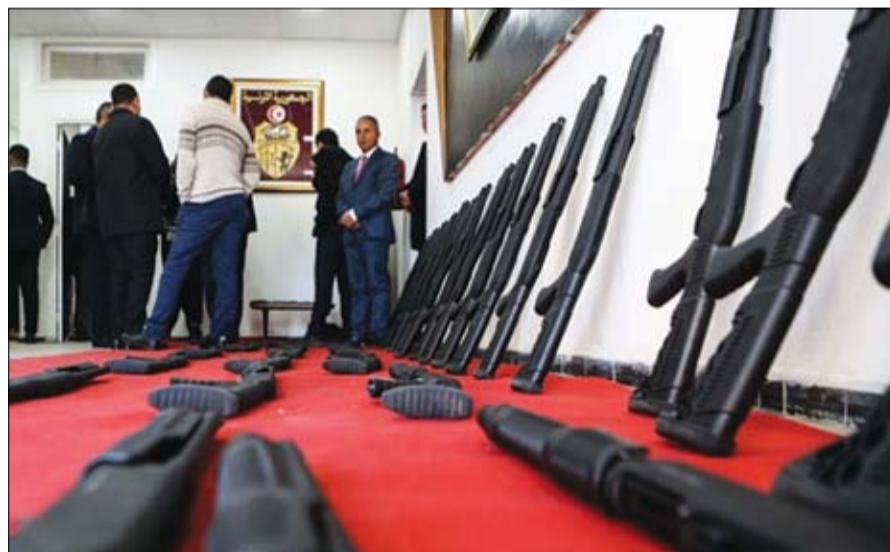
الأسلحة التركية المحجوزة في تونس