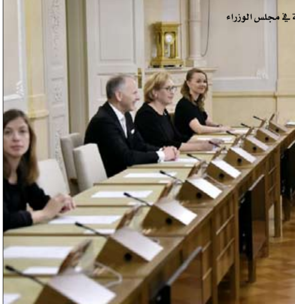
اغلبية نسوية في مجلس الوزراء

أطلق أفضل حملة دعائية رأيتها على الإنترنت. لا غير . وتعرضت هذه الشركة لانتقادات شديدة لعدم وقف حملات نشر معلومات خاطئة خلال انتخابات 2016 الرئاسية. ومع اقتراب الاستحقاق الرئاسي الأميركي في 2020 تضاعف المجموعة جهودها للتصدي ويرفض فيسبوك أن يحذو حذو تويتر الذي أعلن في تشرين الأول/ أكتوبر أنه سيرفض أي دعاية لأغراض سياسية في أي مكان من العالم. وباسم حرية التعبير، يدافع زوكربيرغ بانتظام عن نشر رسائل سياسية على موقعه حتى وإن كانت تنطوي على أكاذيب. من جهته تبنى غوغل محرك البحث موقفا وسطيا بمواصلة السماح بنشر دعايات سياسية لكنه شدد القواعد التي تحظر نشر رسائل خاطئة (كموعد خاطئ للاقتراع) أو منع استهداف الناخبين. لم تلتجأ حملة دونالد ترامب بحد ذاتها إلى نشر معلومات خاطئة أو الخداع في 2016