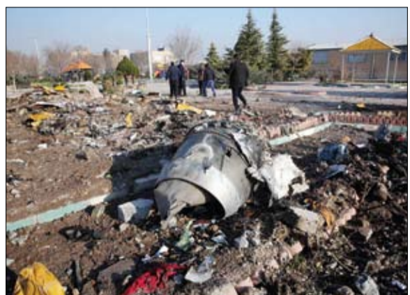
جانب من حطام الطائرة الأوكرانية

قتل أربعة أشخاص على الأقل وأصيب أكثر من عشرة وفق شرطة مقديشو في تفجير سيارة مفخخة قرب البرلمان تبنته حركة الشباب المتطرفة. وانفجرت السيارة وسط العديد من السيارات الأخرى عند حاجز على طريق مكة المكرمة قرب منطقة سيدكا حيث يقع البرلمان الصومالي. وتبنت حركة الشباب التابعة لتنظيم القاعدة هذا التفجير الذي يأتي بعد أيام على تفجير ضخم بمركبة مفخخة تبنته الحركة أيضا وأودى بحياة 81 شخصا في 28 كانون الأول ديسمبر، واقتحام متطرفين في الأحد قاعدة عسكرية في كينيا تستخدمها القوات الأميركية. وأكد الشرطي عدن عبدالله لفراض برس المتفجرات كانت على متن سيارة، مضيفا أن قوات الأمن اعتقدت بادئ الأمر أن السيارة لم تكن قادرة على المرور عبر الحاجز قبل أن يجري تفجيرها. وأشار إلى وجود سيارات أخرى مصطفة خلفها بانتظار العبور عبر نقطة التفتيش الأمني عندما وقع الانفجار. وقال إن المعلومات الأولية التي بحوزتنا تفيد بمقتل أربعة أشخاص وإصابة أكثر من عشرة. وتصاعدت سحابة دخان أسود كثيف في سماء العاصمة بعيد الانفجار، امتدت لمسافة عشرات الكيلومترات من موقع التفجير. وسمع إطلاق نار كذلك في أعقاب التفجير، لكن السلطات لم تؤكد وقوع اشتباك بين قوات الأمن وعناصر حركة الشباب.