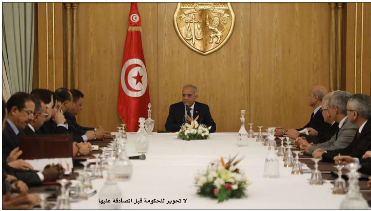
لا تحوير للحكومة قبل المصادقة عليها

الحكومة وتغيير الوزراء الذين لم يحظوا بموافقة السياسيين وعليهم تحفظات"، في إشارة إلى مطالبة حزبي النهضة وقلب تونس بذلك. وأضاف أنه أعلم الرئيس قيس سعيد بالتزامه بهذا التعهد ووافق على أن يكون التعديل في مرحلة لاحقة على ضوء ما يتوفر من معلومات حول النزاهة والاستقلالية والكفاءة في علاقة بالوزراء، حسب تصريحه.