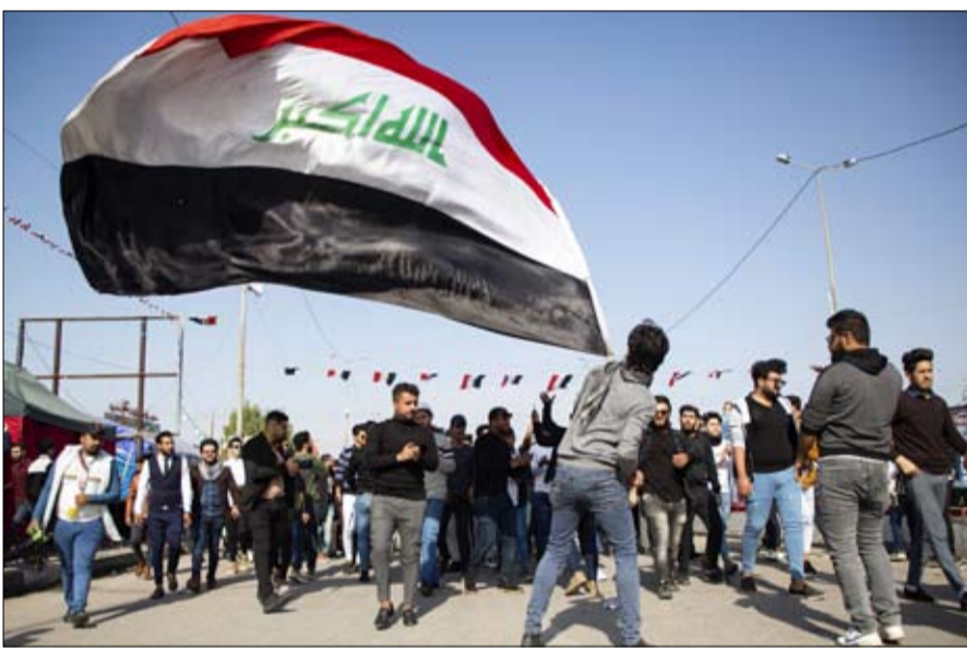
الإيرانية لأن لا سيادة عراقية .

تنصرف في العراق كما يحلو لها، بدءاً من استهدافها في الصيف الماضي مخازن أسلحة لقوات الحشد الشعبي، ومهاجمة ميليشيا حزب الله العراقي في مدينة القائم عند الحدود العراقية السورية، وصولاً للغارات الأخيرة. وتمت جميع تلك العمليات من جانب واحد دون التنسيق مع السلطات الأمنية العراقية.