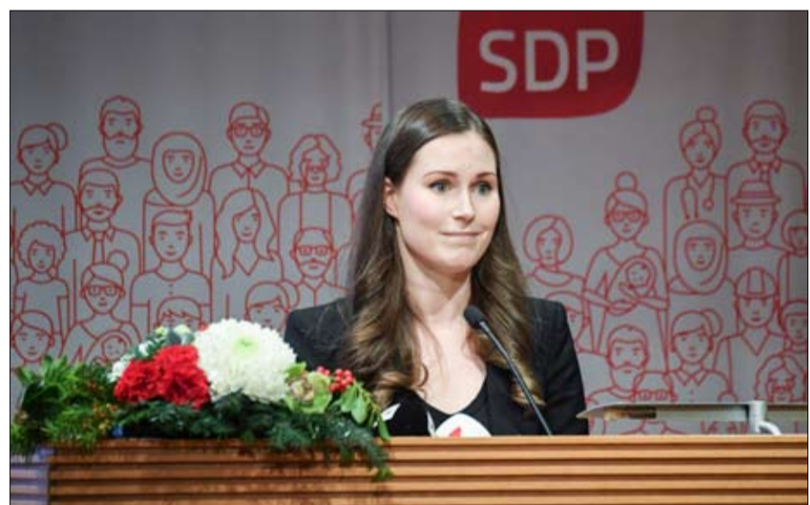
سانا مارين في قيادة السفينة الفنلندية

اليوم، تتولى النساء قيادة الأحزاب الخمسة المشاركة في الائتلاف الحاكم، منذ شهر، وأربعة منهم دون سن 35، وينبهر العالم بجدارة هذا الجيل. تجدر الإشارة الى ان رئيسة الوزراء الجديدة، سانا مارين، ابنة عصرها، فهي من أسرة متواضعة، وأم لطفل يبلغ من العمر 23 شهرا، وأصبحت في سن 34 عاما أصغر رئيسة حكومة حاليا في العالم. كل شيء سار بسرعة بالنسبة لهذه الاشتراكية الديموقراطية التي بدأت مسيرتها السياسية في السابعة والعشرين في تامبيري، ثاني أكبر مدينة في البلاد. وتسارع كل شيء في أوائل ديسمبر عندما اضطرت سلفها، الذي جرفته أزمة ثقة إثر إضراب قطاع البريد، إلى الاستقالة. ثم قام الحزب بتعيين وزيرة النقل والاتصالات هذه، لتتولى هذا المنصب.