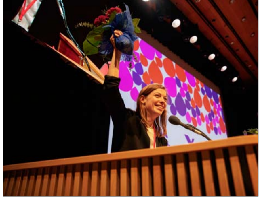
لي اندرسون بعد إعادة انتخابها زعيمة لتحالف اليسار

التحدي الأكبر هو صمود سانا مارين أمام معارضة محافظة قوية حيث معركة التنافس بديهية