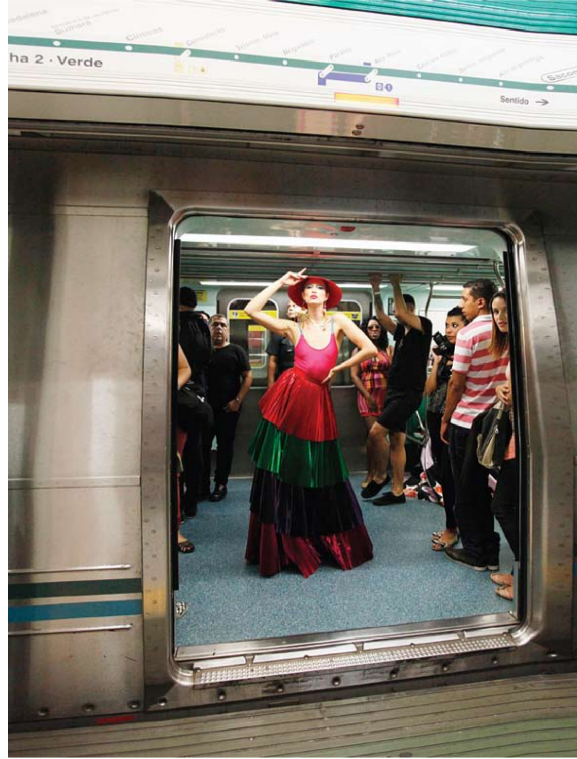
عارضة تقدم زياً جميلاً في محطة القطارات خلال أسبوع الموسمة في ساو باولو بالبرازيل.

أكدت دراسة علمية، أن من يأكل شوكولاته كثيرا والذين يتناولون منتجات الكاكاو أقل تعرضا للجلطة القلبية وغيرها من أمراض القلب والأوعية الدموية بنسبة 37% مقارنة بالذين لا يتناولون الشوكولاته إلا في حدود ضيقة، وأكد معدو الدراسة تحت إشراف أوسكار فرانكو من جامعة كامبريدج الإنكليزية في الدراسة، أن نسبة الإصابة بالجلطة القلبية أقل بواقع 29% بين عشاق الشوكولاته، ومع ذلك فإن الخبراء حذروا من تناول الشوكولاته بلا حدود، وقام الباحثون خلال الدراسة التي أعلن عنها مؤخرا في باريس بتحليل بيانات سبع دراسات شملت 114 ألف مشارك، وتضم هذه الدراسات دلائل على احتمال أن تكون مادة فلافونويد الموجودة في الشوكولاته مفيدة للصحة، فلافونويد هي مجموعة من الألوان النباتية توجد بشكل خاص في ثمار الفاكهة والخضراوات والشاي، وهي تجتذب ما يعرف بالجنذور الحرة، وعناصر شديدة الاستعداد للتفاعل وضارة بالجسم، وأشار الباحثون إلى ضرورة إجراء دراسات أخرى لتأكيد التأثير الإيجابي المحتمل للشوكولاته، حيث إن الدراسة لم تشمل على سبيل المثال ما إذا كانت أنواع بعينها من الشوكولاته هي التي تحدث هذا التأثير الإيجابي المرجح للشوكولاته، بالإضافة إلى أن الشوكولاته العادية غنية جدا بالسكريات الحرارية، ما جعل الباحثين يؤكدون أن الاستهلاك المفرط للشوكولاته يؤدي إلى زيادة الوزن الذي يعرض صاحبه لخطر الإصابة بضغط الدم والسكر وأمراض القلب والدورة الدموية.