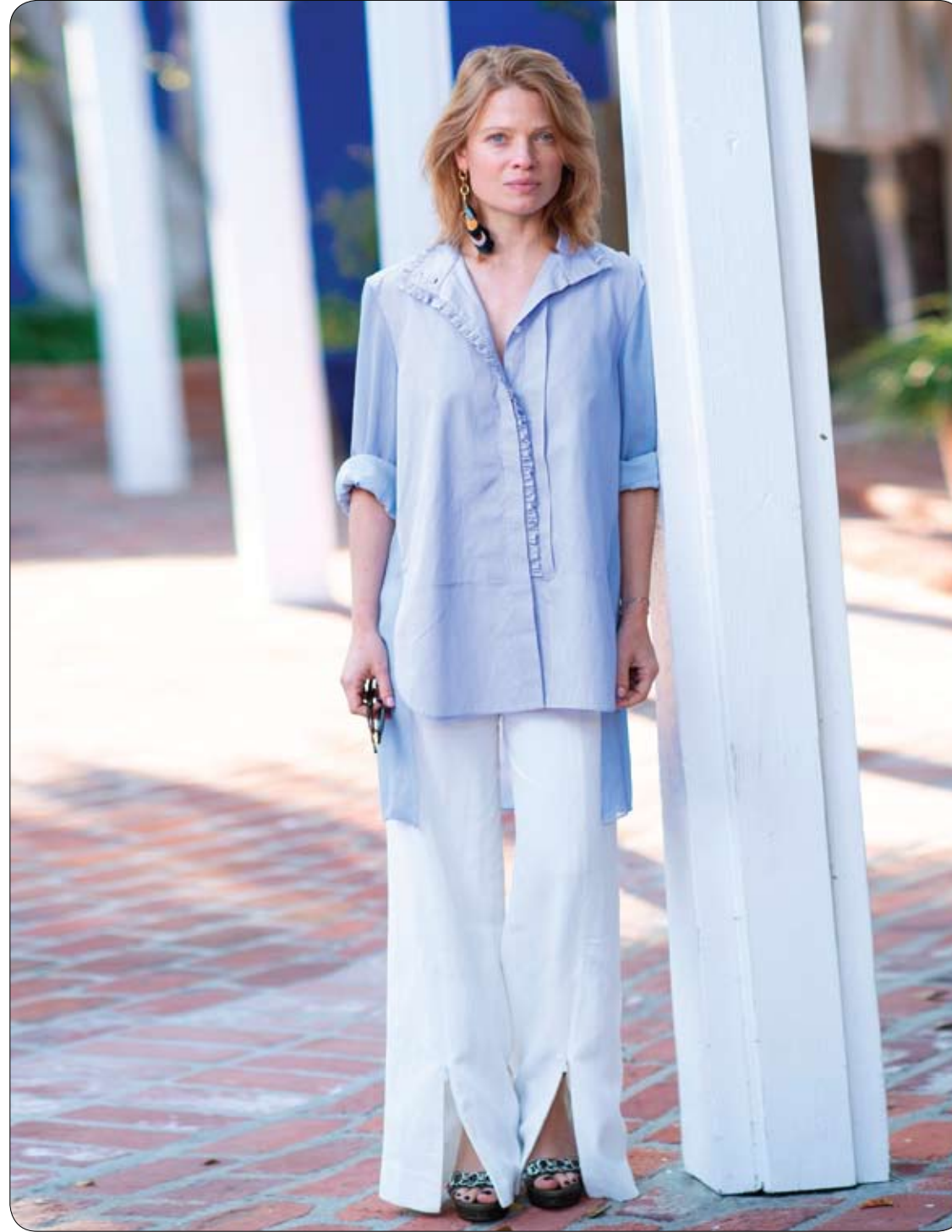
الممثلة الفرنسية ميلاني تييرى عقب حضورها عرض فيلمها (مذكرات الحرب) في بيفرلي هيلز، كاليفورنيا وهو الفيلم الذي اختارته فرنسا لدخول سباق الأوسكار لأفضل فيلم أجنبي في عام 2019.

-يمكنك إضافة ملعقة صغيرة من أقراص الفحم إلى كوب من الماء وتخفيفه جيدًا، ويشرب هذا الخليط قبل تناول وجبة كبيرة.