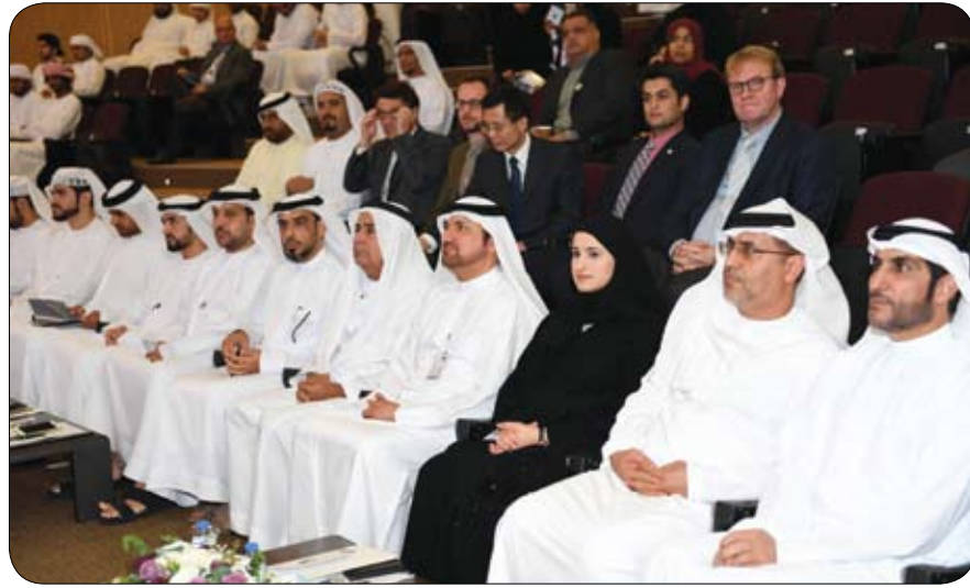
برعاية الرئيس الأعلى للجامعة