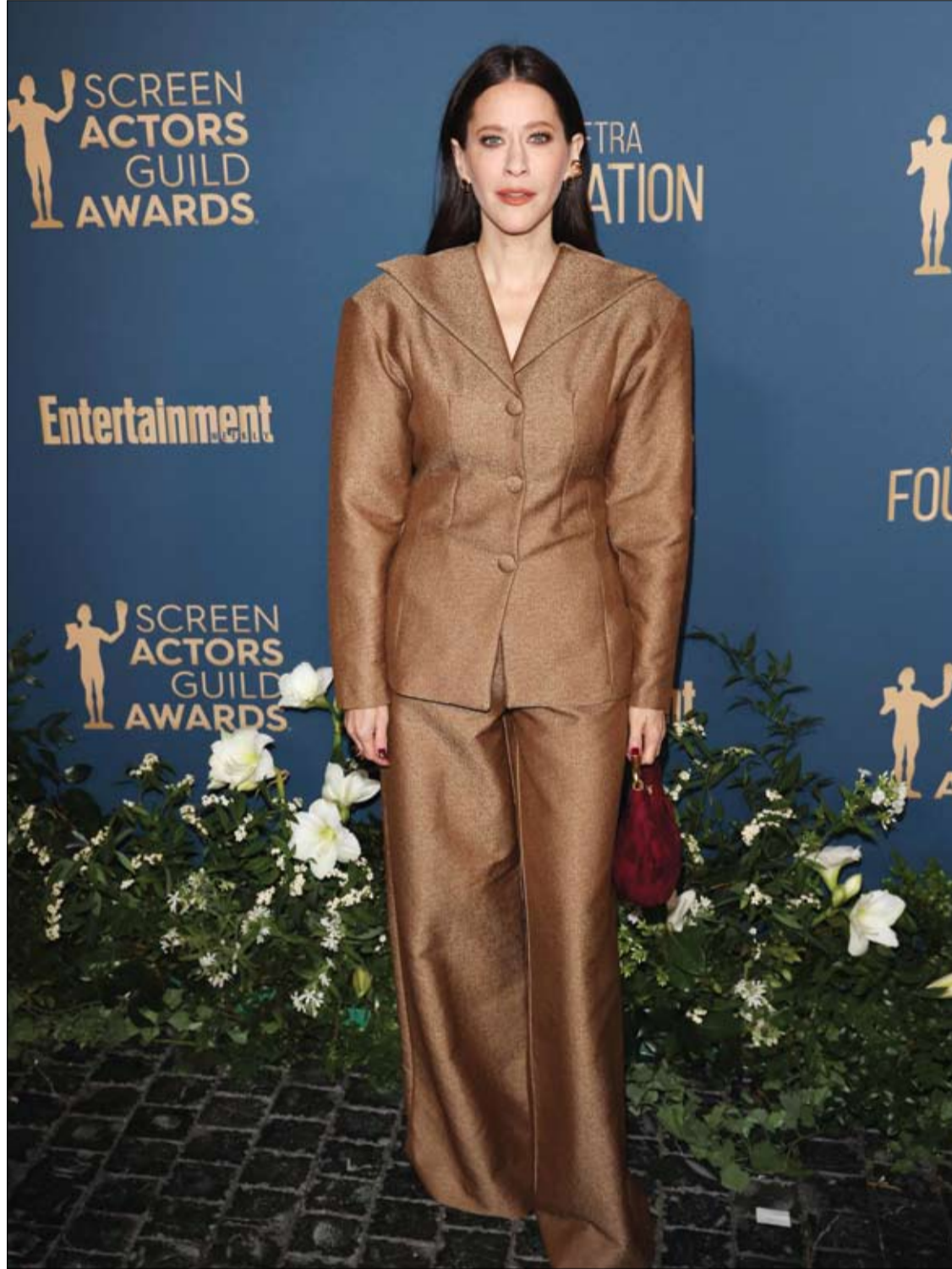
الممثلة الأمريكية جاكى توهن لدى حضورها حفل توزيع جوائز نقابة ممثلي الشاشة (SAG Awards) في لوس أنجلوس. (ا ف ب)

زعمت دراسة برازيلية أن تمارين محددة تتطلب مرونة جسدية قد تكشف مخاطر الوفاة لدى الأشخاص في غضون فترة زمنية محددة. وقام الباحثون بتقييم مرونة أكثر من 3000 شخص في منتصف العمر، باستخدام نظام يسمى Flexindex يبحث في قدرة الأشخاص على التمدد بـ 20 طريقة باستخدام 7 مفاصل مختلفة، بما في ذلك القدرة على لمس أصابع القدمين أو لمس الجزء الخلفي من الكتف الأيسر باليد اليمنى فوق الرأس. وفي أحدث تحليل نُشر في المجلة الاسكندنافية للطب والعلوم في الرياضة، وجد الباحثون أن الأشخاص الذين تتراوح أعمارهم بين 46 و65 عاما ممن حصلوا على درجات Flexindex أعلى، لديهم احتمالات أفضل للبقاء على قيد الحياة في العقد المقبل من حياتهم. وقال الباحثون من عيادة الطب الرياضي، CLINIMEX، في ريو دي جانيرو، إن النساء اللاتي حصلن على درجة Flexindex منخفضة، كان لديهن خطر أعلى بنحو خمسة أضعاف للوفاة. بينما كان الخطر مضاعفا لدى الرجال الذين حصلوا على درجة منخفضة، بمجرد أخذ عوامل مثل العمر والسمنة والظروف الصحية الحالية في الاعتبار. وقال الدكتور كلوديو جيل إس. أراوجو، أحد معدي الورقة البحثية: " ارتبطت اللياقة البدنية والقوة الهوائية والتوازن الجيد بانخفاض معدل الوفيات. تمكنا من إظهار أن انخفاض مرونة الجسم مرتبط أيضا بضعف البقاء على قيد الحياة لدى الرجال والنساء في منتصف العمر".