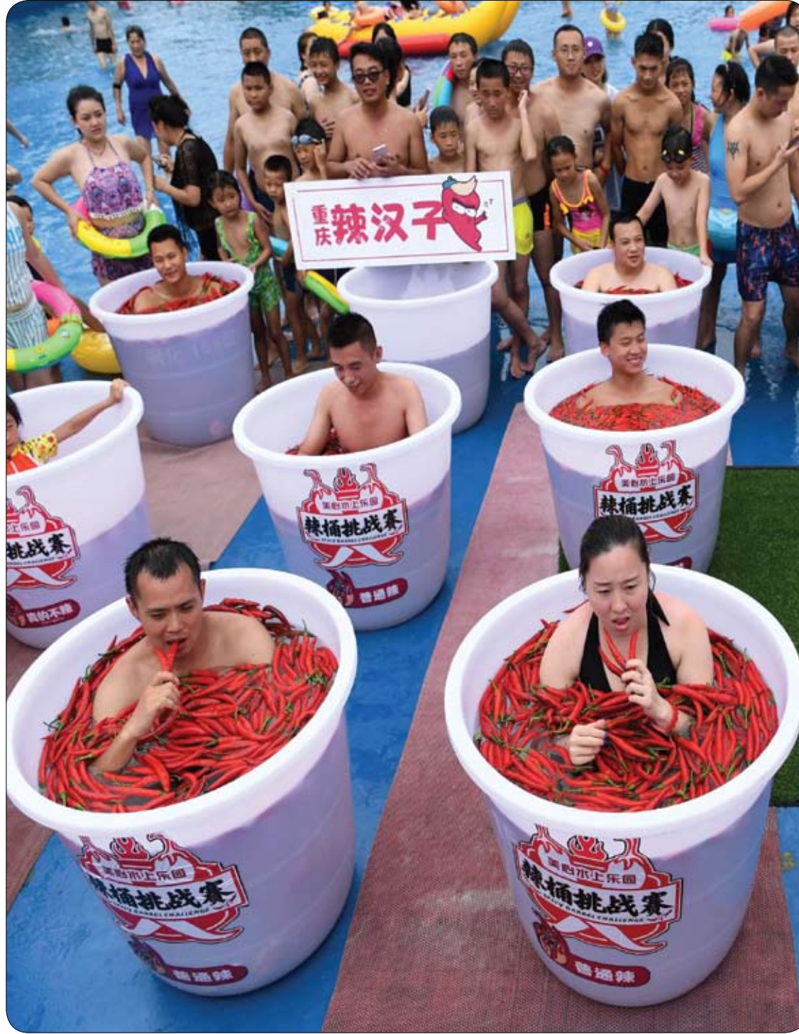
المشاركون يأخذون حماماً في براميل مليئة بالطفل الحار خلال مسابقة Spicy Barrel Challenge داخل منتزه مائي في تشونغتشينغ، الصين.

كشفت علماء بجامعة فيينا، أن الأطفال الذين لديهم إصبع السبابة قصيراً جداً، يميلون أكثر للأنانية وحب التملك والاستحواد. واكتشف العلماء سابقاً أن الأشخاص ذوي سبابة أقصر من البصير، تعرضوا خلال فترة الحمل إلى تأثير هرمون التستوستيرون، بحسب "روسيا اليوم". وأظهرت نتائج الدراسات السابقة، أن الأطفال ذوي السبابة القصيرة جداً يتمتعون بسلوك أكثر عدوانية، لأن تشهد هذه الدراسة الجديدة أن الأطفال ذوي السبابة القصيرة جداً، لا يميلون أيضاً إلى مشاركة أقرانهم بما لديهم من أشياء، ويميلون إلى استعراض أغانيتهم أمام الجميع. وأجرى علماء الجامعة تجربة علمية، شارك فيها 45 طفلاً تتراوح أعمارهم بين 6-9 سنوات، وطُلب منهم مشاركة أطفال آخرين بالملصقات التي بحوزتهم، وقارن الباحثون نتائج هذه التجربة مع مدى تأثر الأطفال بهرمون التستوستيرون في رحم أمهاتهم. وأعلن العلماء أنهم لاحظوا فرقاً كبيراً بين المستويات المنخفضة والمرفعة لهرمون التستوستيرون في رحم الأم، حيث كان الأطفال الذين تأثروا بمستوى عالٍ للهرمون، نادراً ما يتقاسمون ملصقاتهم أو يفعلون ذلك بنوع من الاستياء. وعلق العلماء على ذلك بأن المستوى العالي لهرمون التستوستيرون في فترة الرحم، يؤدي إلى ظهور علامات الذكورة عند البنين والبنات على حد سواء، معتبرين أن ما يحدث سلوكاً استراتيجياً رجائياً بامتياز.