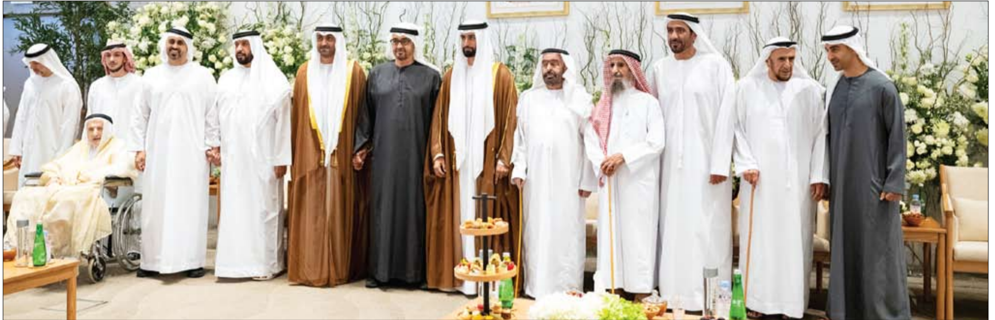
رئيس الدولة خلال حضوره حفل زفاف في أبوظبي