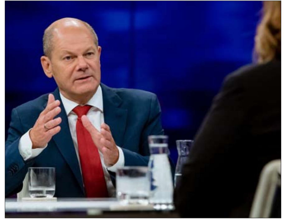
أولاف شولتز مرشح الاشتراكيين الديمقراطيين