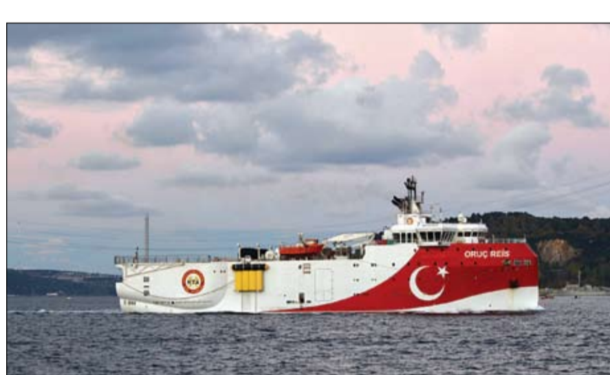
انقرة تتحدى أوروبا وتعيد ارسال السفينة أورتوش ريس الى شرقي المتوسط

سفينة التنقيب خطوة في الاتجاه الصحيح، فيما أعرب أردوغان عن استعداده للقاء رئيس الوزراء اليوناني كيرياكوس ميتسوتاكيس شخصياً أو عبر الاتصال المرئي لمناقشة القضية. وتواصل السفينة التركية يافوز عملها بالتنقيب عن النفط والغاز قبالة سواحل قبرص حتى 12 أكتوبر، على الرغم من الدعوات الدولية المطالبة بسحبها. وأشار النزاع الدائر بين أنقرة وأثينا أزمة استندت دخول دول أعضاء في الاتحاد الأوروبي على الخط، خصوصاً فرنسا التي نشرت سفناً ومقاتلات في المنطقة. ومن المقرر أن يبحث قادة الاتحاد الأوروبي فرض عقوبات على أنقرة في اجتماع سيعقد يومي 24 و25 سبتمبر.