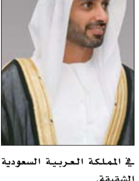
في المملكة العربية السعودية الشقيقة.

الطلاب السعوديين. وتتمثلت العلاقات الثقافية بين البلدين في مستويات عدة، سواء من خلال إقامة العديد من الاتفاقيات والبرامج المشتركة، أو على مستوى التداخل الثقافي بين المؤسسات الجامعة التي تعمل في هذا السبيل والمبدعين والمثقفين في البلدين، وذلك ضمن رؤية تركزت إلى أن العلاقة بين البلدين الشقيقين، تميزها علاقة شعبين لهما امتداد وتاريخ ومرور ثقافي واجتماعي وجغرافي واقتصادي لا يمكن التشكيك فيه.