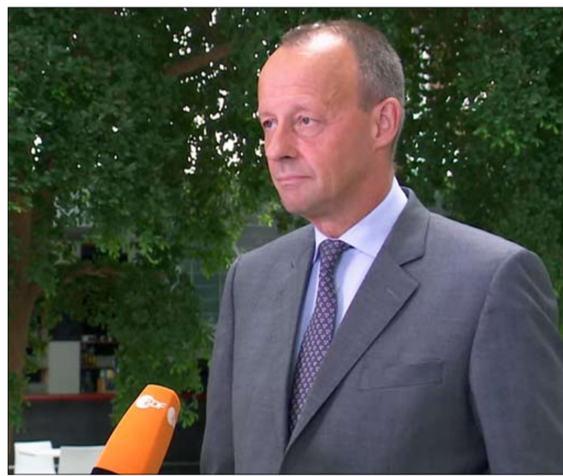
ميرز يحظى بدعم التيار المحافظ