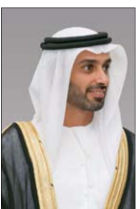
في المملكة العربية السعودية الشقيقة.

تاريخية متينة ورؤية موحدة وإرث غني ونهضة مستمرة بقيادة سواعد وطنية تؤمن برسالة الخير والسلام، وتجمعها قيم سامية وطلعات واحدة في دفع عجلة التطور والنماء. وأكد الشيخ أحمد بن حميد النعيمي ان الإنجازات الإماراتية - السعودية ستواصل على كافة المستويات الاقتصادية والتجارية والثقافية والحضارية، لتضع دعائم متينة لتحقيق الأمن والاستقرار الإقليمي في ظل الدعم اللا محدود من القيادة