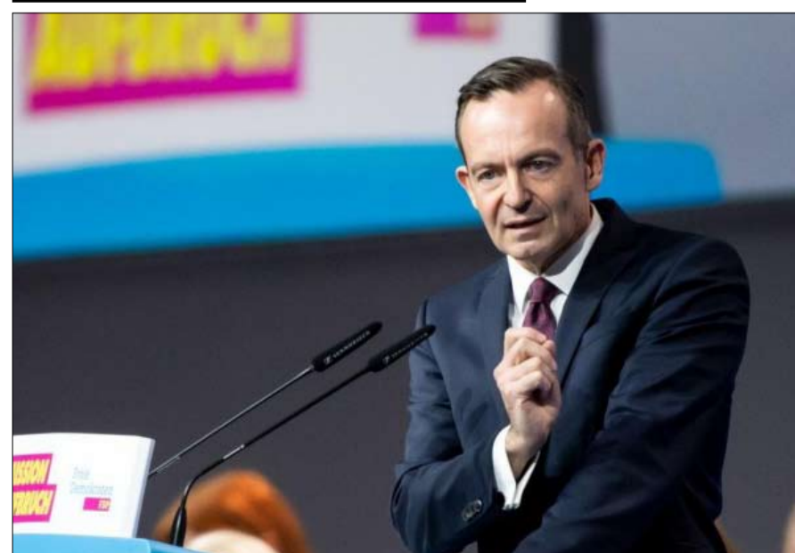
كريستيان ليندنر... الليبراليون يبحثون عن دور