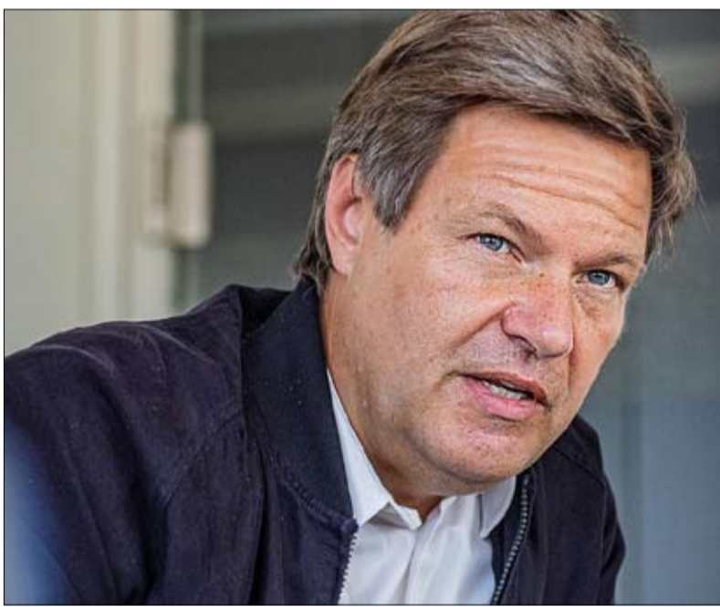
روبرت هابيك... طموحات جديدة للخضر