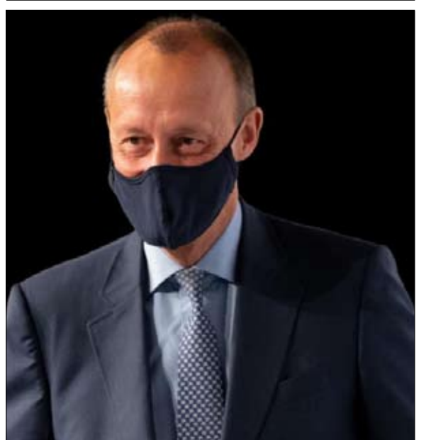
نوربرت روتجن... حظوظ ضعيفة

الشهير في حقبة شرودر / فيشر (عندما، وفقاً للمستشار شرودر، كان الحزب الاشتراكي الديمقراطي هو «الشف» والخضر «النادل»). ولكنه لا يتزدد في القول إننا لا نتنافس على المركز الثاني. ومن الواضح، أن الخضر يعثرون عن طموحات لم يكن أحد ليتخيلها قبل عامين. والمسؤال المطروح في برلين عما إذا كان الخضر مستعدين لذلك - ليحكموا بالناكيد، لكن للمستشارية؟ إذا كان الخضر يهدفون حقاً إلى المركز الأول، فمن حقنا انتظار توضيحات ما زالت مفقودة.