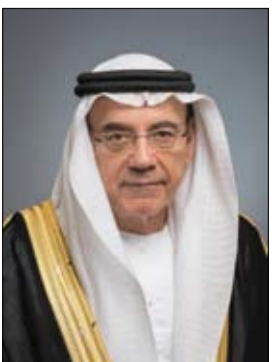
الملكة عزها ورفعتها وازدهارها، وأن يُعَم عليها بالأمن والأمان.

اليوم الوطني الـ 90 للمملكة العربية السعودية الذي يصادف 23 سبتمبر من كل عام- نفتخر في الإمارات بالعلاقات التاريخية الثابتة التي تجمع بين البلدين الشقيقين، والتي تقوم على أرضية صلبة، و رؤية مستقبلية ساهمت في تحقيق منجزات مشتركة خلال العقود الماضية، وتطلع قدماً إلى مواصلة المسيرة تجاه مستقبل مشرق يحمل توحيداً للرؤى والآراء ويرسخ الانسجام