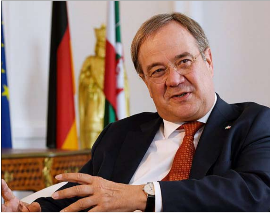
أرمين لاشيت... يحظى بتقدير ولكن...

كرامب-كارينباور، ومن المحتمل أن يصبح مرشحه للمستشارية. الحزب الاشتراكي الديمقراطي، عين مرشحه، نائب المستشارة الحالي أولاف شولتز، لكن لا تعرف مع من سيرغب في تشكيل ائتلاف إذا كانت لديه فرصة حقاً، وهو أمر غير مؤكد.