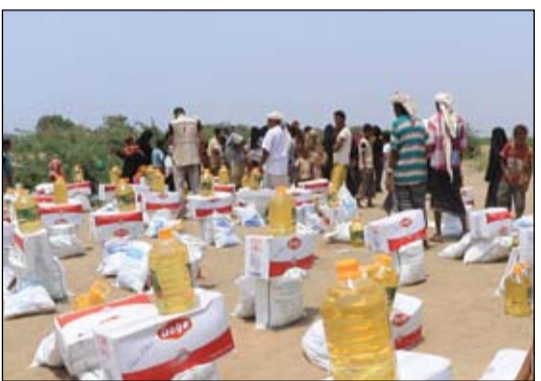
توزيع مساعدات الهلال الأحمر في مخيم العليلي

وأعلن الحمادي عن تسجيل 939 حالة شفاء جديدة، يرتفع معها العدد الإجمالي لحالات التعافي إلى 76.025 فيما لم يتم تسجيل أي حالة وفاة خلال الأربع والعشرين ساعة الماضية، وبناءً على الأرقام المحدثة يبلغ عدد المرضى الذين يتلقون العلاج حالياً في مؤسسات الرعاية الصحية 10.017 مريضاً. (التفاصيل ص4)