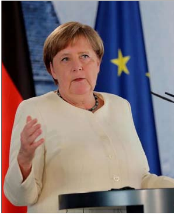
ميركل... دقت ساعة المغادرة