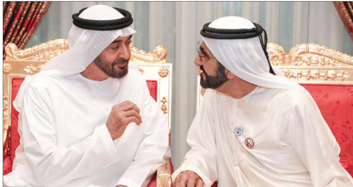
محمد بن راشد خلال استقباله محمد بن زايد