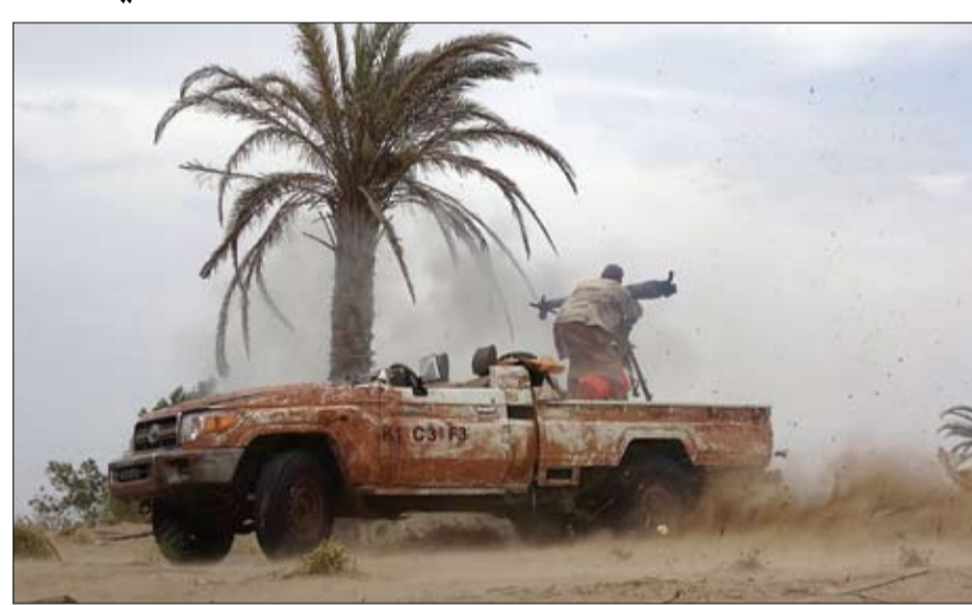
قوات الجيش الوطني اليمني تواصل تقدمها قرب مدينة الحجة في محافظة الحديدة (أ.ف.ب)

موجعة وقاصمة تكبد على إثرها الحوثيون خسائر فادحة في العتاد والأرواح. ولقي 43 عنصراً من ميليشيات الحوثي الموالية لإيران مصرعهم في غارات نوعية لمقاتلات صفوحها. وأسرت قوات المقاومة اليمنية عدداً من مسلحي الميليشيات خلال عمليات تطهير أوكار وجيوب الحوثيين بمنطقة الحاج الأعلى والأسفل في ضربات