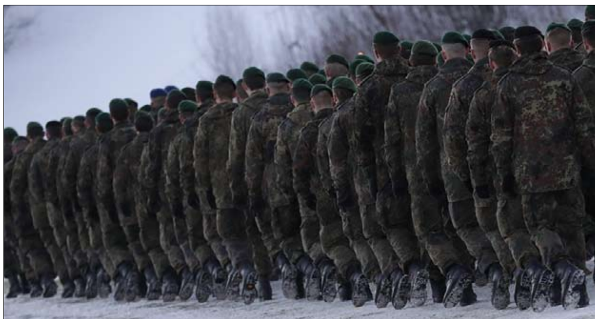
الجيش الألماني المشاركة تحت سلطة البرلمان

إحداث «مجلس أمن أوروبي» تتناوب على عضويته دول الاتحاد