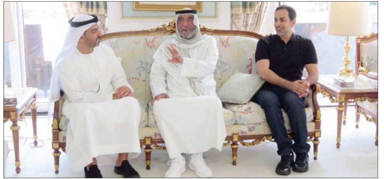
خليفة خلال استقباله حامد وعمر بن زايد ومحمد بن خليفة