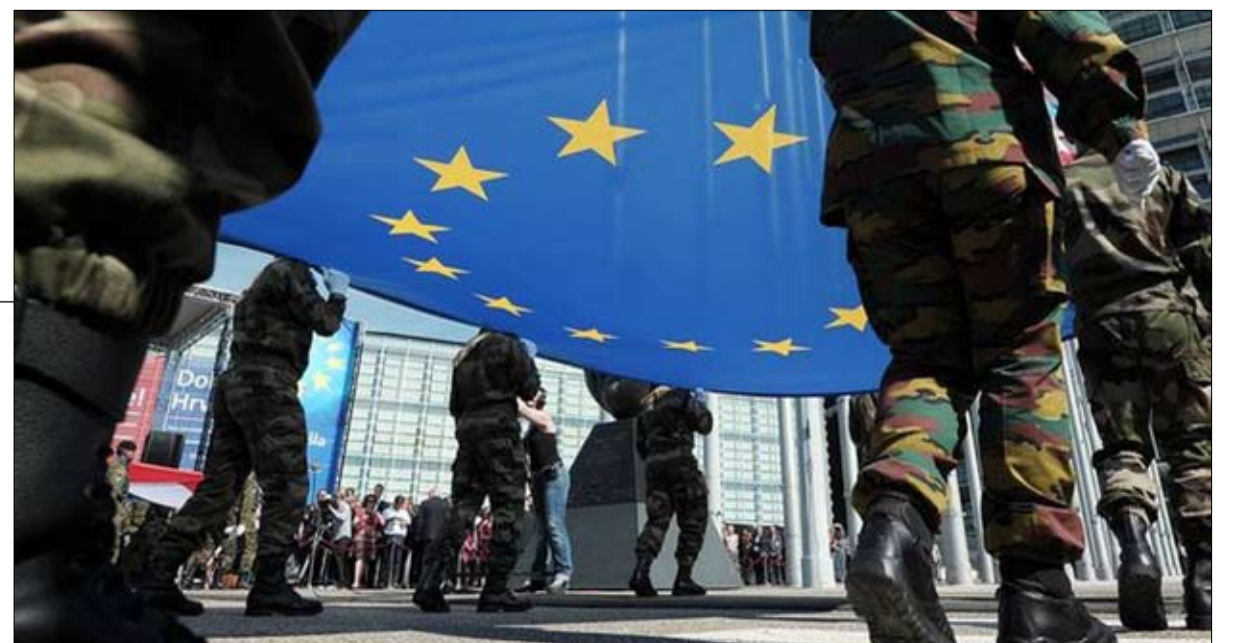
أوروبا الدفاع مشروع حيوي لمستقبل القارة العجوز