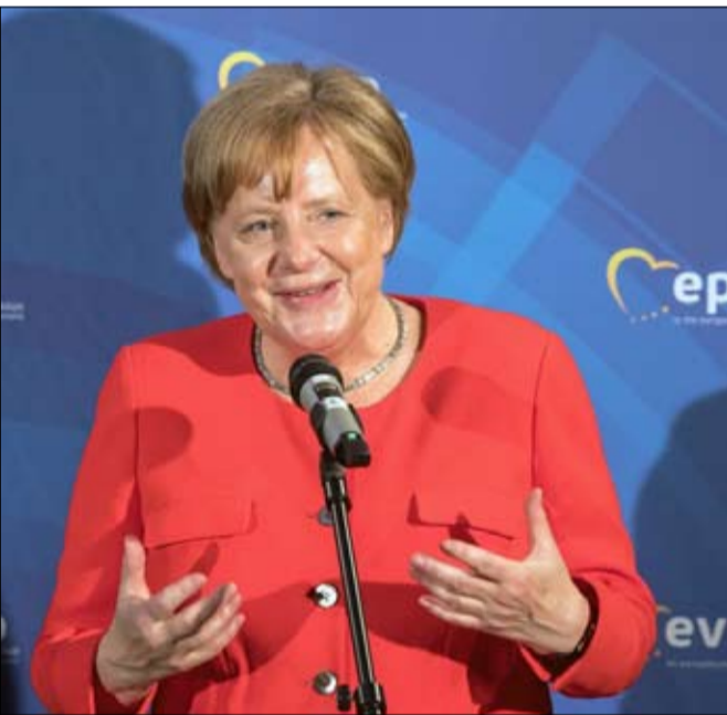
ميركل هذه رؤيتي للحلم الأوروبي

في بناء الدفاع الأوروبي، قد يكون الأصعب هو الاتفاق على خط استراتيجي مشترك. من هم حلفاؤنا؟ من هم الذين يهددوننا؟ ما درجة التهديد والرد المناسب؟ ولا يغيب عن ذهن أحد من أننا لا نستطيع أن نقرر إطلاق النار النووي بـ 27 (الخيار النهائي، يعني) ... لكن، في الحقيقة، إن أخطر تهديد يكمن في الاستيلاء الرقمي على البنية التحتية من قبل قوة أجنبية. وهذا هو الدفاع الأوروبي الذي يجب بناؤه كقاعدة مشتركة حيث أن جدار الصدا مكلف، وأوروبا ليست الأكثر تقدماً في هذا المجال. ... إن هدفي هو أن يعرف العالم أن أوروبا تتصرف بصوت واحد في السياسة الخارجية". تخلص أنجيلا ميركل في هذا الفصل، راسمة دون شك ما ستعتبره إرثها في نهاية عهدها الطويل: ديناوار، المصالحة مع فرنسا.. ولهلموت كول، إعادة الوحدة.. ولغيرهارد شرودر، الإصلاحات والإفلاق الاقتصادي لألمانيا.. ولأنجيلا ميركل، ادماج ألمانيا في أوروبا موحدة في مواجهة تحديات العالم؟