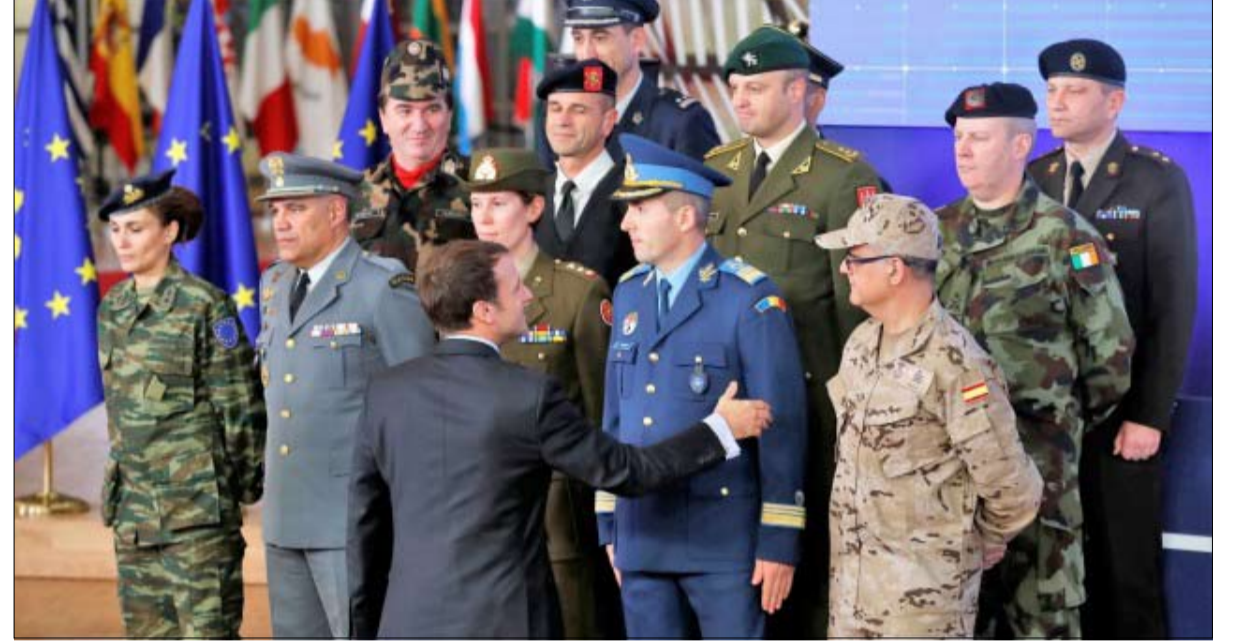
المنظمة الجيوش الأوروبية متنافرة