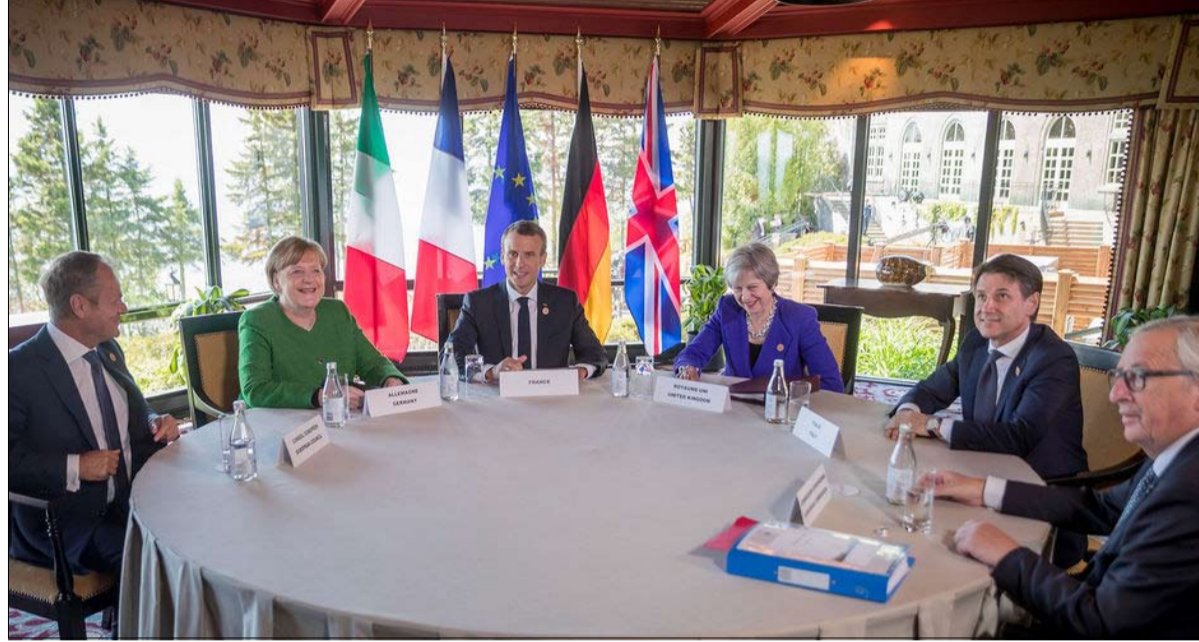
بناء أوروبا قادرة على مواجهة مستجدات العالم