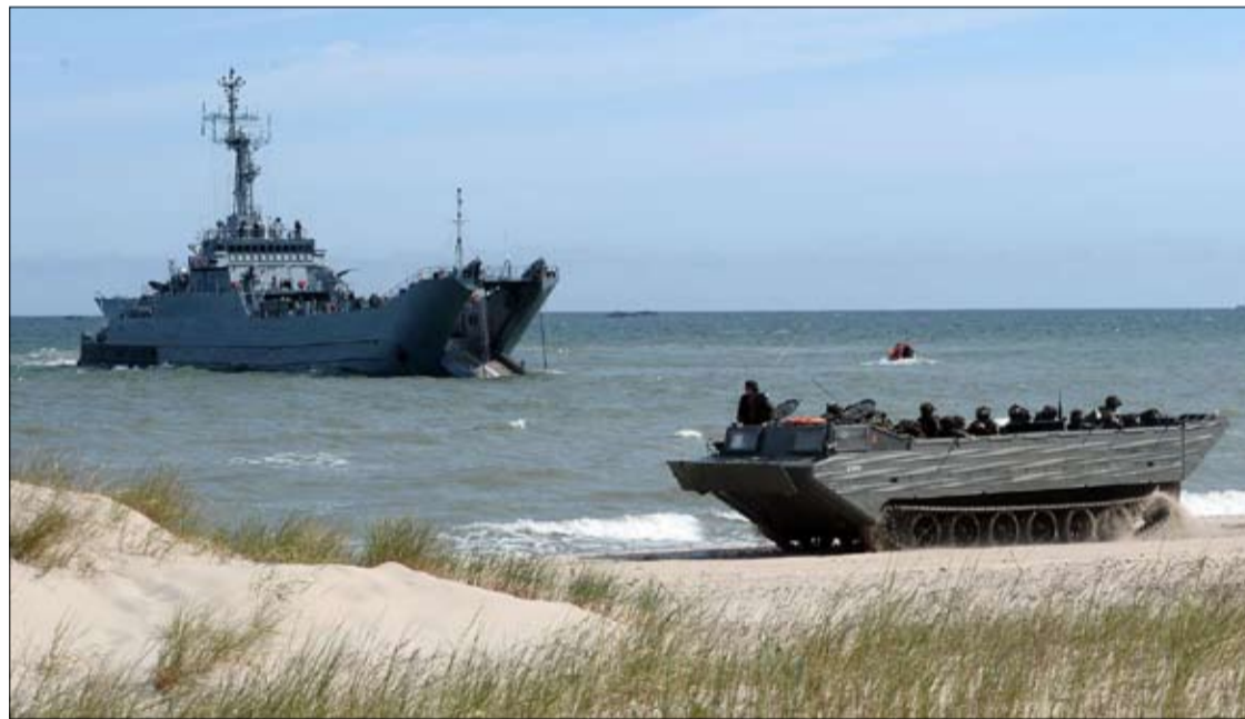
قوة أوروبية خارج الأطلسي هدف بعيد النمال

كما يسمح بند في الدستور الألماني للجيش الألماني بتقديم دعمه