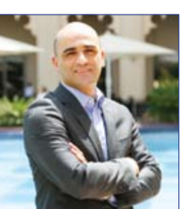
مدير جديد للمبيعات والتسويق لفندق باهي قصر عجمان

ويتمكن الضيوف الخاصة. وأضاف ان فندق شيراتون الخالدية- أبو ظبي يعزز إقامة أفخم عروض الإفطار خلال الأيام المتبقية من شهر رمضان المبارك.