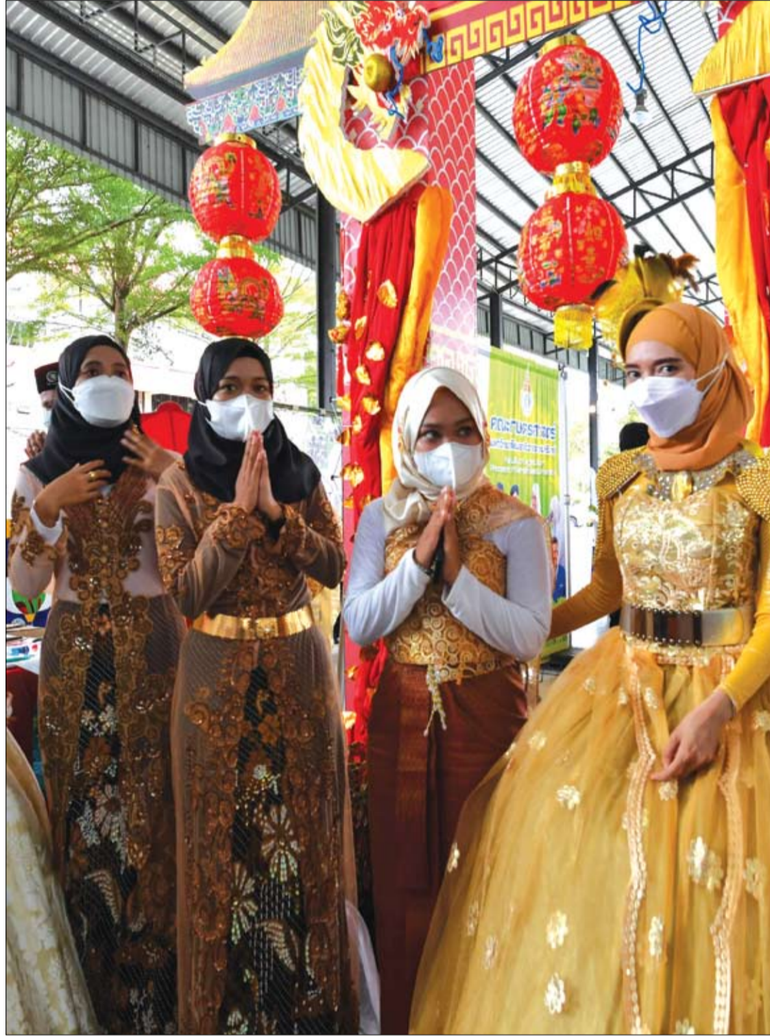
طالبات يرتدين أزياء رسمية أثناء مشاركتهن في احتفالات تأسيس جامعة ناراثيوث راجاناجاريندرا في مقاطعة ناراثيوث جنوب تايواند

وتقول NHS إن الجرعة اليومية الموصى بها هي 10 ميكروغرامات من فيتامين (د) في اليوم. ويمكن تحقيق ذلك عن طريق تناول الكميات الغذائية أو تناول الأطعمة الغنية بهذا الفيتامين، بدءا من الأسماك الزيتية وصفار البيض إلى الأطعمة المدعمة.