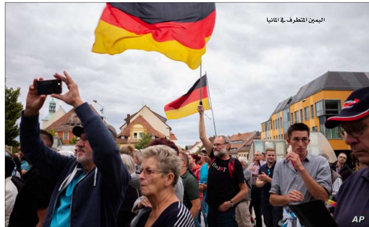
اليمين المتطرف في ألمانيا

بأنها "منظمات غير حكومية يمينية" ويقدم نفسه على أنه "مستشار الشعب"، وهو التعبير الذي استخدمه أدولف هتلر. وفي ألمانيا والنمسا، لم تكن هناك "إعادة تموقع" بل على العكس من ذلك، فإن المشهد السياسي هو الذي تحول نحو اليمين. فقد خاض الحزب الديمقراطي الاشتراكي الألماني حربا ضد الهجرة غير الشرعية، ونأى الديمقراطيون المسيحيون في الاتحاد الديمقراطي المسيحي بأنفسهم عن سنوات حكم ميركل، في حين تبني المحافظون النمساويون قدرا كبيرا من الخطاب المناهض للهجرة الذي يتبناه حزب الحرية النمساوي. في حين أن برامج المحافظين وحزب الحرية النمساوي متقاربة نسبيا ويحكم الحزبان معا في عدة مناطق في النمسا، قبل كل شيء، فإن الصراع المفتوح بين زعيميهما هو الذي يمنع التحالف على المستوى الوطني.