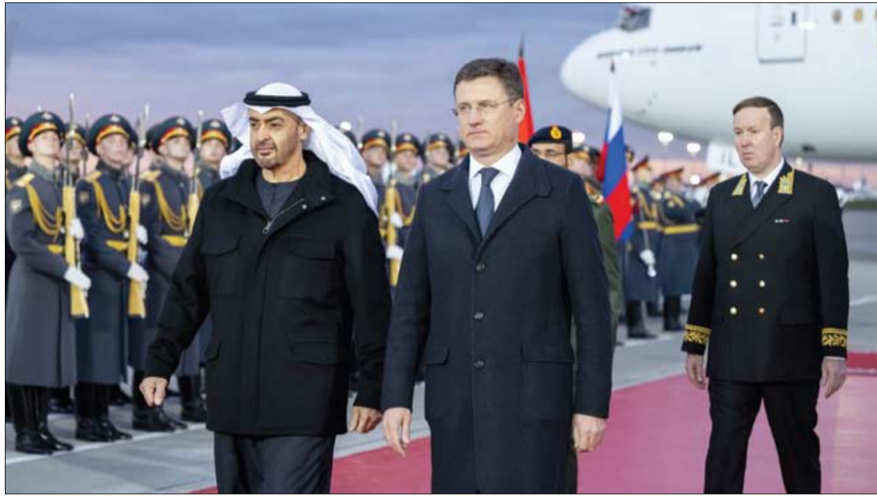
رئيس الدولة لدى وصوله الى موسكو حيث جرت لسموه مراسم استقبال رسمية

تنفيذاً لتوجيهات صاحب السمو الشيخ محمد بن راشد آل مكتوم نائب رئيس الدولة رئيس مجلس الوزراء حاكم دبي، رعاه الله، اعتمد سمو الشيخ حمدان بن محمد بن راشد آل مكتوم، ولي عهد دبي نائب رئيس مجلس الوزراء وزير الدفاع رئيس المجلس التنفيذي لإمارة دبي، رئيس اللجنة العليا للتنمية وشؤون المواطنين في دبي، المخطط الشامل لتطوير مسار سيج السلم الذي يتضمن تطوير خمس محطات خدمية وترفيهية، سيتم تنفيذها بالشراكة مع القطاع الخاص، كما اعتمد سموه حزمة من المشاريع والمبادرات التنموية لتطوير أرياف وبراري دبي، خلال الفترة من 2024 إلى 2028، وتشمل 37 مشروعاً ومبادرة، تقدر تكلفتها بنحو 390 مليون درهم. (التفاصيل ص 6)