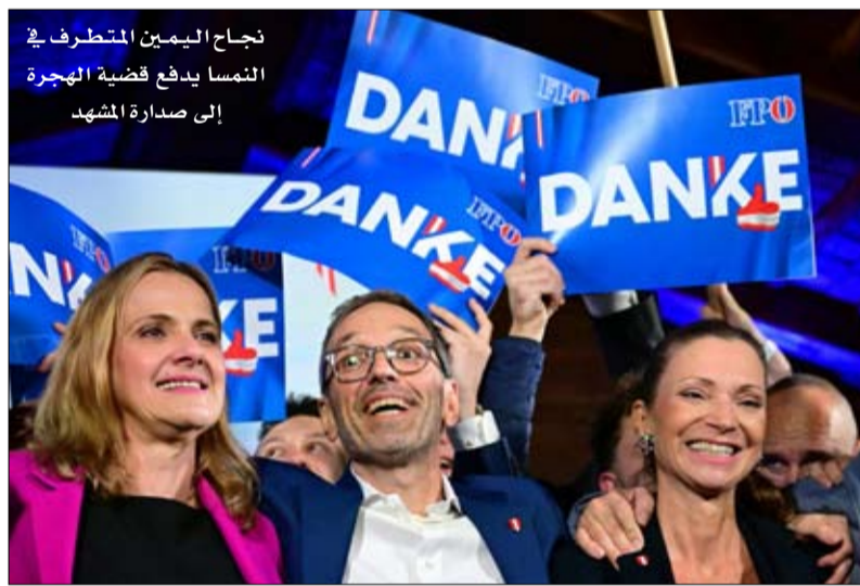
نجاح اليمين المتطرف في النمسا يدفع قضية الهجرة إلى صدارة المشهد

تحت قيادة زعيمه هربرت كيكل، متطرفا. لقد تبني نظريات المؤامرة التي طرحها مناهضو التطعيم، وأدان "شيوعية المناخ" ودعا إلى سياسة "إعادة الهجرة" بالنسبة للنمسا. من محبي التجاوزات اللفظية، يصف زعيم حزب الحرية النمساوي حركات الهوية النمساوية