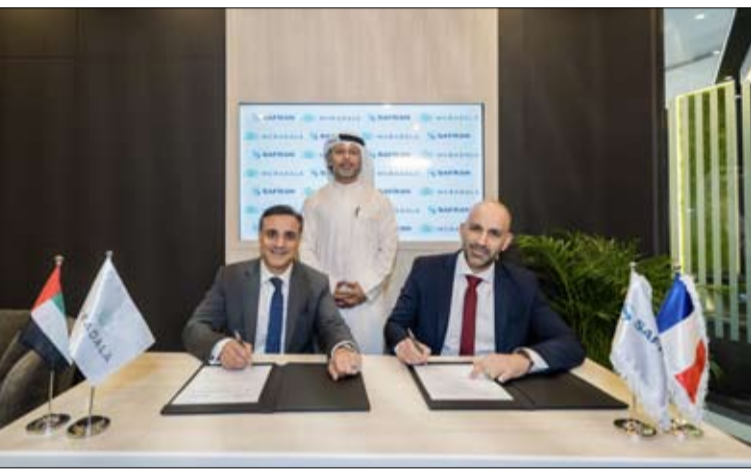
•• أبوظبي - وام

أعلنت شركة مبادلة للاستثمار "مبادلة"، وشركة سافران الفرنسية لصناعات الطيران والدفع، توثيق تعاونهما الإستراتيجي من أجل تسريع الابتكار والتطوير في صناعة الطيران في دولة الإمارات. يأتي تعزيز هذه الاتفاقية الإستراتيجية الإستراتيجية بين الشركتين، التي أعلن عنها في معرض أبوظبي للطيران، للتركيز على عدة مجالات رئيسية تشمل الصيانة، والتصنيع، وتطوير الموارد البشرية، والفضاء، والمواد المتقدمة.