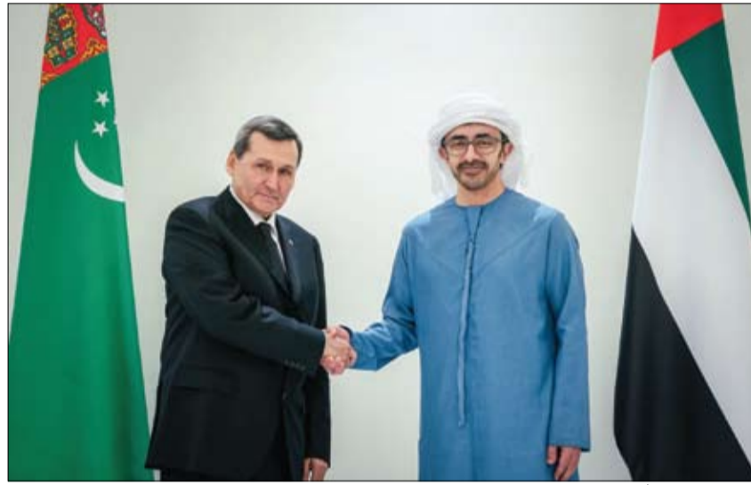
عبد الله بن زايد خلال استقباله رئيس مجلس الوزراء وزير خارجية تركمانستان

أعلنت لجنة تنظيم عيد الاتحاد الـ 53 أن الحفل الرسمي لهذا العام ستقام في مدينة العين. وأوضحت أنه يمكن متابعة الحفل الرسمي مباشرة في مختلف أنحاء الدولة في الثاني من ديسمبر، عبر الموقع الرسمي لعيد الاتحاد الـ 53، وعبر جميع القنوات التلفزيونية المحلية وقناة اليوتيوب الرسمية. ويعرض الحفل على شاشات دور السينما وبعض مناطق الاحتفال المختارة، على أن يتم الإعلان قريباً عن المواقع المحددة التي ستعرض البث في مختلف أنحاء الدولة وقالت عائشة النعيمي، مدير الاتصال في لجنة تنظيم الاحتفال الرسمي لعيد الاتحاد الـ 53، إن مدينة العين تمتلك أهمية تاريخية كبيرة تعود لألاف السنين، حيث تجمع بين جمال الطبيعة وأصالته التراث، ما يعكس التزام دولة الإمارات بمعايير الاستدامة، وبفضل مواقعها الطبيعية ومعالمها التاريخية، تعد المدينة كنزاً وطنياً يعبر عن التراث الإماراتي العريق المتجذر في تاريخ شعبنا والممتد عبر الحضارات. (التفاصيل ص4)