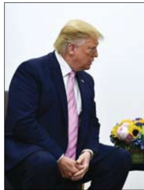
ميركل خلال اجتماعها مع ترامب في أوساكا 2019.

عند مغادرتها واشنطن، خلصت المستشارة إلى أن التعاون من أجل عالم مترابط لن يكون ممكناً في عهد ترامب معربة عن اقتناعها بأن نجاحه يعتمد على فشل الآخرين. وكتبت: كان يرى كل شيء من منظور المظور العقاري، وهي مهنته قبل دخول عالم السياسة. وأضافت: لا يمكن بيع كل قطعة أرض إلا مرة واحدة، وإذا لم يحصل عليها هو فإن شخصاً آخر سيحصل عليها. هكذا يرى العالم. وكتبت ميركل أنها عندما سألت اليابا فرنسيس النصيحة للتعامل مع أشخاص لديهم وجهات نظر مختلفة تماماً، أدرك على الفور أنها تتحدث عن ترامب وقال لها «شدي، شدي، شدي» ولكن لا تتعلمي..