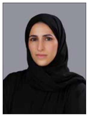
•• أبوظبي - الفجر

أعلن صندوق خليفة لتطوير المشاريع عن مشاركته في معرض أبوظبي الدولي للقوارب 2024، الذي سيعقد في الفترة من 21 إلى 24 نوفمبر في قاعة المارينا بمركز أبوظبي الوطني للمعارض (أدنيك). يُقام هذا الحدث تحت رعاية سمو الشيخ حمدان بن زايد آل نهيان، ممثل الحاكم في منطقة الظفرة، ويُعتبر أكبر حدث بحري في المنطقة، حيث يجمع نخبة الشركات العالمية في مجالات التقنيات البحرية، والحيوات الفاخرة، والرياضات المائية، وسيضم المعرض مشاركات من 26 دولة حول العالم، مما يجعله منصة رائدة لاستكشاف أحدث الابتكارات في هذا القطاع. في هذه النسخة من المعرض، سيدعم صندوق خليفة سبعة مشاريع إماراتية رائدة، تشمل: بيرثينج لإدارة وتشغيل مواقف