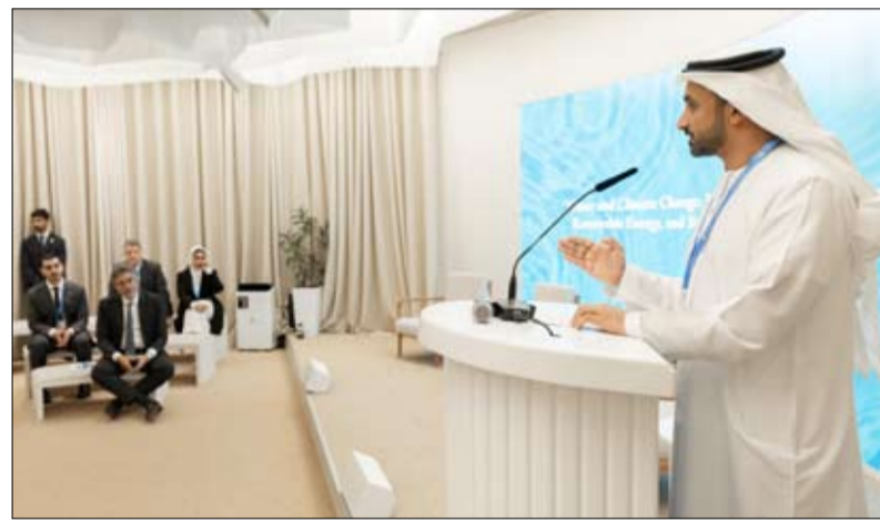
•• باكو - وام

وتستفيد هذه الشراكة الموسعة من أصول مبادلة في مجال الطيران، بما في ذلك شركتي "ستراتا" للتصنيع و"سند"، وتدمج معها خبرة سافران لإعادة تشكيل مشهد صناعة الطيران في الدولة. وتساهم الشراكة في توسيع قدرات وإمكانات "سند" بشكل كبير، كما تفتح الأبواب أمام شركات جديدة عبر محفظة سافران المتنوعة في مجال الطيران. وتهدف الشراكة إلى تعزيز نقاط القوة الحالية لشركة ستراتا في مجال تصنيع هياكل الطائرات لتشمل تصنيع مكونات المحركات التي تكمل محفظة مبادلة الواسعة في مجال صناعة الطيران. وتعطي الأولوية لرعاية المواهب المحلية من خلال فرص التدريب التعاوني للمهندسين الإماراتيين والمتخصصين في مجال الطيران. ونظراً لكون الفضاء مجال تركيز رئيس لشركة مبادلة، فإن الشراكة ستتيح فرصاً في