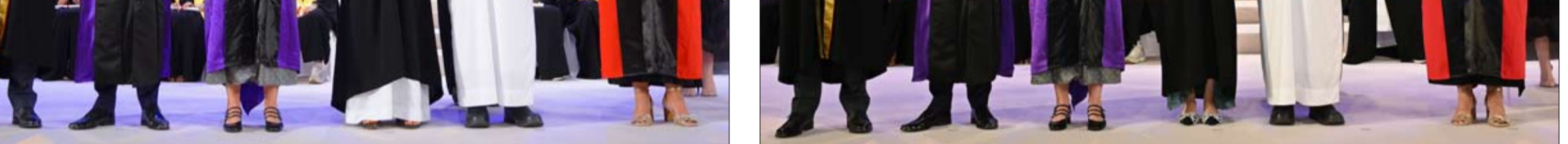
تحت رعاية ريم بنت إبراهيم الهاشمي