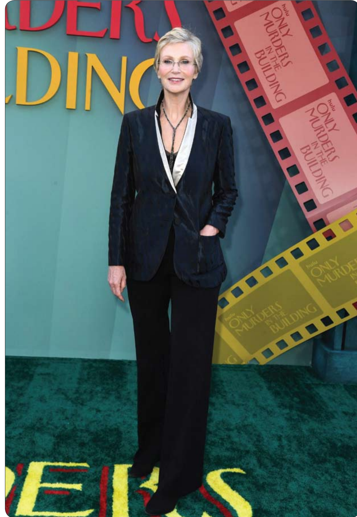
الممثلة الأمريكية جين لينش لدى حضورها العرض الأول للموسم الرابع من مسلسل Only Murders in the Building في لوس أنجلوس.

وقالت بريجيت كروز منظمة المزاد: "يوجد بهذا المزاد بالتحديد بعض القطع القوية للغاية".