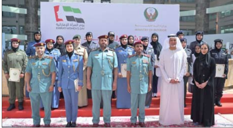
أكاديمية فاطمة بنت مبارك للرياضة والارتقاء بمستوى الصحة واللياقة البدنية لدى المرأة، وتطبيق أفضل المعايير والممارسات على المستوى المحلي والدولي والإقليمي في مجالات الرياضة، وخلق نمط حياة صحي

أكدت سعادة نورة السويدي، الأمينة العامة للاتحاد النسائي العام، أن المرأة الإماراتية حظيت بتقدير القيادة الرشيدة ودعمها المتواصل منذ قيام اتحاد دولة الإمارات، وهو ترجمة عملية للرؤية التي سارت عليها الدولة بدعم من المغفور له الشيخ زايد بن سلطان آل نهيان “طيب الله ثراه“، ويواصل صاحب السمو الشيخ محمد بن زايد آل نهيان رئيس الدولة “حفظه الله“، دعم تلك المسيرة التي ساهمت في تعزيز دور المرأة في جميع المجالات والقطاعات. وقالت سعادتها، في كلمة لها بمناسبة يوم المرأة الإماراتية، الذي يأتي هذا العام تحت شعار “نتشارك للغد“: “لا يسعنا في هذا المقام إلا أن نتوجه بالشكر والتقدير إلى سمو الشقيقة فاطمة بنت مبارك