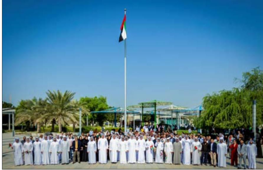
إليه خلال مؤتمر الأطراف COP28. وذلك تماشياً مع اتفاق الإمارات التاريخي الذي تم التوصل

الدولة رئيس مجلس الوزراء حاكم دبي، رعاه الله، وإخوانهما أصحاب السمو أعضاء المجلس الأعلى للاتحاد حكام الإمارات، مواصلي السير على نهج الأب المؤسس الشيخ زايد بن سلطان آل نهيان، طيب الله ثراه، الذي أرسى ركائز دولة الاتحاد وغرس قيم العطاء والانتماء والإخلاص للوطن". وأكد الرمحي أن يوم العلم يمثل مناسبة وطنية للاحتفاء بما حققته وتحققه دولة الإمارات من إنجازات بارزة في شتى المجالات، لاسيما التزامها بتعزيز التعاون الدولي في مجال المناخ وريادتها