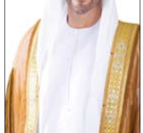
وتعالى أن يحفظ الإمارات وشعبها وأن يعيد هذه المناسبة عليها بمزيد من الإنجازات وتحقيق الطموحات.

وقرر لنا جميعاً، مضيئاً سموه "في هذا اليوم يستذكر الجميع الأيدي البيضاء لمؤسس الدولة المغفور له الشيخ زايد بن سلطان آل نهيان "طيب الله ثراه" الذي أرسى معاني التوحد والتلاحم بين أبناء الإمارات تحت راية علم الدولة". ورفع سمو الشيخ نهيان بن زايد آل نهيان أسمى آيات التهنية بهذه المناسبة الوطنية إلى صاحب السمو الشيخ محمد بن زايد آل نهيان الخبير والعطاء من خلال المساعدات الإماراتية الإنسانية التي تجوب الدول والمجتمعات حول العالم. وقال سموه - في كلمة بمناسبة يوم العلم - "إن هذه المناسبة الغالية على قلوبنا تحمل في طياتها تاريخ وطن غالي، وتبعث في نفوسنا معاني الفخر والاعتزاز، وتجسد قيم التلاحم والتعاقد خلف قيادة دولة الإمارات، لتبقى راية دولتنا الحبيبة خفاقة وشامخة بين الأمم ومصعد عز