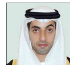
بهذه المناسبة: "في هذا اليوم نجدد عهدنا وولاءنا لوطننا وقيادتنا في العالم. وقال سموه في كلمة له

الرشيدة، ولعلم بلادنا الذي يمثل رمز الكرامة والعزة والوحدة الوطنية، وهو مناسبة وطنية يختر بها الجميع على امتداد الوطن وفرصة للتعبير عن مشاعر الحب والوفاء الذي يكنه شعب دولة الإمارات العربية المتحدة لوطنه ولقائد مسيرتها صاحب السمو الشيخ محمد بن زايد آل نهيان رئيس الدولة "حفظه الله"، ونسال الله عز وجل أن يديم علينا الأمان والاستقرار والتقدم والازدهار تحت ظل علم الإمارات الشامخ، وكل عام وعلى الإمارات بخير وتقدم وازدهار".