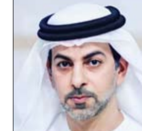
للوحدة والقوة، ويعكس الإنجازات الشريفة التي حققتها الدولة على

مدار السنوات الماضية، حتى أصبحت منارة للتقدم والازدهار والتعايش والسلام. وأضاف سموه: "في هذه المناسبة الغالية نجدد الولاء للقيادة الرشيدة، من أجل استكمال مسيرة التنمية الشاملة بقيادة صاحب السمو الشيخ محمد بن زايد آل نهيان، رئيس الدولة، حفظه الله، إلى أرفع المراتب؛ إذ أصبحت الإمارات بفضل رؤيته الاستثنائية وقيادته الحكيمة في مصاف الدول المتقدمة، ووجهة لكل من يبحث عن الرقي الحضاري والتقدم الاقتصادي.