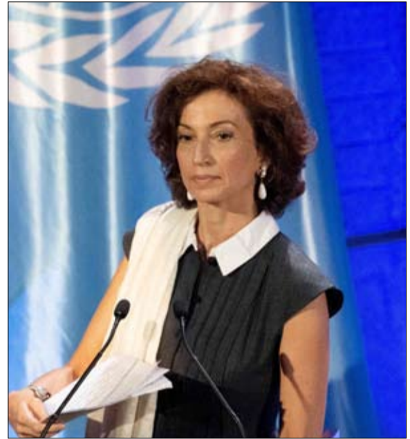
المديرة العامة لليونسكو أودري أزولاي تعلن تلقي طلب الولايات المتحدة بالعودة إلى المؤسسة

•• بيوتر سمولار x ترجمة: خيرة الشيباني عن صحيفة ”لوموند“ الفرنسية كانت اللحظة منتظرة منذ فترة طويلة. لحظة تمثل تتويجا للعمل الدبلوماسي الشاق وراء الكواليس والمفاوضات المعقدة في واشنطن نفسها. يوم الاثنين 12 يونيو في باريس، أعلنت أودري أزولاي، المديرة العامة لمنظمة الأمم المتحدة للتربية والعلم والثقافة، اليونسكو، أعضاءها أن الولايات المتحدة مستعدة للعودة إلى صفوفهم، بعد ست سنوات من الانسحاب الذي قرره دونالد ترامب. في رسالة موقعة من قبل مساعد وزير الخارجية ريتشارد فيرما، والتي علمت بها لوموند، أعلنت إدارة بايدن نيتها تقديم خطة لإعادة قبولها، خلال جلسة خاصة للمؤتمر العام للمنظمة.