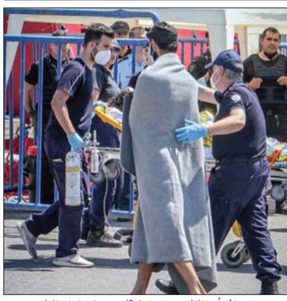
مسعف يرافق أحد الناجين، بعد غرق قارب يحمل عشرات المهاجرين

وقال بوتين إن العقود ضرورية للسماح لجميع المشاركين في الحملة الروسية في أوكرانيا بتلقي مستحقاتهم من مدفوعات الدعم الاجتماعي. وتشمل هذه المستحقات تعويضات للمقاتلين في حالة الإصابة ولعائلاتهم إذا قتلوا أثناء المعارك. ودخل بريجوجن في عداة علني شديد مع وزير الدفاع سيرجي شويغو وكبار قادة الجيش منذ العام الماضي، واتهمهم بالإخفاق في تقديم الدعم الكافي والذخيرة لقوات فاغنر في أوكرانيا، مما تسبب في تكديها خسائر أكبر. لكنه قال في تصريحات الأربعاء إنه يعتقد أنه سيتم إيجاد حل وسط بين بوتين والبرلمان لتمكين مقاتلي فاغنر من الحصول على ضمانات اجتماعية ووضع معتمد كمقاتلين. هذا وأكد فيجنري بريجوجن رئيس مجموعة فاغنر العسكرية الروسية الخاصة مجدداً الأربعاء رفض مقاتلي المجموعة توقيع عقود مع وزارة الدفاع، بعد يوم من إعلان الرئيس الروسي فلاديمير بوتين أن الاتفاقات ضرورية. وفي إظهار مباشر نادر للتحدي للرئيس الروسي، قال بريجوجن ليس هناك أحد بين مقاتلي فاغنر مستعد للالتحاق في طريق العار مرة أخرى. ولهذا لن يوقعوا العقود. وفي اجتماع نقله التلفزيون أيد بوتين دعوة من وزارة الدفاع للمقاتلين المتطوعين في أوكرانيا لتوقيع عقود مع القيادة العسكرية بالبلاد، ما يُنظر إليه على نطاق واسع على أنه وسيلة لتأكيد السيطرة على فاغنر.