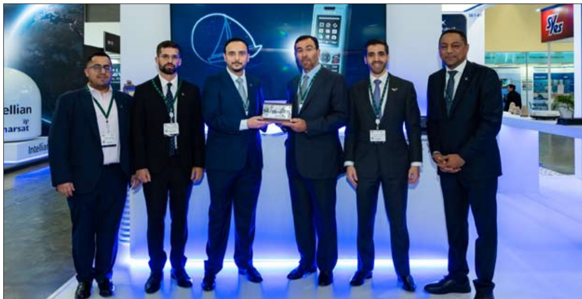
يساندتنا في مساعيها لتحقيق النمو الاستراتيجي، تجدر الإشارة إلى أن "أسبوع