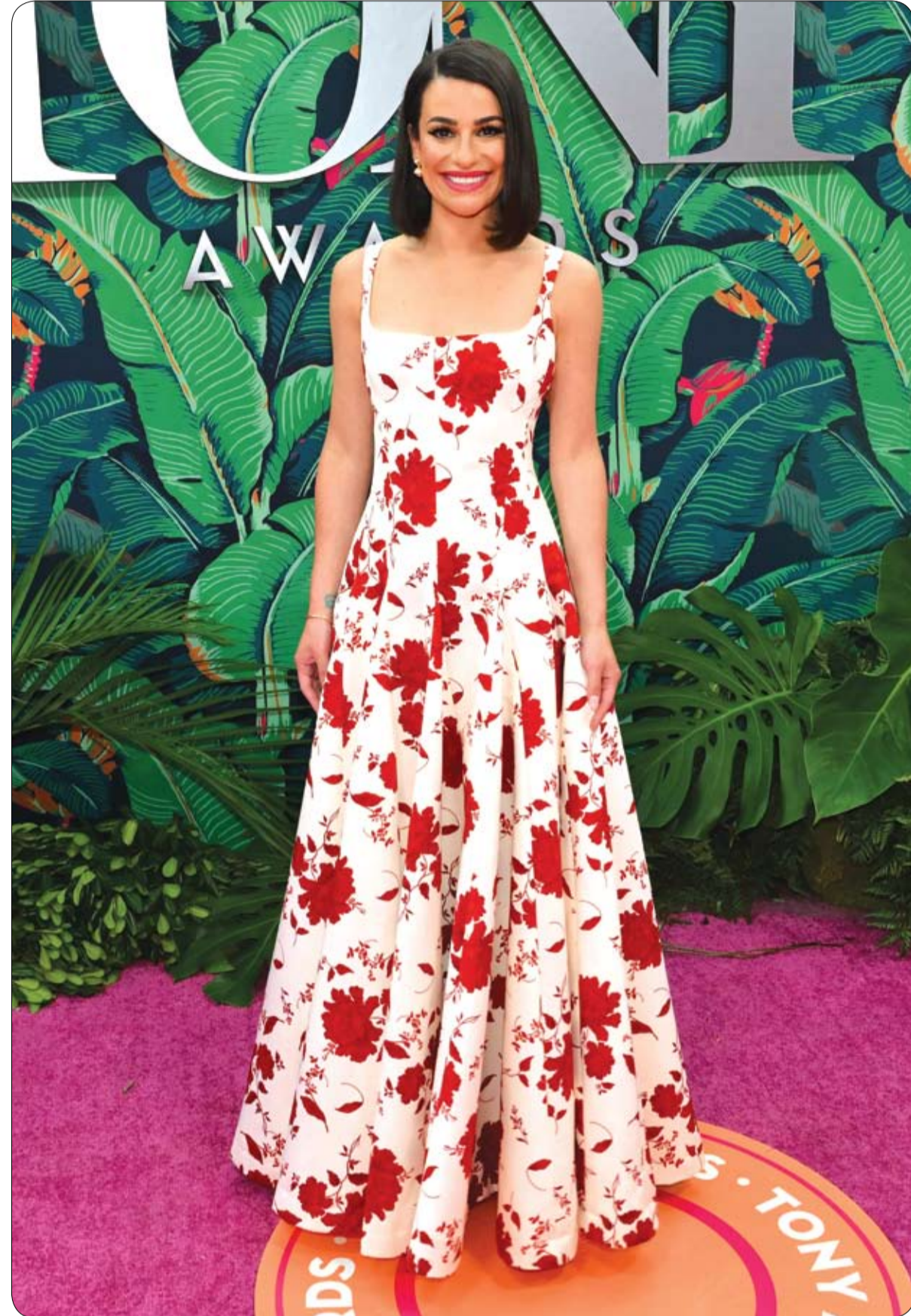
ليا ميشيل خلال حضورها حفل توزيع جوائز توني الستوي السادس والسبعين في نيويورك.

حين يسمع الناس طبق طائر، فإن ما يخطر بالباهم مباشرة هو المركبات الدائرية المرتبطة بالخيال العلمي والكائنات الفضائية المثيرة للفضول والجدل، لكن مدينة صينية شهدت تحليق أول طبق طائر فعلي، في يونيو الجاري. وأظهر مقطع فيديو، الطبق الطائر وهو يرتفع بشكل عمودي في مدينة شنزن الصينية، ثم بدأ يتحرك فوق بحيرة، في حين كان الشخص الذي يتولى القيادة يلوح بيديه. وبحسب صحيفة "ديلي ميل"، فإن الطبق الطائر الذي جرى تطويره في الصين يبدو شبيها بالأشكال المتداولة للمركبة في أفلام الخيال العلمي، فهو دائري الشكل، وتتوسطه كبسولة زجاجية في الوسط. ومن مزايها المركبة التي تعمل بالطاقة الكهربائية أنها تعلق بشكل سلس، كما أنها تستطيع أن تهبط على الأرض والماء على حد سواء.