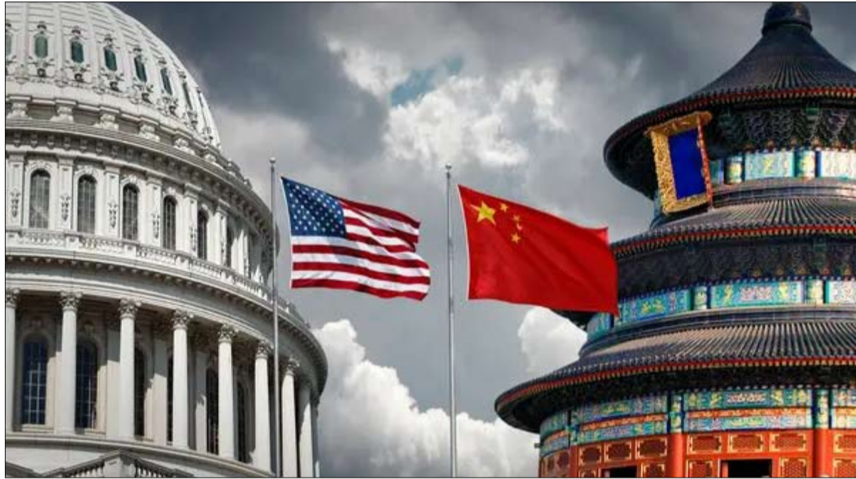
الصين لن تعارض عودة أمريكا إلى اليونسكو

المال السياسي في هذه العودة، بطريقة من الحزبين بحيث لا يجب ان لا تقتصر على عامين فقط. ولكن من الواضح أنه سيكون من الضروري تقديم الحجج مرة أخرى، لتمديد الحكم ” كما تؤكد أودري أزولاي. لقد شهدت العلاقات بين الولايات المتحدة ومنظمة اليونسكو العديد من الاضطرابات. على الرغم من دورها الرائد في تأسيسها عام 1946، فقد انسحبت الولايات المتحدة منها لأول مرة عام 1984. كانت إدارة ريغان قد نددت في ذلك الوقت بـ ”التسييس“ المستمر و”العداء المستشري“ ضد المبادئ الأساسية مثل حرية الصحافة. كان لا بد من الانتظار ششرين عاما وبداية ولاية ليجورج ديليو بوش ليشهد عودة واشنطن. كان الدافع في ذلك الوقت هو تحسين الصورة الأمريكية في العالم وحشد الدعم للحرب في أفغانستان وقبل ذلك مباشرة في العراق.