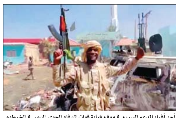
أحد أفراد الدعم السريع في موقع قيادة قوات الدفاع الجوي المدمر في الخرطوم

أعلن مكتب الأمم المتحدة لتنسيق الشؤون الإنسانية، أن ما يقرب من مليوني شخص فروا من السودان، منذ اندلاع الاشتباكات الأخيرة هناك. وبحسب التقرير فر نصف مليون من النازحين إلى دول مجاورة، وإلى جانب العاصمة الخرطوم، تضررت منطقة دارفور غربي البلاد بشدة جراء العنف الشديد. وأعلن حاكم دارفور المنطقة كمنطقة كارثة بعد القتال والنهب المستمرين. ومن جانبها أعلنت نقابة الأطباء السودانية، أمس الأربعاء، ارتفاع حصيلة الضحايا بين المدنيين جراء الاشتباكات الجارية بين الجيش وقوات الدعم السريع، إلى 958 حالة وفاة و4746 مصاباً. وقالت النقابة في بيان نشرته عبر صفحتها على موقع فيسبوك: ارتفع عدد الوفيات بين المدنيين منذ بداية الاشتباكات إلى 958 حالة وفاة، و4746 حالة إصابة. فيما قال المتحدث باسم الأمين العام للأمم المتحدة إن أنطونيو جوتيريش يشعر بالقلق إزاء التقارير التي تتحدث عن عنف واسع النطاق في أنحاء دارفور بالسودان، وأضاف أنه يدعو الطرفين المتحاربين إلى وقف طويل الأمد للأعمال القتالية.