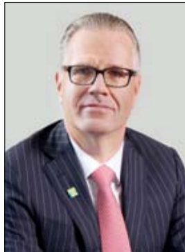
•• دبي-دمحمود علياء

أعلن بنك دبي التجاري، أحد البنوك الوطنية الرائدة في دولة الإمارات العربية المتحدة، عن الإصدار الناجح لأول إصداراته من السندات الخضراء، حيث تم جمع مبلغ 500 مليون دولار أمريكي لهذه السندات، ما يمثل علامة فارقة في التزام البنك بالتمويل المستدام خلال عام الاستدامة. تم تسعير السندات بأجل خمس سنوات، والتي يبلغ معدل فائدتها الناتج 5.319%، بسعر 140 نقطة أساس فوق نسبة عائدات الخزينة، وقد شهد الإصدار إقبالاً كبيراً من المستثمرين خاصة بعد العروض الترويجية