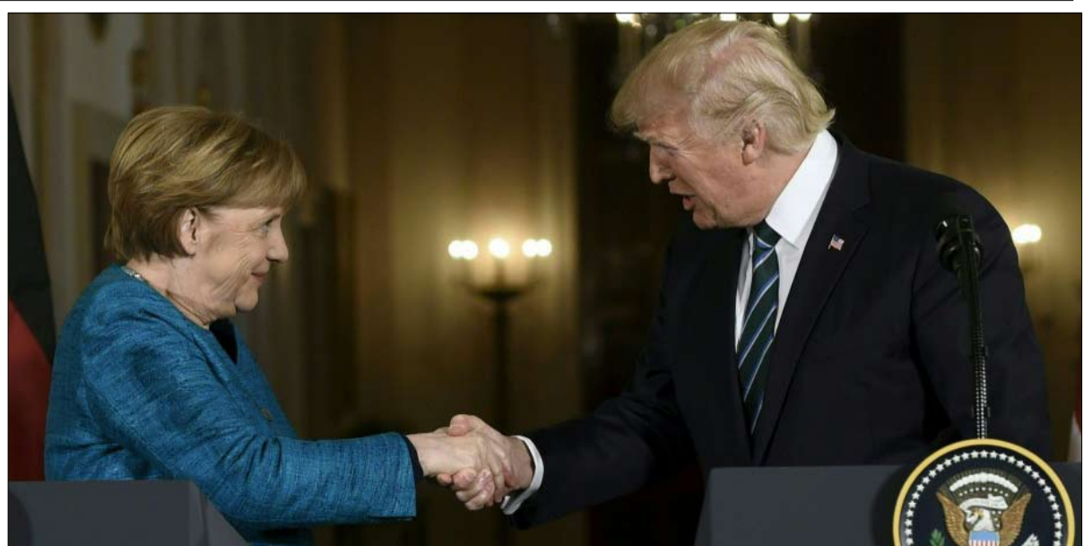
اوربوا والمانيا تحديدا في مرمى القناص ترامب