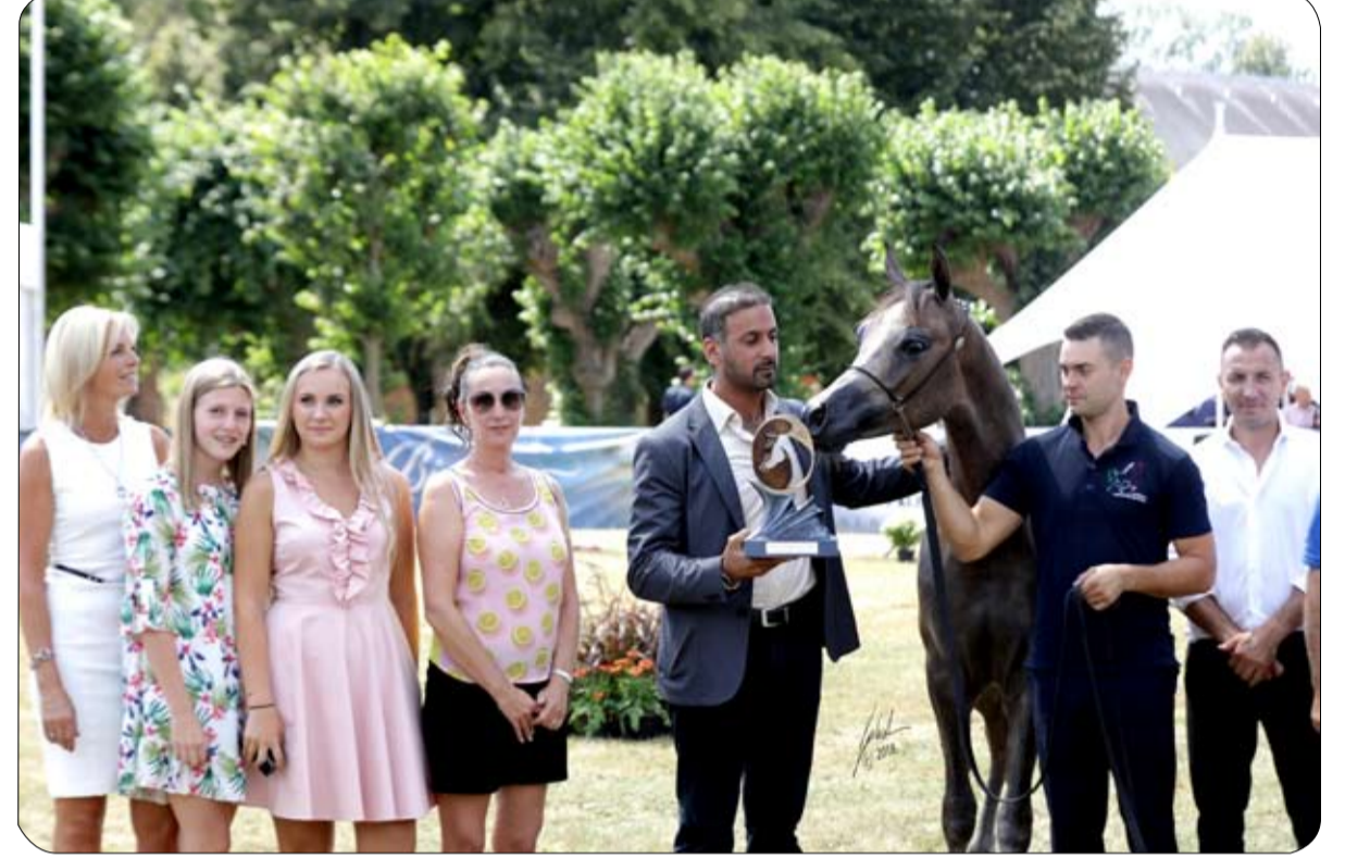
أمهار مربط دبي تتألق في أول أيام كأس إيلران الدولية