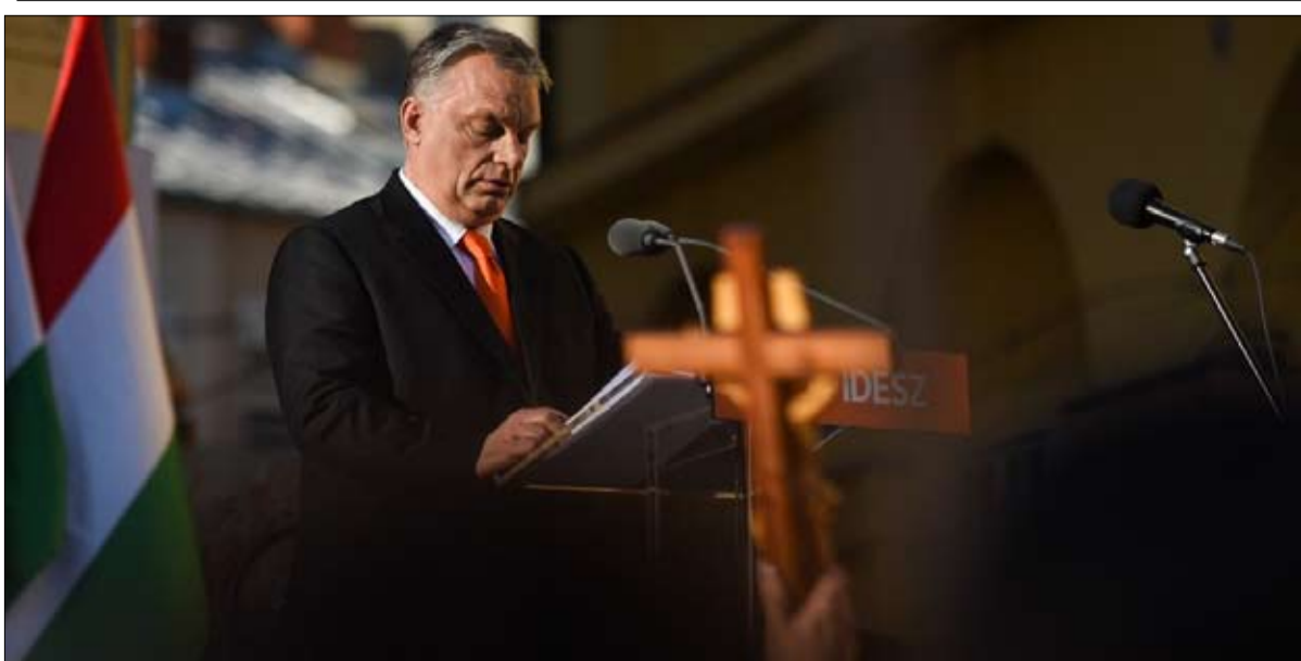
انظمة اوروبا الشرقية تستهوي ترامب