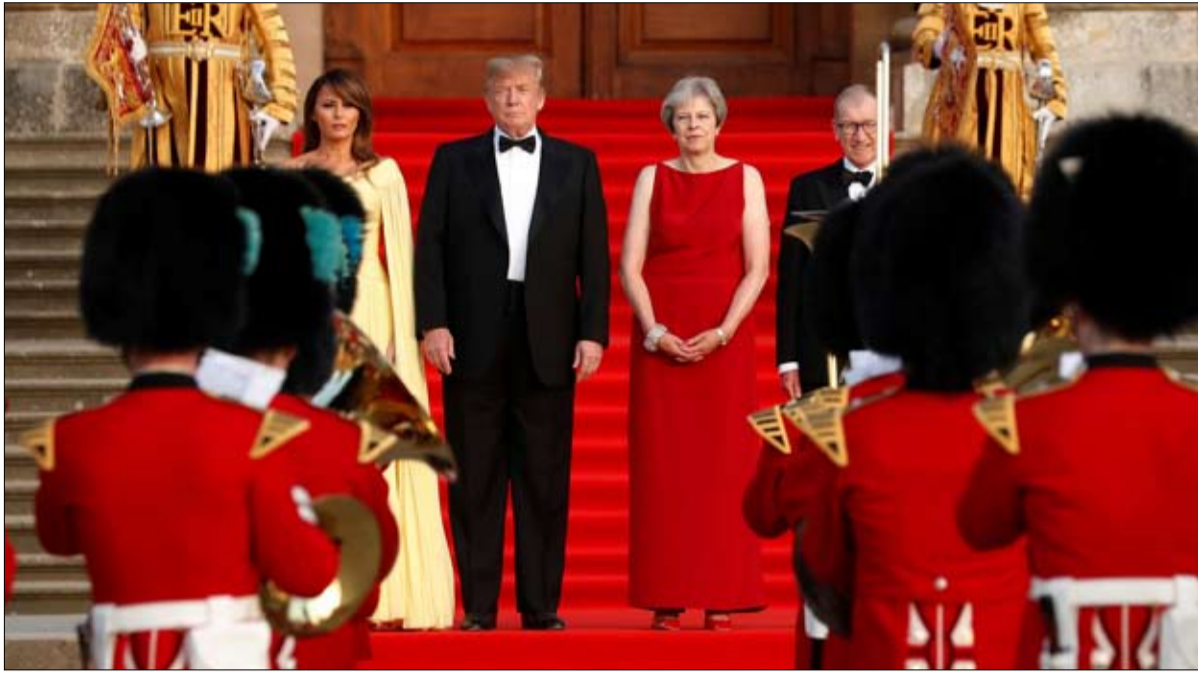
حفاوة الاستقبال لم تمنع اهانتها لامي