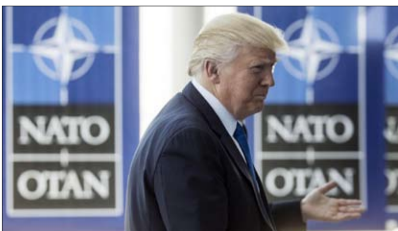
ترامب.. سياسة خارجية جديدة

- هذا الخطاب المناهض للاتحاد الأوروبي وللناتو له دور في المشهد السياسي الأمريكي