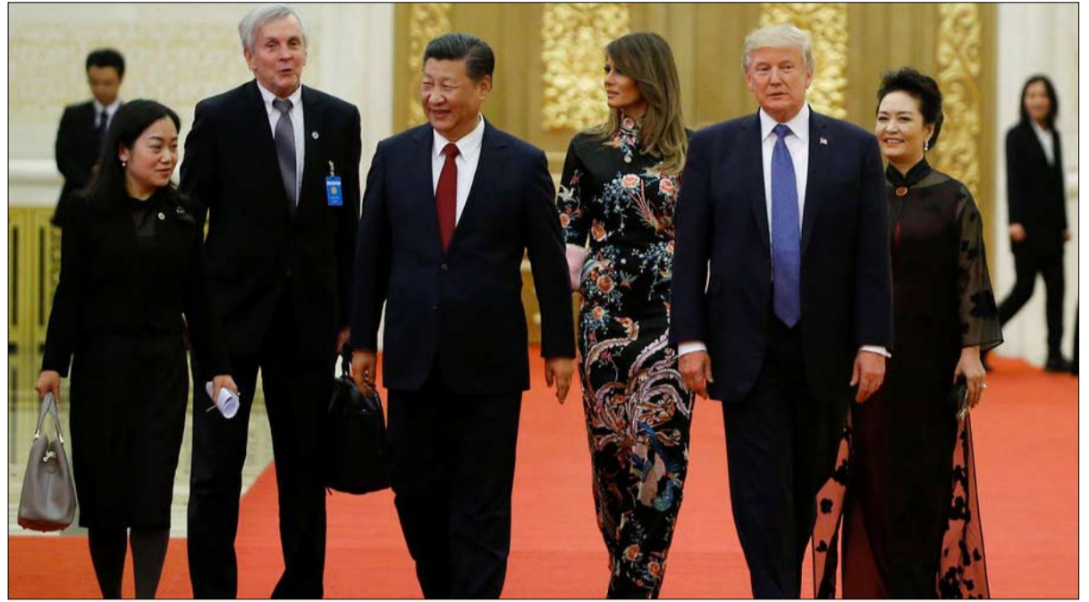
عالم جديد يتشكل