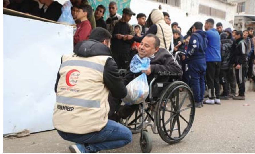
متطوعو الهلال الأحمر الإماراتي يوزعون المساعدات على أهالي غزة