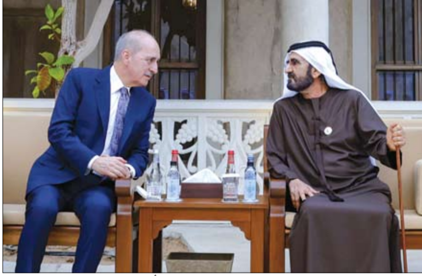
محمد بن راشد خلال استقباله رئيس مجلس الأمة التركي

تجدر الإشارة إلى أن جهود الوساطة الإماراتية نجحت مطلع يناير الجاري في الإفراج عن أسرى حرب بين روسيا وأوكرانيا، علاوة على وساطة أخرى في ديسمبر 2022، للإفراج وتبادل مسجونين اثنين بين الولايات المتحدة الأمريكية وروسيا الاتحادية.