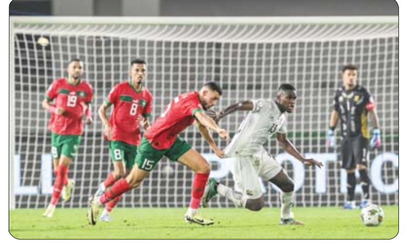
•• دبي - وام:

أسفرت نتائج مباريات دور الـ16 لبطولة كأس الأمم الإفريقية، المقامة منافساتها حالياً في كوت ديفوار، عن مجموعة من المفاجآت، أبرزها اكتمال خروج المصنفين الخمسة الأوائل على مستوى القارة، وتوديع جميع المنتخبات العربية البطولة مبكراً. وأقيمت في هذا الدور الإقصائي 8 مباريات جمعت بين 16 منتخباً تأهلوا من مرحلة المجموعات، شهدت تسجيل 15 هدفاً، بمتوسط 1.8 هدف في المباراة الواحدة. وحسبت 6 منتخبات تأهلت إلى الدور ربع النهائي بالفوز على منافسيهم في الوقت الأصلي من المباريات، في حين احتاج منتخبان للتعميد إلى وقت إضافي وركلات ترجيح بعد انتهاء زمن المباراة بالتعادل، وهما