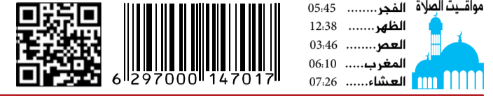
مواقيت الصلاة الفجر ..... 05:45 الظهر ..... 12:38 العصر ..... 03:46 المغرب ..... 06:10 العشاء ..... 07:26 الخميس 1 فبراير 2024 م - 20 رجب 1445 العدد 14066 Thursday 1 February 2024 - Issue No 14066

أعلن الجيش الإسرائيلي الأربعاء أن طائراته الحربية نفذت ضربات على بنية تحتية عسكرية للنظام السوري ليلا ردا على إطلاق صواريخ من سوريا. وقال الجيش في بيان: تم الليلة الماضية تحديد عدد من عمليات الإطلاق من سوريا في اتجاه جنوب مرتفعات الجولان، ردا على ذلك قصفت طائرات مقاتلة تابعة للجيش الإسرائيلي بنية تحتية عسكرية تابعة للنظام السوري في منطقة درعا خلال الليل. ولم يذكر الجيش سقوط ضحايا ولا حجم الأضرار الناجمة عن الغارات، ونادرا ما تعلق إسرائيل على ضربات تستهدف سوريا، لكنها قالت مرارا إنها لن تسمح لإيران التي تدعم حكومة الرئيس بشار الأسد بتوسيع وجودها في البلد. وشنت إسرائيل مئات الغارات الجوية على جارتها الشمالية منذ بدء الحرب الأهلية السورية عام 2011، استهدفت في المقام الأول القوات المدعومة من إيران وبينها حزب الله اللبناني وكذلك مواقع للجيش السوري، لكنها كشفت هجماتها منذ بدء الحرب بين إسرائيل وحركة حماس.