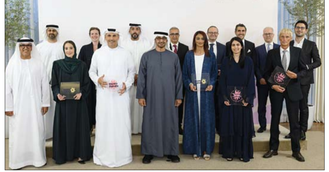
رئيس الدولة خلال تكريمه المؤسسات الحاصلة على «علامة الجودة لبيئة عمل داعمة للوالدين»