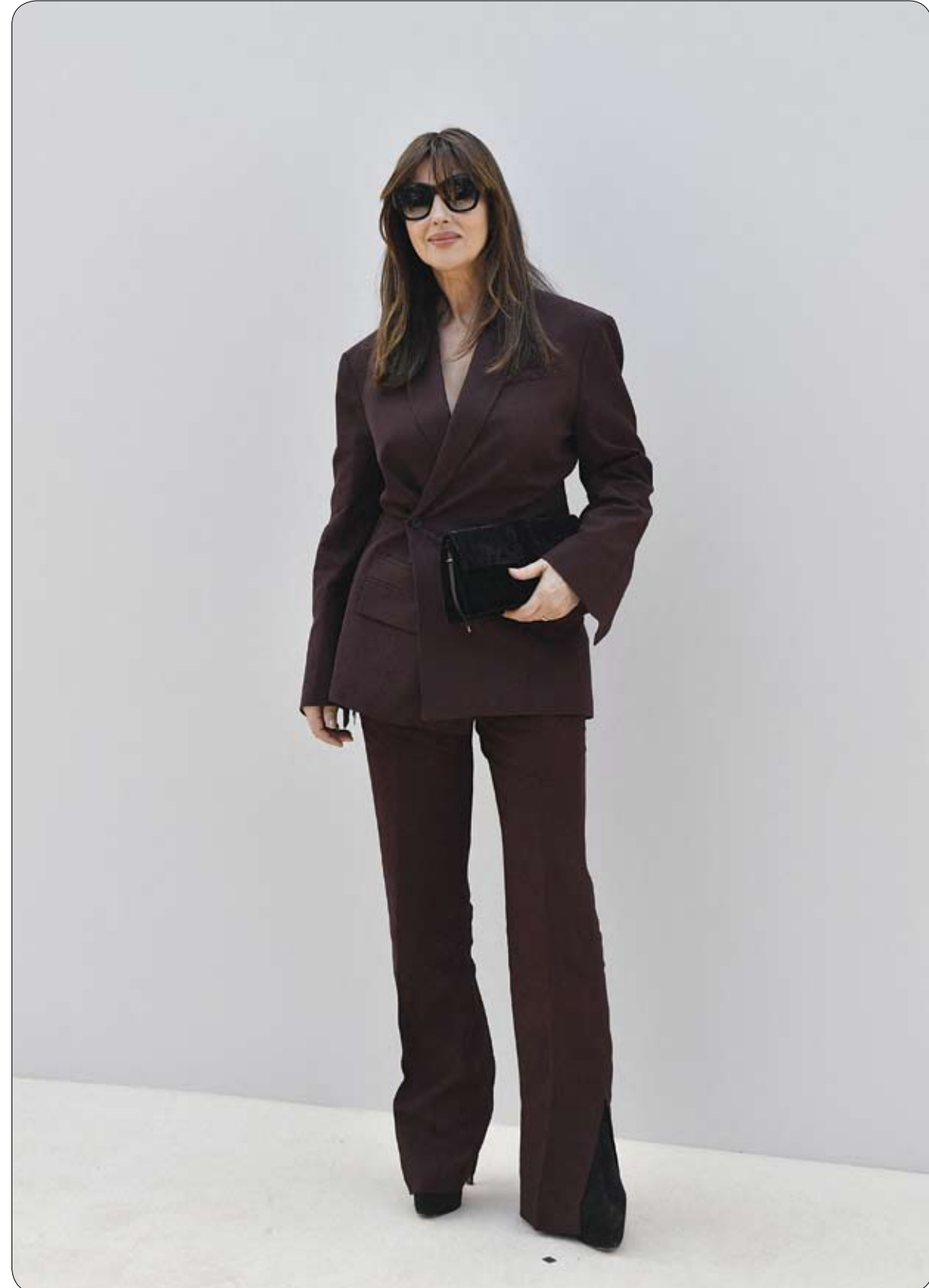
الممثلة الإيطالية مونیکا بيلوتشي لدى وصولها إلى عرض جاكيموس للملابس الرجالية لربيع وصيف 2024

أصدرت وزارة الداخلية المصرية بياناً حول حادثة الدهس بإحدى التجمعات السكنية في العاصمة القاهرة. ونفى البيان صحة ما تم تداوله على مواقع التواصل الاجتماعي بأن مرتكب حادث التصادم ضابط شرطة. وقال البيان: "نفي صحة ما تم تداوله على مواقع التواصل الاجتماعي بأن مرتكب حادث التصادم بإحدى التجمعات السكنية بالناحية الجديدة، والذي أسفر عن وفاة إحدى السيدات (صيدلانية) وإصابة آخرين بوضوح شرطة". وبحسب وسائل إعلام محلية، فقد أُلقت قوات الأمن المصرية القبض على المتهم بدهس صيدلانية وزوجها وأبنائها في كمباوند شهير بالتجمع. حيث لقت غرفة عمليات النجدة بمديرية أمن القاهرة، بلاغاً يفيد بوقوع حادث مرورى بوجود متوثة ومصائبين بأحد الكمبوندات بمنطقة التجمع الأول. وانتقل فريق من رجال المباحث إلى محل الواقعة، وتبين تصادم سيارة ملاكي بعائلة مكونة من أب وأم وأطفالهما الثلاثة، مما أسفر عن مصرع الأم وتعمل صيدلانية وتوفيت إثر إصابتها بترفيف في المخ. كما أصيب الأب وهو طبيب بيطري وإصابة أطفاله بجروح وكسور. وتم إخطار النيابة العامة لمباشرة التحقيقات واتخاذ الإجراءات القانونية اللازمة حيال الواقعة.