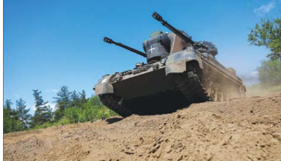
جنود أوكرانيون يستخدمون مدفع مضاد للطائرات من طراز Gepard باتجاه المواقع الروسية.

جزيرة القرم الروسية، سيرغي أكسيونوف. ووفقا لبيان صادر عن جهاز الأمن الفيدرالي الروسي، تم اعتقال مواطن روسي جنده أجهزة المخابرات الأوكرانية، وتم تدريبه في أوكرانيا على المتفجرات والألغام. وحطط الرجل لتضجير سيارة أكسيونوف، لكن تم القبض عليه وبحوزته العبوة الناسفة قبل أن ينفذ الخطة، وتم فتح قضية ضده بتهمته محاولة ارتكاب عمل إرهابي وحيازة متفجرات بشكل غير قانوني، وفقا لما ذكرته وكالة نوفوستي الروسية للأخبار. وأوقف مواطن روسي مولود العام 1988 بشبهة تجنيده من جانب عناصر في جهاز الاستخبارات الأوكرانية (أس بي يو) على ما أفاد المصدر نفسه مؤكدا أن الرجل تابع تدريباً على استخبارات التخريب في أوكرانيا بما يشمل المتفجرات.