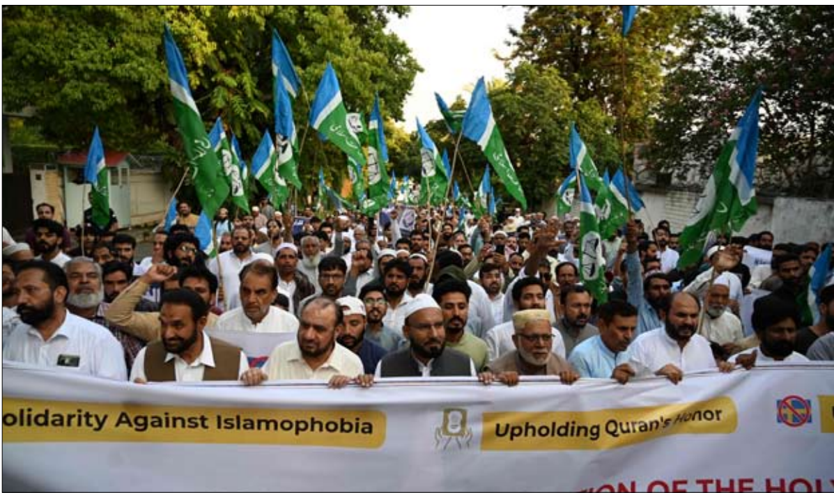
الاحتجاجات في ستوكهولم، السويد، احتجاجا على حرق القرآن في السويد.

أثارت واقعة سماح السويد لمظاهر بحرق المصحف انتقادات دولية، في الوقت الذي توقع به مراقبون أن تلقي الأزمة بظلالها على طلب ستوكهولم للانضمام إلى حلف شمال الأطلسي (ناتو)، الذي يصطدم بمعارضة تركية حتى الآن. وقال الرئيس التركي رجب طيب أردوغان، إن سماح السويد للمظاهر بإحراق صفحات من نسخة من المصحف، بمثابة "إهانة للمسلمين وليست حرية فكر"، مضيفا: "سنبدي رد فعل بأقوى طريقة ممكنة حتى تتم محاربة التنظيمات الإرهابية وأعوان الإسلام بجزم" بحسب وكالة أنباء "الأناضول" الرسمية في تركيا. وتأتي تصريحات أردوغان قبل أسبوع من لقاء مقرر بين وزير الخارجية السويدي والتركي في بروكسل، لمناقشة انضمام السويد للناتو، ما قد يعقد مواقعة أقرة التي تأخرت طويلا على طلب ستوكهولم. في يناير الماضي، علقت تركيا المحادثات مع السويد بشأن طلبها لحلف الناتو، بعد أن أحرقت ناشط نسخة من القرآن خارج السفارة التركية في ستوكهولم، ويضغط حلف الناتو وكذلك الحكومات الغربية على تركيا، لمنع السويد الضوء الأخضر قبل القمة السنوية للحلف في ليتوانيا يومي 11 و12 يوليو المقبل، في خضم مواجهة روسيا.