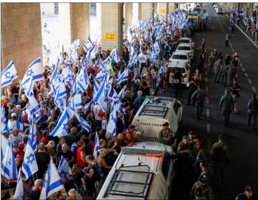
احتجاجات في إسرائيل، احتجاجا على التعديلات القضائية.

من الناخبين، ولوت مزارع وعضو في البرلمان المحلي وقد نافسه في هذه الانتخابات نيلس نومان وهو مرشح مستقل حاز 48.9% من الأصوات. حسب وسائل إعلام محلية، هذه أول مرة تشهد ألمانيا فوز مرشح يميني متطرف برئاسة بلدية مدينة بدوام كامل. والحالات السابقة التي شغل فيها أعضاء من حزب البدليل لألمانيا منصب رئيس بلدية كانت عن طريق تطوعهم لتولي هذه المهمة بدوام جزئي أي أنه كانت لديهم وظائف أخرى ولم يكونوا متفرغين لوظيفة رئيس البلدية. بين 2018 و2020 تولى عضو بلدية بلدة ألمانية تقع في غرب البلاد، ومع أنه كان متفرغا للاندستراكيين الديموقراطيين بزعامة أولاف شولتس.