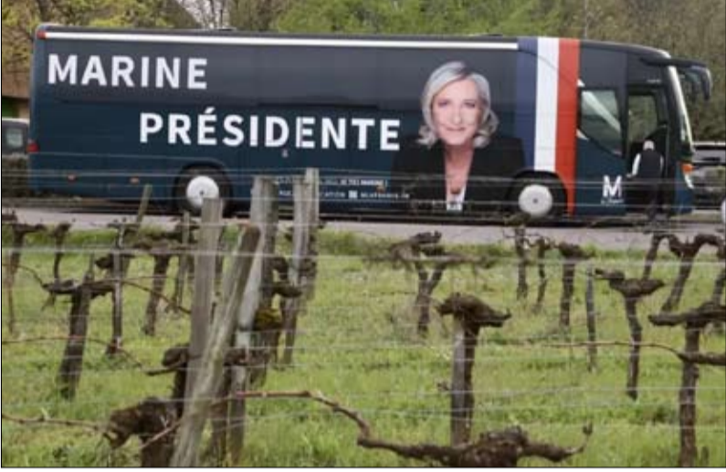
قامت بحملة محلية بحافلة تحمل صورتها في كل منطقة من مناطق فرنسا