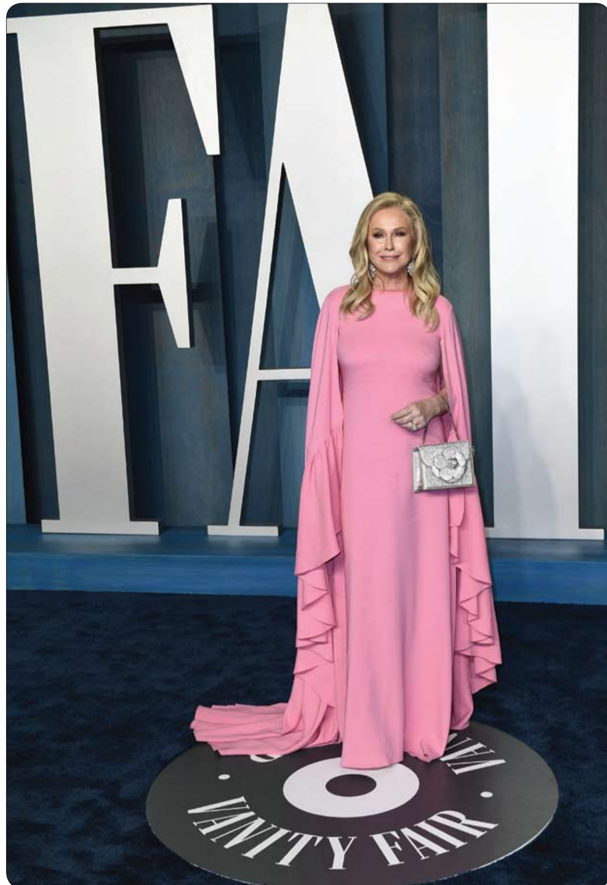
كاشي هيلتون لدى حضورها حفل فائيتي فير أوسكار لعام 2022 في بيفرلي هيلز، كاليفورنيا

انتشار الكلاب الضالة يخلق أكثر سكان المغرب العربي وخصوصاً بعدما لمقت تلميذة مصرعهما في تونس وكذلك قضى صبي في الجزائر، لكن القتل المنظم لهذه الحيوانات، وهو الحل الرئيسي المعتمد في مواجهة هذه الظاهرة، يلقى استنكاراً من المدافعين عن الحيوانات. وفتح مكتب المدعي العام في قابس (جنوب شرق تونس) الجمعة تحقيقاً في أعقاب مقتل فتاة تبلغ 16 عاماً، تعرضت لهجوم كلاب ضالة وهي في طريقها إلى المدرسة. وقد اشتكى السكان من الارتفاع الأخير في أعداد الكلاب الضالة التي تهاجم أيضاً الماشية في هذه المنطقة الزراعية. وفي الجزائر "التهمت الكلاب" الطفل صلاح الدين (12 عاماً) في بداية شهر آذار/مارس بمدينة البليدة غرب العاصمة، بحسب عمه الذي قال إنه "لم يبق منه سوى العظام في أطرافه السفلى". وصرح الطبيب البيطري عبد المؤمن بومزة لووكالة فرانس برس أن الطريقة الوحيدة التي تستخدمها أعوان البلدية في هذا البلد هي الأسم والقتل، معرباً عن أسفه أيضاً لأنهم يتصرفون فقط "في حالات الطوارئ، عندما تكون من جانبها، تؤكد تونس أنها اتخذت بعض الإجراءات، فقد أتاحت وزارة الزراعة لقاح داء الكلب مجاناً وحددت لنفسها هدف تلقيح 70 في المئة من الكلاب بسرعة في تونس العاصمة.