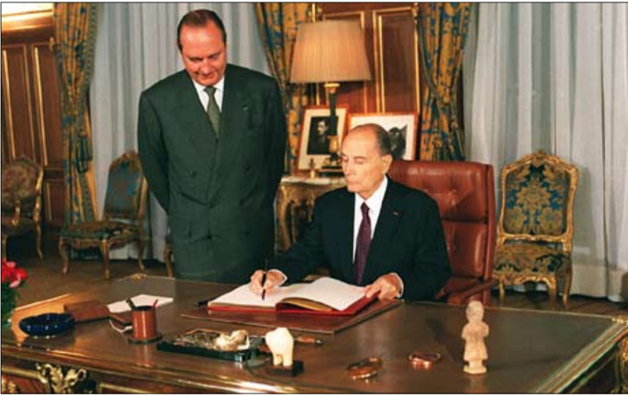
ميتران وشيراك نفس قارئة الفنان