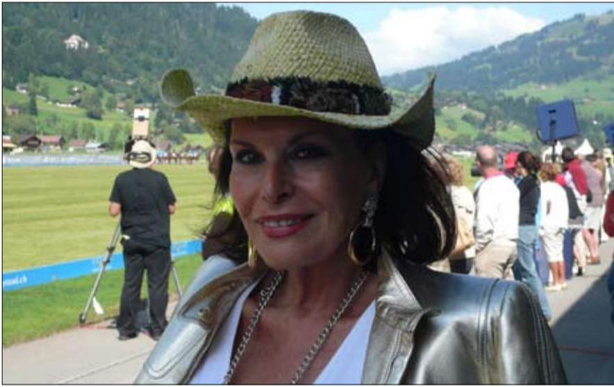
إيزابيث تيسييه المرأة التي تهمس في أذن الرؤساء