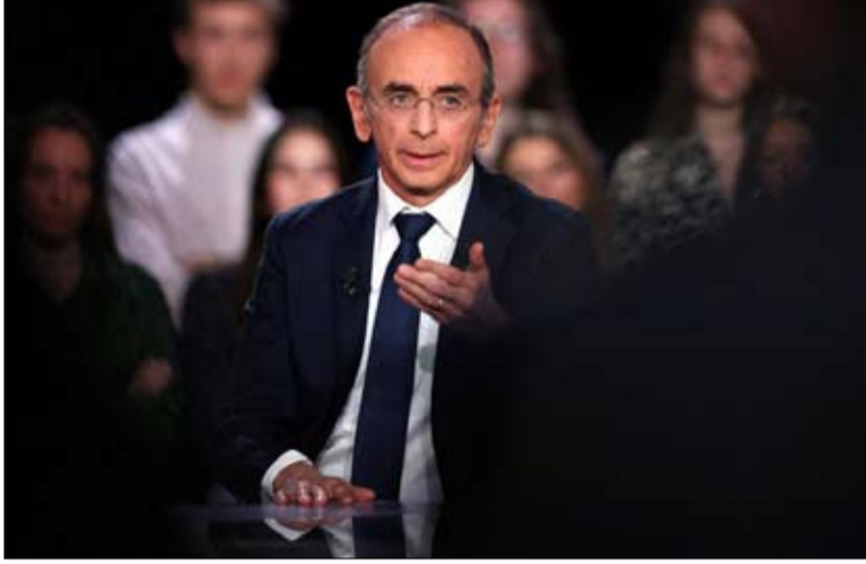
زمر قدم خدمة جليلة لمنافسته مارين