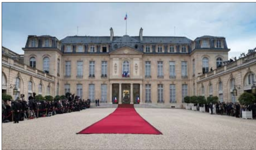
هل تترتب مارين على عرش الإليزيه