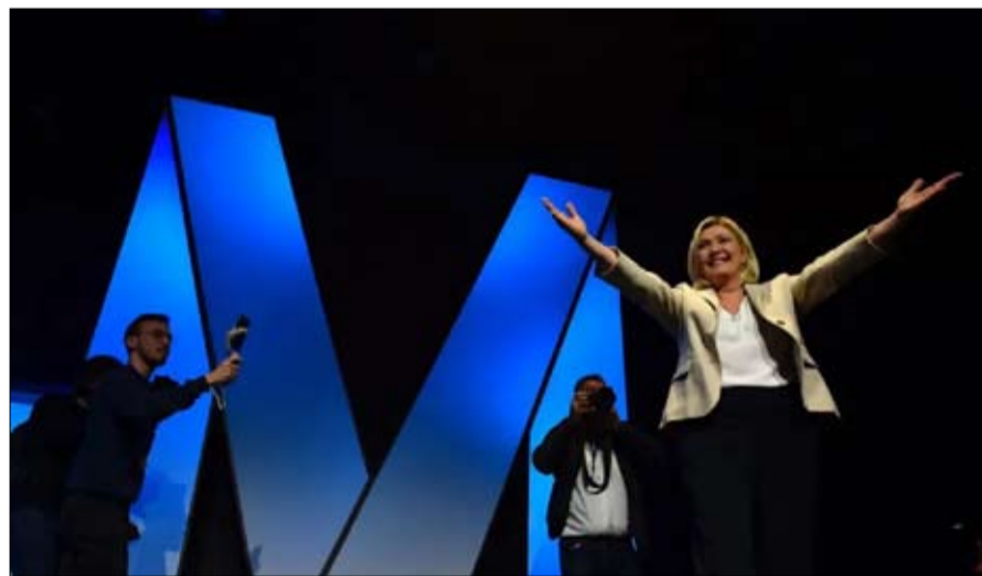
مارين لوبان تقصص الفارق مع ماكرون

الشركات والحكومات ستراجع اعتمادها على دول أخرى