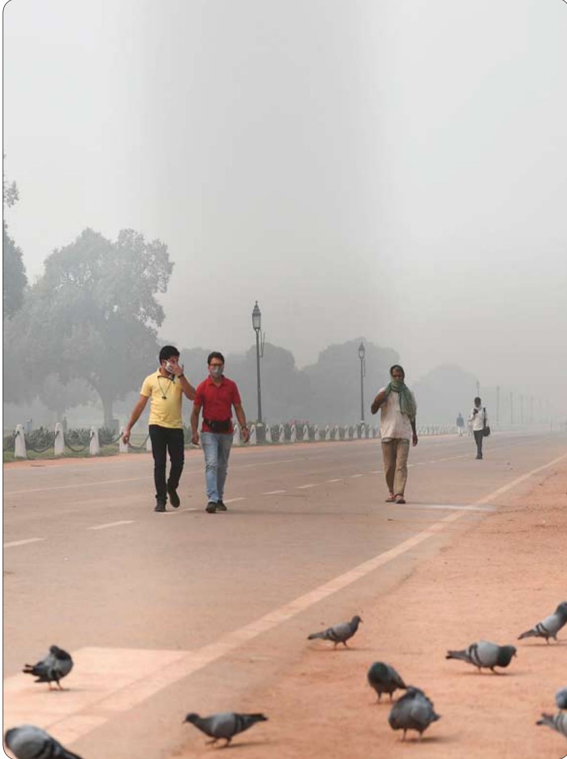
أشخاص يسيرون بالقرب من بوابة الهند في ظل ظروف الضباب الدخاني الكثيف في نيودلهي.