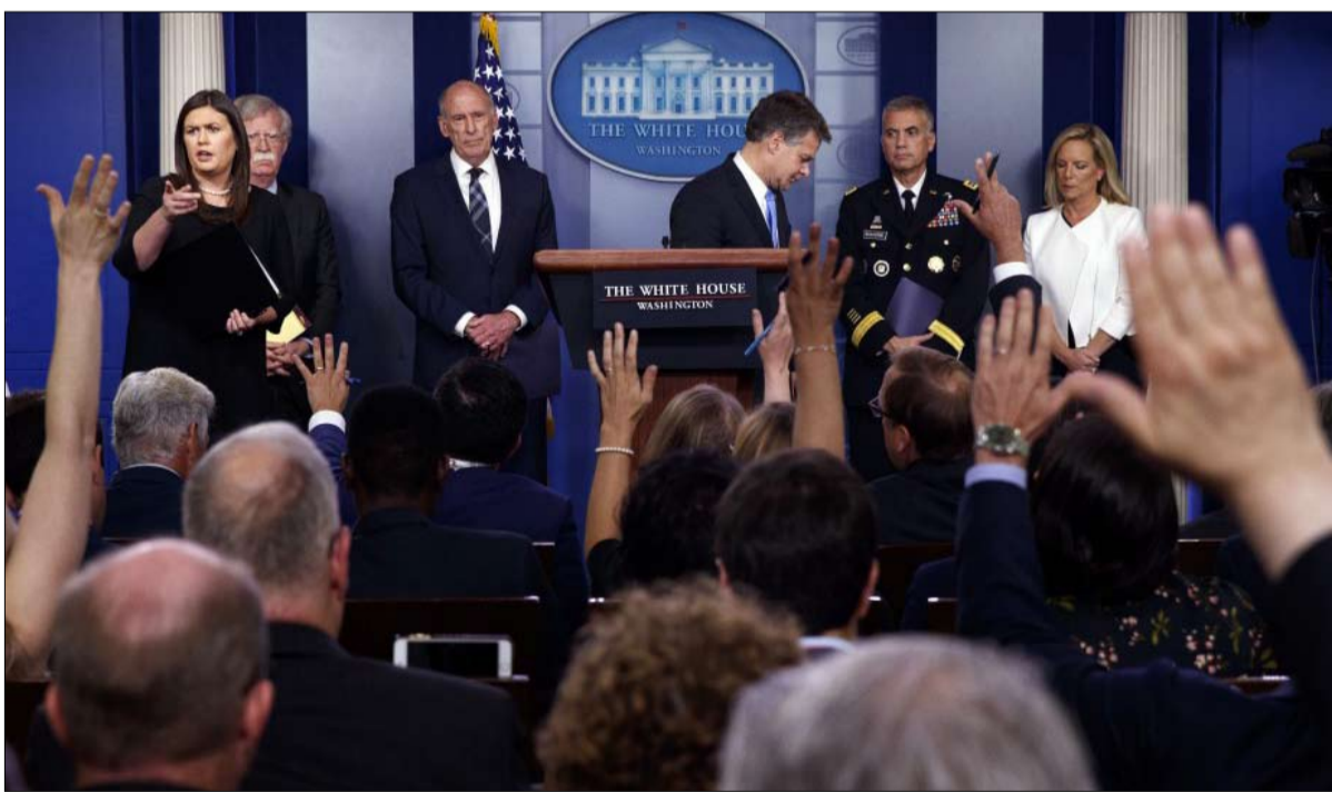
الندوة الصحفية في البيت الابيض

وحاول مستشار الأمن القومي جون بولتون طمأنة المجلس التشريعي في رسالة إلى أعضاء مجلس الشيوخ، مفادها أن الحكومة اتخذت إجراءات، وأن دونالد ترامب عازم على منع التدخل في الحملة الانتخابية النصفية. وكان الرئيس الأمريكي قد أعرب على تويتر، عن قلقه من أن يتدخل قرصنة روس في الحملة الحالية ... لكن لخدمة المعارضة بشكل أفضل: "استنادا إلى حقيقة أنه لم يكن هناك رئيسا أكثر صرامة مني مع روسيا، سيدفعون بقوة لدعم فوز الديمقراطيين، فهم بالطبع لا يريدون ترامب...".