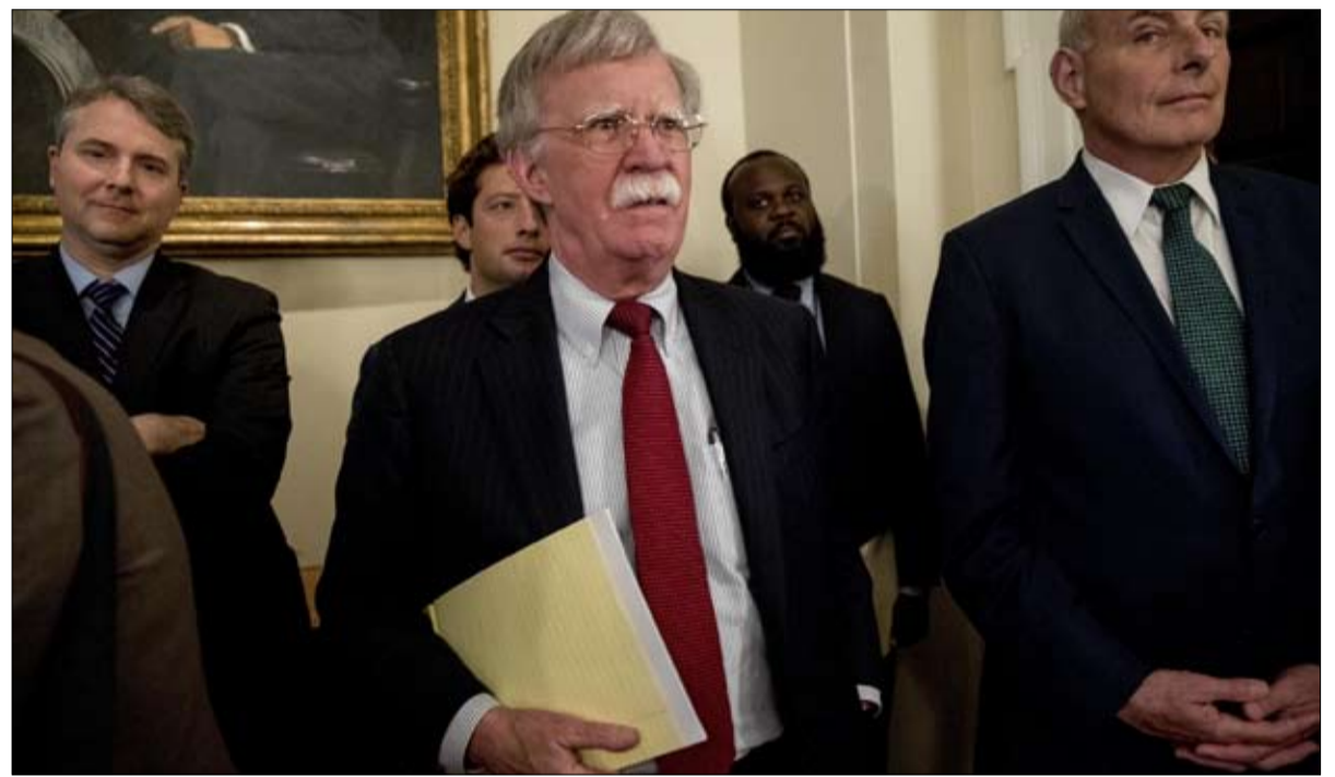
جون بولتون يطمن

المخابرات الأمريكية على نفس الموجة "محاولة إضعاف وتقسيم الولايات المتحدة" بالتدخل في العملية الانتخابية الأمريكية والتدخل في النقاش السياسي، اتهم مدير الاستخبارات الوطنية الأمريكية دان كوتس الخميس. وأضاف، أن التهديد "حقيقي، وأنه مستمر، ونحن نبدل كل ما في وسعنا لإجراء انتخابات يمكن للأمريكيين أن يتقوا بها". ووفقا له، رصدت المخابرات محاولة روسيا "اختراق وسرقة معلومات من مرشحين ومسؤولين حكوميين، حذر كريستوفر فراي،