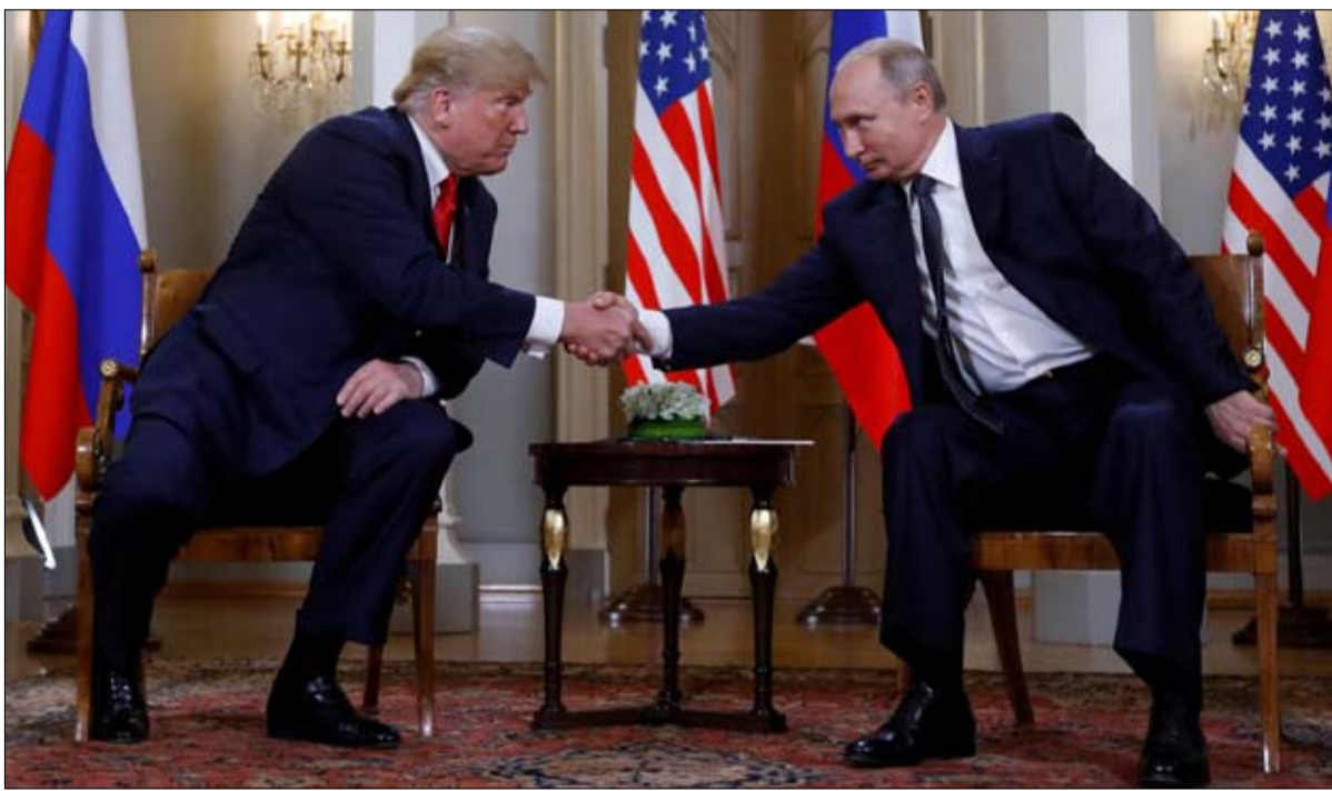
تساهل يثير الانزعاج

لتساهله تجاه فلاديمير بوتين خلال لقائهما في 16 يوليو في هلسنكي. خطاب ذو سرعتين يزعج حتى داخل صفوف الكونغرس.