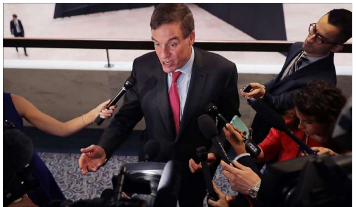
السناتور الديمقراطي مارك وارنر يرحب