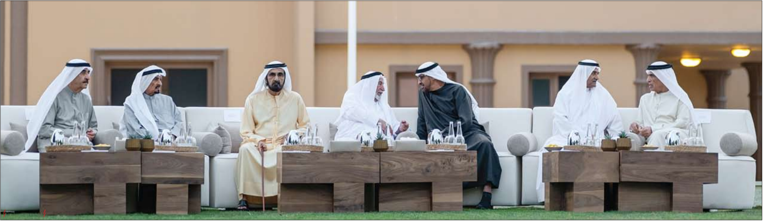
رئيس الدولة وحكام الإمارات يتبادلون التهاني بشهر رمضان في مزرعة الشيخ زايد التاريخية في منطقة الخوانيج في دبي (وام)

يومية - سياسية - مستقلة www.alfajrnews.ae