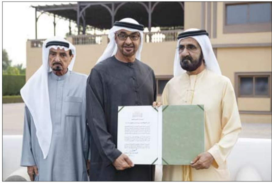
رئيس الدولة يسلم محمد بن راشد رسالة شكر موقفة من سموه لجهوده المخلصة في خدمة كتاب الله (وام)