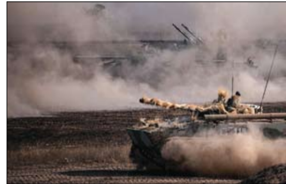
هل الدبابات الروسية جاهزة للزنتير؟

قال رئيس الوزراء الإسرائيلي نفتالي بينيت، الاثنين، إن إيران لا تستحق أي مكافآت أو تخفيف للعقوبات مقابل هبميتها، مناشداً حلفاء إسرائيل بعدم الاستسلام لما سماه الابتنزاز النووي الإيراني، فيما يتم استئناف المفاوضات النووية بين إيران والقوى العالمية في فيينا. وأضاف الحساب الرسمي لرئيس الوزراء الإسرائيلي على تويتر: رغم الانتهاكات الإيرانية وتقويضها لعمل مفتشي الوكالة الدولية للطاقة الذرية، إيران ستصل إلى طاولة المفاوضات في فيينا. هذا وانطلقت في فيينا، أمس الاثنين، المحادثات الدولية حول إحياء الاتفاق النووي الإيراني لعام 2015، بعد أشهر من تعليقها. وأرسلت الولايات المتحدة وفداً برئاسة مبعوثها الخاص إلى إيران روب ماني ليشترك في المحادثات بشكل غير مباشر. يذكر أن الجولة الجديدة للمفاوضات هي السابعة من نوعها والأولى بعد تولي الرئيس الإيراني الحالي إبراهيم رئيسي منصبه في أغسطس 2021. ويجتمع أطراف خطة العمل الشاملة المشتركة مجدداً في فيينا بعد ما يقرب من 6 أشهر لمناقشة العودة المتبادلة إلى الصيغة من قبل كل من الولايات المتحدة وإيران، لكن الفجوة أعلت وقتاً لتجدد عقبات جديدة. وقبل انطلاق المفاوضات، أكدت الخارجية الإيرانية، أمس الاثنين، أن طهران لن تجري محادثات ثنائية مع الوفد الأمريكي في محادثات فيينا النووية.