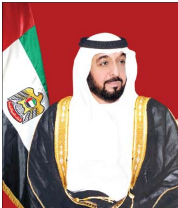
حفظ الله بلادنا، ونعقد برحمته ومغفرته أرواح شهدائنا، وأدام