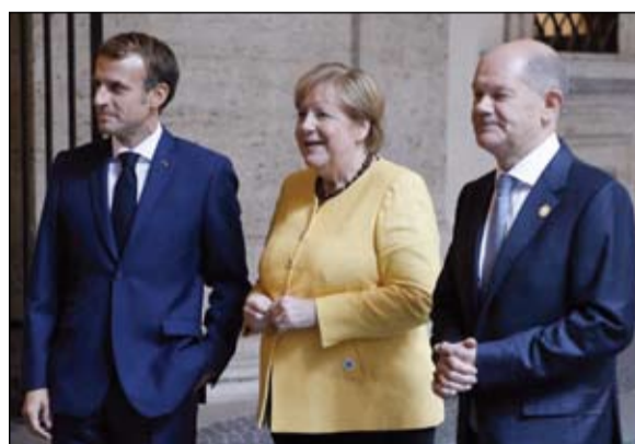
ماكرون والمستشارة السابقة ميركل والمستشار المستقبل أولاف شولتز

قال الرئيس التركي، رجب طيب أردوغان، الاثنين، إن تركيا ستتخذ خطوات تقارب مع مصر وإسرائيل. وفي شأن محلي، قال أردوغان: لن أتنازل عن خفض أسعار الفائدة والتضخم سينخفض قبل انتخابات 2023، مشيراً إلى أنه لم يغير رأيه بأن أسعار الفائدة المرتفعة تزيد التضخم. ونقلت وسائل الإعلام التركية عن أردوغان قوله للصحافيين، أثناء رحلته العودة من زيارة لتركمانيستان، إن تقلبات سعر الصرف الأخيرة لم تكن قائمة على أسس اقتصادية، وإن أنقرة مستعدة لتقديم الدعم اللازم لتعزيز الاستثمارات، وتحديدًا من خلال البنوك الحكومية. وخسرت الليرة ما يصل إلى 45% من قيمتها مقابل الدولار هذا العام، وجاءت معظم تلك الخسائر بعد أن صدأ أردوغان من دفاعه عن موقفه إزاء السياسة