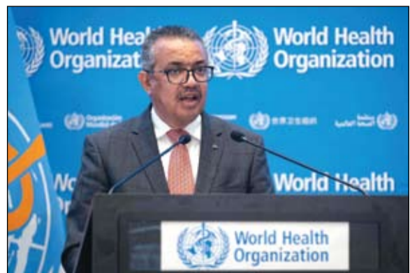
رئيس منظمة الصحة العالمية يحد من سرعة انتشار المتحور الجديد

التهى، إلا أنه شدد على أهمية الإبقاء على الحدود مفتوحة رغم متحور أوميكرون. وأشارت منظمة الصحة العالمية إلى أن ثمة قدراً كبيراً من عدم اليقين إزاء قدرة أوميكرون على التغلب على جهاز المناعة، وهناك حاجة لمزيد من الأبحاث للوصول إلى فهم أفضل لاحتمال تغلب أوميكرون على اللقاحات والمناعة المكتسبة بعد الإصابة. وحثت الدول الأعضاء على الإبلاغ عن أول حالات وبور تفشي أوميكرون، مشيرة إلى أنه قد تحدث زيادة في الإصابة بكوفيد-19 اعتماداً على خصائص أوميكرون، وهو ما ستكون له عواقب وخيمة، مشيرة إلى أنه من المتوقع إصابة الأشخاص المعتمدين بلقاحات كورونا بالمتحور الجديد وإن كان بنسبة محدودة. المستوى العالمي مرتفع، مشيرة إلى أن تقييم مجمل الخطر العالمي المتعلق بأوميكرون مرتفع للغاية، مشيرة إلى أن متحور أوميكرون يؤكد ضرورة الحاجة للمساواة في التطعيم. وشددت المنظمة الأممية، على