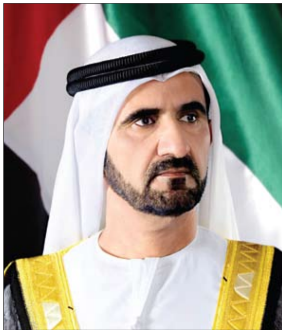
حفظ الله بلادنا، ونعقد برحمته ومغفرته أرواح شهدائنا، وأدام

إن الثلاثين من نوفمبر، يوم لتقدير الوفاء، تحلي فيه دولتنا، بقيادة شعبنا، قيم الفداء والتضحية وممارسات البطولة والإقدام، يوم تعبر فيه، نساء ورجالا، عن عظيم شكرنا ووافر امتناننا لمن بذلوا أرواحهم ودماءهم الغالية في ساحات الشرف فداء للوطن، ولتظل أمانة في الأعناق، يتعهدهم الوطن بالتقدير والحب، وتولاهم الدولة بالعناية والرعاية، فحنن من أمة تعظم الشهادة، ويكرم دينها الشهداء بأعلى الرتب، ويرفع المنازل والقامات وأحسنها، يبشرهم بالجنة، و"ألا خوف عليهم ولا هم يحزنون".