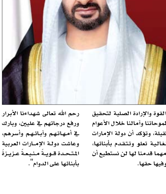
حفظ الله بلادنا، ونعقد برحمته ومغفرته أرواح شهدائنا، وأدام

أبناء وبنات الإمارات الكرام السلام عليكم ورحمة الله وبركاته.. أحببكم وأنتم الوطنية بسير أسلافنا وهم يتيمون الحياة على هذه الأرض ويحافظون عليها، ويفتدونها بالغالي والثمين.