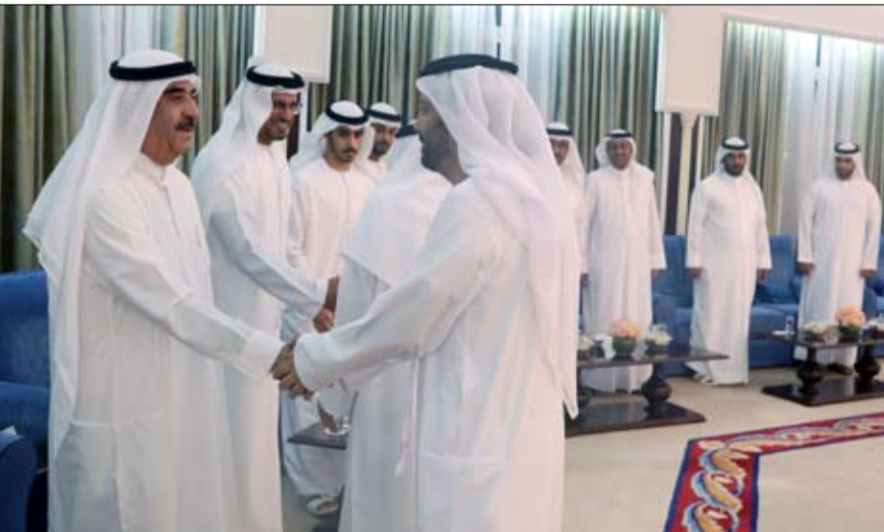
العربية والإسلامية باليمن وعلى بن سعود بن راشد المعلا رئيس دائرة البلدية والشيخ صقر بن سعود بن راشد المعلا سعادة ناصر سعيد التلاي مدير الديوان الأميري وسعادة راشد محمد أحمد مدير التشريفات بالديوان الأميري وعدد من المسؤولين.

واصل صاحب السمو الشيخ سعود بن راشد المعلا عضو المجلس الأعلى حاكم أم القيوين الليلة الماضية بقصر سموه استقبال المهنيين بشهر رمضان المبارك. فقد تقبل سموه التهاني والتبريكات بشهر رمضان من المواطنين وأبناء القبائل ورجال الأعمال والتجار والمستثمرين وأصحاب ومديري الشركات والمؤسسات والمصانع العاملة بالدولة وأبناء الجاليات العربية والإسلامية والأجنبية الذين قدموا لتهنئة سموه بالشهر الفضيل .. داعين الله العلي القدير أن يعيد هذه المناسبة على سموه بموفقور الصحة والعافية وعلى شعب الإمارات والأمتين