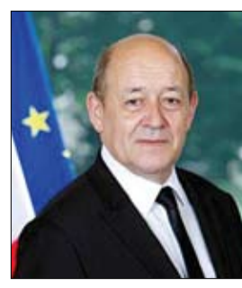
وزير الخارجية الفرنسي

الاستثمارات المختلفة والمتنوعة ضرب تضامن الدول (الأعضاء في الاتحاد) في ما بينها، وأشار الوزير أيضا إلى أن النزعات الشعبية في بعض الدول الأوروبية، تحاول المساهمة في عملية التفكك هذه. وأنتقد لوردان الذي غادر الحزب الاشتراكي لكن بدون أن ينتمي إلى الحزب حزب ماكرون ويؤكد أنه لا يزال يساريا، رفاهه السابقين وكذلك حزب التجمع الوطني (يمين متطرف) بزعامة ماريون لوين واليمين (حزب الجمهوريين). وقال إن التجمع الوطني لديه هدف واحد في هذه القضية هو محاولة الشأ (لهزيمة) في الانتخابات الرئاسية، وهذا ليس الموضوع المطروح، في إشارة إلى الدورة الثانية من الانتخابات الرئاسية في 2017 بين الرئيس ماكرون ولوين.