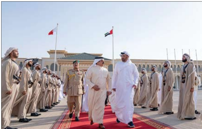
محمد بن زايد خلال وداعه ملك البحرين لدى مغادرته البلاد

كما بعث صاحب السمو الشيخ محمد بن راشد آل مكتوم نائب رئيس الدولة رئيس مجلس الوزراء حاكم دبي "رعاه الله" وصاحب السمو الشيخ محمد بن زايد آل نهيان ولي عهد أبو ظبي نائب القائد الأعلى للقوات المسلحة برقيتي تهنئة مماثلتين إلى دولة ناريندرا مودي.