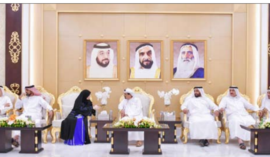
الخاص لصاحب السمو حاكم عجمان وسعادة طارق بن غليظه مدير مكتب الحاكم وسعادة يوسف محمد النعيمي مدير عام الشيوخ وكبار المسؤولين.

الزاهر للسلام وتقديم أسمى آيات التهاني والتبريكات بالشهر الفضيل. كما تبادل سموهما التهاني والتبريكات بمناسبة شهر رمضان المبارك مع الشيوخ وأعيان البلاد ووجهاء القبائل وجموع المهنيين من المواطنين والمقيمين وأبناء الجاليات العربية والإسلامية، سائلين الله العلي القدير أن يعيدها على سموهما بموفقور الصحة والسعادة. حضر المقابلات .. الشيخ