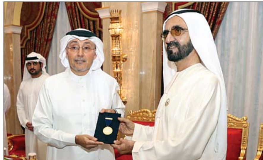
محمد بن راشد يقبل وسام سموه للدكتور وائل الحميد

تبرعت سمو الشيخة فاطمة بنت مبارك رئيسة الاتحاد النسائي العام رئيسة المجلس الأعلى للأمومة والطفولة الرئيسة الأعلى مؤسسة التنمية الأسرية والرئيسة الفخرية لهيئة الهلال الأحمر بمبلغ عشرة ملايين درهم لصالح حملة الإمارات لأطفال والروهنغيا، التي انطلقت امس على مستوى الدولة بتوجيهات القيادة الرشيدة و مشاركة عدد من المنظمات الإنسانية الإماراتية.