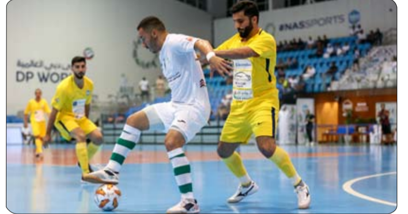
شرطة دبي ثالثاً في كرة الصالات