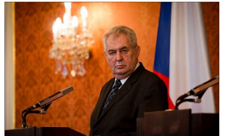
ميلوس زيمان لا يخفي تعاطفه مع روسيا والصين

حزب الحرية، هذا الحزب المعادي للإسلام، هو القوة الثانية في مجلس النواب. ويواجه منافسة تييري باوديت، المؤيد لخروج هولندا من الاتحاد الأوروبي. وكان متندي الديمقراطية، حزب هذا الأخير، قد دخل إلى مجلس الشيوخ بشكل مدهش، متفوقا، من حيث عدد المقاعد، على حزب رئيس الوزراء مارك روتي، بمقعد واحد.