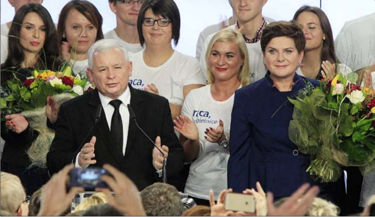
جاروسلاف كاتشينسكي الزعيم الحقيقي للبلاد