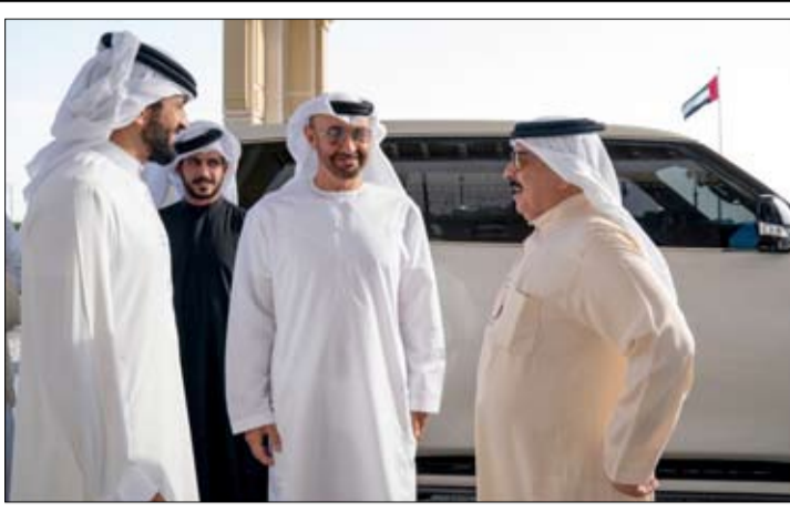
محمد بن زايد في وداع ملك البحرين لدى مغادرته البلاد