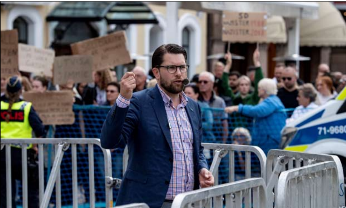
جيمي أكيسون يدافع عن خروج السويد من الاتحاد الأوروبي