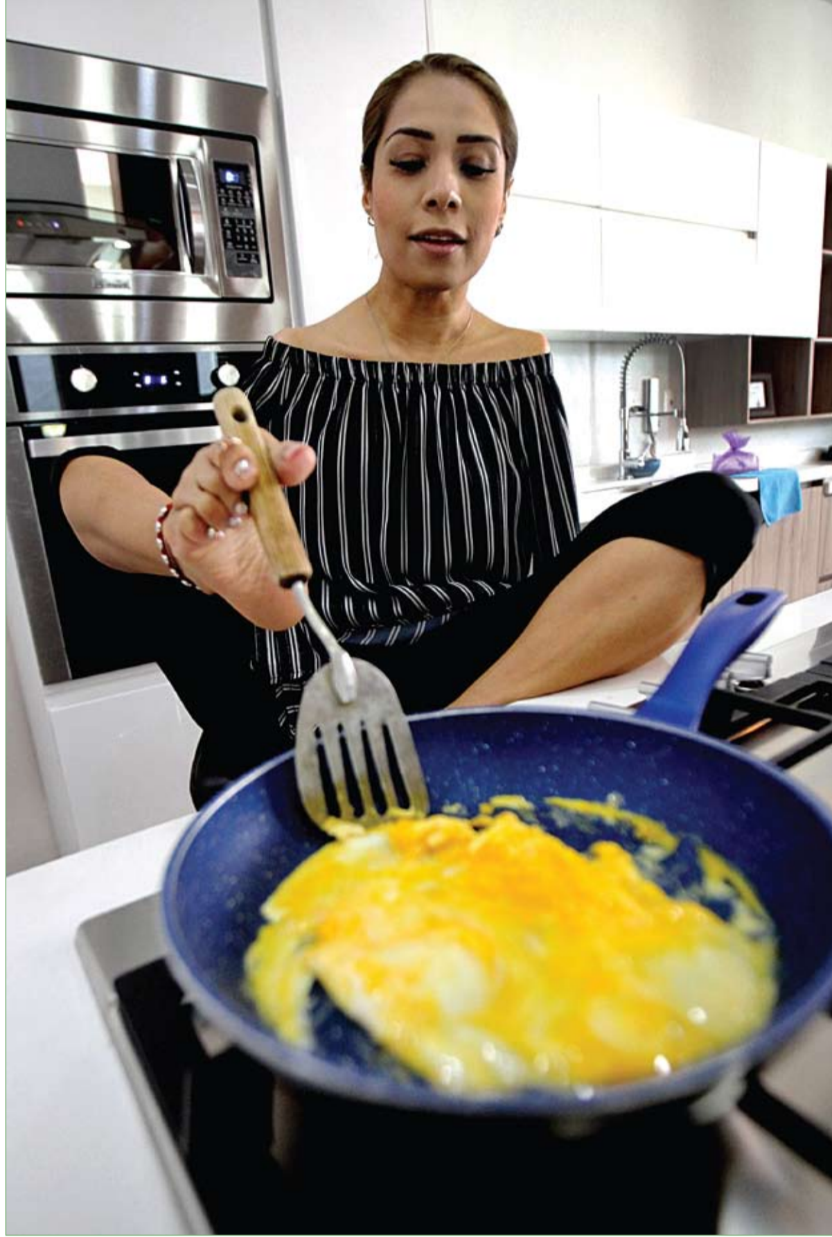
أدرينا ماسياس، المحامية والناشطة ومصممة الأزياء المكسيكية التي ولدت دون أذرع تُعد وجبة الإفطار باستخدام قدميها في غواداخارا بالمكسيك.

ورسومات دافنشي، التي تم اقتناؤها في عهد تشارلز الثاني، محفوظة منذ وفاة الفنان في الثاني من مايو- أيار 1519 في وادي نهر لوار في فرنسا.