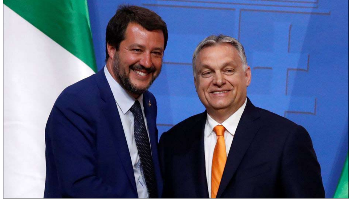
سالفيني واوربان ثنائي المرح