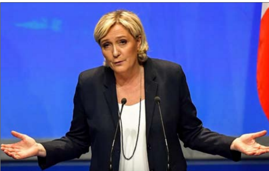
مارين لوپان هل تكرر الانجاز