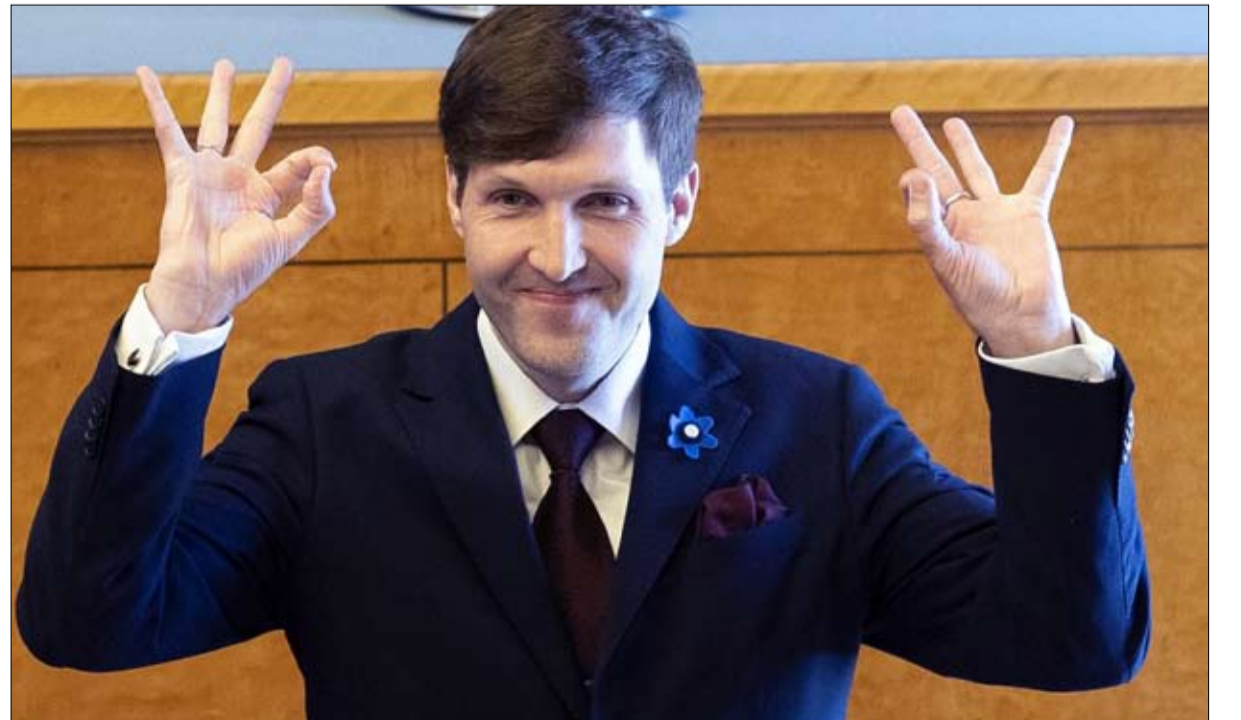
استوني عنصريون في الحكومة