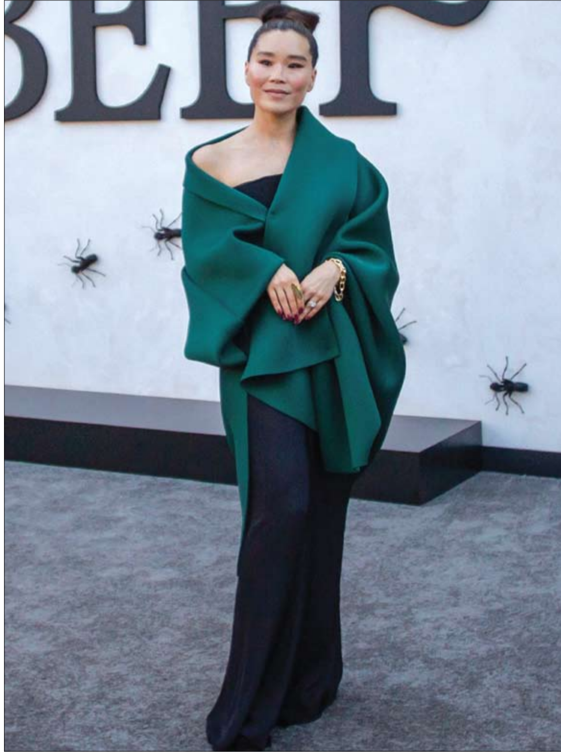
الممثلة الأسترالية أنيسيا هانا كيم لدى حضورها العرض الأول للموسم الثاني من مسلسل 'بيف'، في المسرح المصري في لوس أنجلوس.