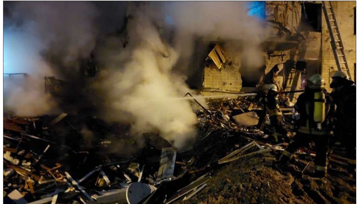
بوتين... روسيا لن تتوقف في منتصف الطريق