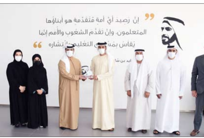
من خلال تخصيص صندوق تكافل تعليمي في الجامعات كافة