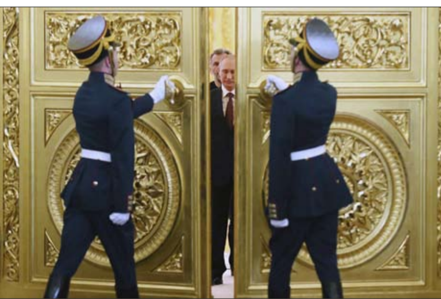
لا شيء كان يدل على انه سيصبح القيصر الجديد