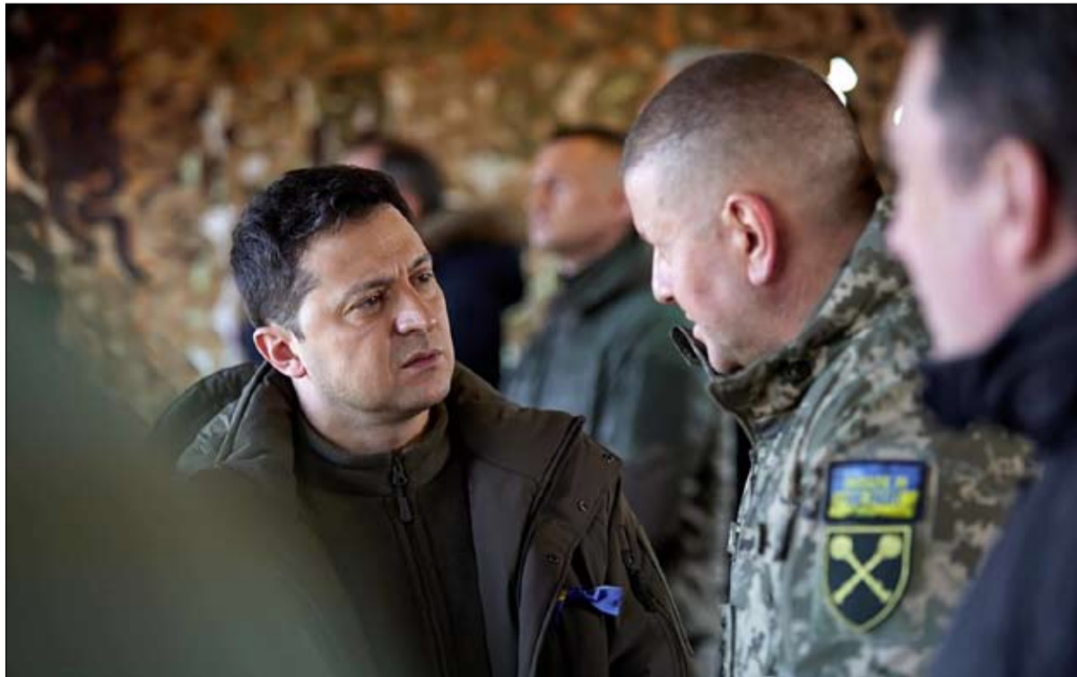
سلطة غير مرغوب فيها روسيا

لم يستطع أحد منع هذه الحرب، لأن فلاديمير بوتين أرادها مهما كان الثمن. لقد كزر القليلة الماضية عزمه على