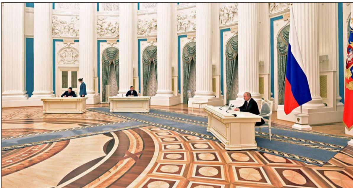
استعادة عظمة روسيا هاجسه

قبضته، حقيقة لا تفاجئ ديفيد رينينيك، محرر مجلة نيويورك ومؤلف كتاب عن نهاية الاتحاد السوفياتي، حيث يصف بوتين على النحو التالي: "سعى إلى إضفاء الطابع الروسي على إمبراطوريته متعددة الأعراق...". يطبق الرئيس الروسي قبل كل شيء، لغة القوة، ففي شبابه، كان معروفاً بالشجار في شوارع لينينغراد. وأرضيه ضعف روسيا ما بعد الحرب الباردة، ويقول في هذا الإطار: لقد أظهرنا ضعفاً، والضعاف يهزمون. في روسيا، السلطة العمودية هي التي تقرض نفسها، ويدفع خصومها الثمن.