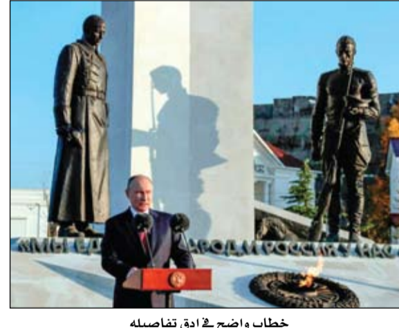
خطاب واضح في ادق تفاصيله