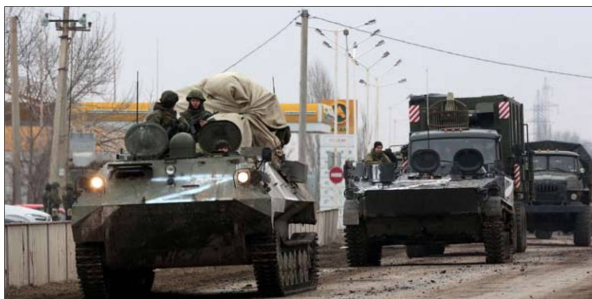
الروس أكبر منه وربما كان هدف الروس هو حصار كييف بشكل يؤدي إلى انهيار حكومة الرئيس فولوديمير زيلينسكي. ولا يريد الروس التورط في حرب مدن نو استطاعوا ذلك. وتوعد بوتين في إعلانه عن الغزو أي قوة خارجية

وقال إن الخدمات الاستخباراتية الغربية التي توقعته بدقة حدوث هذا السيناريو، تعتقد أن بوتين يهدف للإطاحة بالحكومة الأوكرانية وتنصيب حكومة ديم، ولن تقتصر عملية "قطع رأس" الحكومة على العاصمة فحسب، بل ستشمل الحكومات الإقليمية