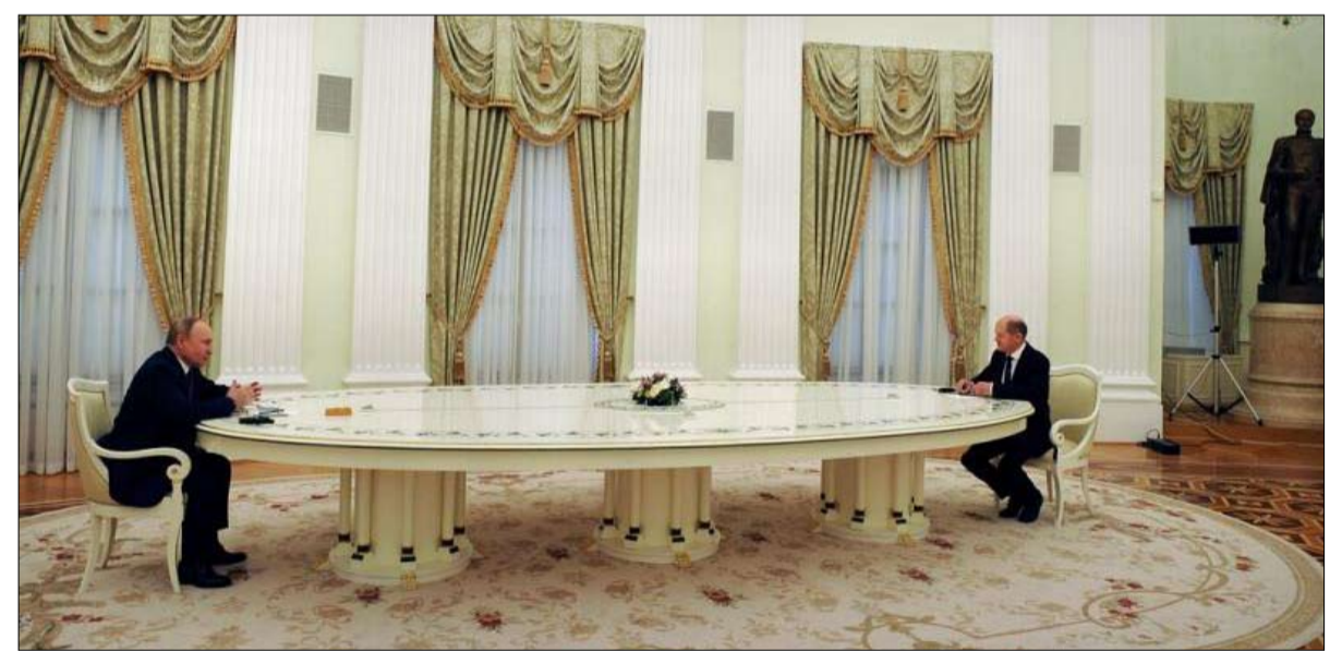
سيد الكرملين يستقبل أولاف شولتز في موسكو مع الحفاظ على مسافة