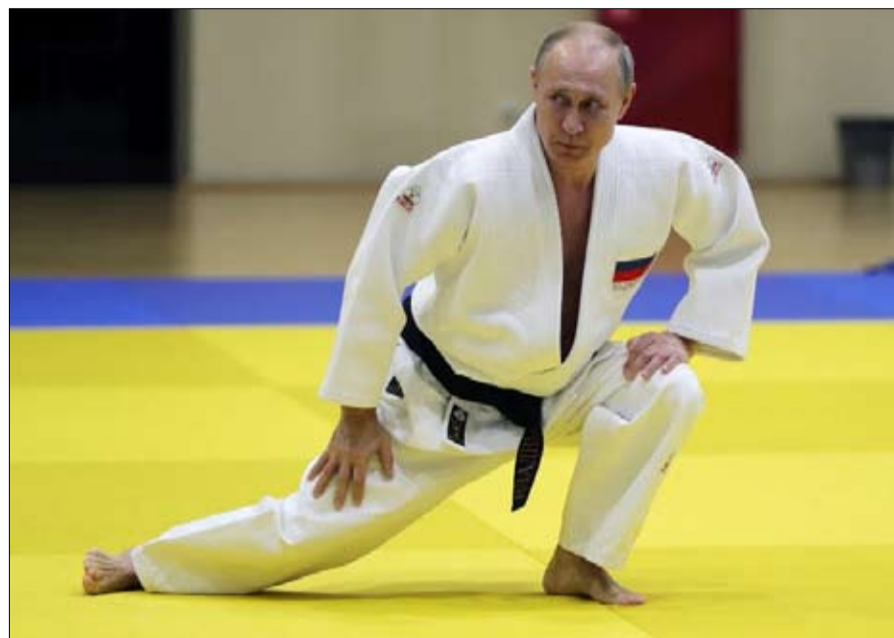
بوتين .. القوة لفته