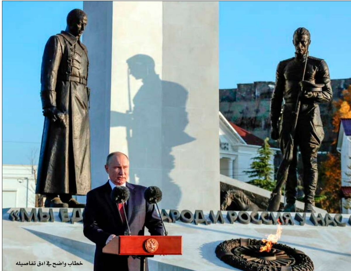
خطاب واضح في ادق تفاصيله