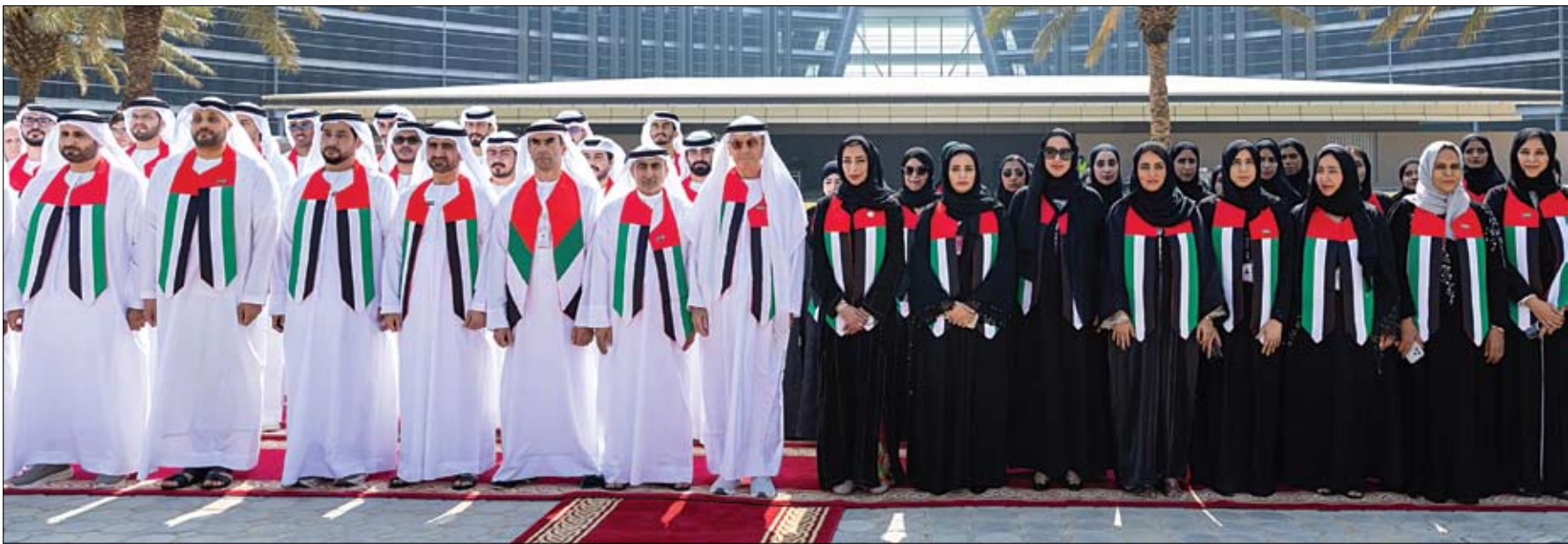
داخل الحرم الجامعي