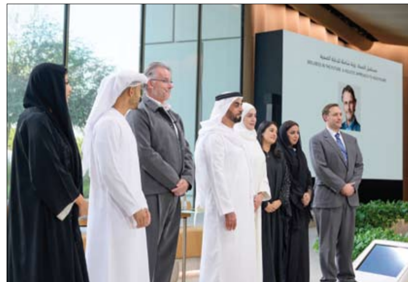
نظمتها مجلس محمد بن زايد