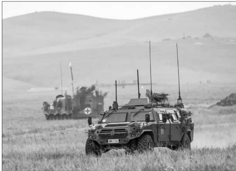
روسيا شريك في المنظومة الامنية المشددة