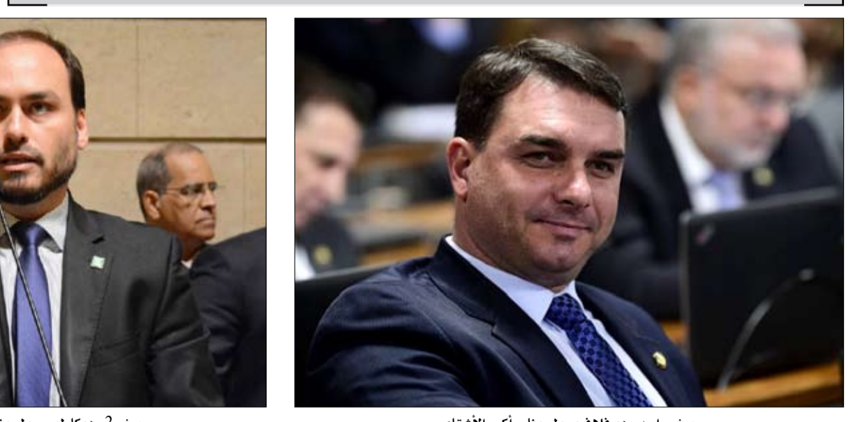
صفر واحد وهو فلافيو بولسونارو أكبر الأشقاء

عموده الفقري، إذ تحالفوا في البداية مع هذه المجموعات التي ما لبثت أن طردتهم، وتراقب الهجوم من العديد من الانتهاكات والفظاعات. في 11 كانون الثاني/يناير 2013، أطلقت فرنسا عملية "سرفال" لوقف تقدم المتطرفين الذين أخذوا بعد ثلاثة أيام مدن الشمال الكبرى. وفي الأول من آب/أغسطس حلت محل "سرفال" عملية "برخان" المكلفة محاربة المتطرفين. بدأت العملية بمشاركة ثلاثة آلاف جندي فرنسي قبل أن يرتفع عددهم إلى 4500 عسكري، ولا يقتصر انتشارهم على المستعمرة الفرنسية السابقة، بل يشمل خمس دول في منطقة الساحل في أيضا النيجر وبوركينا فاسو وتشاد وموريتانيا.