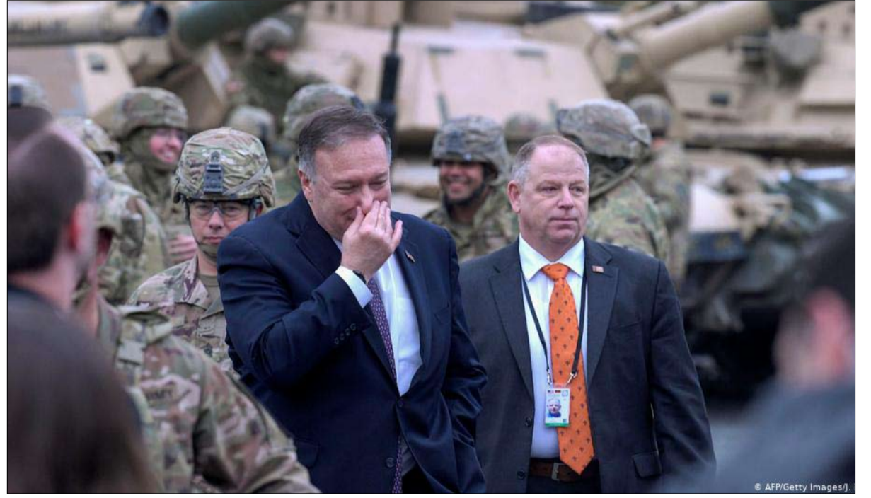
هل سيتخلص الامريكان من العبء الاوروبي؟