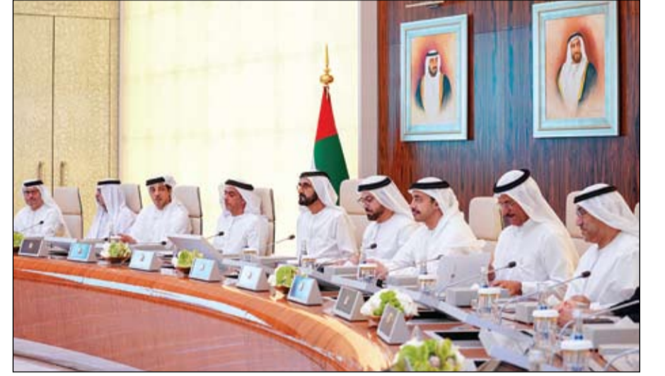
محمد بن راشد خلال ترؤسه اجتماع مجلس الوزراء (وام)

معالي محمد خليفة المبارك رئيس دائرة الثقافة والسياحة في أبوظبي. ورحب سموه بأعضاء اللجنة التي تساهم في عدد من المبادرات والحوارات الثقافية التي تتميز بها البلدان، مشيراً سموه إلى أهمية التواصل الحضاري بين مختلف الشعوب بما يعزز ويقوي علاقات الصداقة والتعاون بينهم ويخدم التراث الإنساني. (التفاصيل ص2)