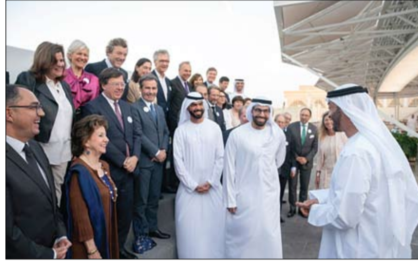
محمد بن زايد يتحدث الى وفد لجنة كولبير

بلغت قيمة البرامج الإنسانية والعمليات الإغاثية والمشاريع التنموية التي نفذتها هيئة الهلال الأحمر الإماراتي، في إندونيسيا منذ العام 1993 وحتى الآن، 440 مليوناً و44 ألفاً و859 درهماً. وافتححت الهيئة مؤخرًا بالتنسيق مع سفارة الدولة في جاكرتا عدداً من المشاريع الجديدة، ضمن جهودها التنموية على الساحة الإندونيسية، تضمنت إنشاء وصيانة 42 وحدة سكنية للأسر الضعيفة في منطقة سينجاساري بوركوترو في جاوه الوسطى، وتكثفت بسداد قيمة إمدادات الكهرباء لـ 70 منزلاً لمدة عام. (التفاصيل ص4)