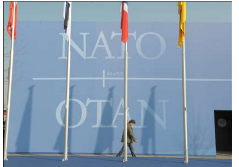
الناتو تضامن مكوناته يهتز