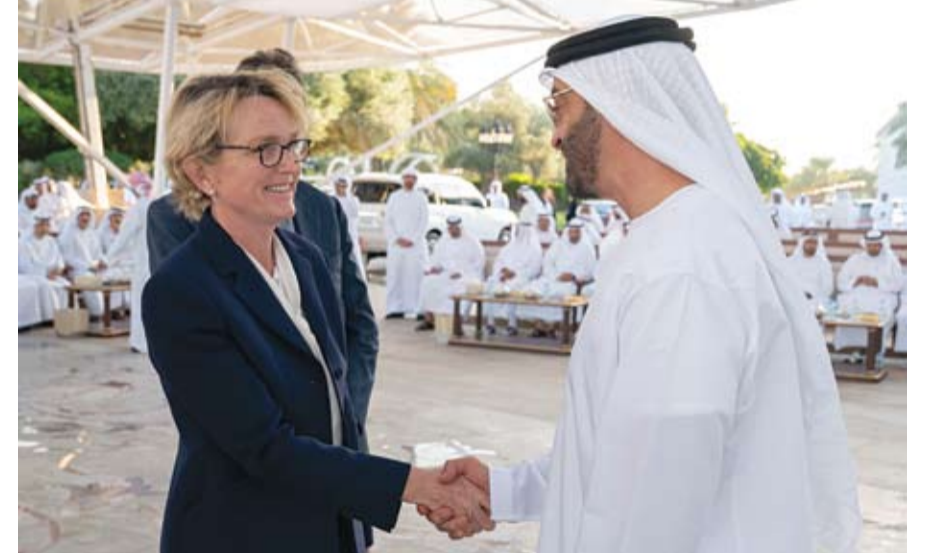
استقبال وفدا من لجنة «كولبير» وابنة الرئيس الفرنسي الراحل شيراك