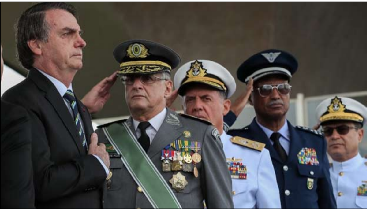
بولسونارو الاب رجل مطافئ لثيران ابائه