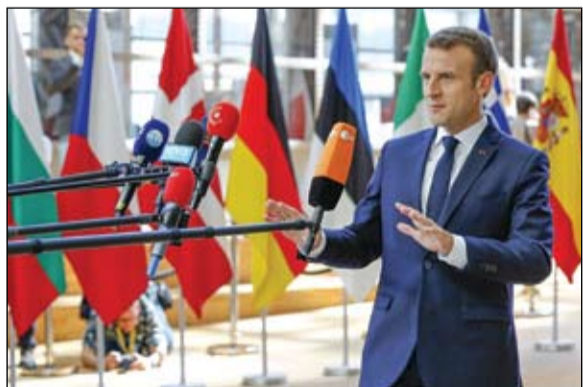
ماكرون وهاجس الامن الاوروبي

مدد المجلس الأوروبي في بروكسل أمس التدابير التقييدية ضد فنزويلا لمدة عام واحد، حتى 14 نوفمبر 2020. وتشمل التدابير التي تم إقرارها على هامش اجتماعات وزراء خارجية الاتحاد الأوروبي فرض حظر على الأسلحة والسفر وتجميد الأصول على 25 فرداً مدرجين في وظائف رسمية.