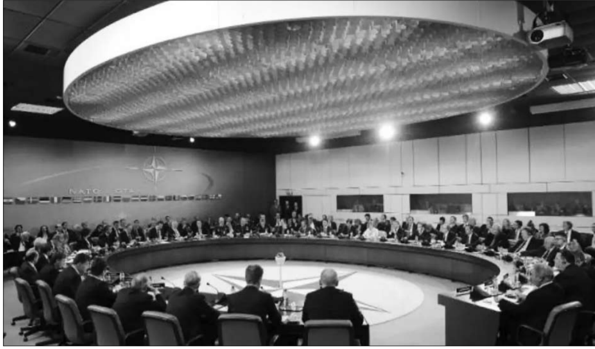
الاطلسي.. اي دور في المستقبل؟

تصريحات إيمانويل ماكرون الأخيرة، التي قال فيها إن الناتو في حالة موت سريري، استفزت وأثارت أسئلة، ولكنها أعادت إلى السطح مجدداً مسألة دور الناتو والحاجة اليه.