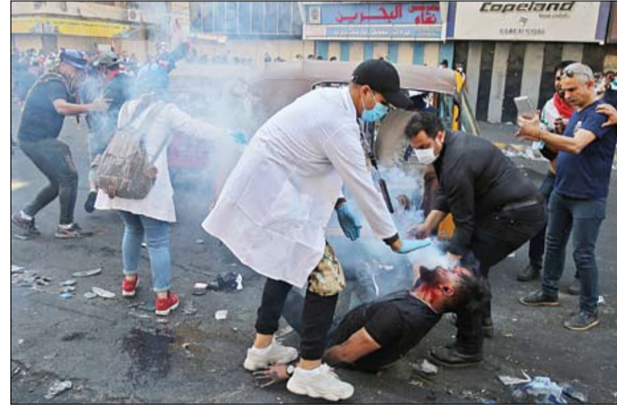
متظاهري عراقي أصيب في الاشتباكات مع قوات الأمن في بغداد

العراق على وقع احتجاجات تدعو لمحاربة الفساد ومحاسبة النخبة الحاكمة التابعة لقوى خارجية على رأسها إيران، والتي وجدت موطناً قدام كبيراً في البلاد عقب الغزو الأميركي في سنة 2003. ويوم الاثنين، قالت مبعوثة الأمم المتحدة إلى العراق، جينين بلاسغارت، إنه لا محيد عن سلك طريق آخر في العراق، إذا لم تكن الرئاسات الثلاث قادرة على تلبية مطالب المتظاهرين، في إشارة إلى كل من رئاسة الجمهورية والحكومة والبرلمان. وذكرت بلاسغارت التي تزور المرجع الشيعي الأعلى في العراق، علي السيستاني، الاثنين، أن البلاد لا يمكن أن تكون ساحة للخصومة السياسية، وشددت على ضرورة احترام سيادته من قبل الجميع. لكن مبعوثة الأمم المتحدة قولت بانتقادات وسط المتظاهرين، في وقت سابق، ورأى الغاضبون أنها لم تكن حازمة في انتقاد حملة القمع الشرسة التي تعرض لها الغاضبون، رغم التزامهم بالسلمية.