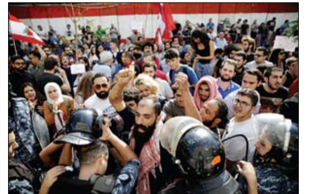
لبنانيون يتظاهرون أمام مقر المصرف المركزي (ا ف ب)

وارد لأن لبنان يعتمد على النقل الحر للأموال. ودعت نقابات واتحادات عمالية في لبنان إلى الإضراب العام في جميع أنحاء البلاد، اليوم الثلاثاء، وسط استمرار المظاهرات والاحتجاجات بمختلف المناطق والساحات، مع دخول الحراك الشعبي، الاثنين، يومه السادس والعشرين. وأعلنت نقابة موظفي مستخدمي الشركات المشغلة لقطاع الخلوي في لبنان بدء إضراب مفتوح، والتوقف عن العمل في شركتي أفا وتاتش. قال حاكم مصرف لبنان المركزي رياض سلامة أمس الاثنين إن الودائع في البنك محمية، وأن للبنك المركزي الامكانيات لحفظ استقرار سعر صرف الليرة اللبنانية، المربوط بالدولار. وقال سلامة في مؤتمر صحافي نقله التلفزيون، إن البنك اتخذ إجراءات لحماية الودائع. وأضاف أن فرض قيود على حركة رؤوس الأموال، غير