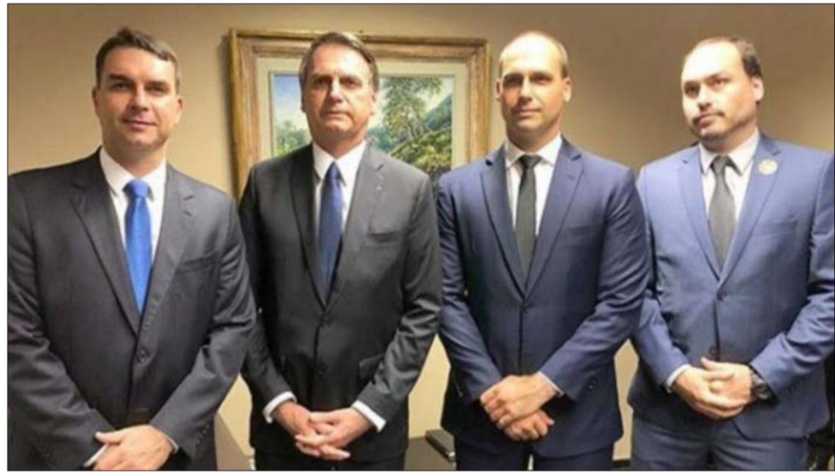
ال بولسونارو البرازيل في قبضة يمين متشد

وتعتمد، وتختطف السلطات العليا مثل القناصل والسفراء ورجال الشرطة وسكرين، قال ادواردو بولسونارو. و إذا تطرف اليسار إلى هذه الدرجة، سيعتبر علينا الرد، وهذه الإجابة يمكن أن تكون نسخة جديدة من القانون المؤسسي رقم 5، ويمكن أن يكون تشريعا معتمدا عبر الاستفتاء. صحيح أنه بالنسبة لآل بولسونارو، يجسد اليسار ما هو أسوأ، وبالطبع، كل شيء بسبب إخطائه. الرئيس البرازيلي، الذي اعتاد التقليل من