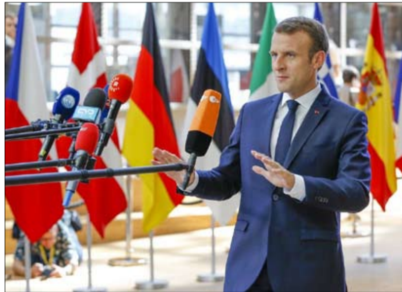
ماكرون وهاجس الامن الاوروبي