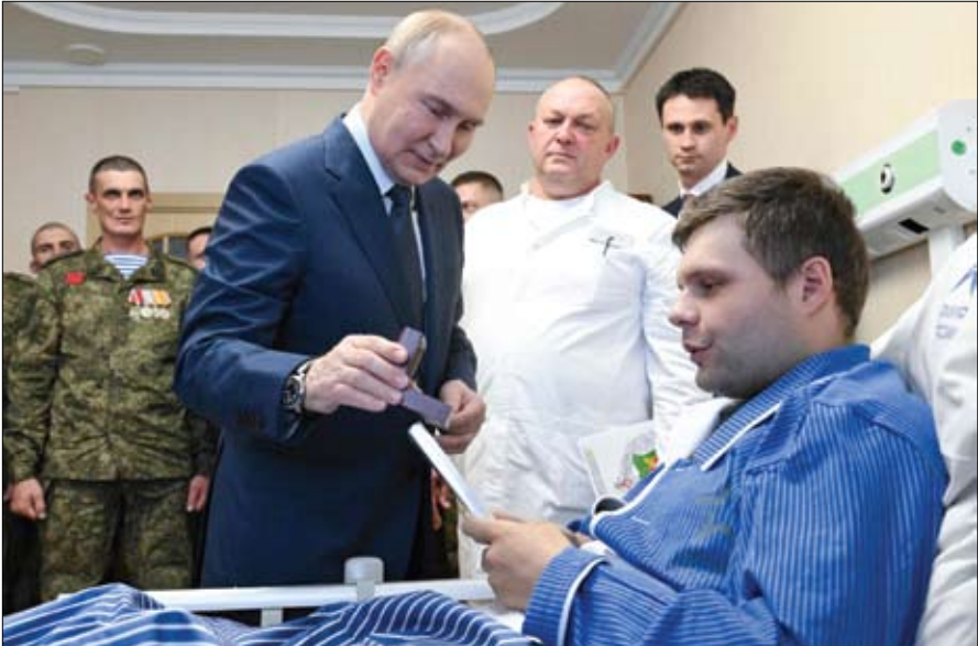
الرئيس الروسي يمنح ميدالية لأحد الجنود الجرحى أثناء زيارته مستشفى عسكرياً في موسكو.

في غضون ذلك قالت السلطات الروسية، أمس الأربعاء، إن أوكرانيا أرسلت طائرات مسيرة باتجاه موسكو ليلية الثالثة على التوالي، واستهدفت عدة مناطق