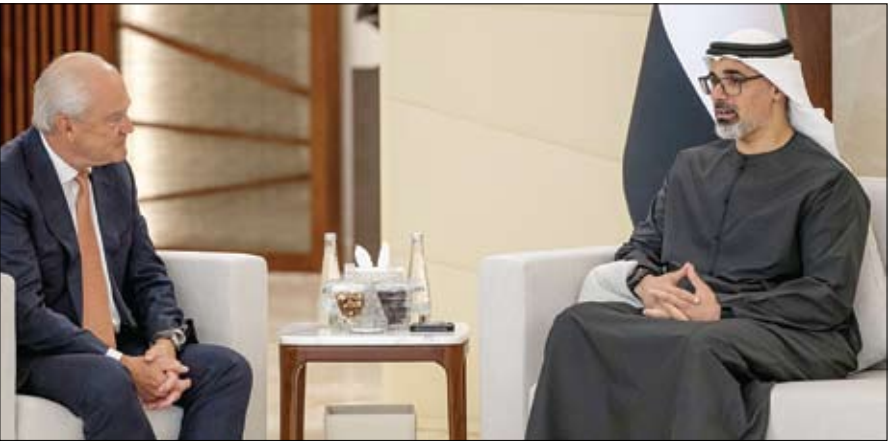
ولي عهد أبوظبي خلال لقائه رئيس مجلس إدارة شركة أسترازينيكا

وحمل كل طرف الآخر مسؤولية فشل المحادثات.