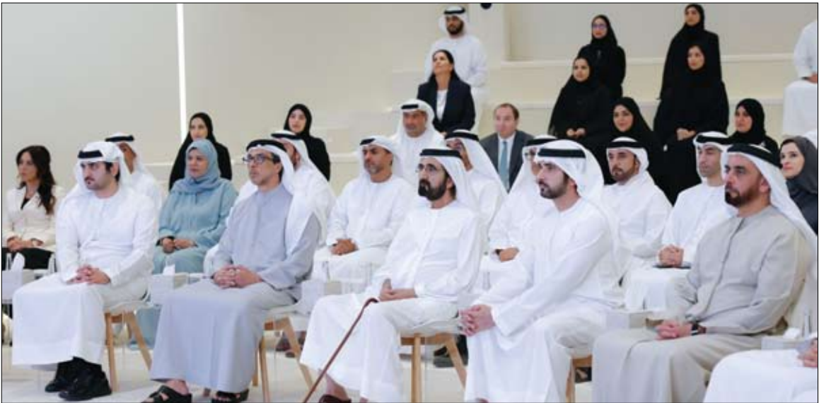
محمد بن راشد خلال اطلاقه منظومة التطوع والمشاركة المجتمعية بحضور منصور بن زايد

بمختلف تنوعاتها وأشكالها لتعزيز مساهمتها في التنمية المستدامة. وقال صاحب السمو الشيخ محمد بن راشد آل مكتوم: أطلقنا في عصر الوطن منظومة الإمارات للتطوع والمشاركة المجتمعية والتي تتضمن إستراتيجية شاملة للتطوع الوطني لتصل قاعدة المتطوعين 600 ألف متطوع وإطلاق منصة متكاملة لهم.