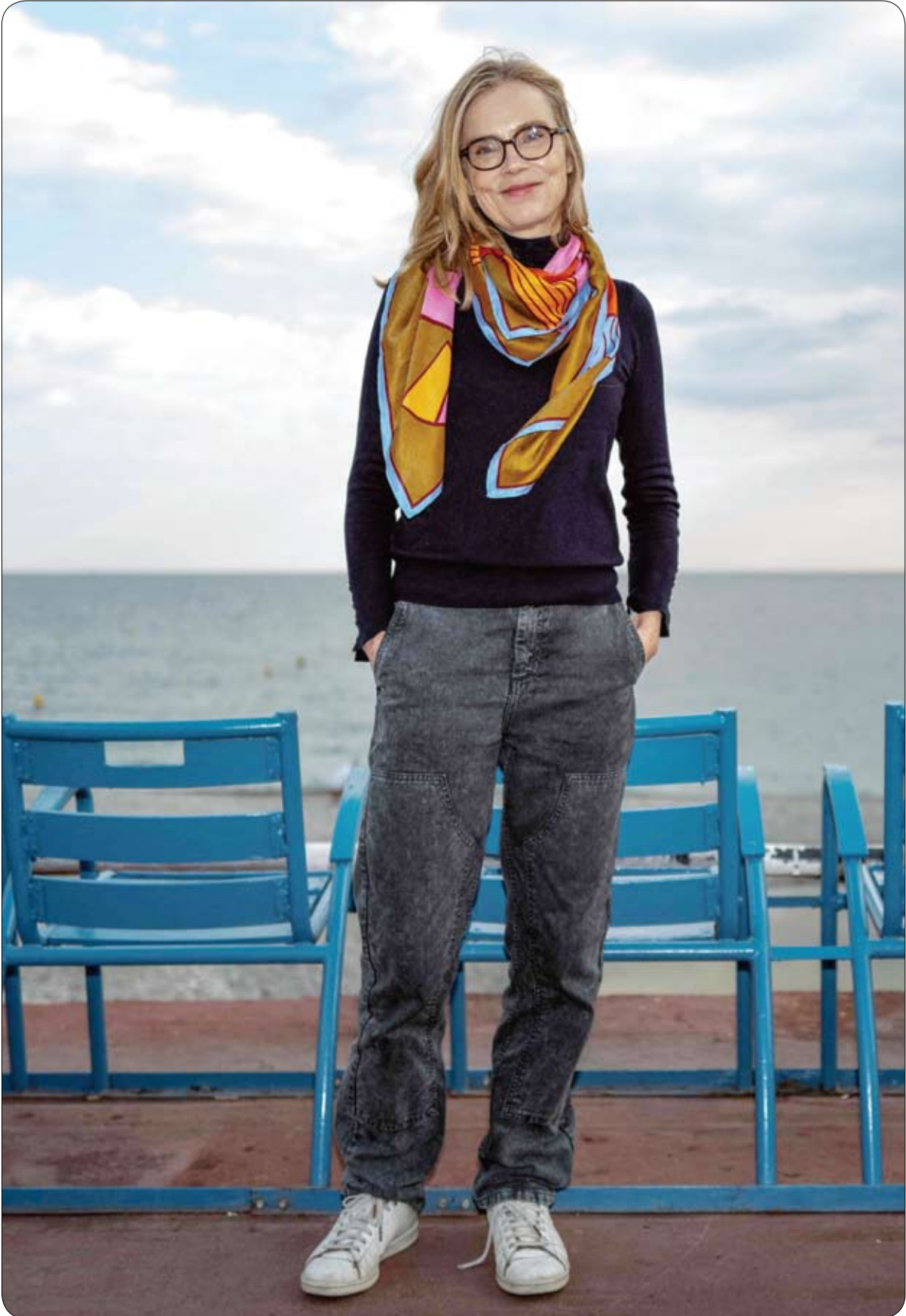
الممثلة الفرنسية إيزابيل كاريه خلال جلسة تصوير لفيلم "الأحلام" ضمن فعاليات مهرجان سينييرومان السينمائي.