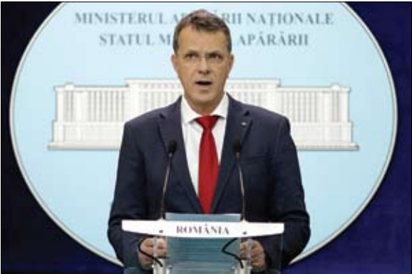
وزير الدفاع الروماني خلال مؤتمر صحفي حول خفض القوات الأمريكية

وقال مسؤول في الناتو حتى مع هذا التعديل، فإن وجود القوات