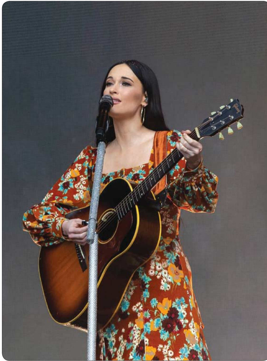
الغنية وكاتبة الأغاني الأمريكية كاسي موسغريفز تشدو على خشبة المسرح خلال مهرجان الموسيقى لمدينة أوستن، تكساس. ا ه ا ب

علاج التهاب الحلق الشديد قد يكون بمضادات الالتهاب مصحوباً ببعض الأدوية المسكنة، والعلاجات المنزلية البديلة التي تخفف الألم، من دون إغفال الأدوية التي تعالج السبب الرئيسي لالتهاب الحلق. تعرفوا في الآتي على علاج التهاب الحلق الشديد: لا تهدف هذه العلاجات إلى معالجة سبب التهاب الحلق، وإنما للتخفيف عن الشخص المريض. وبناءً عليه فإن علاج الأعراض سوف يرافق العلاج الأساسي لسبب التهاب الحلق. ومن أجل تهدئة الألم وتخفيف الحمى، يمكن أخذ مسكن من نوع الباراسيتامول، ومضادات الالتهاب غير الستيرويدية، في حال عدم وجود موانع ولمدة قصيرة إذا بدا أن التهاب الحلق أصله فيروسي (حيث إنه تم اتهامها بأنها تعزز الإصابة بالتهاب اللوزتين الجرثومي). اضيفي العسل إلى الليمون لعلاج ألم الحلق وعلى المستوى الموضعي يمكن استخدام غسولات الفم أو حبوب المص، أو الغرغرة مع المطهرات. كما أن الحليب الساخن المضاف إليه العسل، أو العسل والليمون، لها خصائص مطهرة ولطيفة. وفي حال وجود الحمى يجب تعويض خطر حدوث الجفاف بشرب الكثير من السوائل.