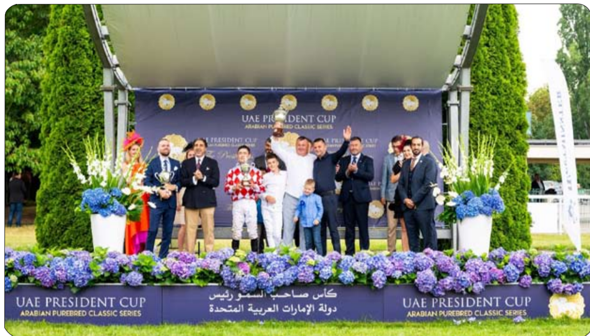
الإدارة مضمرا سلوزويك البولندي العربية والمكانة المتطورة التي وللقائمين على سباقات الخيول تحظى بها في وارسو. في عام 2024، موجها الشكر مكمساً جديداً لأجندة السباقات والارتقاء بالسباقات. وأعرب عن فخره بالتناجحات المهمة التي تمثل

حققت المحطة البولندية الرابعة لسلسلة سباقات كأس صاحب السمو رئيس الدولة للخيول العربية الأصيلة بنسختها الـ 31، نجاحاً كبيراً، وذلك في ختام ديربي وسط أوروبا، الذي أقيمت منافساته على مضمار سلوزويك في العاصمة وارسو أمس الأول الأحد وسط حضور 15 ألف متفرج. وفاز «باد جاي بومبادور» بلقب سباق المحطة البولندية، بعد تألقه وقيادته لمجموعة الخيول المشاركة في منعطف نهاية السباق الذي أقيم