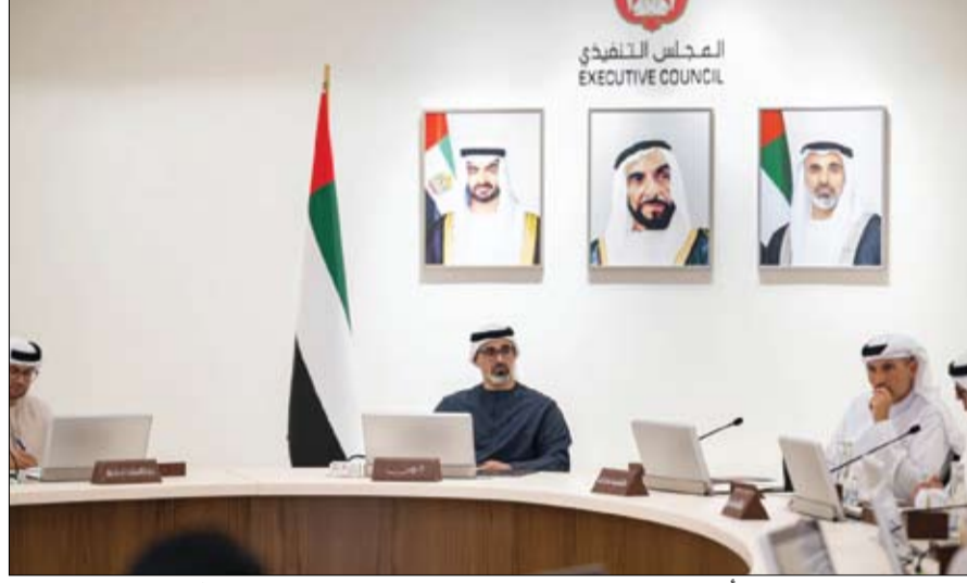
ولي عهد أبوظبي خلال ترؤسه اجتماع المجلس التنفيذي للإمارة (وام)

حذرت شرطة أبوظبي الجمهور من تجدد أساليب النصب والاحتيال واستدراج الضحايا بطرق مضللة يتم بموجبهما الاحتيال عليهم من خلال عرض صور عقارات وهمية بمبالغ رمزية في وسائل التواصل الاجتماعي حيث يقوم الضحية بوضع عربون للعقار ثم يكتشف بأنه وقع ضحية نصب واحتيال. وأكدت شرطة أبوظبي على ضرورة الالتزام بضوابط الجهات المعنية في توثيق العقود الإيجارية، ألا يكون خفض الضمان المعتمد، دافعا للوقوع ضحية للاحتيال العقاري. ودعمت الشرطة الجمهور إلى اتخاذ التدابير الوقائية، من خلال التواصل مع مكاتب العقارات المعتمدة، والطلب من الوسيط أو المندوب إبراز الهوية الإماراتية، وتسجيل بياناتها، وعدم إعطائهم الأوراق الثبوتية إلا في تلك المكاتب، واستلام الإيصالات المختصة، والاحتفاظ بالعقود الرسمية، والتأكد من تسجيل العقار في الدائرة الحكومية المعنية. (التفاصيل ص2)