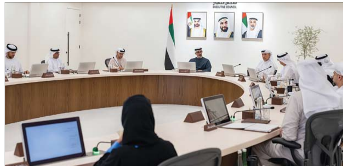
ترأس اجتماع المجلس التنفيذي لإمارة أبوظبي