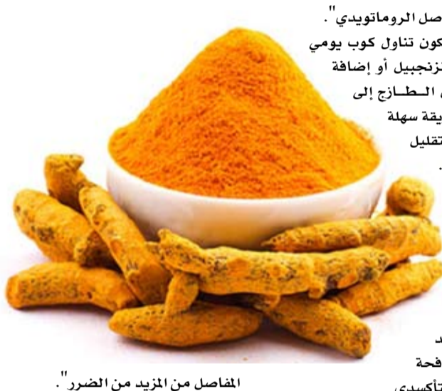
المفاصل من المزيد من الضرر.

زيت الزيتون يُعرف زيت الزيتون البكر الممتاز بأنه غني بمضادات الأكسدة والدهون الصحية، وخصوصاً مركب الأوليكينثال الذي يُشبه تأثير الإيبوبروفين في تقليل الالتهابات.