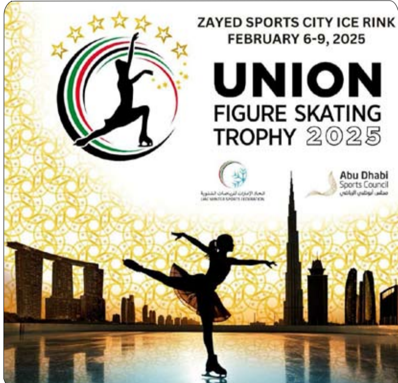
البطولة في ظل المشاركة الكبيرة المتوقعة من النجوم من مختلف دول العالم، مشيرة إلى الارتقاء بقدرات لاعبي ولاعبات الإمارات.