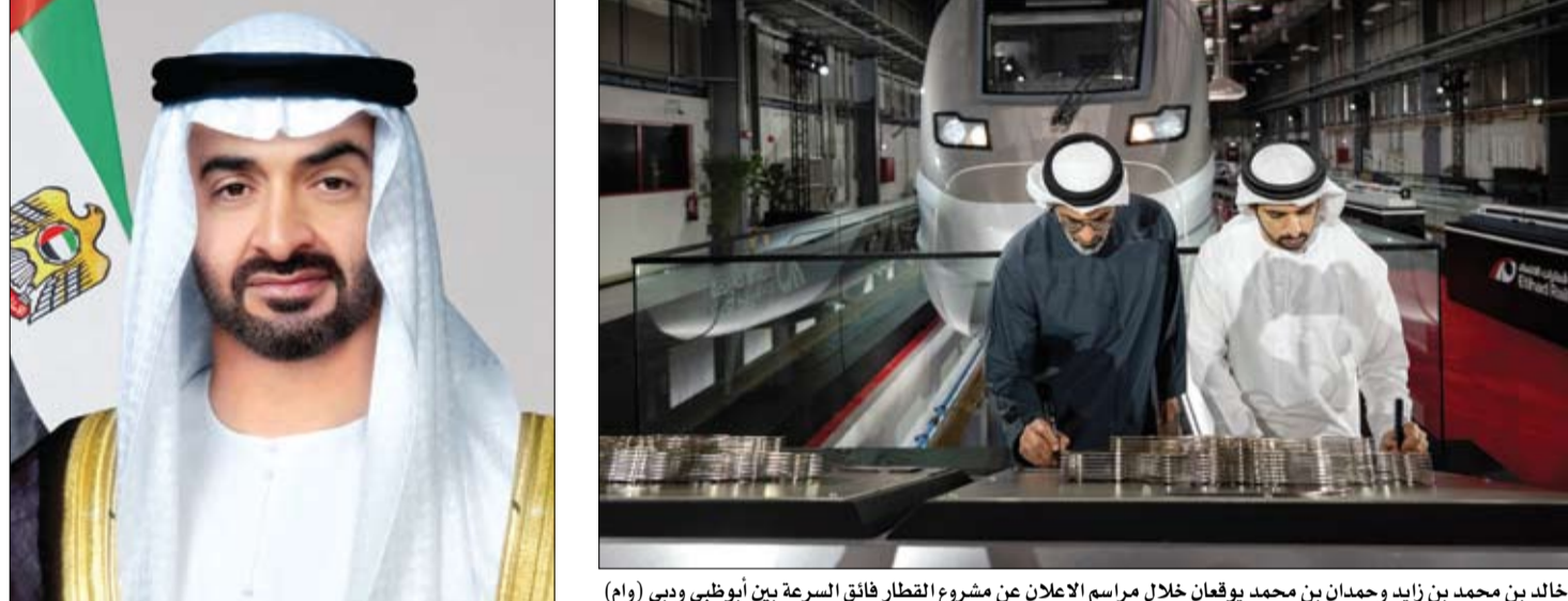
خالد بن محمد بن زايد وحمدان بن محمد يوقعان خلال مراسم الإعلان عن مشروع القطار فائق السرعة بين أبوظبي ودبي

قال سمو الشيخ منصور بن زايد آل نهيان نائب رئيس الدولة، نائب رئيس مجلس الوزراء، رئيس ديوان الرئاسة في تدوينة على حساب سموه الشخصي في منصة (كس): المناص، ليس مجرد رياضة، بل هو إرث نفخر به ونعيشه بكل تفاصيله. لقد كان قديماً، هو مدرسة تعلمنا فيها معاني الصبر، التحدي، والاعتماد على النفس. المناص يعيدنا إلى زمن جميل يحمل قيماً أصيلة، غرسها فينا الشيخ زايد بن سلطان آل نهيان، طيب الله ثراه. لقد كان قديماً، الأولى في ترسيخ هذا التراث في نفوسنا، واليوم، نسير على خطاه، نحافظ عليه، ونورثه لأبنائنا بكل فخر واعتزاز.