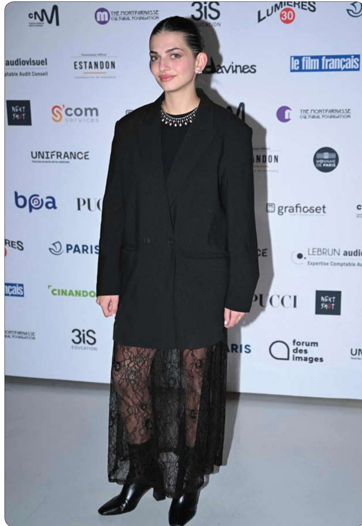
الممثلة الفرنسية غيفانا بينيديتي خلال جلسة التصوير الخاصة بحفل توزيع جوائز السينما الـ 28 Ceremonie des lumieres في باريس.

ويحدث حمل التوائم عندما يتم تخصيب بويضتين منفصلتين في الوقت نفسه، أو عندما تنقسم البويضة الخصبة إلى اثنتين.