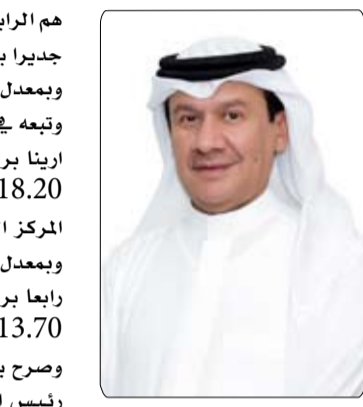
الميدع الذي حقق العلامة الكاملة في ثلاث جولات من 10 جولات

غير مسبوقه بسبب البنية التحتية الرائعة التي تمتلكها الولة والمتمثلة في النفق الهوائي الاضخم والاعلى في العالم وأشار الحمادي الى أن البطولة الحالية تضمنت المنافسة في سباق القفز لمجموعة من الفئات ممثلة في المطاردة الفردية، سباق التتابع، والسباق النهائي. وأكد ان اتحاد الإمارات للرياضات الجوية يهدف إلى تعزيز مكانة الإمارات كوجهة رياضية عالمية، ودعم رياضة القفز الحر على المستويات المحلية والإقليمية والعالمية.