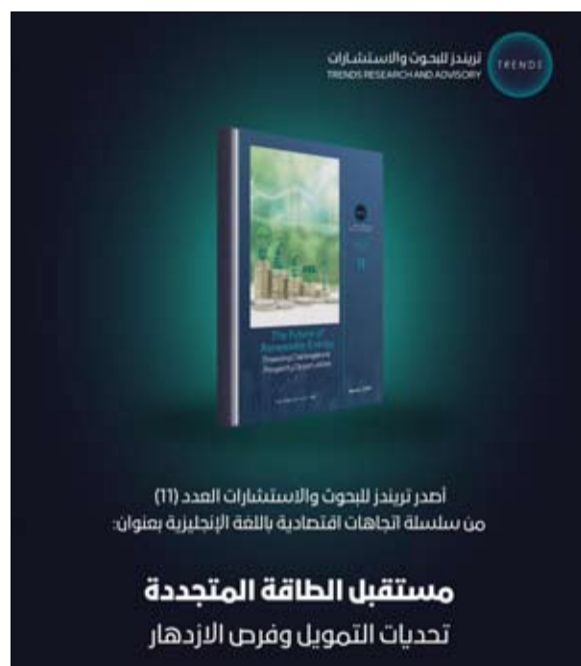
أصدر تريندز للبحوث والاستشارات (TRENDS) من سلسلة الأبحاث المتعددة اللغة الإنجليزية بعنوان: «مستقبل الطاقة المتجددة: تحديات التمويل وفرص الازدهار»

وتناول الفصل الثالث الأدوات المالية المتاحة لدعم مشروعات الطاقة المتجددة، مثل القروض الاستثمارية والاستثمارات المباشرة. كما استعرض أبرز التحديات، مثل المخاطر الاقتصادية والسياسية التي قد تعيق تحقيق التمويل المستدام، مشيراً إلى فرص جديدة للتهوض بهذا القطاع. واستعرض الفصل الأخير الدور المحوري الذي تلعبه صنابير المناخ والبنوك الدولية والاستثمارات الأجنبية المباشرة في سد الفجوة التمويلية لقطاع الطاقة المتجددة. كما قدمت الدراسة توصيات عملية لتعزيز