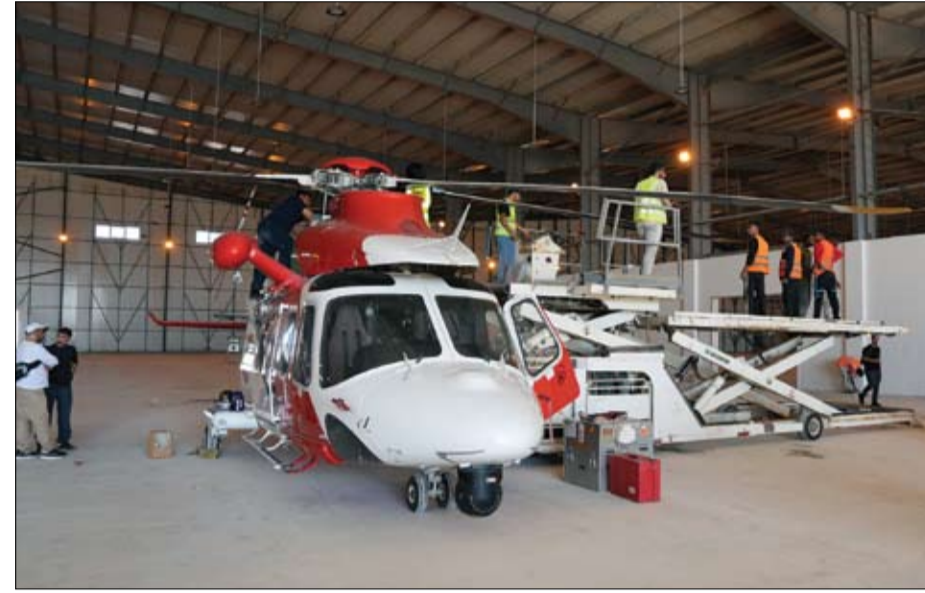
استمرار الجسر الجوي الإماراتي لإغاثة الشعب الليبي الشقيق جراء الفيضانات

بقيمة تتجاوز الـ 3 مليارات درهم سيف بن زايد يشن جهود شرطة دبي لاجتثاث واحدة من أكبر عمليات تهريب الكبتاجون على مستوى العالم •• أبو ظبي - وام اطلع الفريق سمو الشيخ سيف بن زايد آل نهيان نائب رئيس مجلس الوزراء وزير الداخلية، على تفاصيل العملية النوعية لشرطة دبي والتي كشفت مخططات عصابة دولية إجرامية، وضبط واحدة من أكبر عمليات تهريب الكبتاجون على مستوى العالم في عملية أطلق عليها اسم ستورم. وأكد سموه أن الإمارات بحكمة ورؤية القيادة الرشيدة وتوجيهاتها المستمرة، ستبقى واحة للأمن وعنوانا للأمان، وستكون بالمرصاد لكل من تسول له نفسه العبث بأمن وسلامة المجتمع الإماراتي، مؤكدا سموه أن الجهات المعنية في دولة الإمارات العربية المتحدة قادرة على تطبيق واحباط أنشطة العصابات ومروحي المخدرات وإفشاء مخططاتهم الدنيئة، لتبني الإمارات عصبة على المجرمين وتجارة السموم. جاء ذلك خلال استقبال سموه فريق شرطة دبي بحضور اللواء الركن خليفة حارب الخيلي وكيل وزارة الداخلية، ومعالي الفريق عبد الله خليفة المري القائد العام لشرطة دبي، واللواء خبير خليل إبراهيم المنصوري مساعد القائد العام لشؤون البحث الجنائي في شرطة دبي، واللواء عبد محمد ثاني حارب مدير الإدارة العامة لمكافحة المخدرات، والعميد خالد بن موزة نائب مدير الإدارة العامة لمكافحة المخدرات بشرطة دبي، وعدد من الضباط. (التفاصيل ص 3)