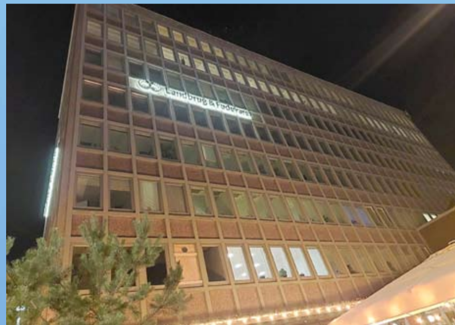
مركز الزراعة والغذاء الدنماركي