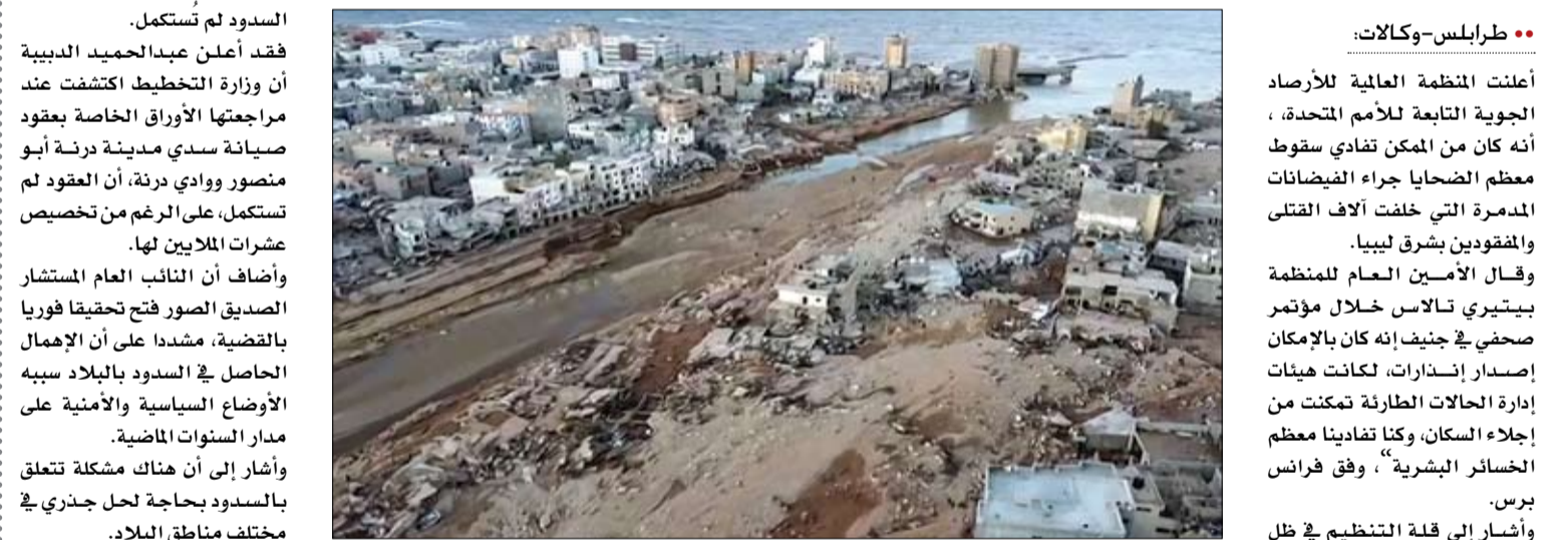
منظر جوي للأضرار الناجمة عن الفيضانات في مدينة درنة شرق ليبيا.

السدود لم تستكمل. فقد أعلن عبد الحميد الديبية أن وزارة التخطيط اكتشفت عند مراجعتها الأوراق الخاصة بعقود صيانة سدي مدينة درنة الذي منصور ووادي درنة، أن العقود لم تستكمل، على الرغم من تخصيص عشرات الملايين لها. وأضاف أن النائب المستشار الصديق الصور فتح تحقيقا فوريا بالقضية، مشددا على أن الإهمال الحاصل في السودان بالبلاد سببه الأوضاع السياسية والأمنية على مدار السنوات الماضية. وأشار إلى أن هناك مشكلة تتعلق بالسدود بحاجة لحل جذري في مختلف مناطق البلاد. كما تابع في كلمته باجتماع للحكومة عقده لمتابعة أوضاع السودان مع وزارة الموارد المائية وبت عبر فيسبوك، إلى استدعاء النيابة مسؤولي التخطيط، لاستيضاح تفاصيل منهم. وأعلن أن انفجار السدين من أسباب الكارثة.