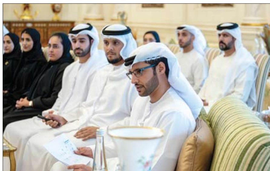
مواهبهم لدعم مسيرة التنمية الوطنية، وتحقيق تطلعاتهم. وأكد سمو الشيخ هزاع بن زايد آل نهيان، أن الشباب هم الثروة الحقيقية للوطن، والركيزة الأساسية في بناء مستقبله، ولذلك تولى دولة الإمارات، بقيادة صاحب السمو الشيخ محمد بن زايد

لهم للإبداع والتميز، وذلك من خلال إشراكهم في مجالس الشباب التي توفر منظومة حيوية للحوار والتطوير والابتكار، وتساهم في دعم تحويل أفكارهم إلى مشاريع رائدة تخدم أفراد المجتمع. وشهد سموه، خلال اللقاء، على أن الإنجازات التي حققتها مجالس الشباب تُعبر عن عزم شباب دولة الإمارات وإبداعهم في بناء مستقبل مشرق لوطن، وتشكل مصدر إلهام للأجيال المقبلة في قيادة العمل الشبابي الوطني، وتؤكد أن الشباب الإماراتي قادر على تحقيق الإنجازات العالية، وأن دولة الإمارات ستظل داعمة لهموسحاتهم، وستوفر البيئة الخصبة لتمكينهم وتحقيق تطلعاتهم، ترسيخاً لريادتها في مجال دعم الشباب والاستثمار في طاقاتهم وإبداعاتهم.