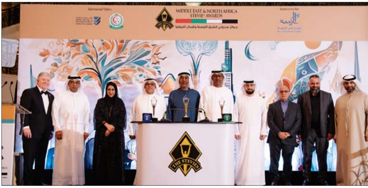
من النخبة المبدعين والمبتكرين على أرض الامارات، وفي رحاب إمارة رأس الخيمة، التي ترحب دوماً بضيوف الإمارات على مختلف أوانهم ومشاريعهم يحاطون بكل مظاهر الود والتكريم والترحيب، وأثنى على القائمين على الجائزة وعطاءاتهم الفاعلة في إنجاح هذا المهرجان السنوي، الذي تستضيفه إمارة رأس الخيمة على مدار خمس سنوات

رأس الخيمة-الضجر: شهدت إمارة رأس الخيمة حفل تكريم الفائزين بجوائز ستيفي الشرق الأوسط وشمال أفريقيا لعام 2025. في دورتها السادسة والذي أقيم بفندق والدورف أستوريا.. حيث ترشح للجائزة 1100 مرشح فاز منهم 162 فائزاً حصداً و393 جائزة ما بين ذهبية وفضية وبرونزية. كان نصيب الأسد من حصص الجوائز لـ دولة الامارات العربية المتحدة، حيث فاز 66 مؤسسة من حكومية وخاصة وحصداً 157 جائزة، تليها المملكة العربية السعودية بفوز 33 فائزاً بـ 86 جائزة، تليها تركيا 25 فائزاً حصداً 44 جائزة، فقطر 21 فائزاً بـ 5 فائزين بـ 18 جائزة، فايران 4 فائزين بـ 31 جائزة، فالكويت جائزة، وتتوالى بعد ذلك تونس، ف لبنان، ف مصر، فالاردن، وعمان، ف خضوعاً جميعاً للتقييم وفق معايير عالمية، من قبل لجان تحكيم على أعلى مستوى يمثلون 118 محكماً وخبيراً.