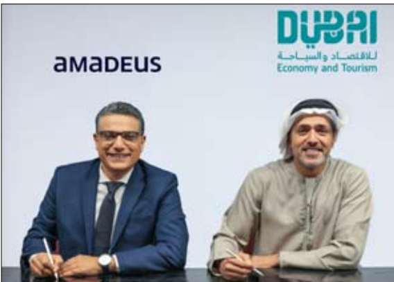
بعدد من المبادرات المتعلقة بتحسين رحلة المسافرين من خلال التركيز على استخدام المقاييس الحيوية، وكذلك ارتفاع تجارب الزوار في