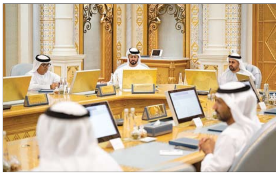
الحيثية التي أسهمت في تحقيق أهداف الدورة السابعة للبرنامج. وقال سمو الشيخ ذياب بن محمد بن زايد آل نهيان، إن الدورة السابعة للبرنامج تعكس جهود وتوجيهات سمو الشيخة فاطمة بنت مبارك "أم الإمارات"،

الابتكار الاجتماعي وتحقيق التنمية المستدامة للأفراد والمجتمعات، مؤكداً حرص سموها الدائم على تفعيل دور أفراد المجتمع وإشراكهم في إيجاد حلول مبتكرة ومستدامة للتحديات التي تواجه مجتمعاتهم، من خلال إبراز التميز والابتكار من الأفراد والمؤسسات، والاعتراف بإنجازاتهم وإسهاماتهم وتقديرهم ودعمهم. وقال سموه إن جهود سمو الشيخ ذياب بن محمد بن زايد آل نهيان، تشكل محركاً أساسياً لنجاح البرنامج وتحقيق الدورة السابعة لأهدافها التي تركز على دعم الابتكار المجتمعي، وتعزيز المشاركة الفاعلة من جميع فئات المجتمع.