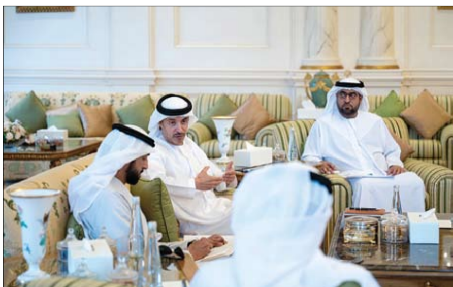
كما استمع سموه إلى شرح حول خطة عمل المجلس للعام الجاري، ودور مجالس الشباب في تعزيز مشاركة الفئات الشابة وتسخير المجتمع في المجالات المختلفة، وتكثفت مؤخرا بحصولهم على جائزة أفضل مبادرة مجتمعية عن بطولته "التبة".

استقبل سمو الشيخ هزاع بن زايد آل نهيان، ممثل الحاكم في منطقة العين، وفداً من المؤسسة الاتحادية للشباب ومجلس العين للشباب. حضر اللقاء، الشيخ محمد بن حمدان بن زايد آل نهيان، ومعالي الدكتور سلطان بن سيف النيايدي، وزير دولة لشؤون الشباب وسعادة خالد محمد النعيمي، مدير المؤسسة الاتحادية للشباب. واستعرض سموه مع الوفد، دور المجالس الشبابية في تحقيق مستهدفاتها في تمكين الشباب وبناء قدراتهم، وخططهم المستقبلية لاستثمار طاقاتهم، بما يتوافق مع رؤية القيادة الرشيدة ومستهدفات الأجندة الوطنية للشباب 2031.