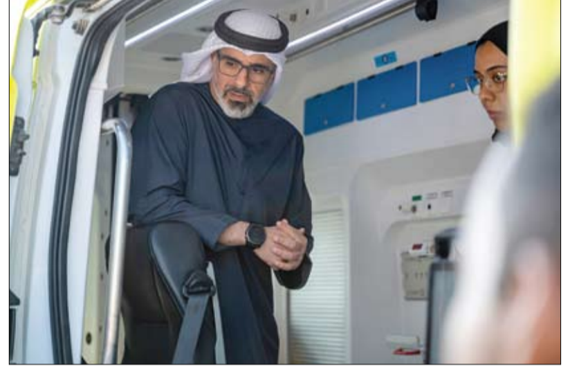
اطلع على منظومة مركز قيادة العمليات الطبية الموحدة في أبوظبي