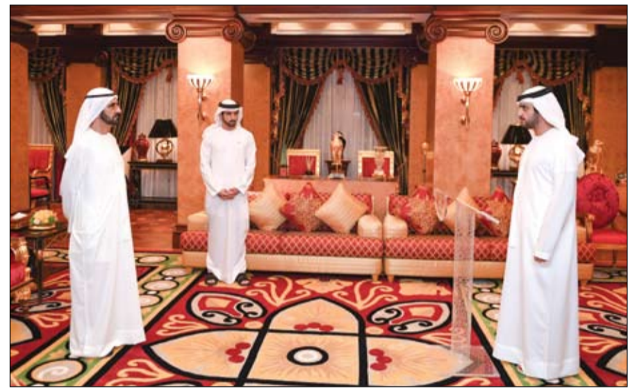
أمام محمد بن راشد .. مكتوم بن محمد يؤدي اليمين القانونية كرئيس لجهاز الرقابة المالية في حكومة دبي

في غضون ذلك .. سقط عدد كبير من عناصر ميليشيات الحوثي الموالية لإيران بين أسرى وقتلى وجرحى وسط تفقهتر متسارع في صفوفها بعد