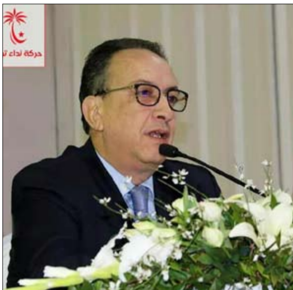
السيسي الابن.. يريد اسقاط الشاهد ابن حزبه