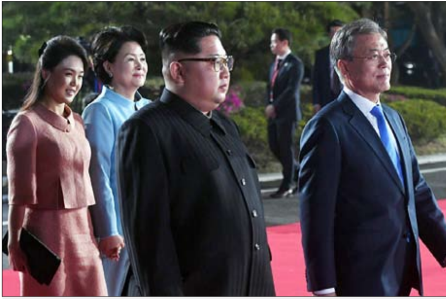
هل تبخرت احلام القمة الاولى

نظم آلاف الأرجنتيين احتجاجا محاولة الحكومة الحصول على خط التمتاني من صندوق النقد الدولي الذي يتحون باللائمة عليه في صعوبات واجهتها البلاد خلال أزمة مالية سابقة. وشارت أحزاب معارضة ونقابات ومنظمات لحقوق الإنسان وفتانون في المسيرة التي جرت قرب المسلة الرمزية في بوينس آيرس تحت شعار "البلاد في خطر". وهذا أكبر احتجاج ضمن سلسلة من عدة احتجاجات تطلعت منذ إعلان الرئيس مورايسيو ماركري في الثامن من مايو ايار إنه بدأ محادثات تمويل مع صندوق النقد الدولي بعد تقبلات شهدتها الأسواق لأسابيع. وفاجأت هذه الخطوة غير المتوقعة المستثمرين وأججت مخاوف الأرجنتيين من تكرار انهيار الاقتصاد الذي عانت منه البلاد في 2001-2002. وأُنحى كثيرون في الأرجنتين باللوم على إجراءات التقشف التي فرضها صندوق النقد الدولي في تقاضم الأزمة التي أدت إلى وقوع الالايين في براثن الفقر وحولت الأرجنتين إلى دولة مبنوذة عالميا بعد أن تخلفت الحكومة عن سداد دين قياسي بلغ حجمه 100 مليار دولار.