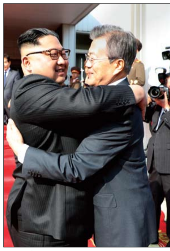
عناق بين زعمي الكوريتين في المنطقة المنزوعة السلاح

ذكرت الشركة المشغلة لمترو الأنفاق في العاصمة الأوكرانية، أن خمس محطات مترو أغلقت، معظمها في وسط العاصمة، بعد إنذار بوجود قنابل.