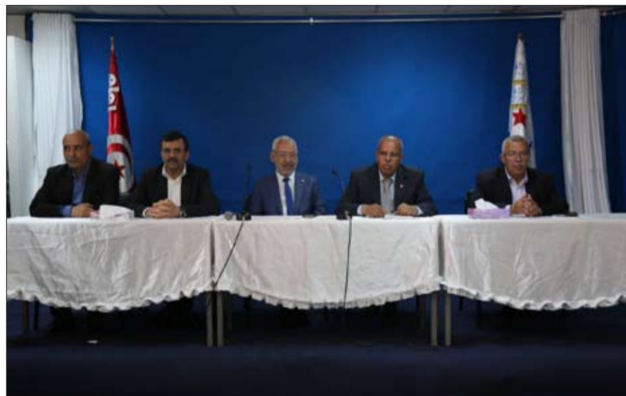
النهضة تتمسك برئيس الحكومة.. ربما إلى حين