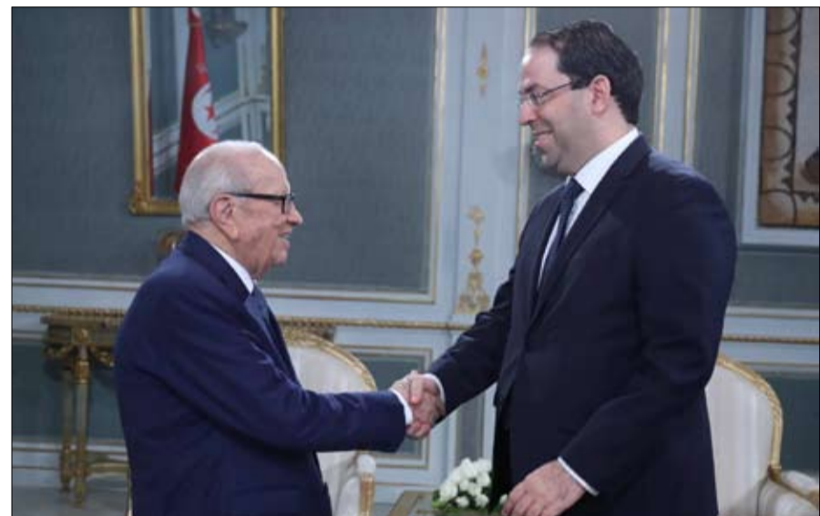
السيسي القى بكرة الشاهد في ملعب الضفراء