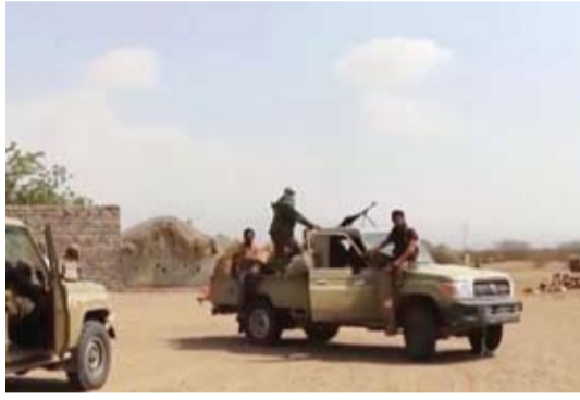
قوات المقاومة اليمنية تصل الى مشارف الحديدة

انتهيار تحصيناتها الدفاعية الرئيسية التي كانت تعول عليها في مفرق زيبيد والفازة. وتواصل قوات المقاومة اليمنية بمختلف تشكيلاتها تقدمها الميداني بشكل متسارع باتجاه الحديدة ومينائها وسط مواجهات مستمرة بين المقاومة ومسلحي الحوثي تكبدت على إثرها الميليشيات هزائم ساحقة وخسائر فادحة في العتاد والأرواح.. فيما فر العشرات من عناصرها من جبهات القتال بعد هجوم واسع لقوات المقاومة اليمنية ومحاصرته من عدة محاور. وتشهد صفوف ميليشيات الحوثي الموالية إلى إيران تراجعاً ميدانياً في مختلف الجبهات بالتزامن مع إطلاق عملية عسكرية واسعة باتجاه الحديدة لتطهيرها من مسلحي الحوثي وحرر المخطط الانقلابي في اليمن والذي باتت نهايته تقترب كثيراً مع توسع رقعة سيطرة المقاومة والتقدم المستمر بجبهة الساحل الغربي.