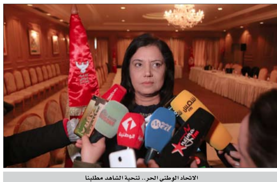
الاتحاد الوطني الحر.. تنحية الشاهد مطلبنا