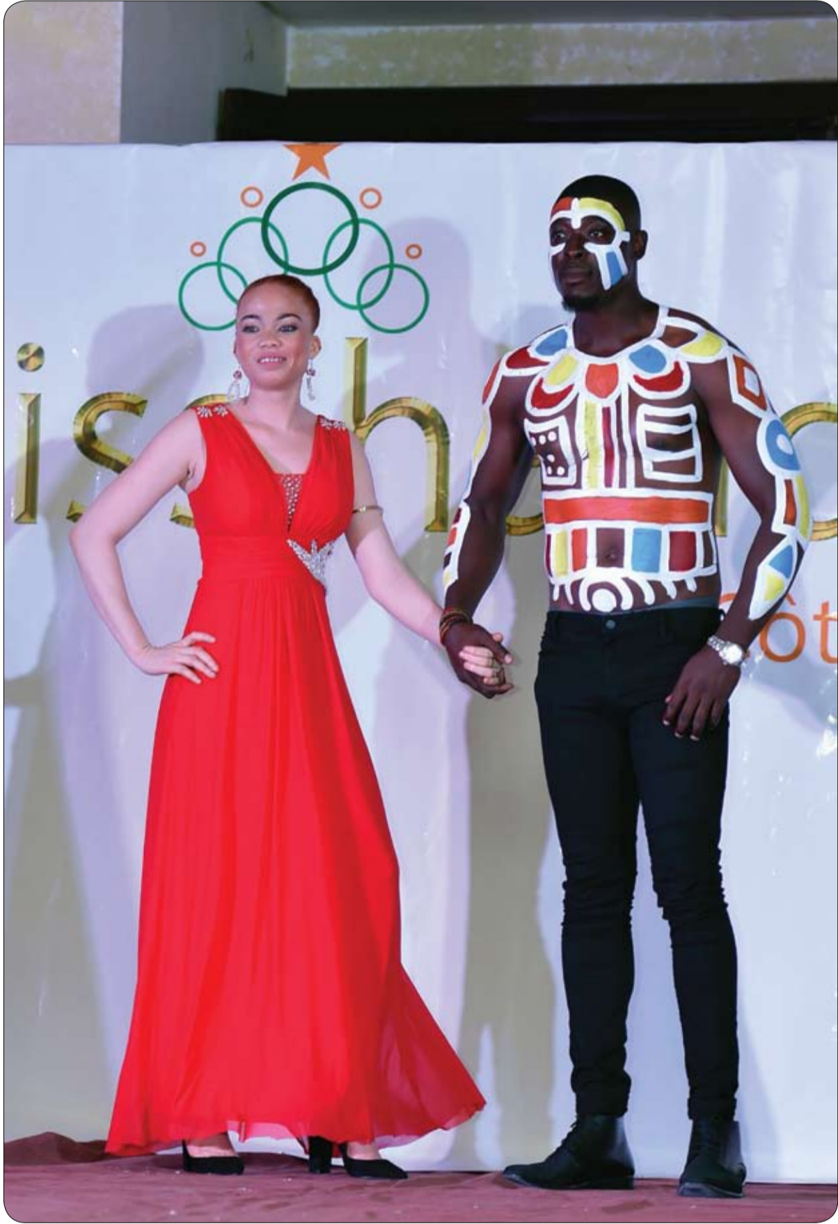
مرشد يقود مرشحة كنيصة على المنصة لسابقة ملكة جمال العاقين بساحل العاج لعام 2018، بهدف تغيير العنصرية بشأن الإعاقة في إفريقيا.