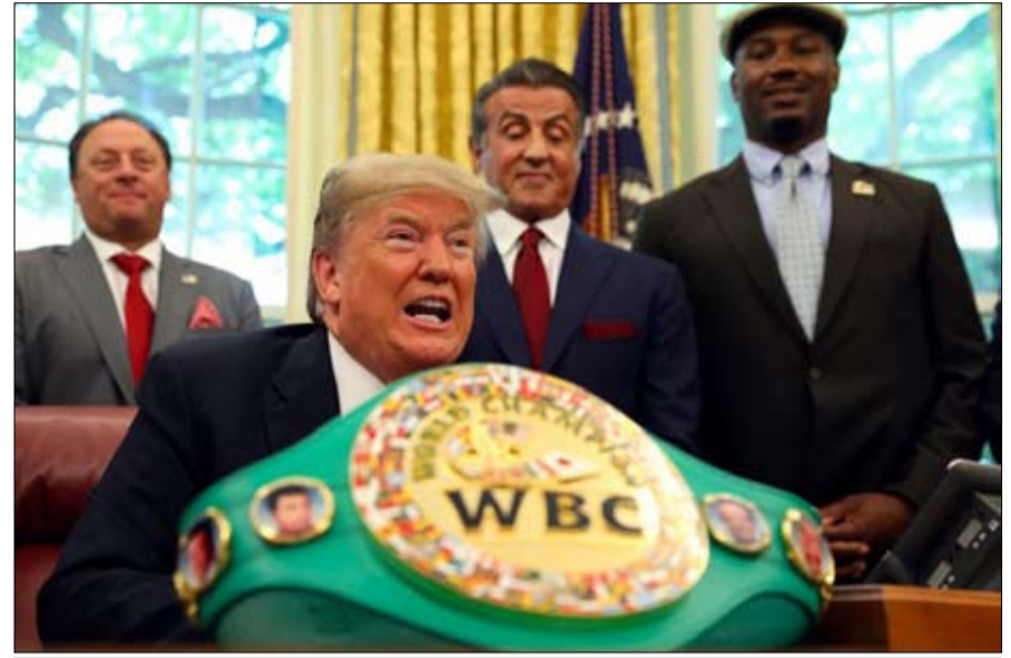
هل حقا يسيطر ترامب على الحلبة الكورية