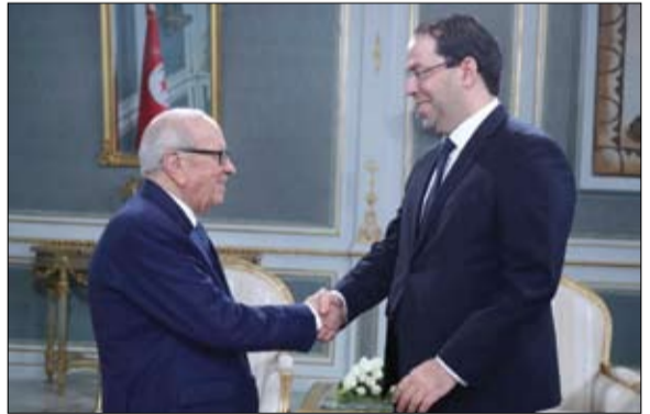
السيسي التي بكرة الشاهد في ملعب الفرقاء

والاجتماع هو أحدث تطور في سلسلة من التطورات الدبلوماسية خلال أسبوع بشأن القمة غير المسبوقة بين الولايات المتحدة وكوريا الشمالية وأقوى إشارة حتى الآن على أن زعمي الكوريتين يحاولان إبقاء جهود عقد القمة في مسارها. وجاءت الحادثات التي استمرت ساعتين بين مون وكيم في قرية بانمونجوم بعد شهر من عقدهما أول قمة في الجانب الجنوبي من الحدود.