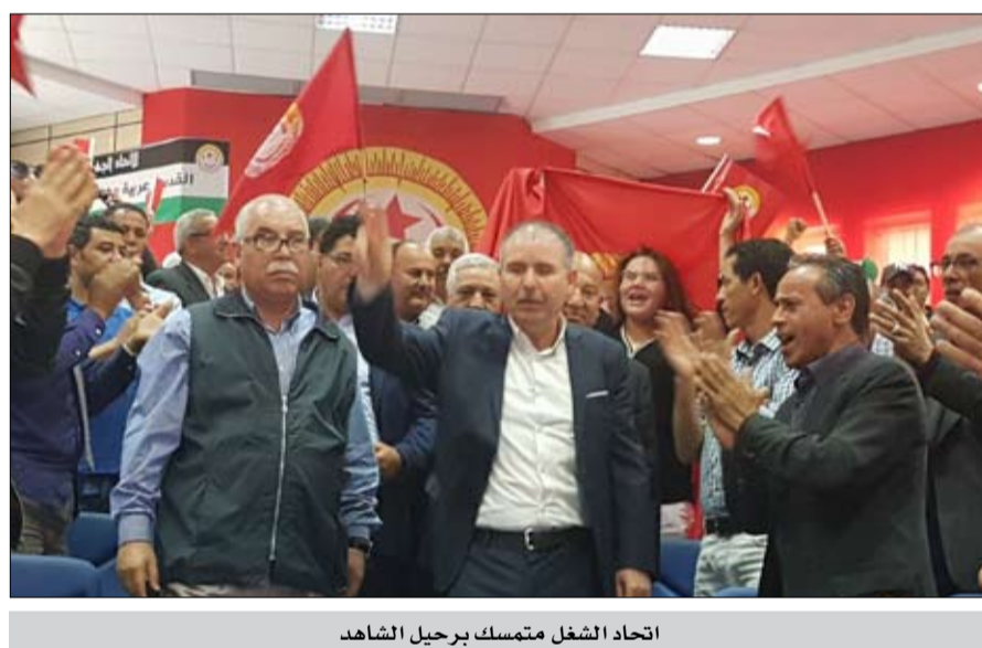
الاتحاد الشغل متمسك برحيل الشاهد