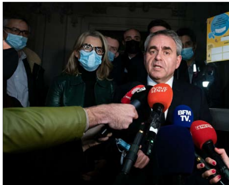
كزافيه برتران، الاوفر حظا وضع نفسه في خدمتها منذ هزيمته

لم تخطئ فاليري بيكريس ابدأ في نوع الانتخابات، ولهذا السبب فازت بها. تلميذة جاك شيراك، اشتهرت في كثير من الأحيان، بالتجديف عكس التيار. خلال الانتخابات التمهيدية لعام 2016، دعمت آلان جوبيه قبل ثلاثة أسابيع من هزيمته. وبعد ثلاث سنوات، انتظرت استقالة لوران وكيز من رئاسة الجمهوريين لتترك الحزب. لقد تعلمت من أخطائها. وهذه المرة، كان لدى الوزيرة السابقة إحساس بالتوقيت.