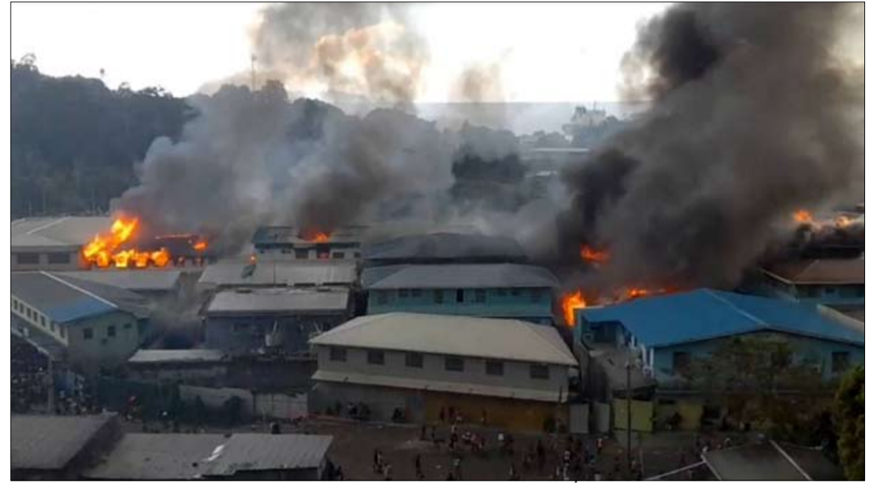
أضرمت النيران في عدة مبانٍ في العاصمة هونيوارا