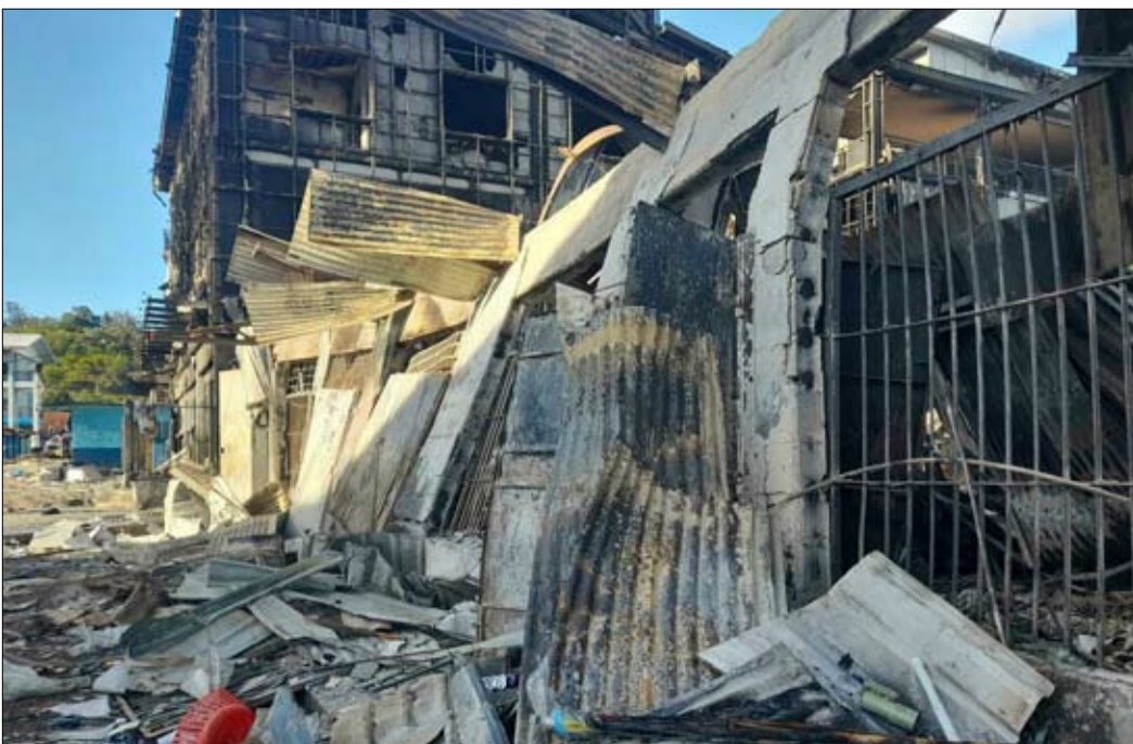
تدمير عدد من البيوت منها مقر رئيس الوزراء

لا تساعد الخصومات التقليدية بين مختلف مكونات الأرخبيل في توفير الحلول