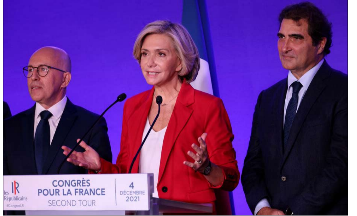
الغلبة كانت للوسط

الثاني في الجولة الأولى من الانتخابات الرئاسية. "سيتملكون العباء، يقول مقرب من مرشح مهزوم، إذا خسرت في الجولة الأولى، سيكونون المسؤولين". ويقدر داعم لفاليري بيكريس أنها قد تصل إلى 15/14 بالمائة من نوابا التصويت في يناير، أما "إذا بقيت عند 10 بالمائة، فسكون هذه مشكلة..".