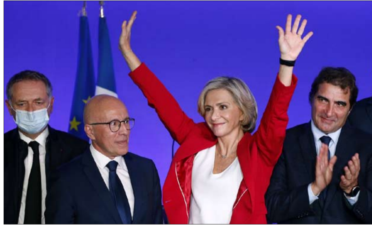
بيكريس. العودة من بعيد