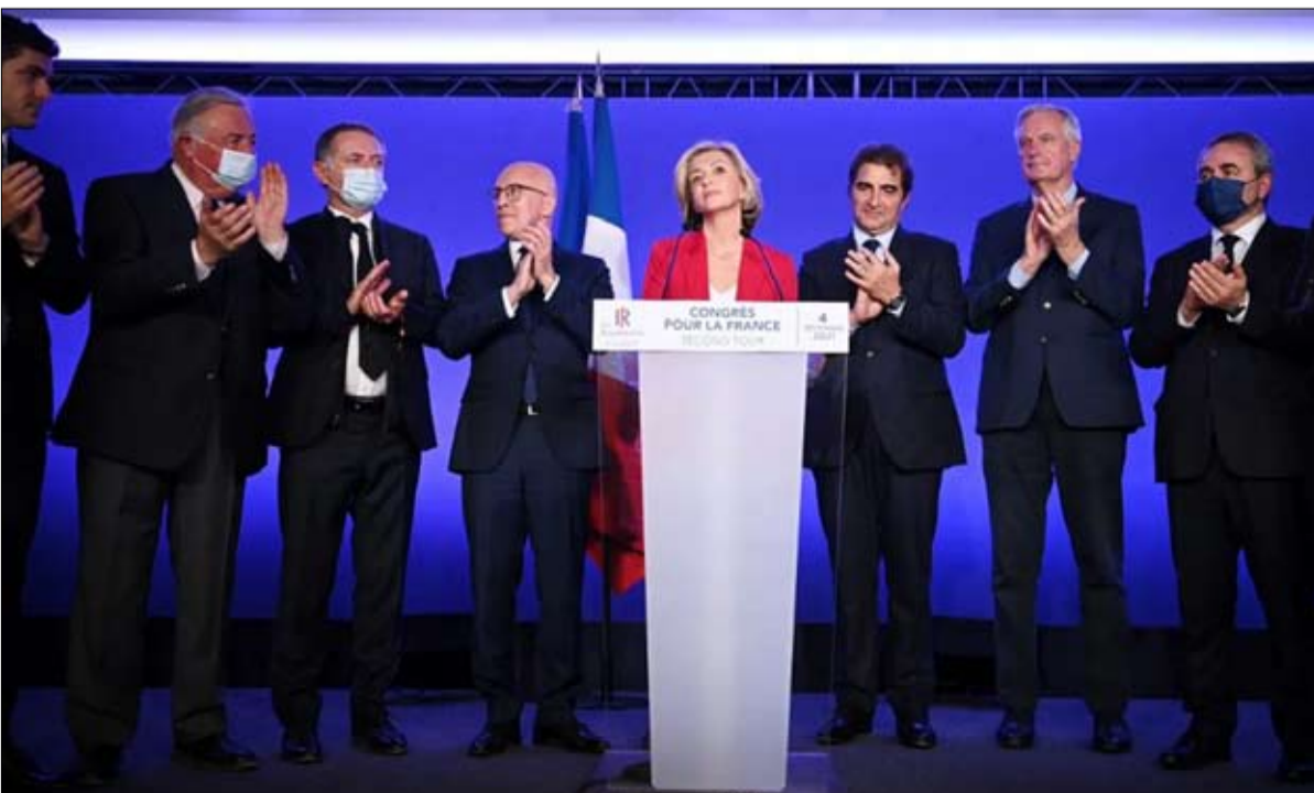
وحدة اليمين المهمة الاساسية

على المرشحة إخراج الجمهوريين من كماشة ماكرون-لوبان، وأن تعيد إلى اليمين سبب وجوده