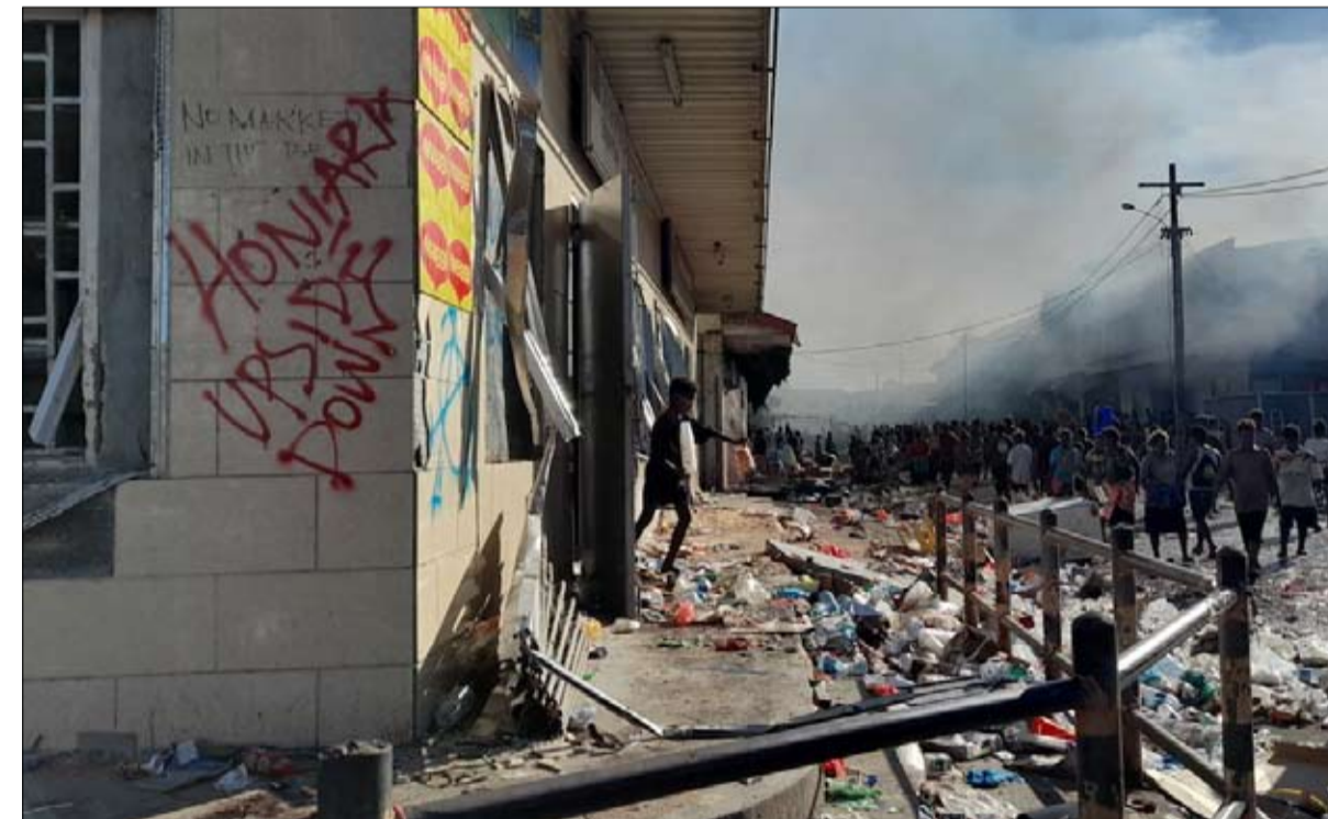
مظاهرات وتخريب في الحي الصيني

في 24 و25 نوفمبر، كان الوضع مختلفاً: تضخم المظاهرات، وتدين الشعارات مجدداً طبقة حاكمة تعتبر فاسدة، أو حتى مشاريع بنيت تحتية لم يتم تنفيذها. تجتمع الآلاف من الأشخاص أمام البرلمان للمطالبة باستقالة رئيس