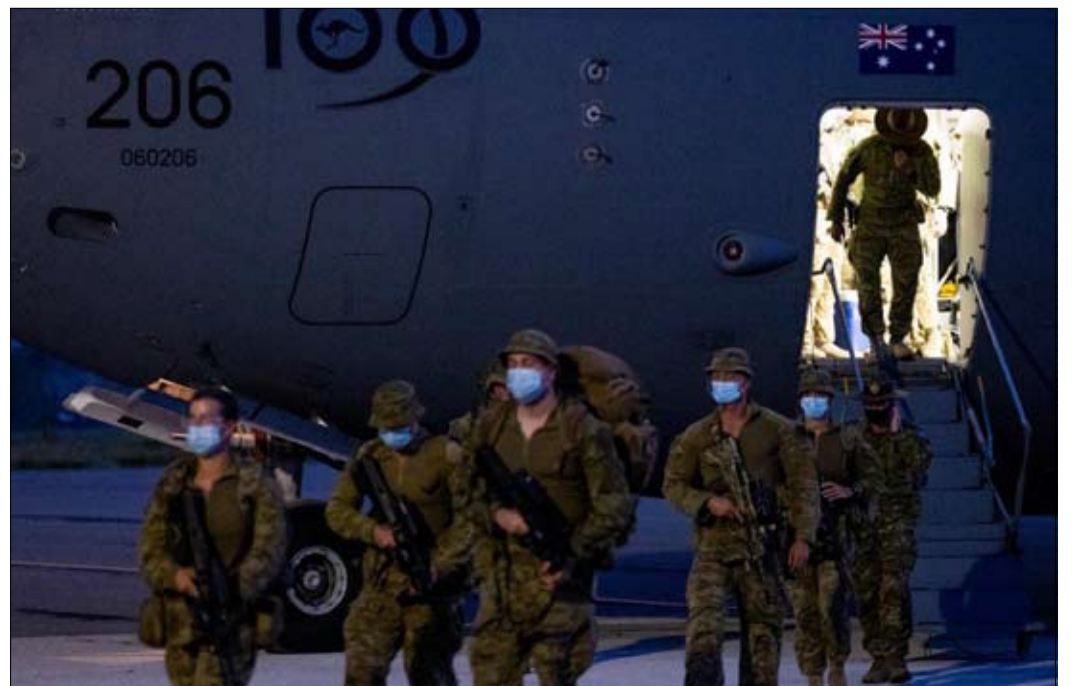
الاستراليون لإعادة الاستقرار

معارضة جزر سليمان تصف رئيس الوزراء ماناسيه سوغافاري بأنه «دمية للصين»