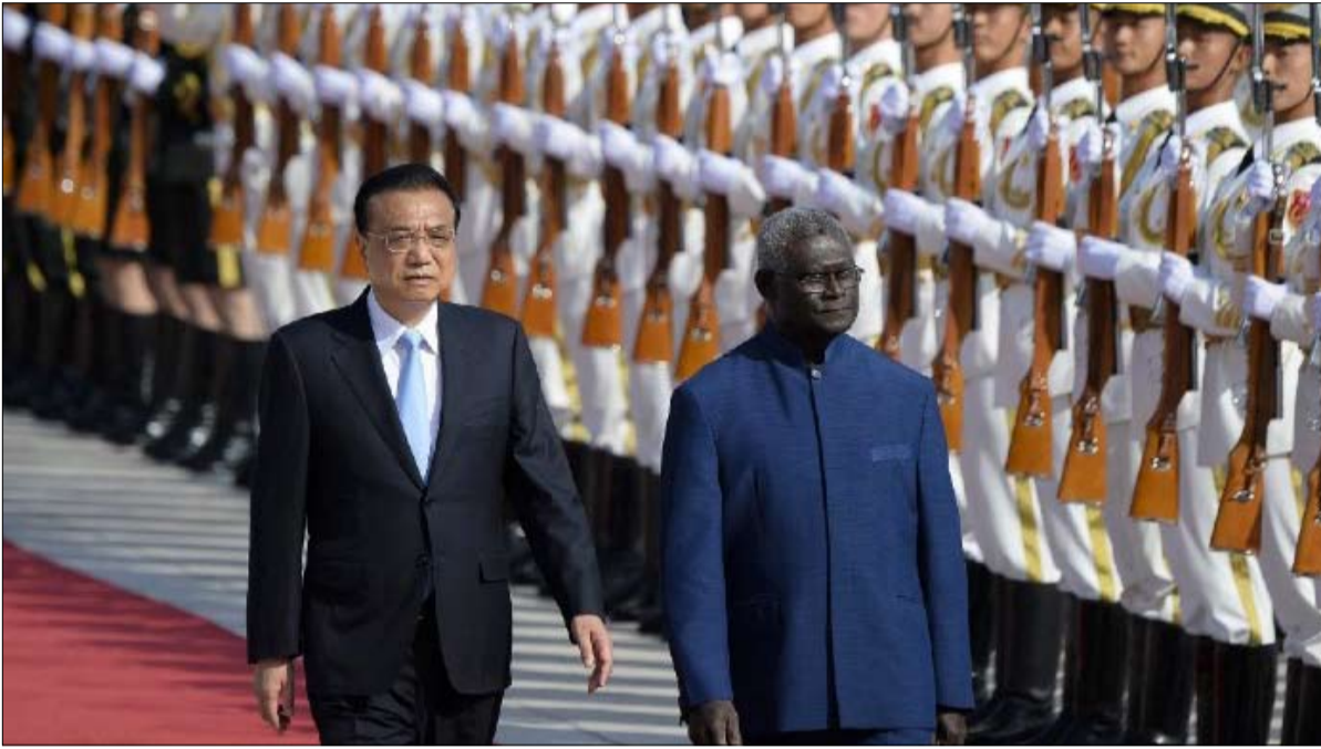
رئيس وزراء جزر سليمان ماناسيه سوغافاري في زيارة للصين