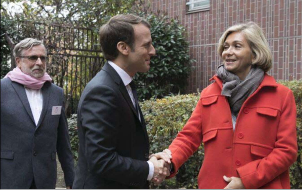
المطلوب التمايز عن ماكرون