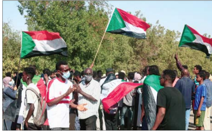
استمرار المظاهرات المطالبة بالحكم المدني

الرامية لتهدئة الشارع السوداني؛ حيث رفضت لجان المقاومة التي قادتها إلى جانب تجمع المهنيين وقوى الحرية والتغيير - المجلس المركزي - الثورة التي أطاحت بنظام عمر البشير في أبريل 2019، دعوة وجهها لها رئيس بعثة الأمم المتحدة في السودان يونيتامس فولكر بيرتس للاجتماع به ويحث حلول للارزمة، وانتقد دبلوماسيون ومرافقون ما أسموه تقاعس البعثة عن القيام بدوره بالتصوص عليه في قرار إنشائها في يونيو 2020 والتمثل في حماية الوثيقة الدستورية والمدنيين وفقاً للمهام الموكلة لها