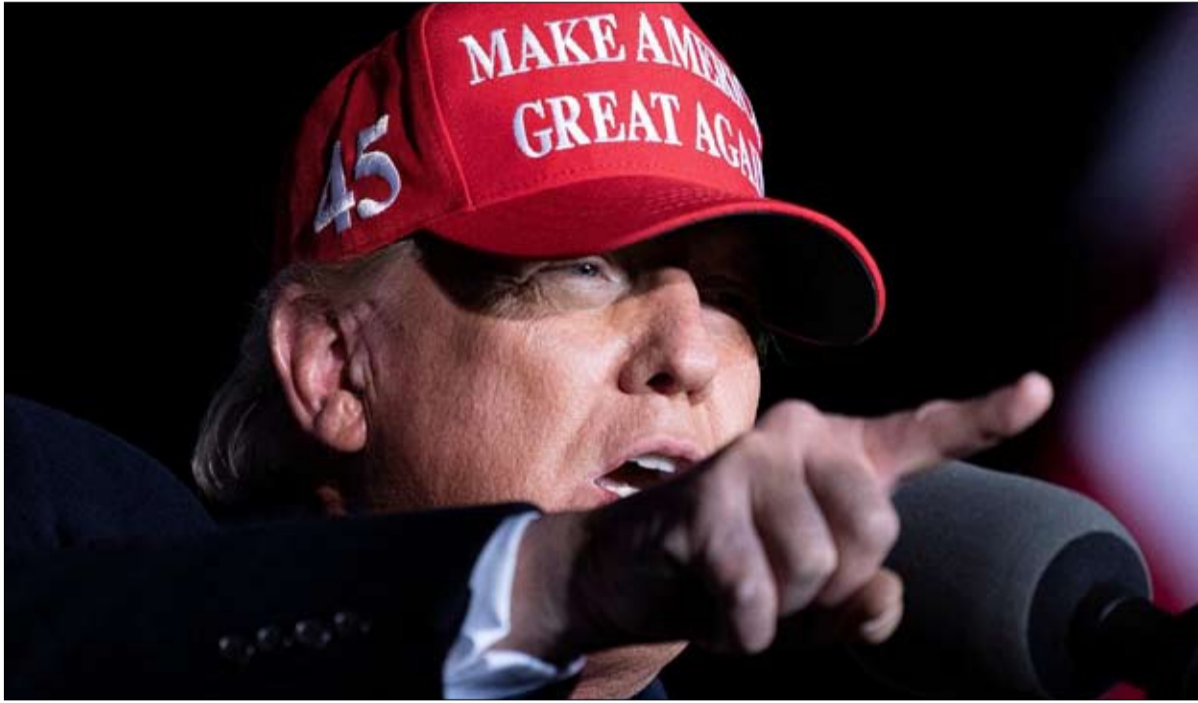
يعتبر ترامب من رموز الشعبوية

بطريقة ما، كان الهجوم على الكابيتول هيل بمثابة تأليه لرئاسة ترامب وتجسيد مثالي لعلامته التجارية: انتهاك الأعراف وتدنيس