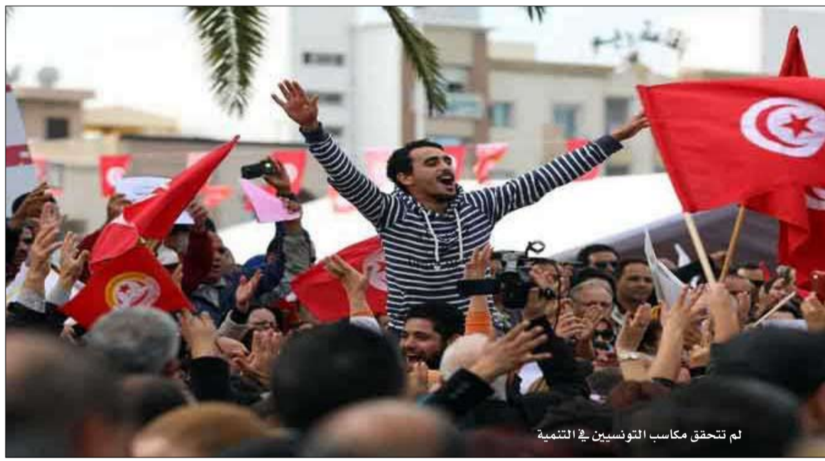
لم تتحقق مكاسب التونسيين في التنمية