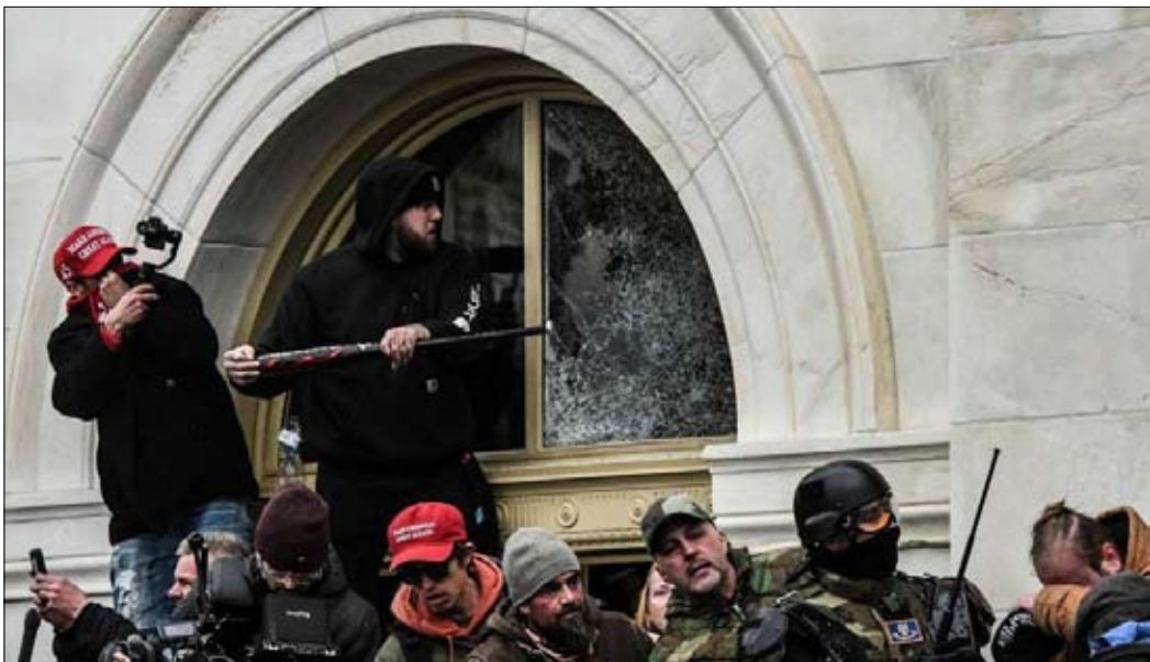
خطاب عنيف أدى الى ممارسة العنف

أستاذ مساعد في جامعة سيرجي باريس، متخصص في الولايات المتحدة