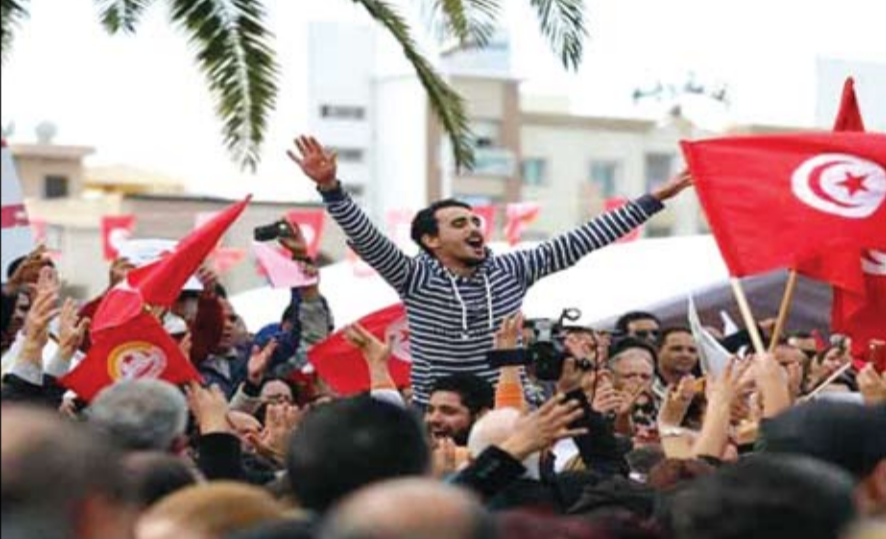
لم تتحقق مكاسب التونسيين في التنمية

•• دبي-وام: أكد صاحب السمو الشيخ محمد بن راشد آل مكتوم نائب رئيس الدولة رئيس مجلس الوزراء حاكم دبي رعاه الله، أن دولة الإمارات حققت مكانة متقدمة في مجال الأمن والأمان إقليمياً وعالمياً، بما يضمن تأكيد ريادتها وحرصها على ترسيخ أسس الأمن وضمان