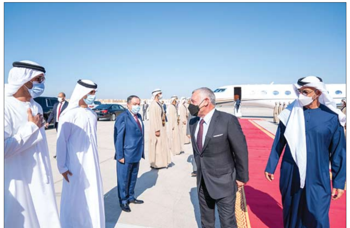
بحثاً تعزيز الأمن والاستقرار في المنطقة والعمل من أجل السلام وإيجاد تسوية عادلة للقضية الفلسطينية