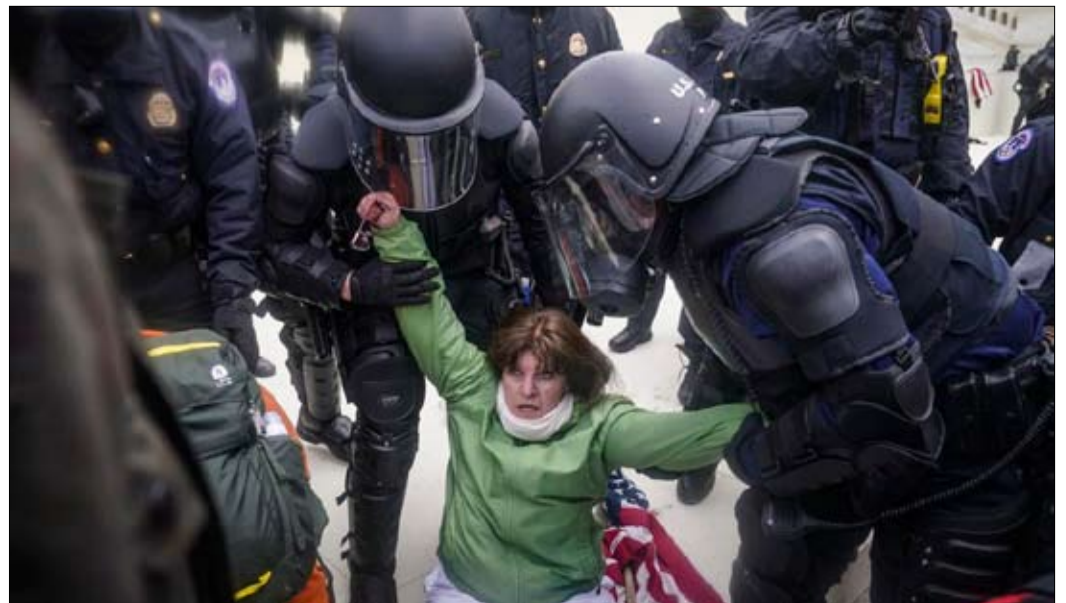
بطلة في قاموس ترامب

شعب ترامب، هو شعب ضحية وسائل الإعلام والأخبار المزيفة ونظام غير عادل