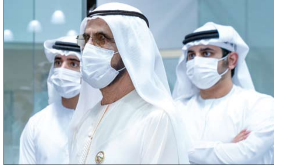
محمد بن راشد خلال زيارته مقر أمن الدولة في دبي

•• أبوظبي-وام: بحث صاحب السمو الشيخ محمد بن زايد آل نهيان ولي عهد أبوظبي نائب القائد الأعلى للقوات المسلحة وصاحب الجلالة الملك عبدالله الثاني بن الحسين عاهل المملكة الأردنية الهاشمية الشقيقة - خلال اللقاء الذي عقد أمس بينهما في قصر الشاطئ في