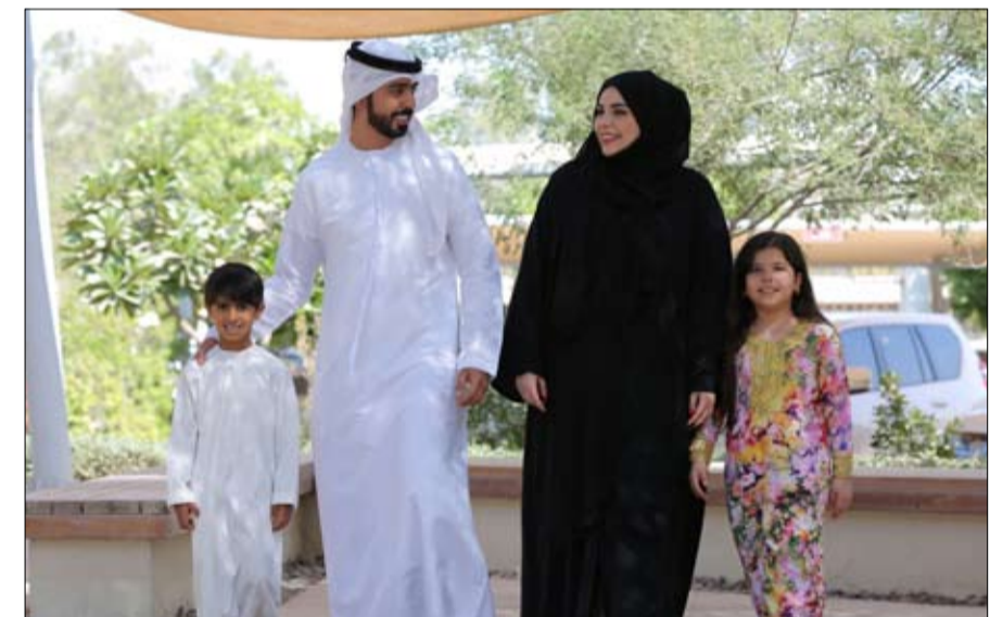
أبوظبي، بتعزيز المبادرات الداعمة للحفاظ على استقرار المجتمع الإماراتي انطلاقاً من تماسك الأسرة التي تعتبر لبنة الأولى من لبنات بناء المجتمع. وأشار إلى أن البرنامج استحدث

أليات مبتكرة لتمكين الأسر من حل الخلافات عبر جلسات توجيهية مكثفة للأطراف مع موجهين مختصين اجتماعياً ونفسياً وقانونياً، فضلاً عن تنظيم ورش تدريبية غنية بالوسائل المتعددة والتمارين التفاعلية لاكتساب مهارات تحد من الخلافات الزوجية، إلى جانب خطة متابعة لضمان الالتزام باتفاقيات الصلح، ومحاولة علاج أي عقبات تطرأ أثناء أي عقبات تطرأ أثناء مناقشة المراجعة الزوجية إن أمكن، وفي حال وجود أبناء تتم متابعة العلاقة الوالدية ومدى التزام الوالدين بحسن تربيتهم لضمان تنشئة أجيال قادرة على العطاء وبناء مجتمع متلاحم، مع العمل على قياس جدوى البرنامج وتأثيره في تحقيق تماسك الأسرة واستدامتها.