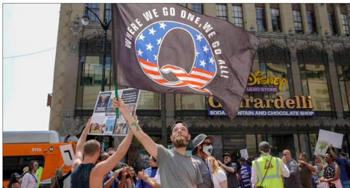
فكر كيو اناون حاضر في خطاب ترامب