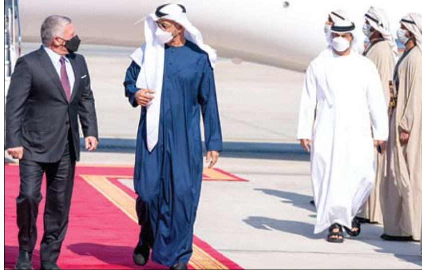
محمد بن زايد خلال استقباله الملك عبد الله الثاني

للحد من انتشار فيروس كوفيد-19 لجنة الطوارئ والأزمات تعددت إجراءات دخول إمارة أبوظبي من داخل الدولة اعتباراً من اليوم •• أبوظبي-وام: أعلنت لجنة إدارة الطوارئ والأزمات والكوارث الناجمة عن جائحة كورونا في إمارة أبوظبي أمس، تحديث إجراءات دخول إمارة أبوظبي تعزيزاً للجهود الاستباقية لاحتواء العدوى والحد من انتشار فيروس كوفيد-19، وسيبدأ تطبيق هذه الإجراءات اعتباراً من يوم الأحد 17 يناير 2021. واعتمدت اللجنة السماح بدخول الإمارة من داخل الدولة خلال 48 ساعة من تلقي نتيجة سلبية لفحص مسحة الأنف PCR أو فحص اليليزر DPI بدلاً من 72 ساعة، كما اعتمدت إجراء فحص PCR في اليوم الرابع من دخول الإمارة لمن تتجاوز مدة إقامته 4 أيام متتالية، وإجراء فحص PCR في اليوم الثامن لمن تتجاوز مدة إقامته 8 أيام متتالية، وذلك بدلاً من إجراء فحص اليوم السادس المطبق حالياً. وتطبق هذه الإجراءات على كافة سكان الدولة، ويستثنى منها المتعمرون في برامج التطعيم الوطنية والمتطوعون في الدراسات السريرية لللقاح الذين تظهر حالتهم الخاصة بحرف E أو النجمة الذهبية، على تطبيق الحصن. وجددت اللجنة دعوتها لأفراد المجتمع لمواصلة تعاونهم والتزامهم باتباع الإجراءات الوقائية والاحترازية، وأن عدم الالتزام بالإجراءات المحددة قد يعرض المخالفين إلى الغرامة والمساءلة القانونية.