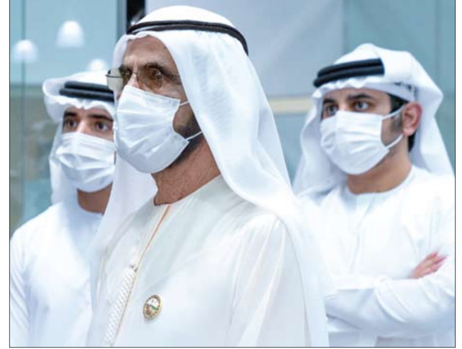
زار مقر أمن الدولة في دبي وأثنى على جهود قياداته ومنتسبيه