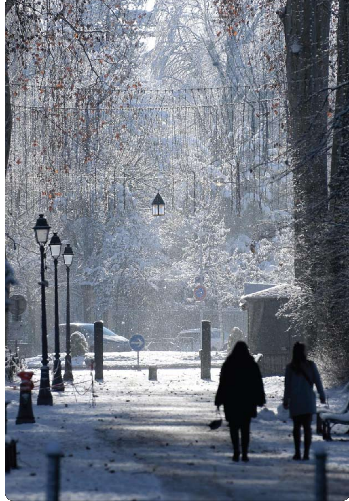
امراتان تسيران على الجليد في حديقة أورانجيري في ستراسبورغ بشرق فرنسا.

أعلنت النرويج، تعديل المحاذير الخاصة بتلقي اللقاحات المضادة لفيروس كورونا المستجد، لا سيما فيما يتعلق بكبار السن. وكشفت أوسلو أن لقاحات "كوفيد 19" قد لا تكون آمنة بالنسبة لكبار السن، وأولئك الذين يعانون أمراضاً معينة، مع تقييم الآثار الجانبية للقاحات. وفي وقت سابق، قال مسؤولون نرويجيون أن 23 شخصاً توفوا في البلاد، بعد وقت قصير من تلقي جرعتهم الأولى من اللقاح، وكان معظمهم فوق الثمانين عاماً. ومن بين هذه الوفيات تم حتى الآن تشريح 13 جثة، وأشارت النتائج إلى أن الآثار الجانبية الشائعة ربما تكون قد ساهمت في ردود فعل شديدة لدى كبار السن، وفقاً لوكالة الأدوية النرويجية. ووفقاً لإحصاءات رسمية، تلقى أكثر من 30 ألف شخص الجرعة الأولى من لقاح "فايزر بيونتك" أو "موديرنا" في النرويج، منذ نهاية ديسمبر الماضي. وقال العهد النرويجي لصحة العامة: "بالنسبة لأولئك الذين يعانون من الضعف الشديد، حتى الآثار الجانبية الخفيفة نسبياً للقاح يمكن أن يكون لها عواقب وخيمة. (بالنسبة لهم) قد تكون الفائدة للقاح هامشية أو غير ذات صلة".