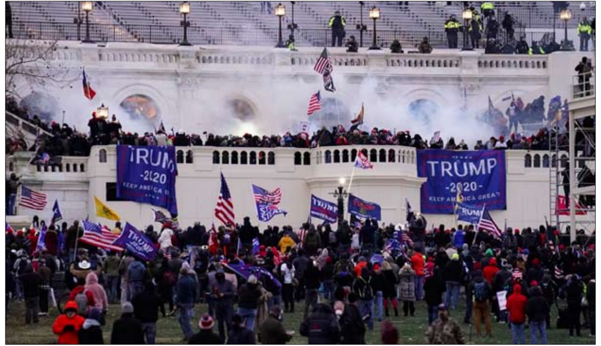
حقن الجماهير بشحنة عاطفية اضافية