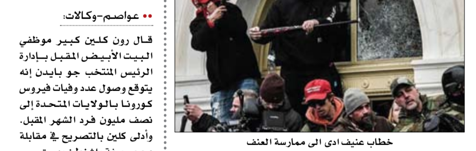
خطاب شنيف أدى الى ممارسة العنف

•• عواصم-وكالات: قال رون كلين كبير موظفي البيت الأبيض المقبل بإدارة الرئيس المنتخب جو بايدن إنه يتوقع وصول عدد وفيات فيروس كورونا بالولايات المتحدة إلى نصف مليون فرد الشهر المقبل. وأدى كلين بالتصريح في مقابلة مع صحيفة واشنطن بوست. وأضاف كلين أنه واثق في قدرة هيئات إنفاذ القانون على ضمان مراسم تنصيب آمنة لبايدن يوم الأربعاء. هذا ويهدد تأخر تسليم الجرعات في إبطاء هذه المهمة في أوروبا أكثر مناطق العالم تضروا من الجائحة. ودعت منظمة الصحة العالمية إلى بدء التلقيح في كل الدول في الأيام اللمة المقبلة لمواجهة الوباء الذي أسفر عن أكثر من مليوني وفاة في العالم. وقال المدير العام لمنظمة الصحة العالمية تيدروس أدهانوم غيبريسوس خلال مؤتمر صحافي في جنيف أريد أن أرى حملات التلقيح وقد بدأت في كل دولة في غضون الأيام المئة المقبلة،